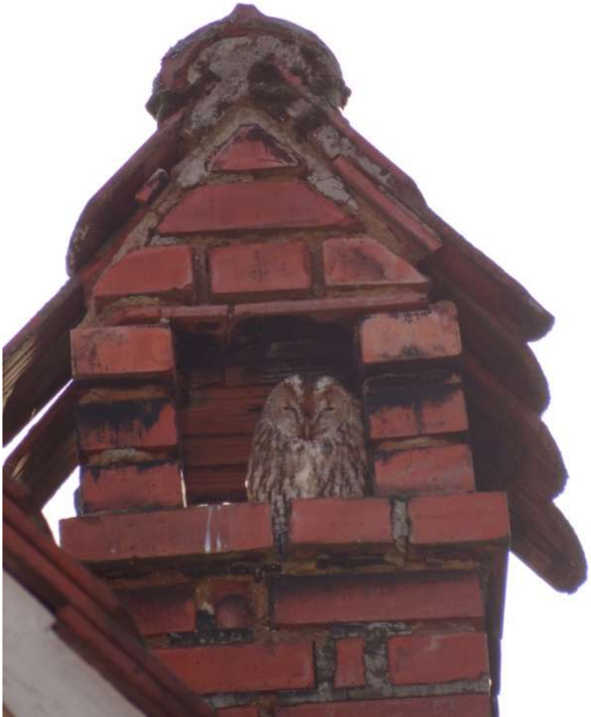
Strix aluco - Chouette hulotte (14.01.2012)