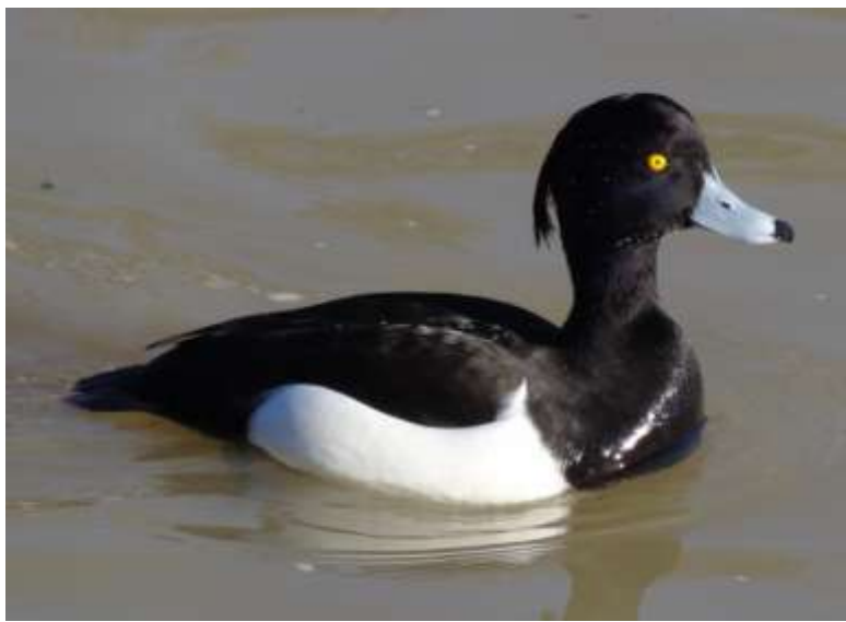
Aythya fuligula - Fuligule morillon mâle