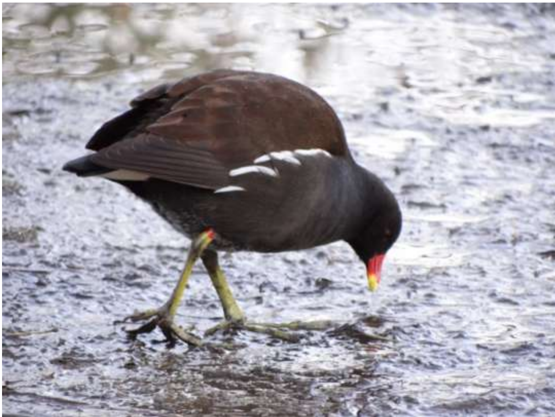
Gallinula chloropus - Gallinule poule-d'eau adulte – Rallidae – (Lieu : INGERSHIEM - 15.12.2011)