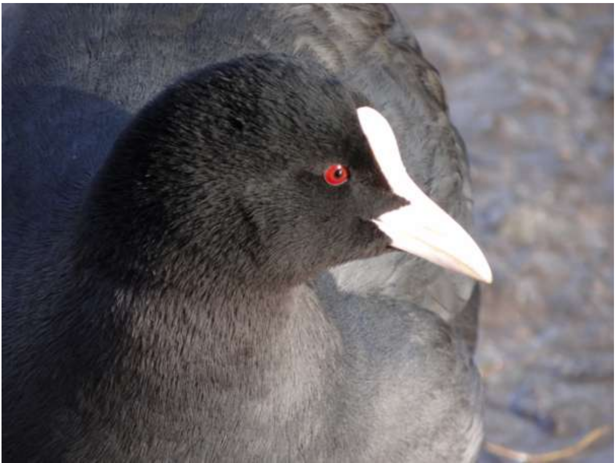
Fulica atra - Foulque macroule (Lieu : INGERSHEIM - 15.12.2011)