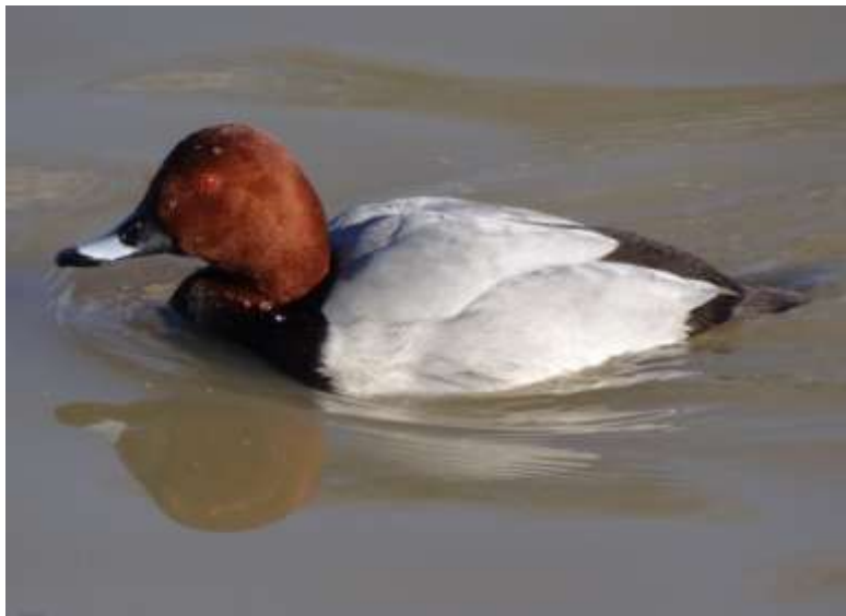
Aythya ferina - Fuligule milouin mâle – (Lieu : L'ILL à MULHOUSE - 12.12.2011)