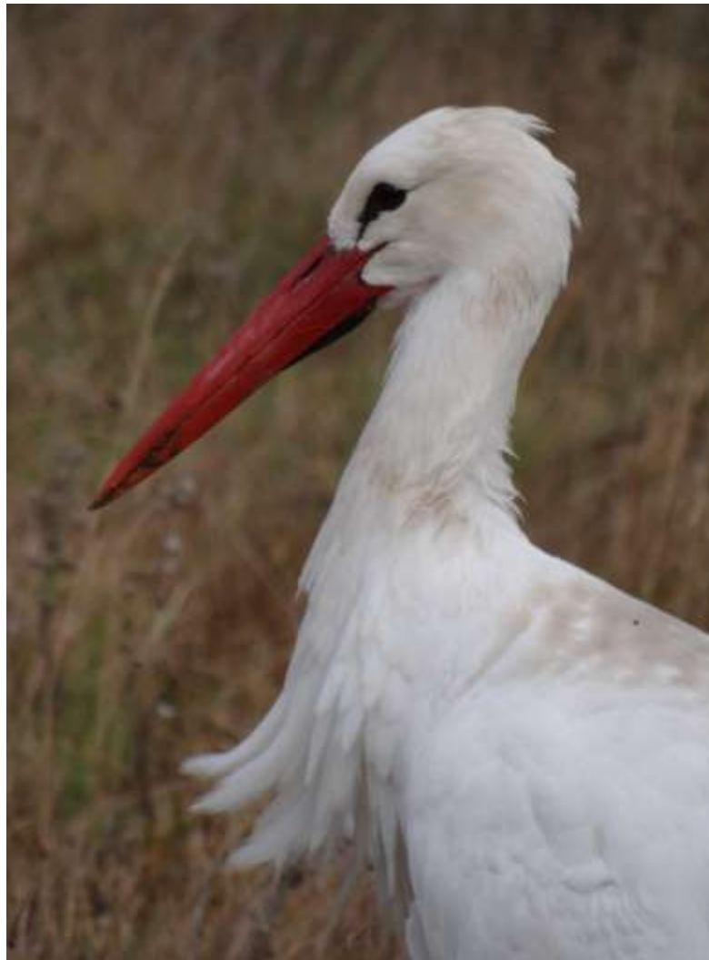
Cigognes (Lieu : INGERSHEIM -68- 15.12.2011)