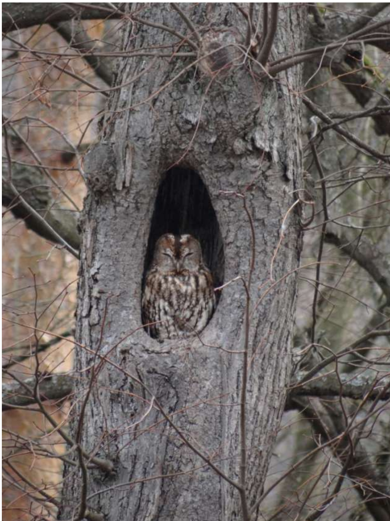
Strix aluco - Chouette hulotte – (Lieu : Vallée de THANN - 18.03.2012)