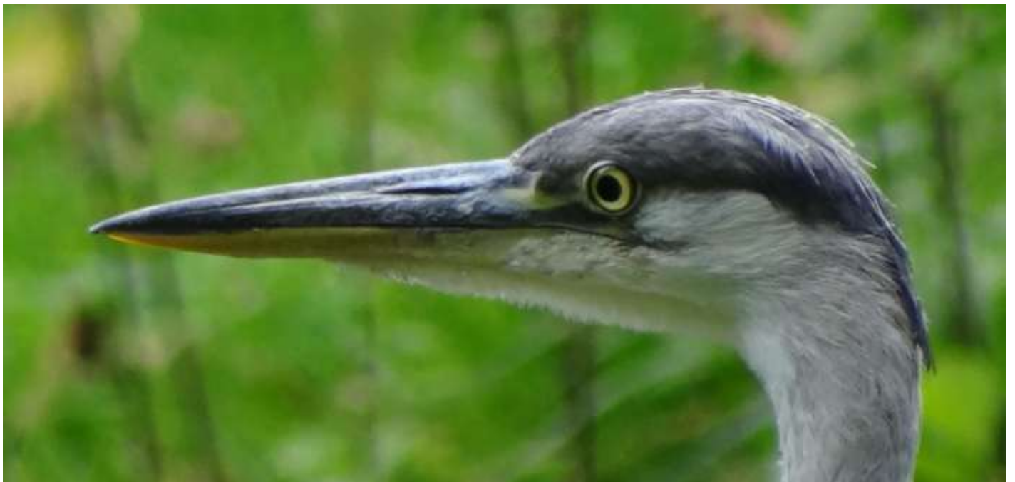
Ardea cinerea - Héron cendré immature (aux environs d'ALTKIRCH)