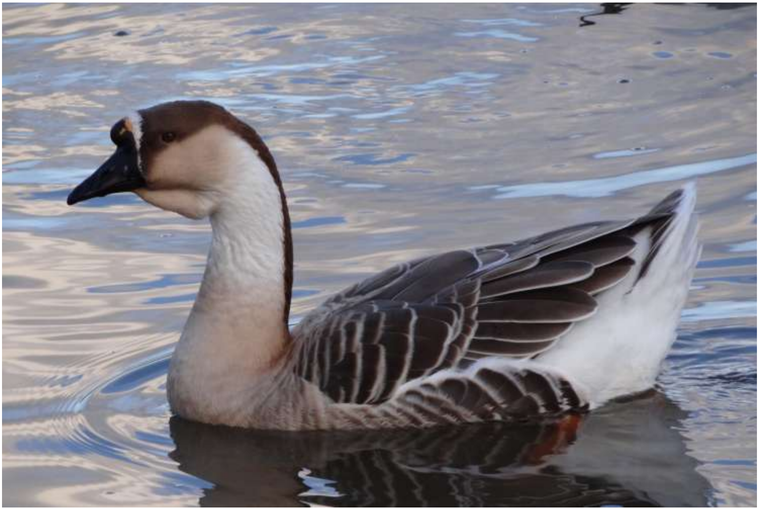
Oie cygnoïde domestique ou Oie d'Orient ou Oie de Guinée – Oie caronculée de chine – (Lieu : L'ILL à MULHOUSE 12.12.2011)