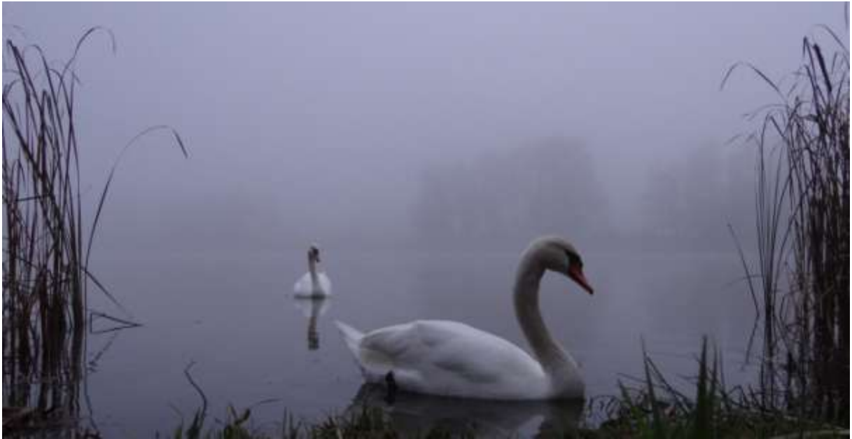
Cygnés (Lieu : Barrage de MICHELBAACH - 14.11.2012)