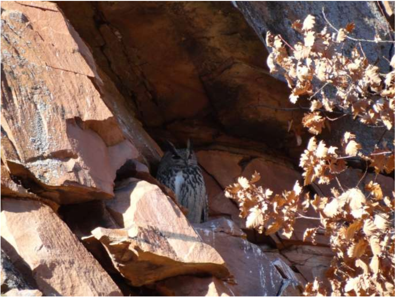
Hibou Grand duc - (Alsace) - 16.01.2012