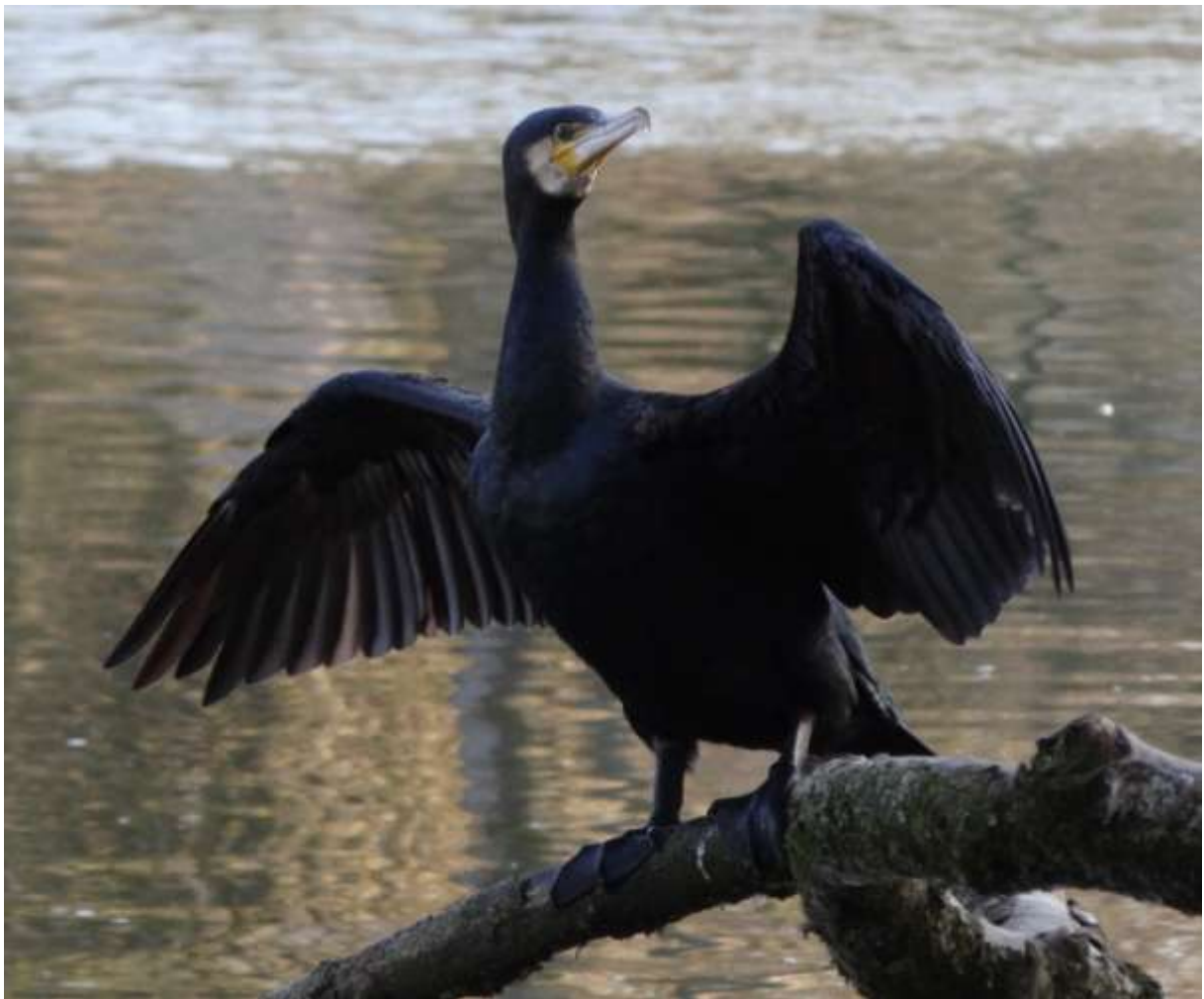
Phalacrocorax carbo - Grand Cormoran – (Lieu : L'ILL à MULHOUSE - 15.01.2012)