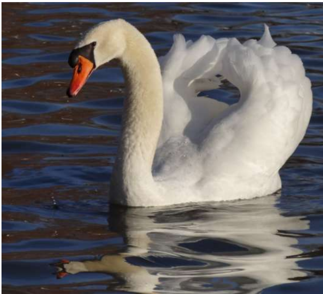
Cygnus olor - Cygne domestique ou Cygne muet - mâle – (Lieu : l'ILL à MULHOUSE - 28.12.2011)