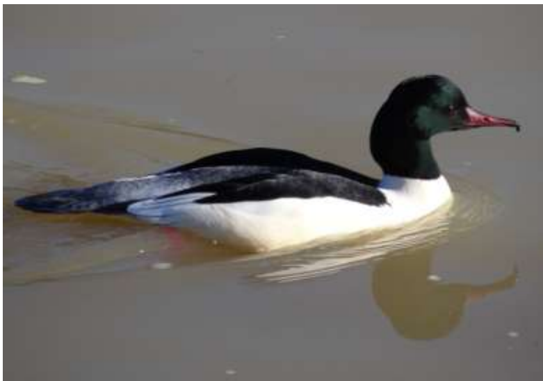
Mergus merganser - Harle bièvre mâle