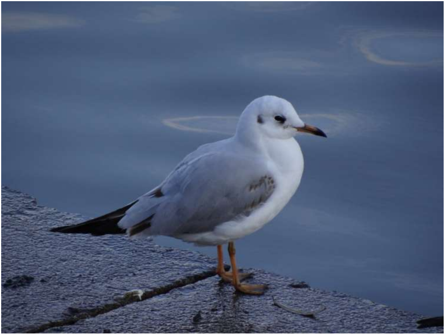
Larus ridibundus - Mouette rieuse (Lieu : L'ILL à MULHOUSE - 12.12.2011)