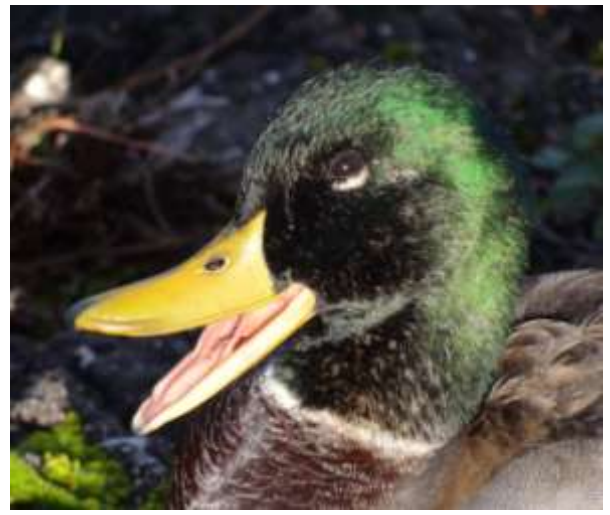
A gauche : Anas platyrhynchos - Canard colvert – Anatidae - (Lieu : L'ILL à MULHOUSE - 12.12.2011)