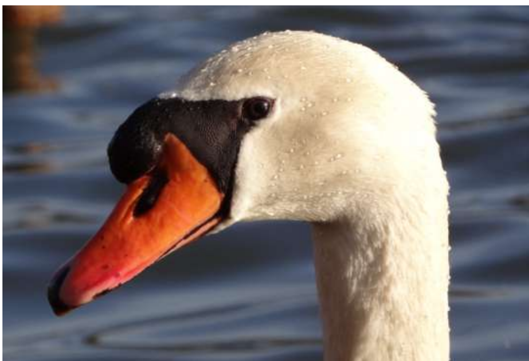
Cygnus olor - Cygne domestique ou Cygne muet - mâle – (Lieu : l'ILL à MULHOUSE - 28.12.2011)