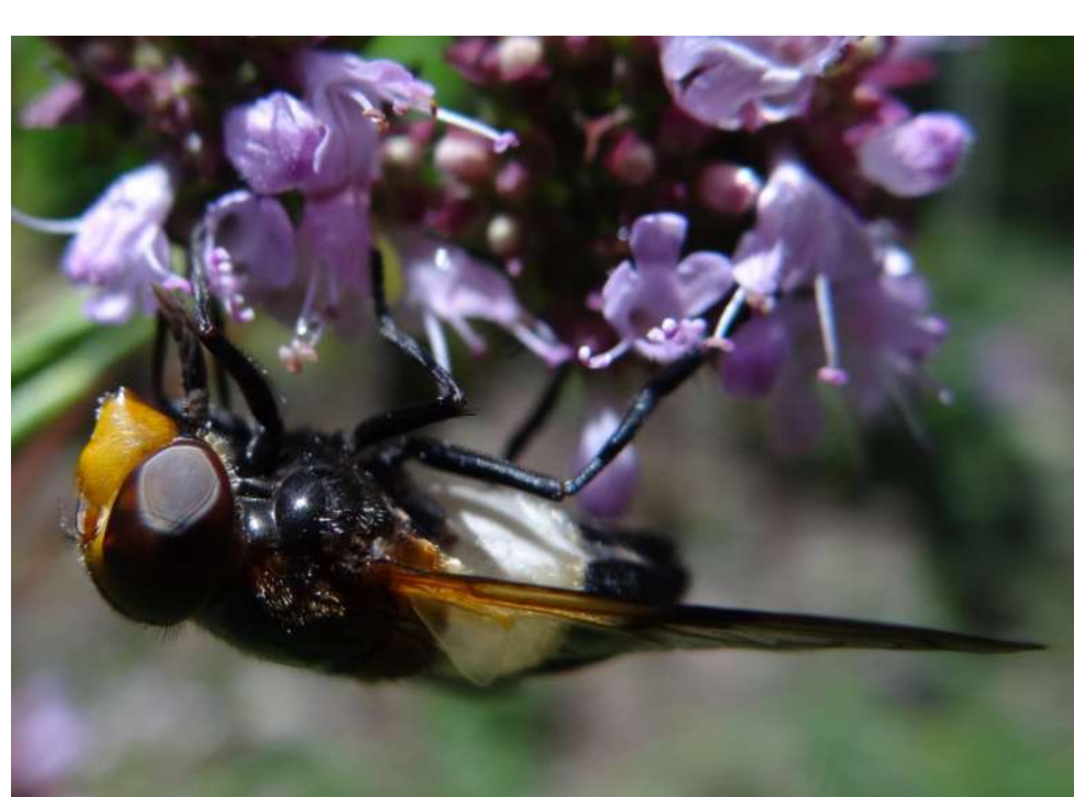
Volucella pellucens – Syrphidae (Lieu : secteurs lac de SEWEN et lac d'ALFELD – 17.08.2015)