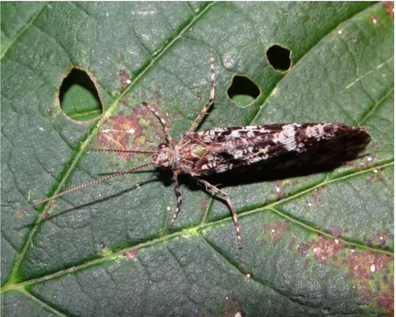
Agrypnia varia - Trichoptera – Phryganeidae (Lieu : « ROTHMOOS » - Nuit du 31.08.2016 au 01.09.2016)