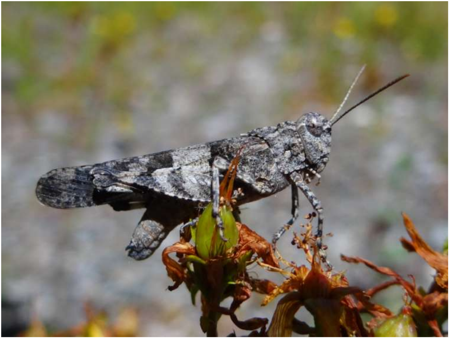
Oedipoda caerulescens - Oedipode turquoise – Criquet à ailes bleues et noires – Criquet bleu – Criquet rubané – Oedipode bleuâtre – Acrididae – (Lieu : Réserve naturelle régionale des marais et landes du ROTHMOOS « WITTELSHEIM -68- ») 18.07.2016