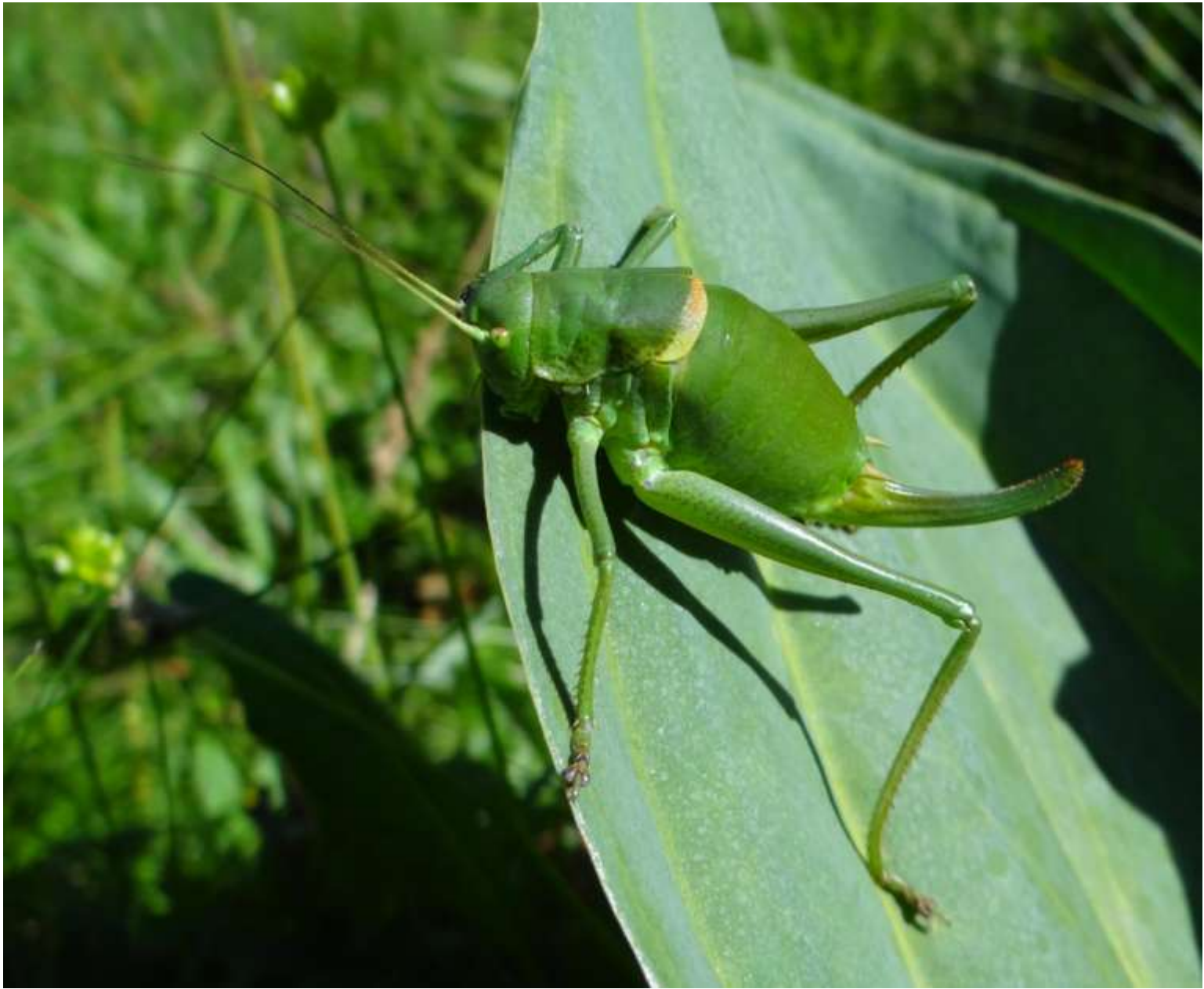
(Lieux : aux alentours du Rothenbachkopf « sur les hauteurs de MITTLACH » - 09.07.2016)