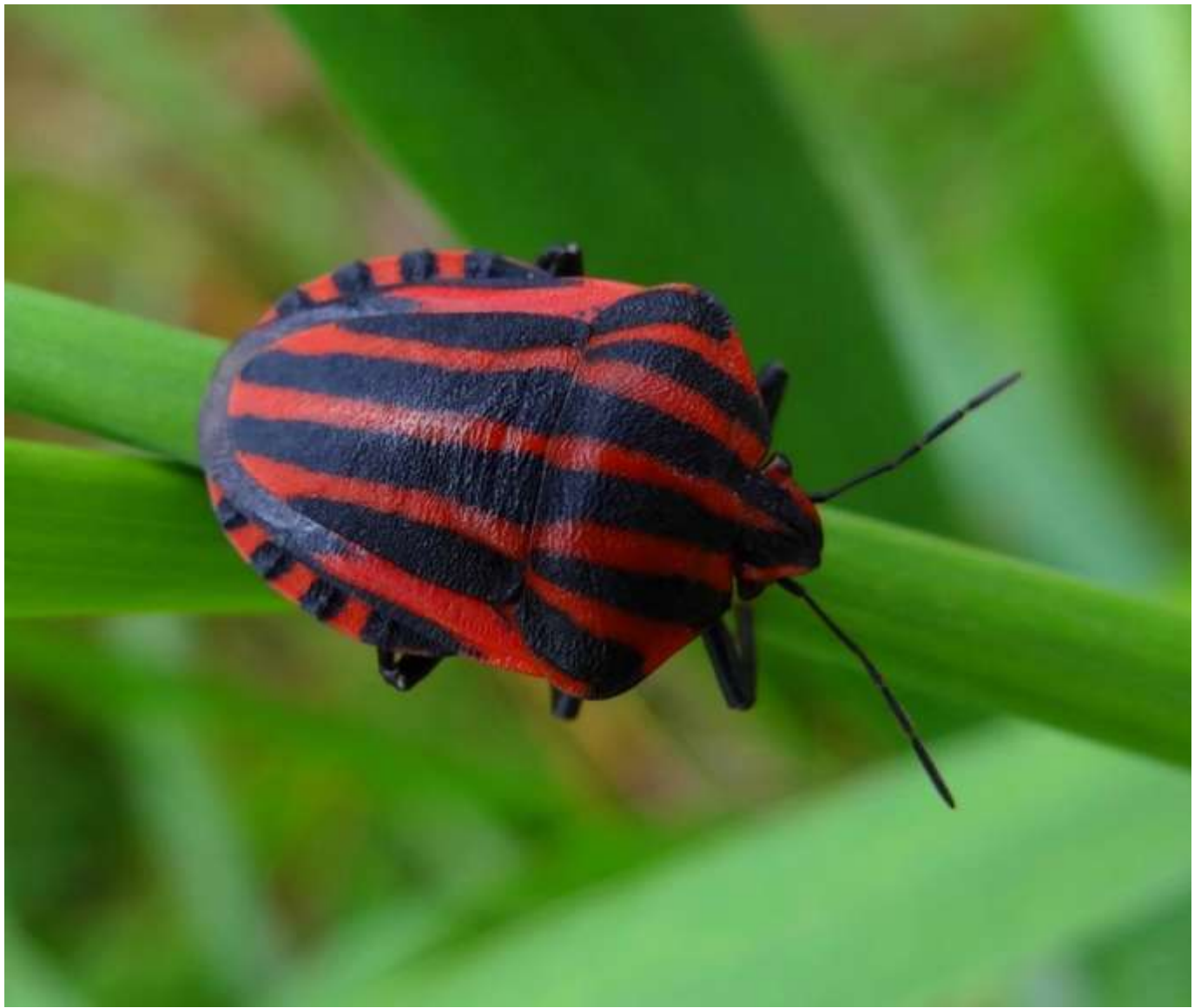
Graphosoma italicum - Punaise arlequin - Hemiptera – Pentatomidae – (Lieu : HEIDWILLER – 25.06.2016)