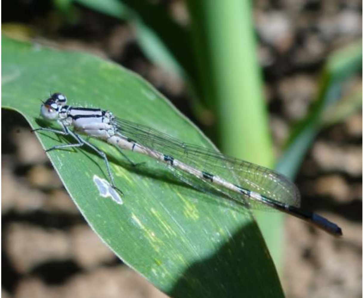
Enallagma cyathigerum – L'Agrion porte-coupe – Coenagrionidae – (Lieu : DESSENHEIM 68 – 24.06.2015)