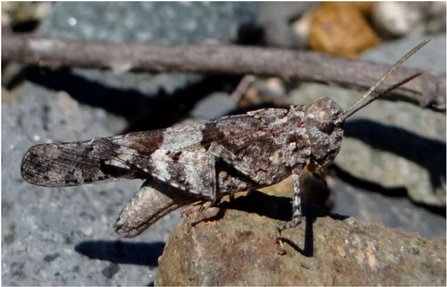
Oedipoda caerulescens - Oedipode turquoise – Criquet à ailes bleues et noires – Criquet bleu – Criquet rubané – Oedipode bleuâtre – Acrididae – (Lieu : Réserve naturelle régionale des marais et landes du ROTHMOOS « WITTELSHEIM -68- ») 18.07.2016