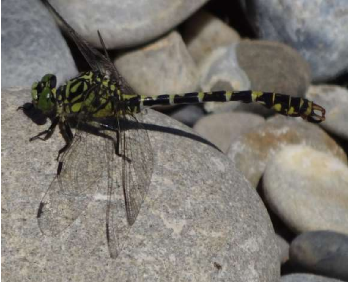
Onychogomphus forcipatus - mâle – Onychogomphe à pinces – Gomphe à pinces – Gomphidae – (Lieu : DESSENHEIM 68 « à proximité d'une gravière » – 24.06.2015)