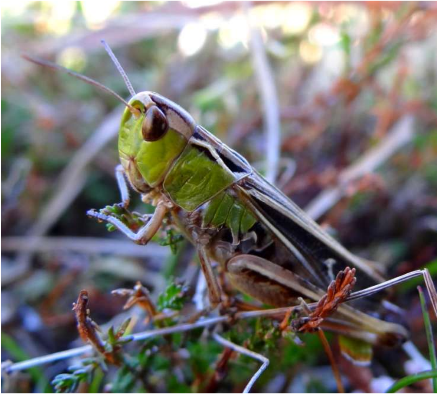
Stenobothrus lineatus – Criquet de la Palène - Le Sténobothre ligné – Criquet du brachypode – Orthoptera – Acrididae (Lieu : GERSTACKER sur les hauteurs de ALTENBACH – 29.09.2016)