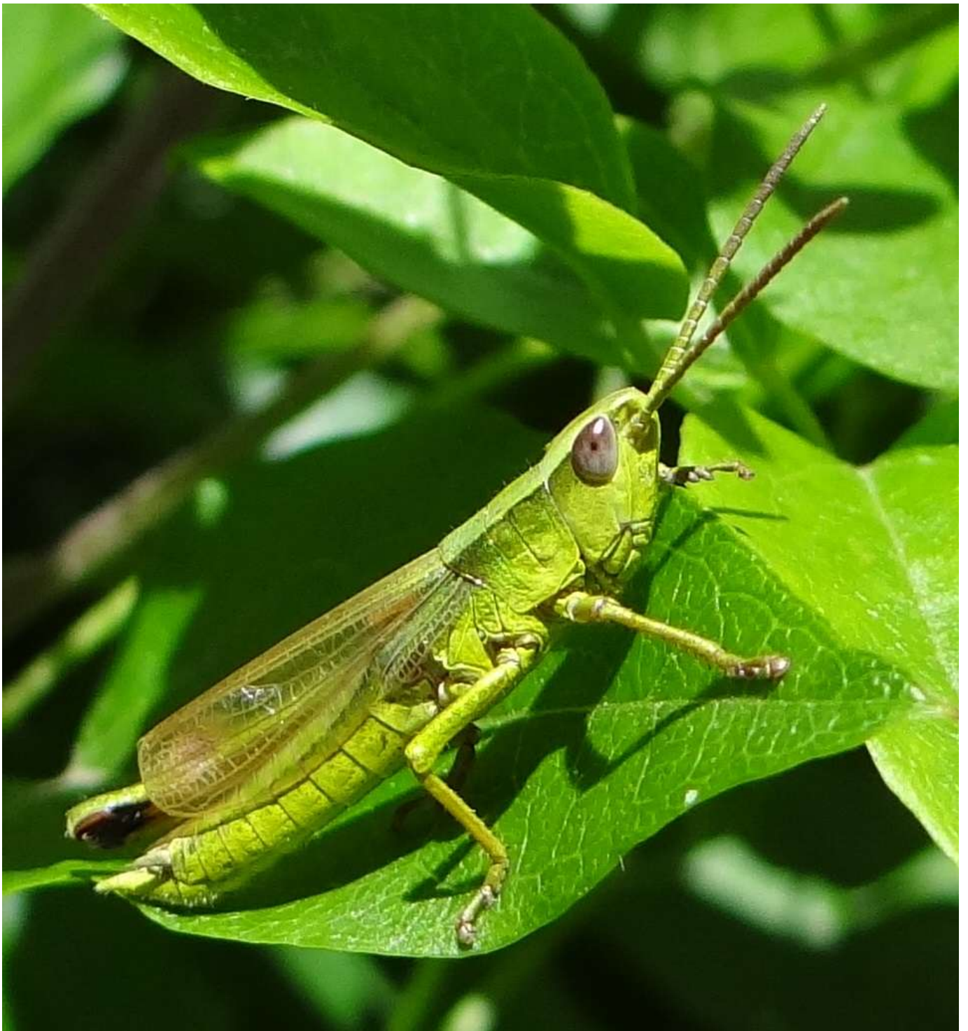
Chrysochraon dispar – mâle – Criquet des clairières – Orthoptera – Acrididae - (Lieu : DESSENHEIM -68- 24.06.2015)