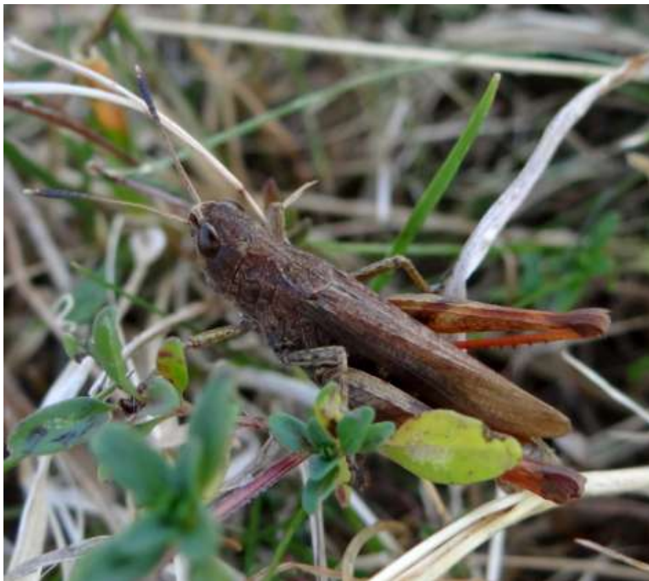
Gomphocerippus rufus – Gomphocère roux – Gomphocère fauve – Orthoptera – Acrididae – (Lieu : GERSTACKER sur les hauteurs d'ALTENBACH – 13.09.2016)