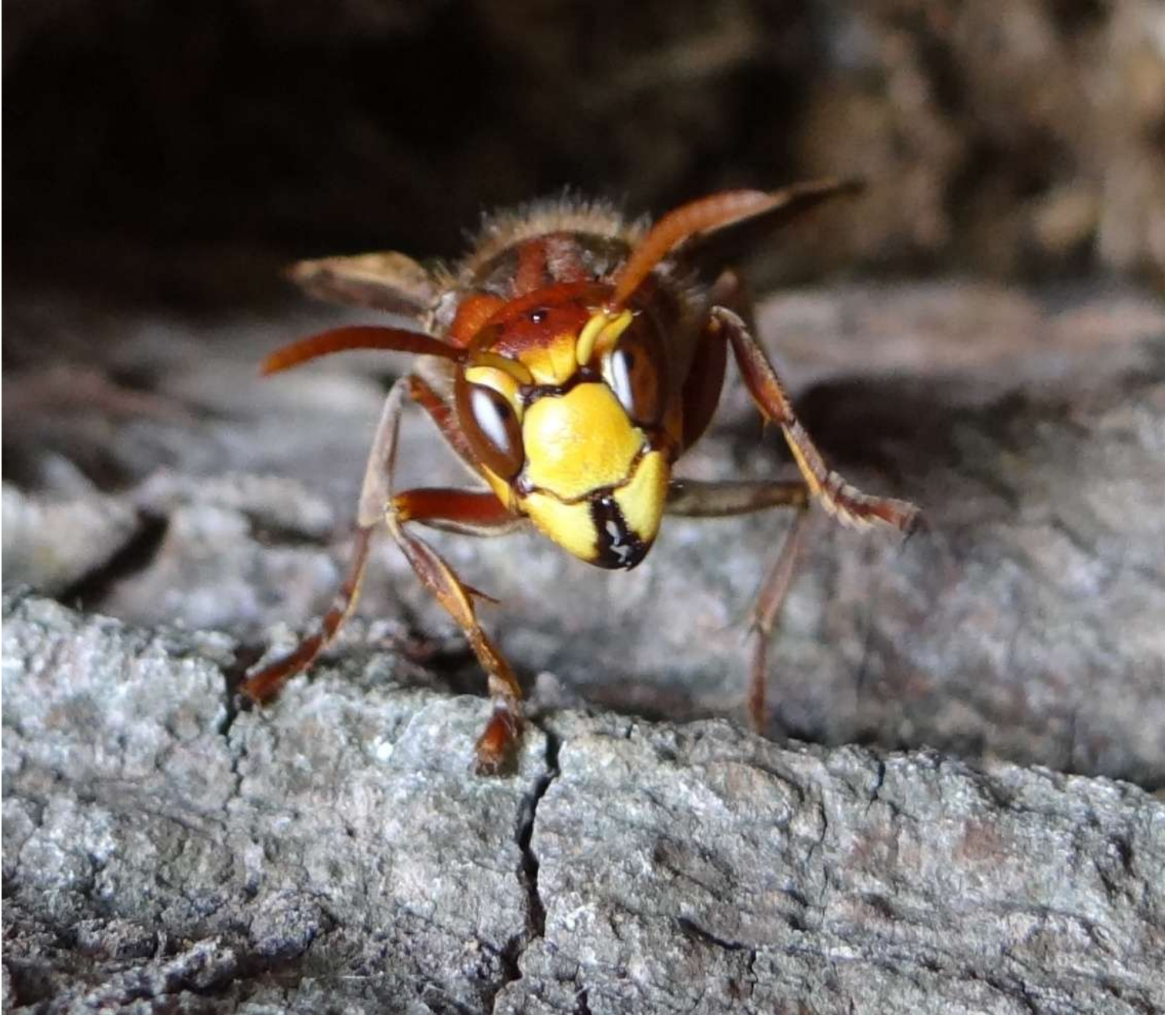
Vespa crabro – Frelon – Vespidae - (Lieu : MULHOUSE - 06.10.2012)