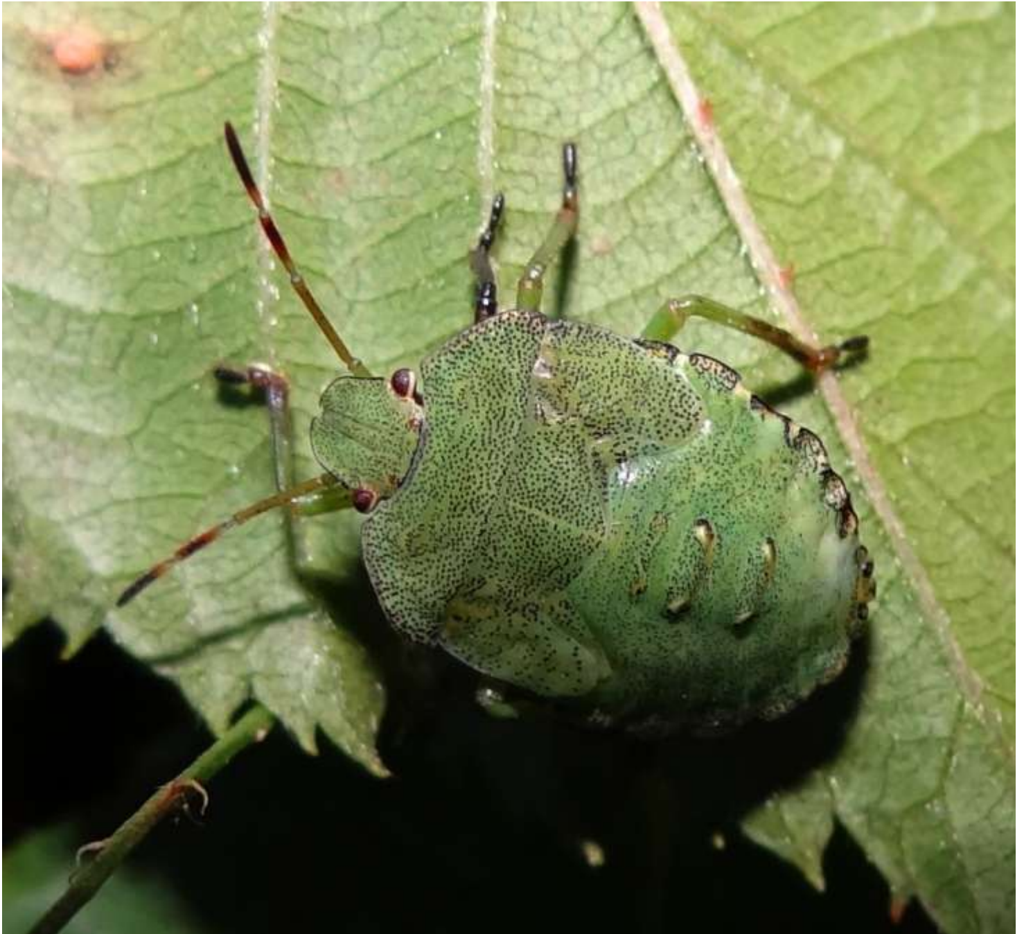
Palomena prasina - larve stade V – La Punaise verte – Hemiptera - Pentatomidae – (Lieu : « ROTHMOOS » - WITTELSHEIM – nuit du 31.08.2016 au 01.09.2016)