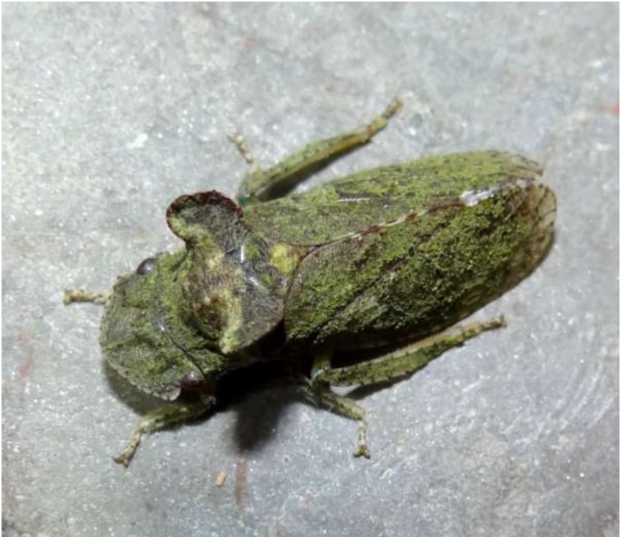
Leda aurita – Le Grand diable – Hemiptera – Cicadellidae (Lieu : aux alentours de CERNAY – Nuit du 10 au 11.09.2016)