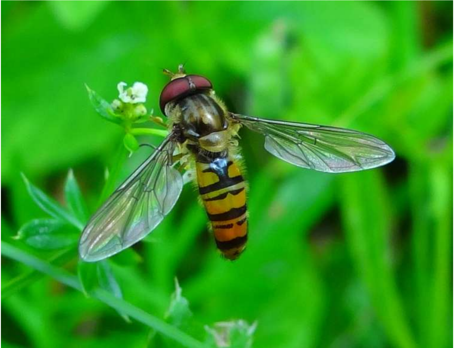
Episyrphus balteatus - Le Syrphe ceinturé - Syrphe à ceinture(s) - Diptera - Syrphidae (Lieu : HEIDWILLER – 25.06.2016)