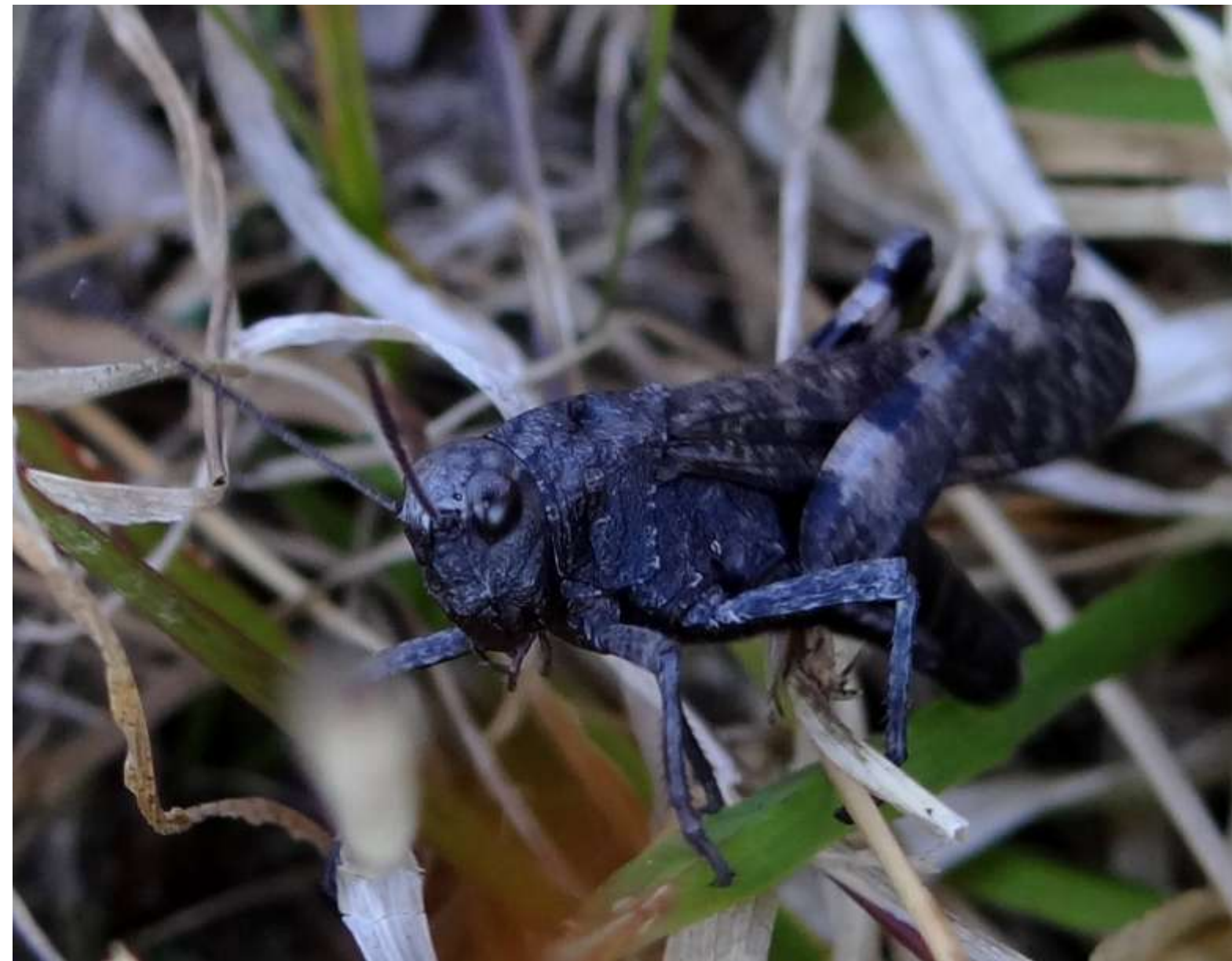
Psophus stridulus – L'Oedipode stridulante - Orthoptera – Acrididae - (Lieu : GERSTACKER sur les hauteurs d'ALTENBACH – 29.09.2016)