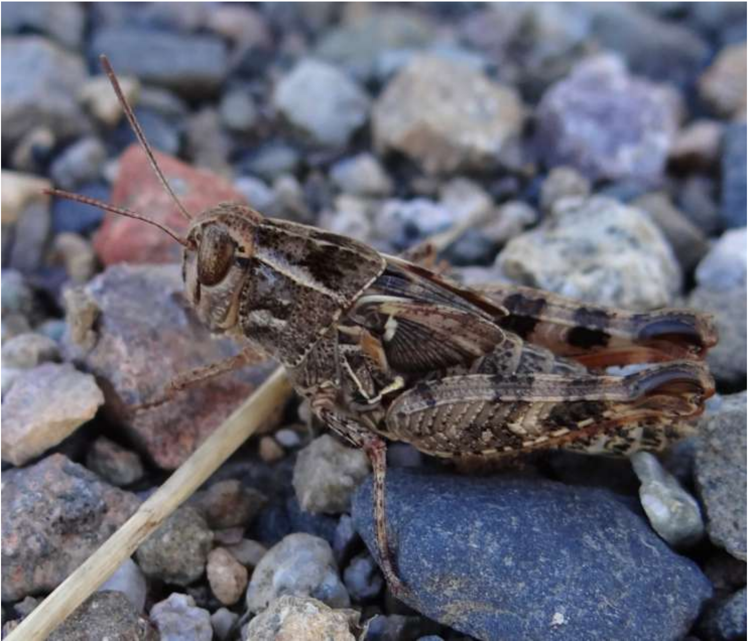
Calliptamus italicus - Criquet italien jeune – Caloptène italien - Acrididae (Lieu : Réserve naturelle régionale des marais et landes du ROTHMOOS « WITTELSHEIM -68- » 18.07.2016