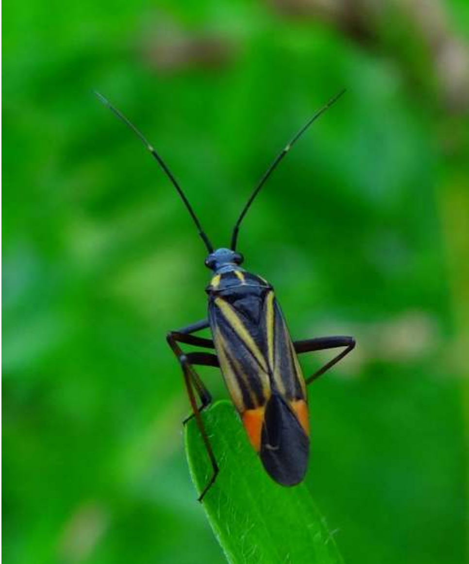
Hadrodemus m-flavum - Hemiptera – Miridae - (Lieu : HEIDWILLER – 25.06.2016)