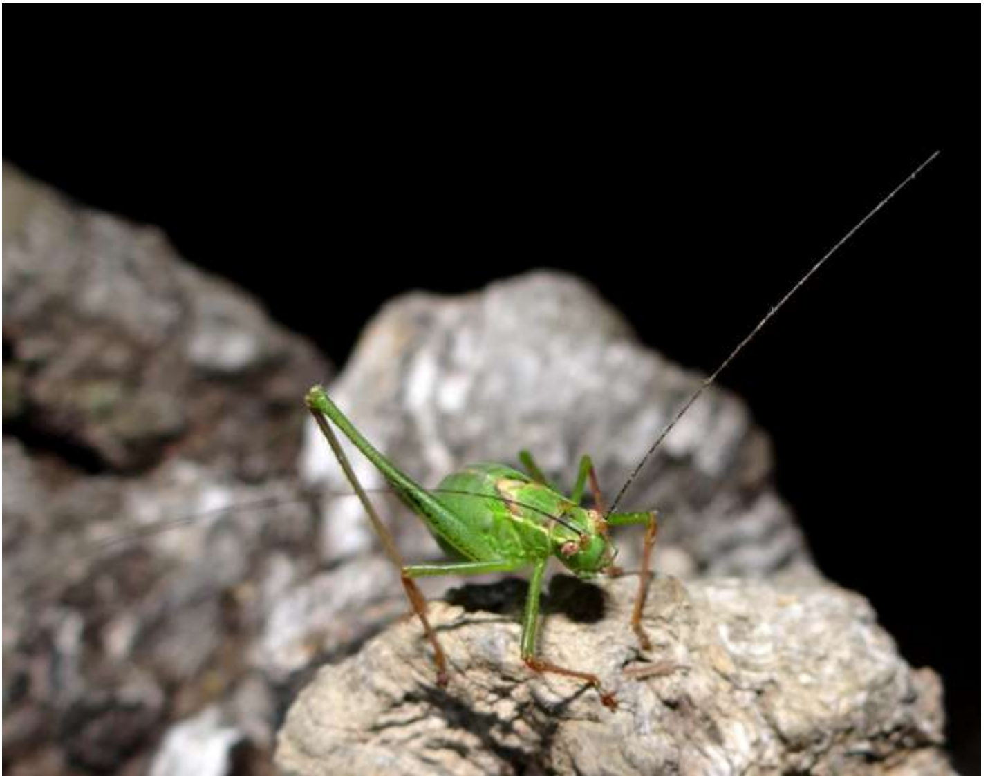
Leptophyes punctatissima – La Leptophye ponctuée – Sauterelle ponctuée Barbitiste très ponctué Orthoptera – Tettigoniidae – (Lieu : aux alentours de CERNAY – Nuit du 10 au 11.09.2016)