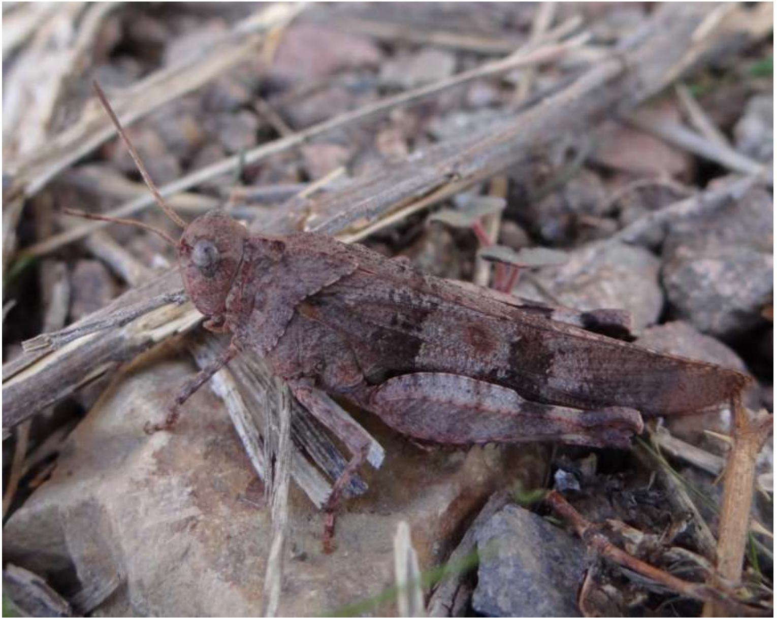
Oedipoda caerulescens - Oedipode turquoise – Criquet à ailes bleues et noires – Criquet bleu – Criquet rubané – Oedipode bleuâtre – Acrididae – (Lieu : Le Rangen sur les hauteurs de THANN / VIEUX-THANN - 18.07.2016)