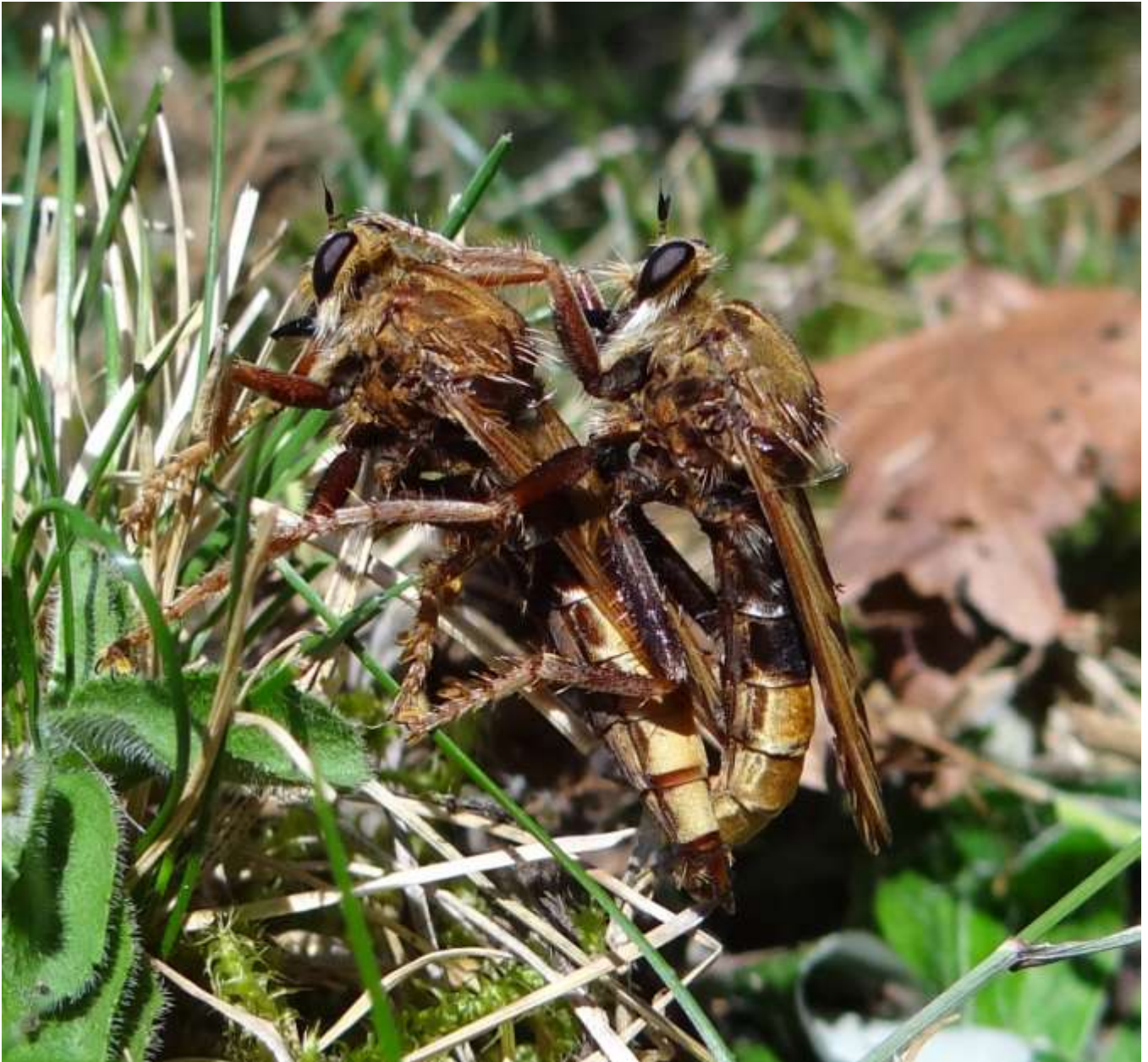
Asilus crabroniformis - Asile frelon - Diptera – Asilidae (Lieu : GERSTACKER sur les hauteurs d'ALTENBACH – 13.09.2016)