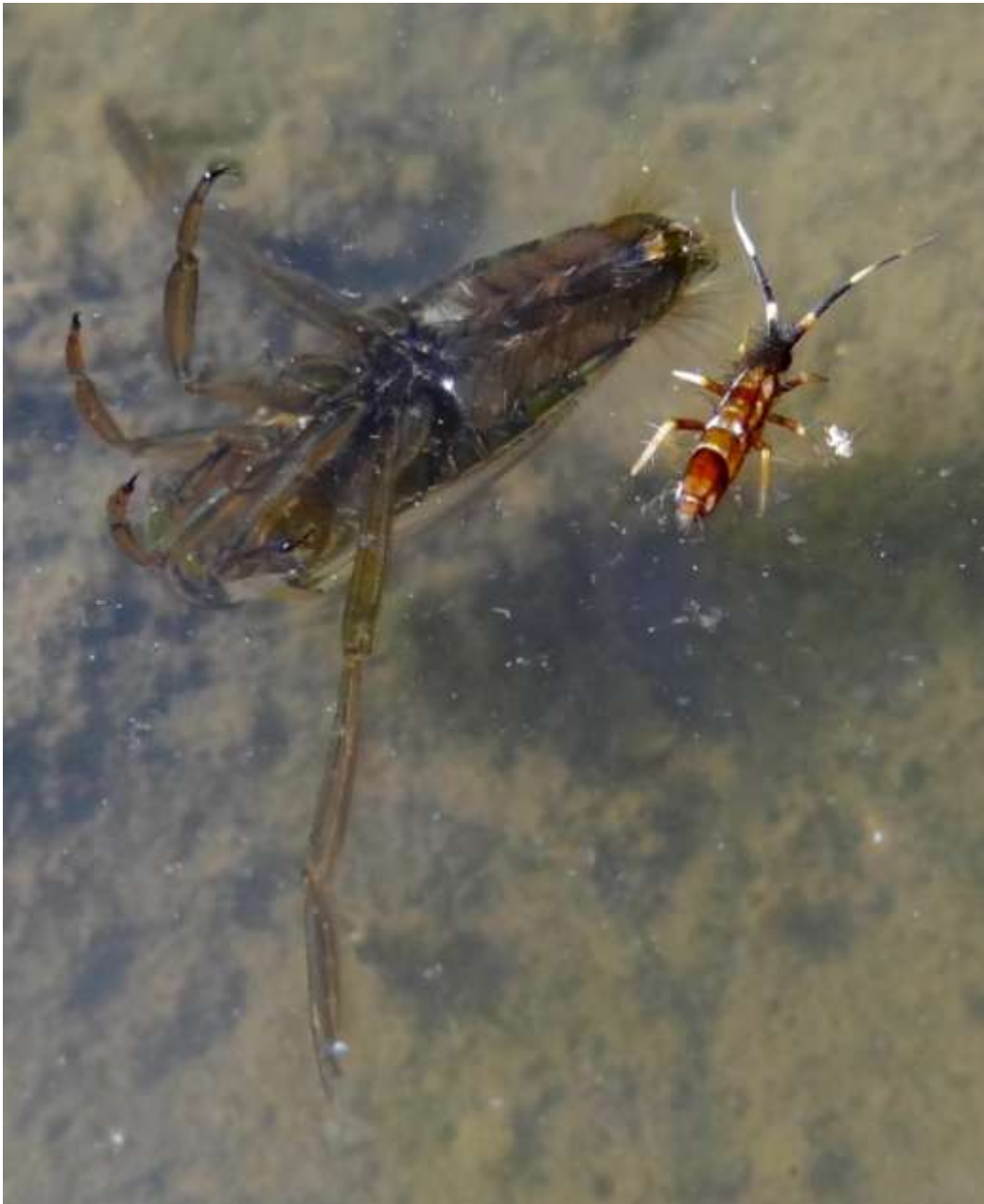
Notonecta sp (Hemiptera – Notonectidae) et Orchesella cincta (Collembola – Entomobryidae) (Lieu : Réserve naturelle régionale des marais et landes du ROTHMOOS « WITTELSHEIM -68- »)