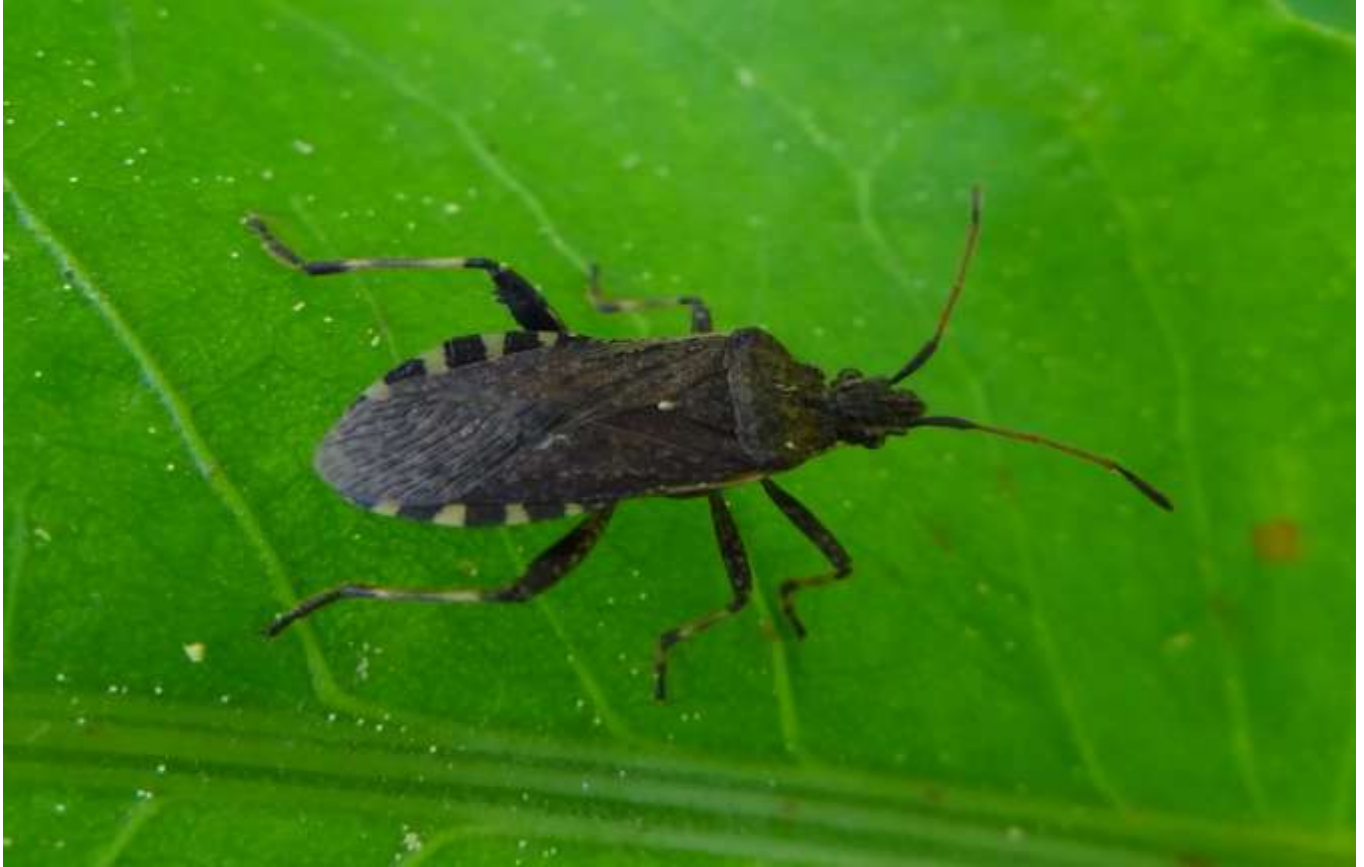
Ceraleptus gracilicornis – Hemiptera – Coreidae – (Lieu : STEINBACH « secteur Silberthal » - 09.05.2016)