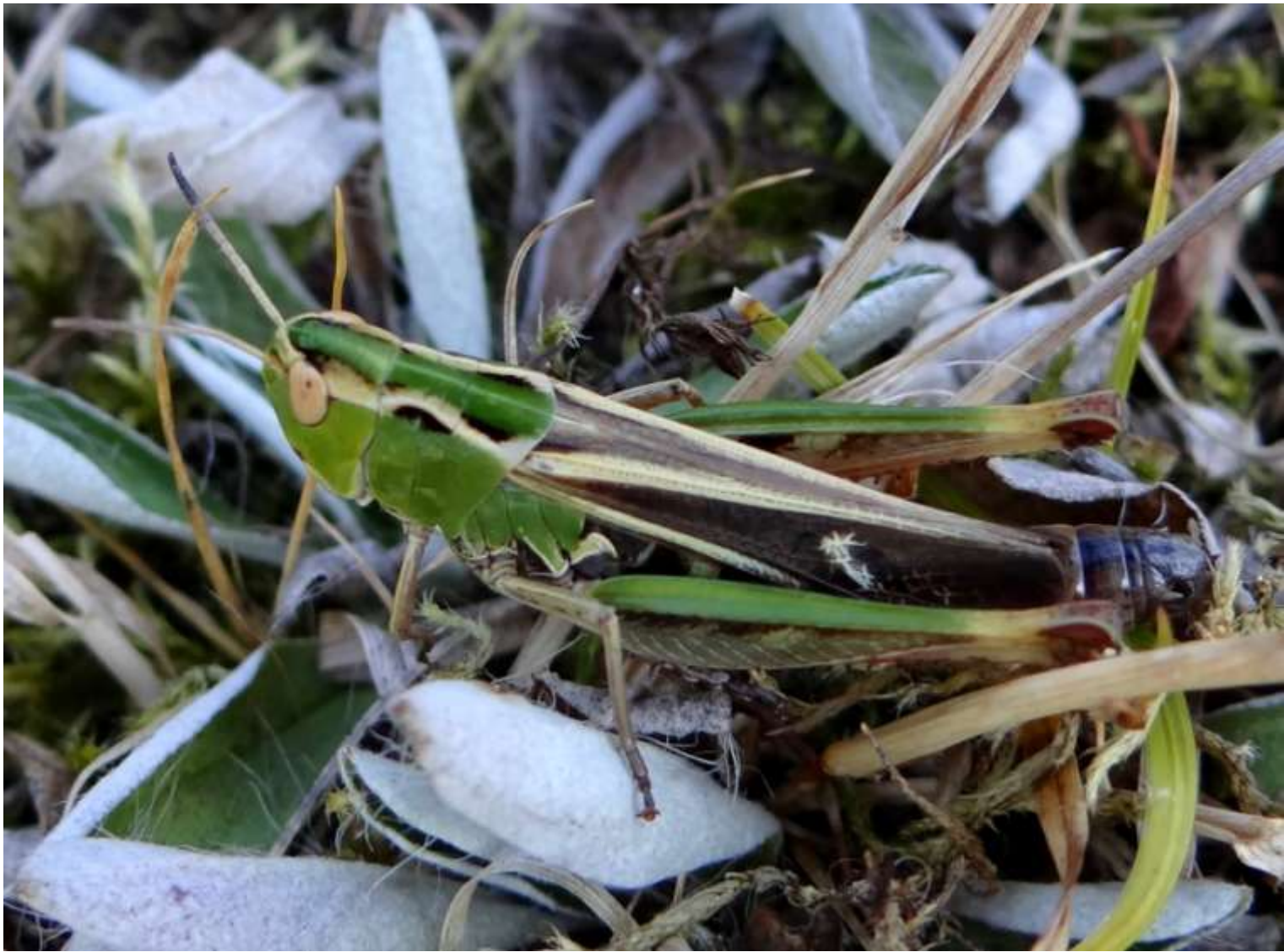
Stenobothrus lineatus – Criquet de la Palène - Le Sténobothre ligné – Criquet du brachypode – Orthoptera – Acrididae (Lieu : GERSTACKER sur les hauteurs de ALTENBACH – 13.09.2016)