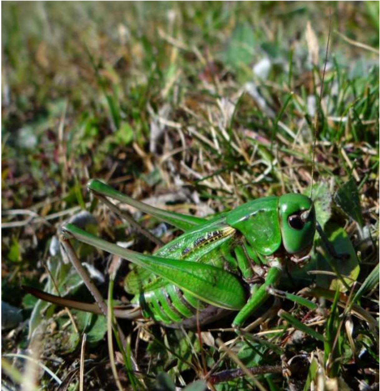
Decticus verrucivorus - Le Dectique verrucivore – Sauterelle à sabre - Orthoptera – Tettigoniidae - (Lieu : GERSTACKER sur les hauteurs d'ALTENBACH – 13.09.2016)