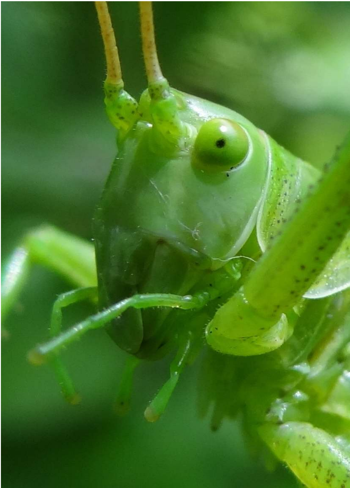
Probablement : Tettigonia viridissima – La Grande sauterelle verte – Tettigoniidae - Réserve naturelle régionale du ROTHMOOS (Mar-en-Bois) - 26.06.2015 –