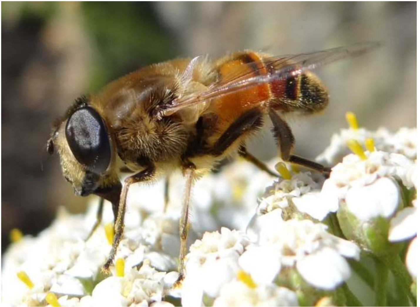
Eristalis jugorum – Syrphidae (Lieu : secteur HERRENFLUH - 08.06.2015)