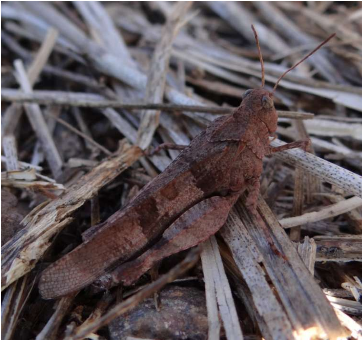
Oedipoda caerulescens - Oedipode turquoise – Criquet à ailes bleues et noires – Criquet bleu – Criquet rubané – Oedipode bleuâtre – Acrididae – (Lieu : Le Rangen sur les hauteurs de THANN / VIEUX-THANN - 18.07.2016)