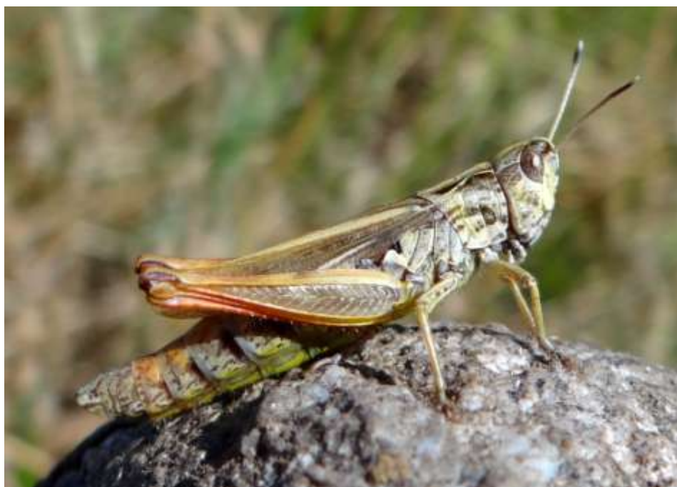
Gomphocerippus rufus – Gomphocère roux – Gomphocère fauve – Orthoptera – Acrididae – (Lieu : GERSTACKER sur les hauteurs d'ALTENBACH – 13.09.2016)