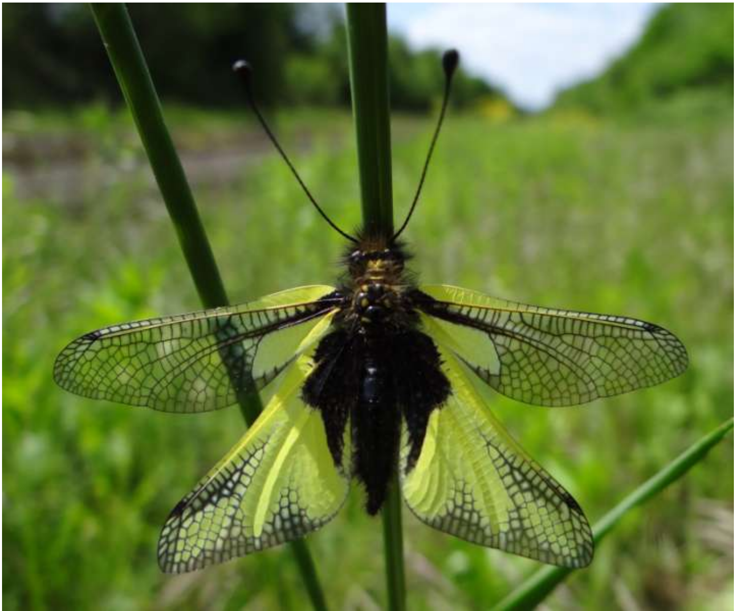
Libelloides coccajus - L'Ascalaphe soufré – femelle - Ascalaphidae (Lieu : secteur forêt de la Harth ou Hardt 68 – 10.05.2015)