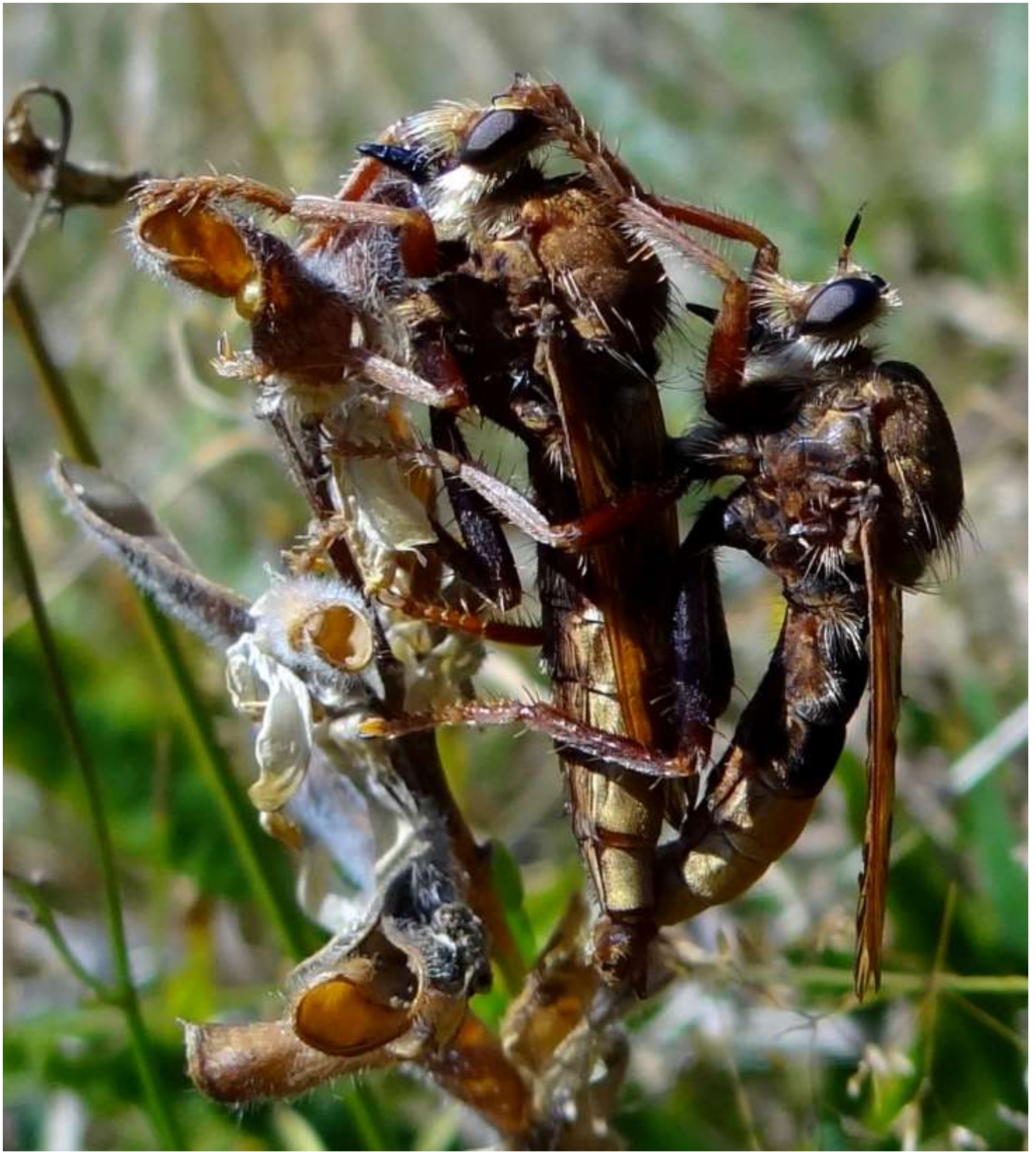
Asilus crabroniformis - Asile frelon - Diptera – Asilidae (Lieu : GERSTACKER sur les hauteurs d'ALTENBACH – 13.09.2016)