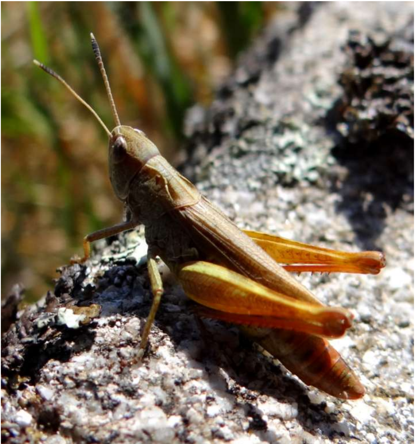
Gomphocerippus rufus – Gomphocère roux – Gomphocère fauve – Orthoptera – Acrididae – (Lieu : GERSTACKER sur les hauteurs d'ALTENBACH – 13.09.2016)