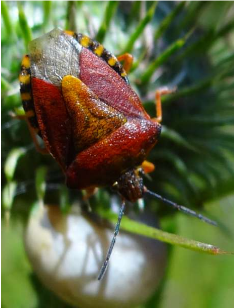
Carpocoris purpureipennis – Punaise à pattes rouges - Hemiptera – Pentatomidae (Lieu : Réserve naturelle régionale des marais et landes du ROTHMOOS « WITTELSHEIM -68-)