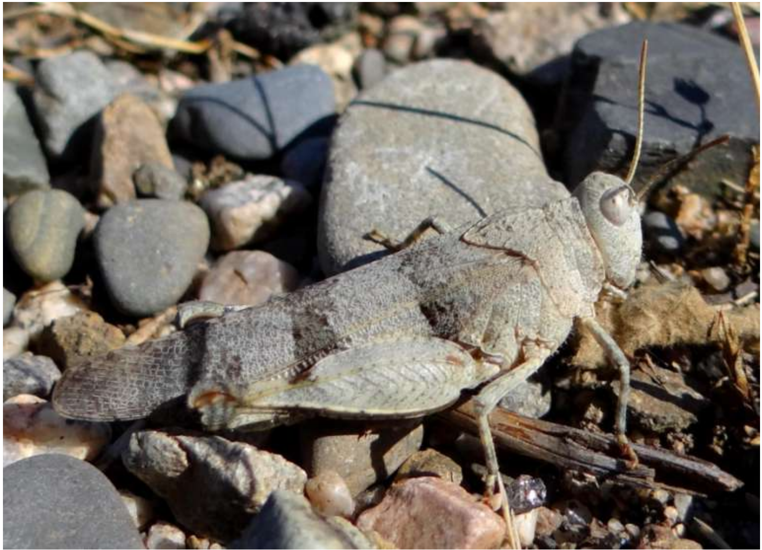
Oedipoda caerulescens - Oedipode turquoise – Criquet à ailes bleues et noires – Criquet bleu – Criquet rubané – Oedipode bleuâtre – Acrididae –

(Lieu : Réserve naturelle régionale des marais et landes du ROTHMOOS « WITTELSHEIM -68- »)