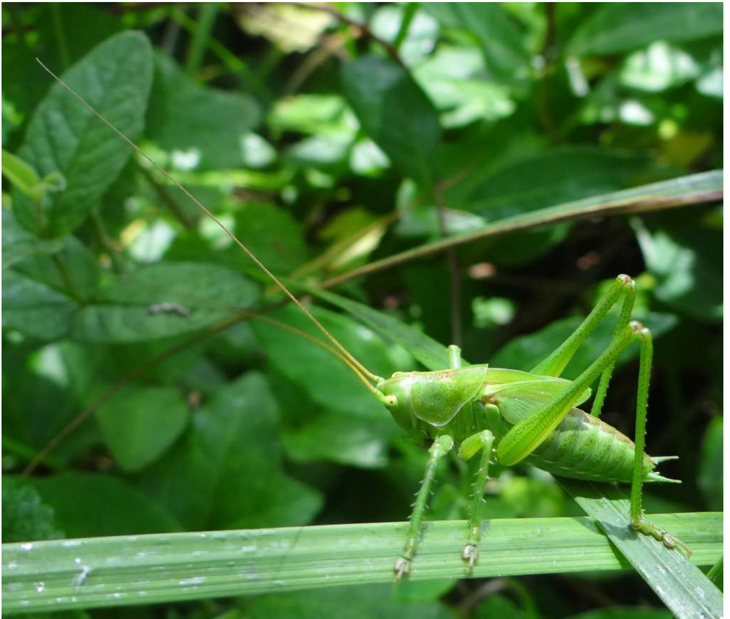
probablement : Tettigonia viridissima – La Grande sauterelle verte – Tettigoniidae - (stade larvaire en raison des ailes non entièrement développées) Réserve naturelle régionale du ROTHMOOS (Mar-en-Bois) - 26.06.2015 –