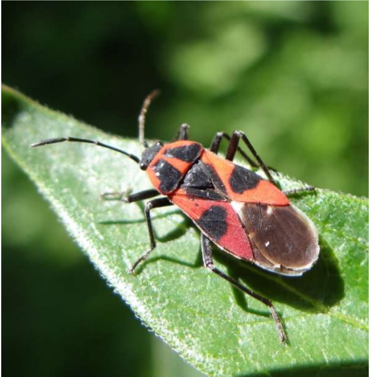
Tropidithorax leucopterus - Punaise du Dompte-venin – Lygaeidae – (Lieu : DESSENHEIM 68 – 24.06.2015)