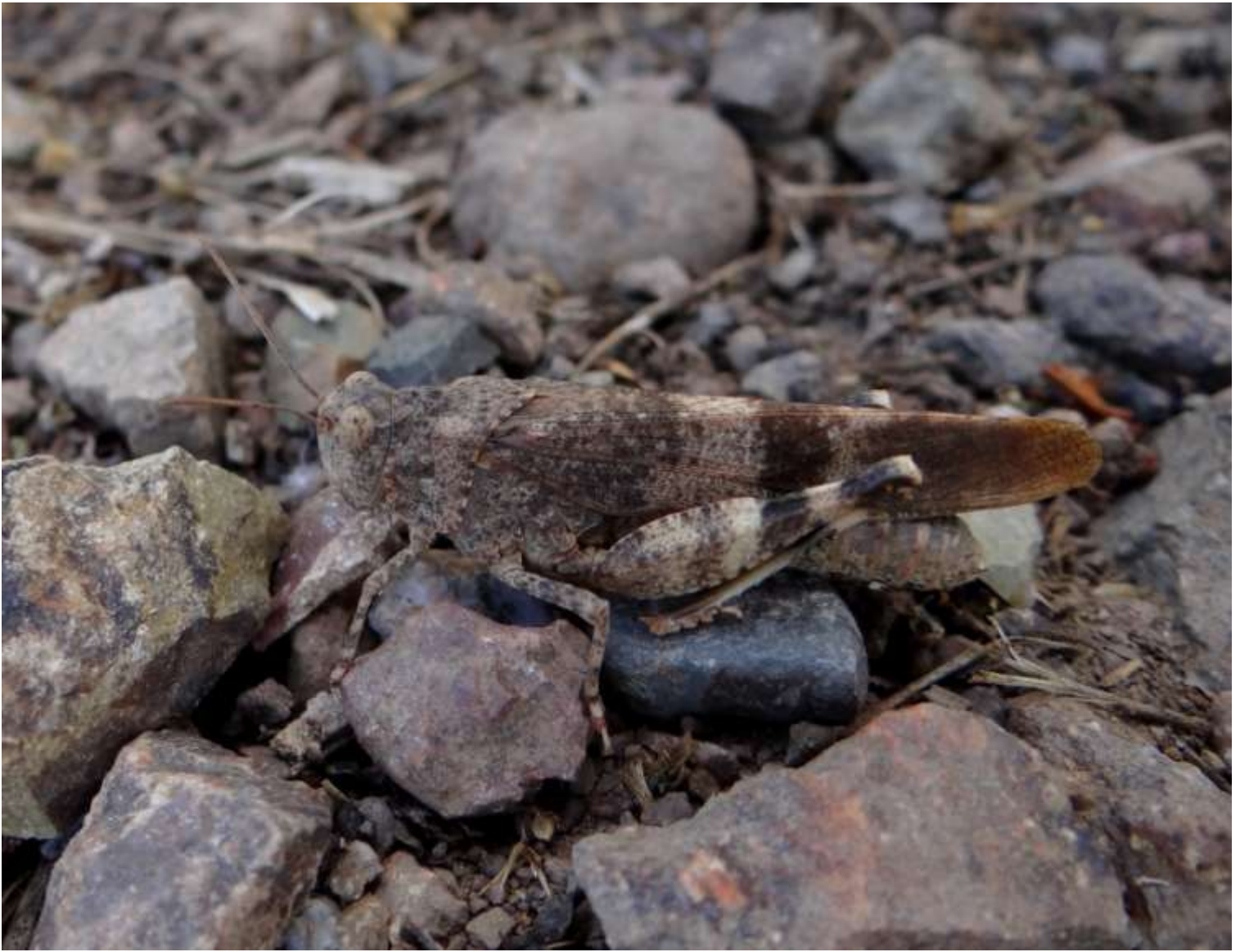
Oedipoda germanica - Oedipode rouge – Le Criquet à ailes rouges – Acrididae - (Lieu : Le Rangen sur les hauteurs de THANN / VIEUX-THANN – 30.09.2016)