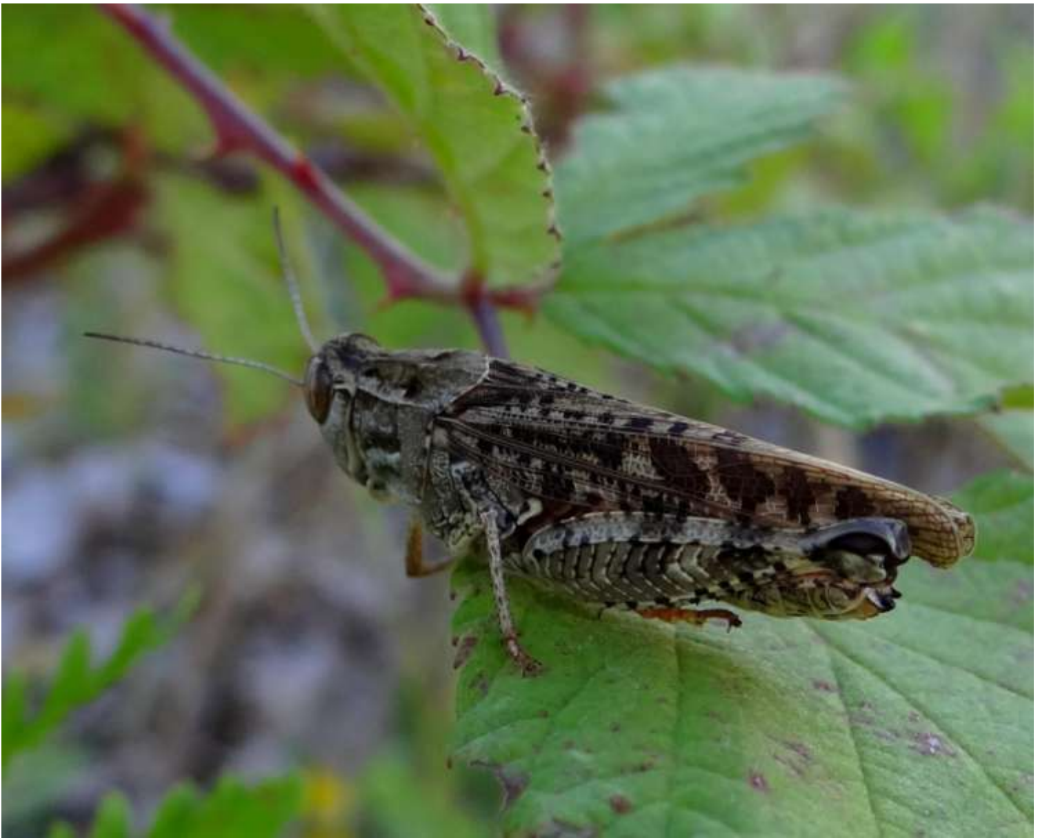
Calliptamus italicus - Criquet italien – Caloptène italien - Acrididae (Lieu : Réserve naturelle régionale des marais et landes du ROTHMOOS « WITTELSHEIM -68- » 18.07.2016