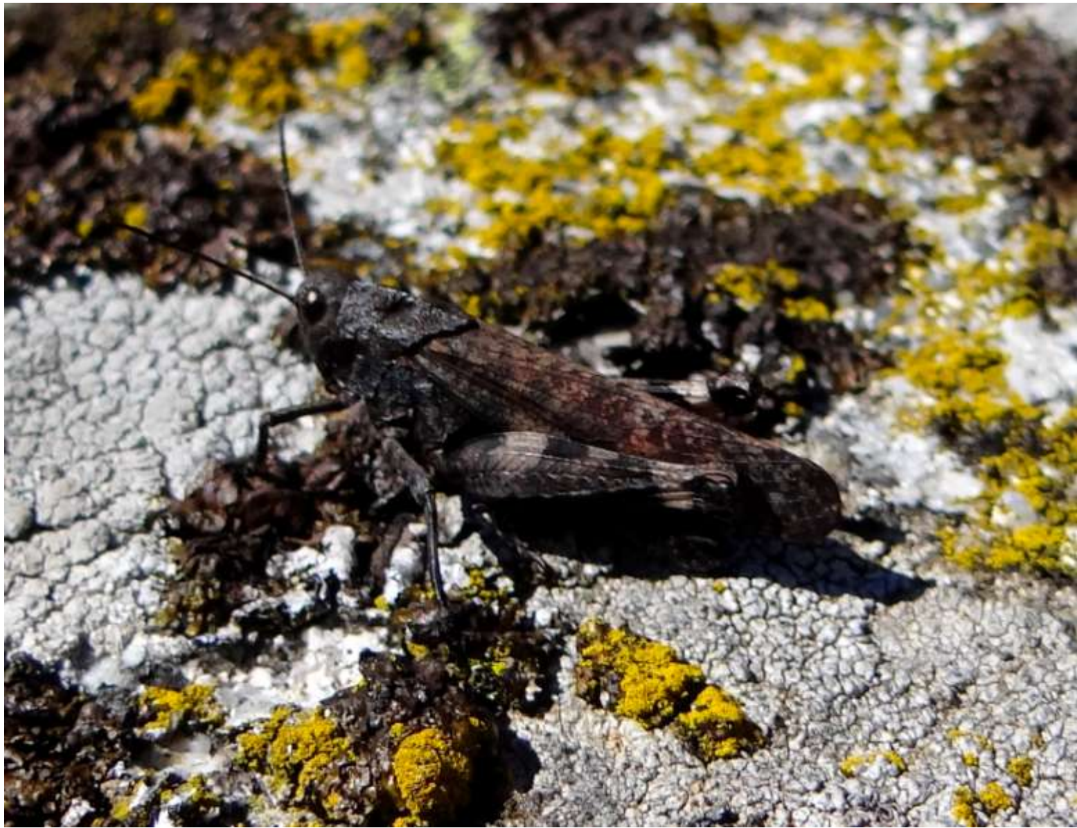
Psophus stridulus – L'Oedipode stridulante - Orthoptera – Acrididae - "Criquet ayant des ailes rouges et émettant un bruit particulier en volant – hélicoptère -» (Lieu : GERSTACKER sur les hauteurs d'ALTENBACH – 29.09.2016)