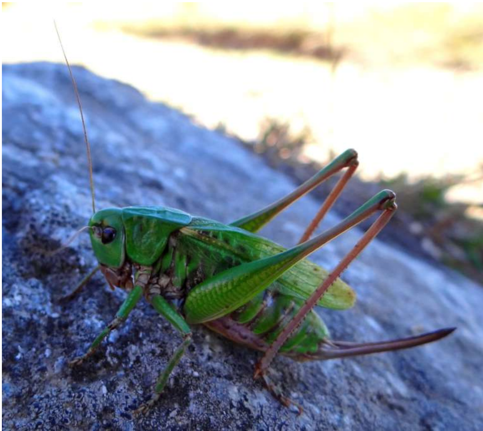
Decticus verrucivorus - Le Dectique verrucivore – Sauterelle à sabre – femelle – Orthoptera – Tettigoniidae - (Lieu : GERSTACKER sur les hauteurs d'ALTENBACH – 29.09.2016)