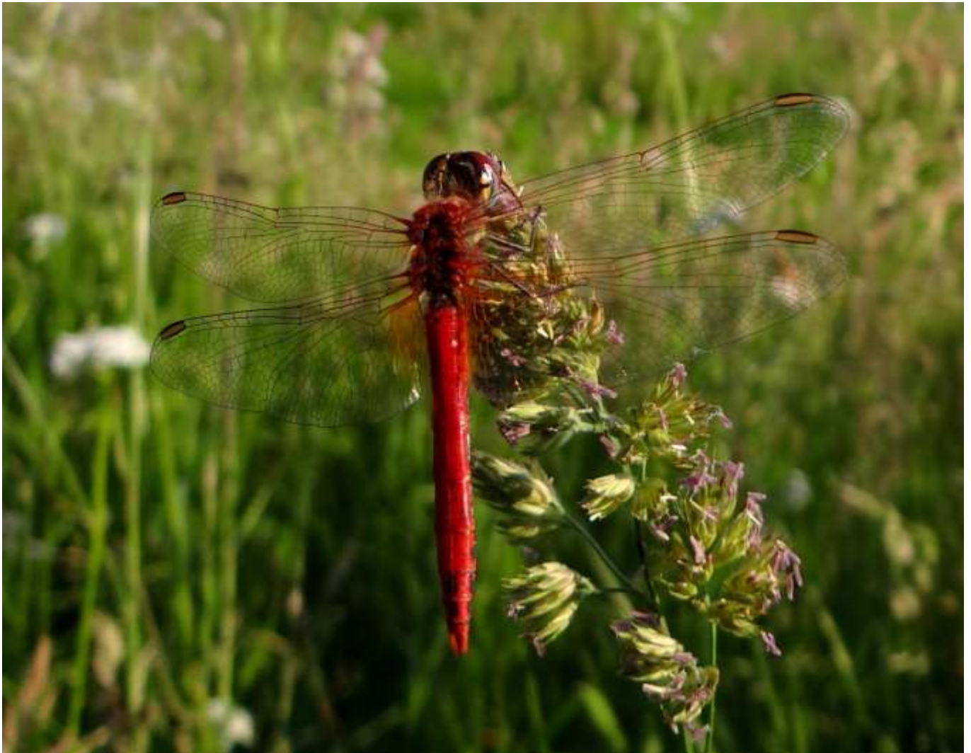
Sympetrum fonscolombii – Sympétrum à nervures rouges – Libellulidae (Lieu : LUTTERBACH « Galgenhag » - 06.06.2016)