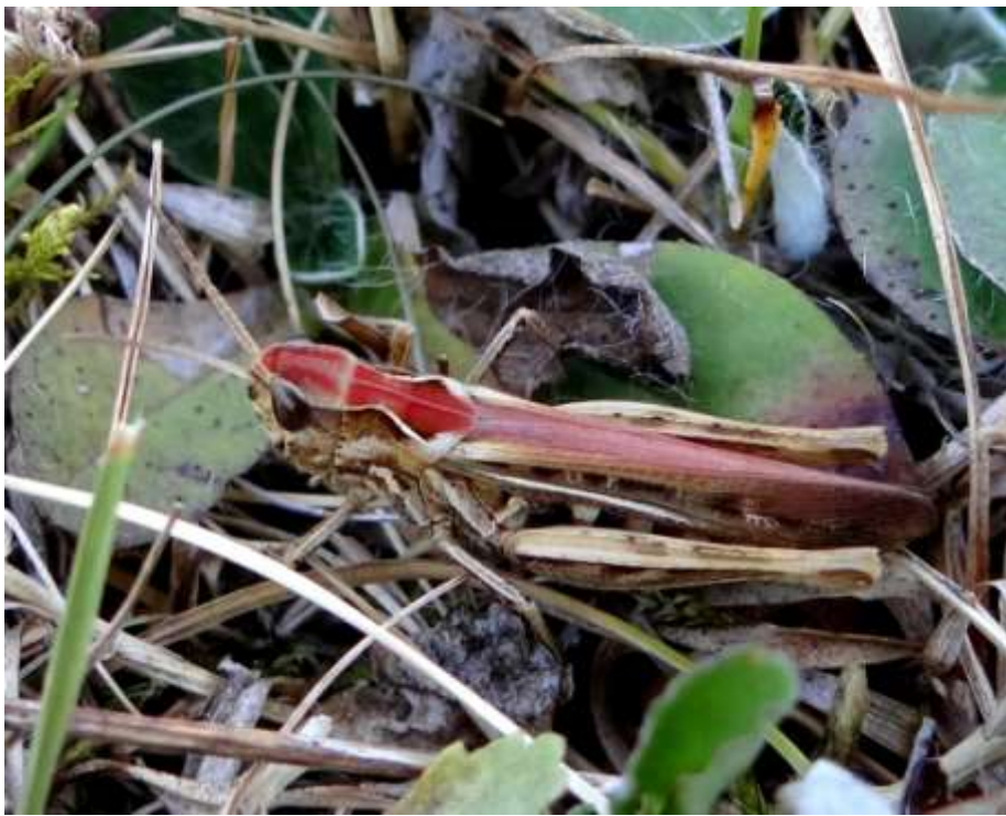
Criquet non identifié du groupe BBM ( Biguttulus , Brunneus , Mollis ) – Acrididae - famille qu'on ne peut distinguer avec certitude que par le chant des mâles. (Lieu : GERSTACKER sur les hauteurs d'ALTENBACH – 13.09.2016)