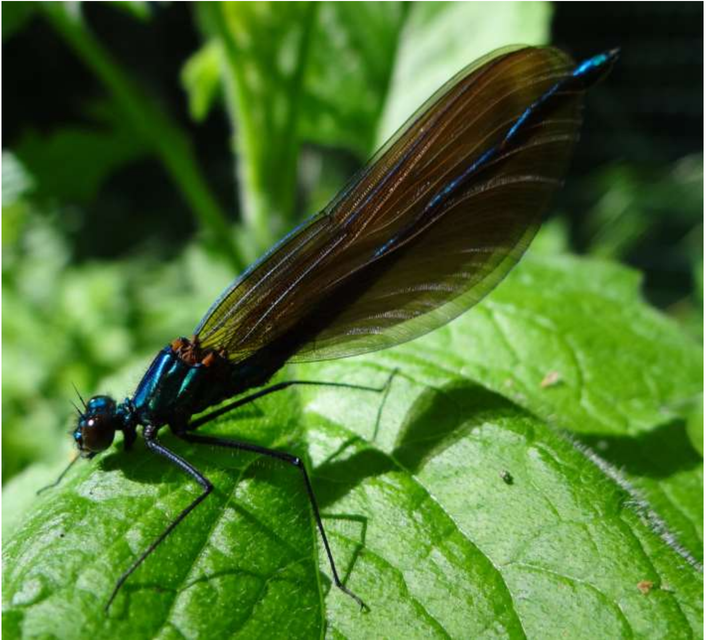
Calopteryx virgo - Caloptéryx vierge - Calopterygidae (Lieu : REININGUE - 13.05.2012)