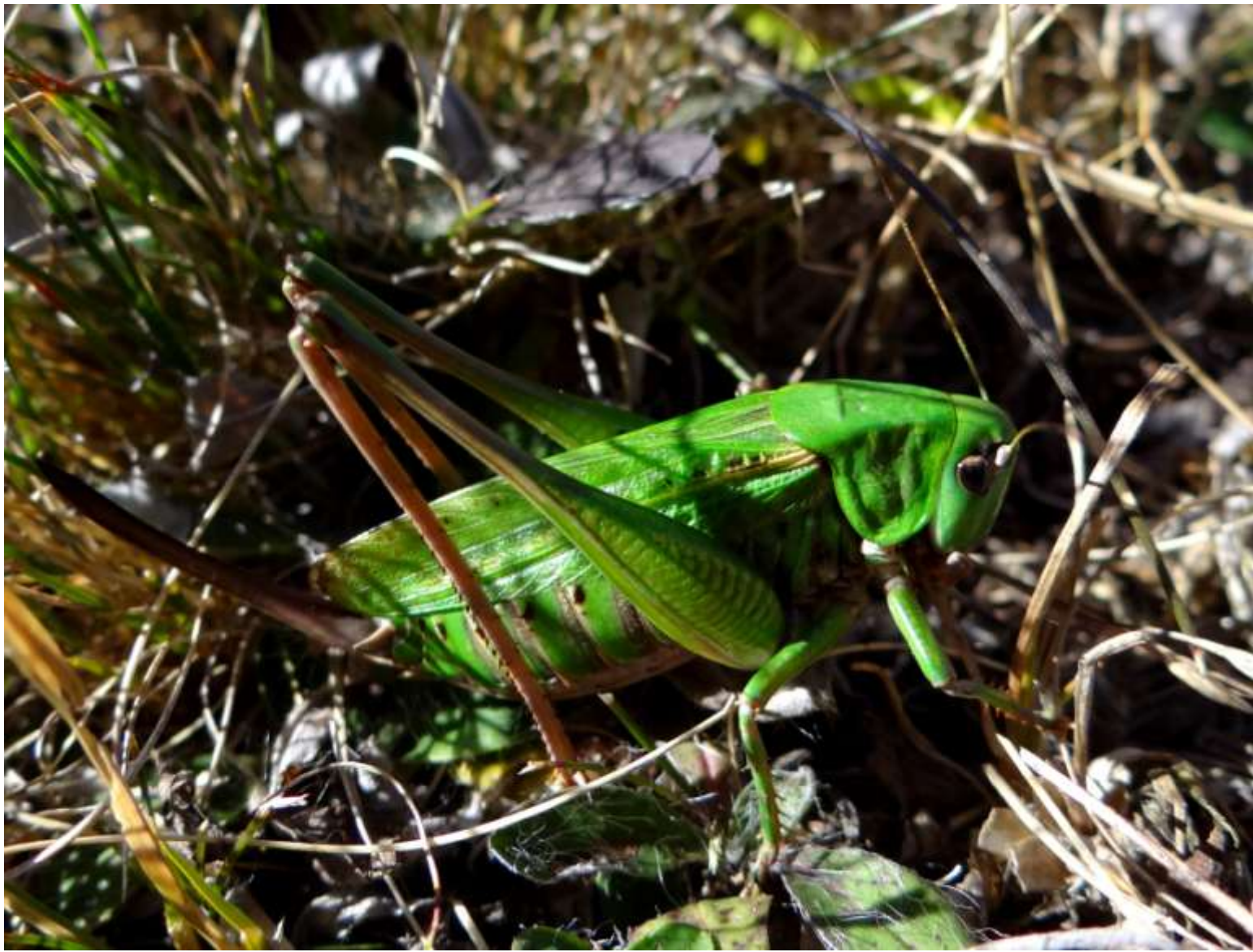
Decticus verrucivorus - Le Dectique verrucivore – Sauterelle à sabre - Orthoptera – Tettigoniidae - (Lieu : GERSTACKER sur les hauteurs d'ALTENBACH – 29.09.2016)