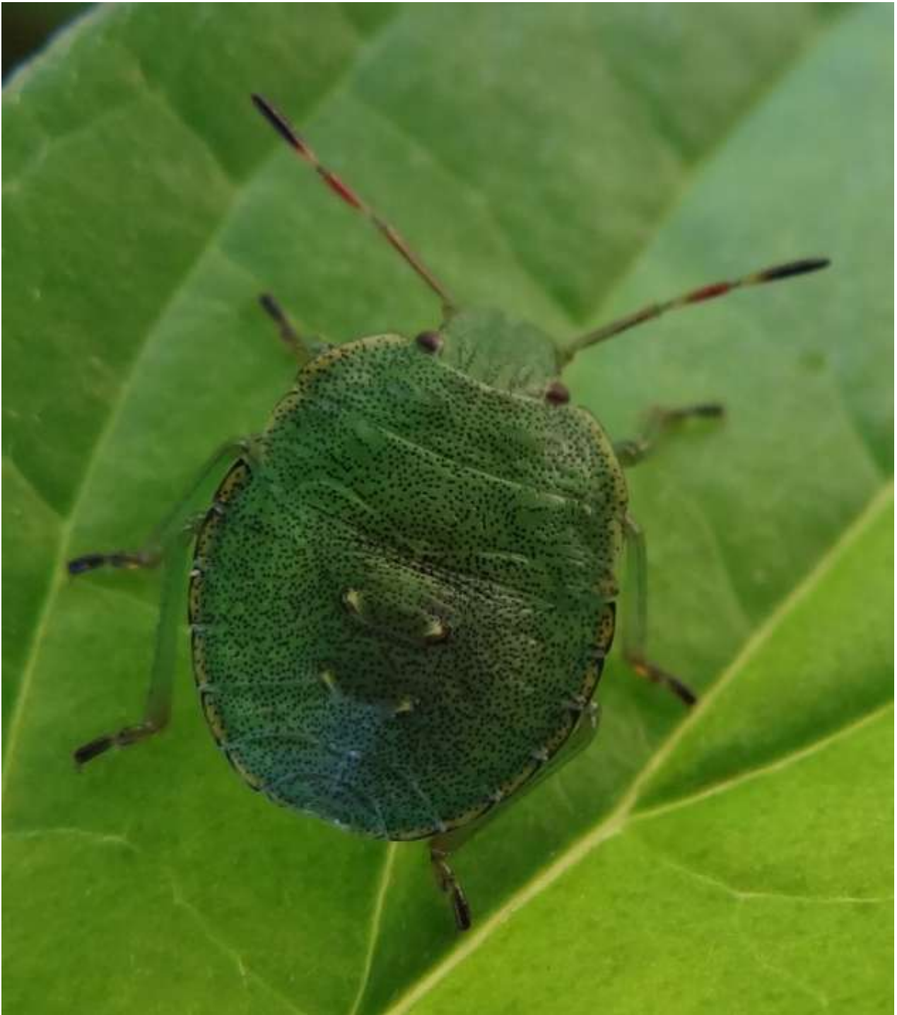
Palomena prasina - larve stade IV – La Punaise verte – Hemiptera - Pentatomidae – (Lieu : DESSENHEIM 68 – 24.06.2015)