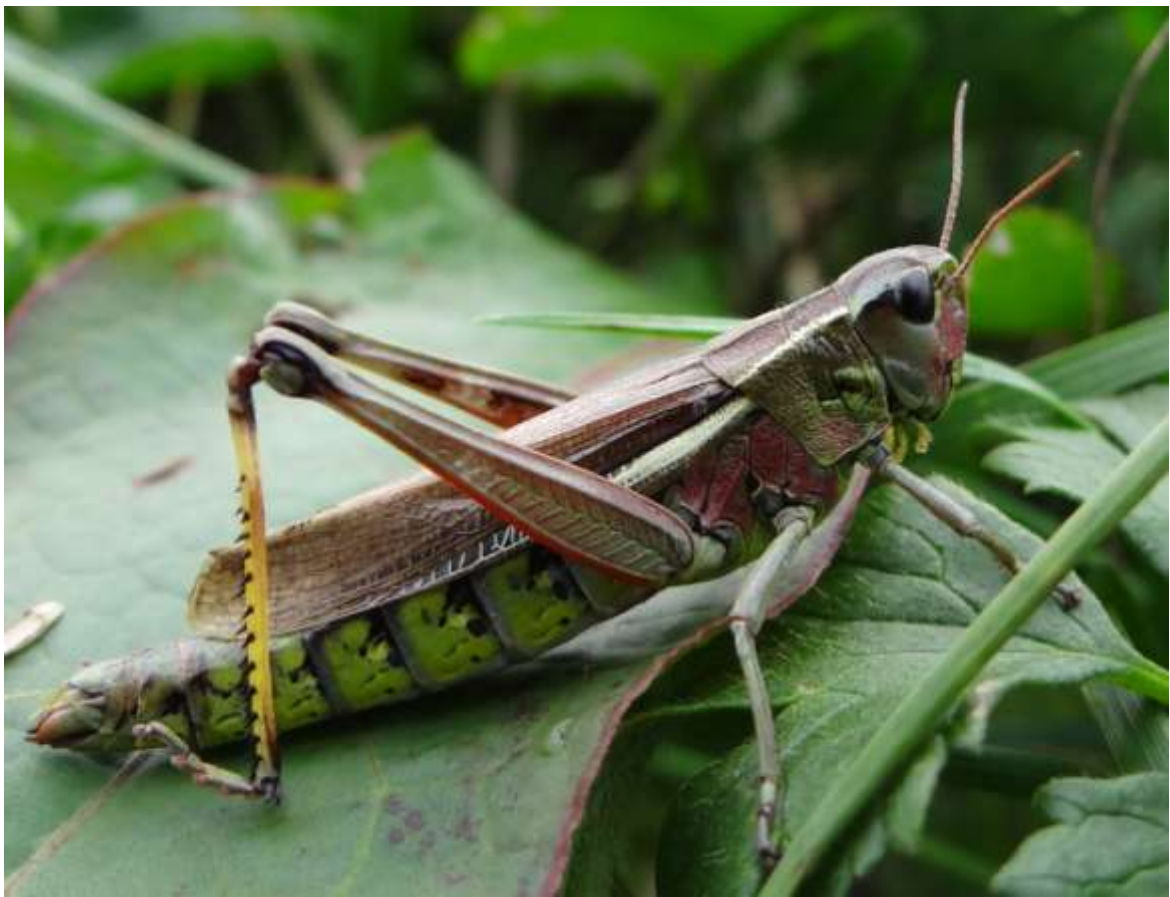
Stethophyma grossum - Criquet ensanglanté – Acrididae – (Lieu : aux alentours de DANNEMARIE – 16.09.2015)