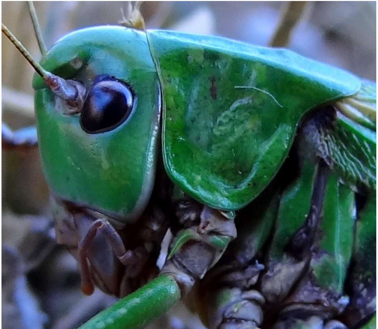
Decticus verrucivorus - Le Dectique verrucivore – Sauterelle à sabre - Orthoptera – Tettigoniidae - (Lieu : GERSTACKER sur les hauteurs d'ALTENBACH – 29.09.2016)