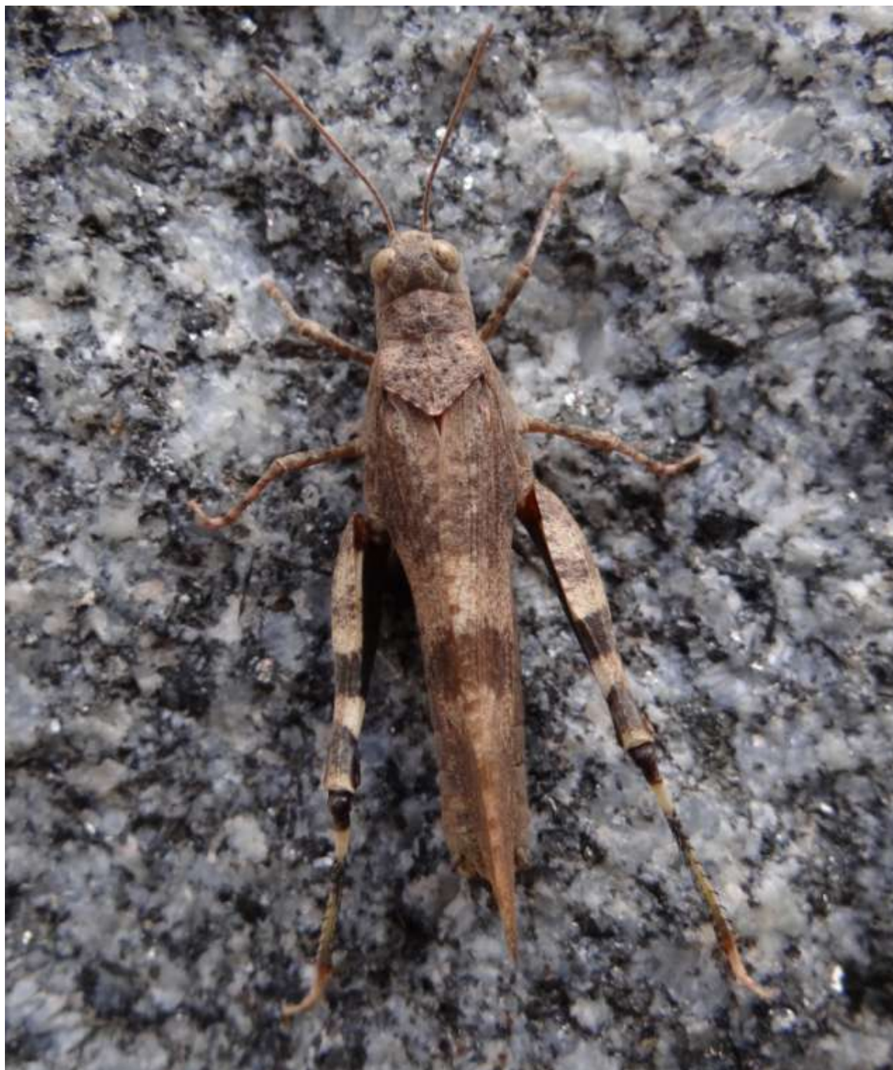
Oedipoda germanica - Oedipode rouge – Le Criquet à ailes rouges – Acrididae - (Lieu : Le Rangen sur les hauteurs de THANN / VIEUX-THANN – 30.09.2016)