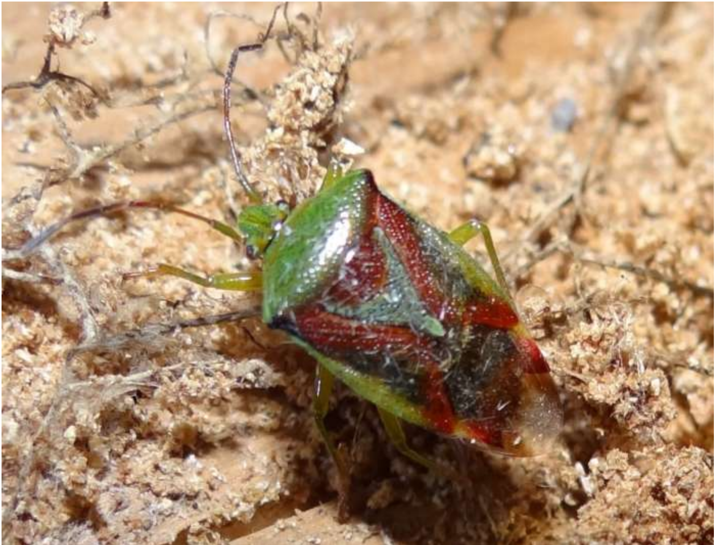
Acanthosoma haemorrhoidale - Punaise de l'Aubépine – Acanthosomatidae (Lieu : BURNHAUPT-LE-HAUT – 22.04.2015)