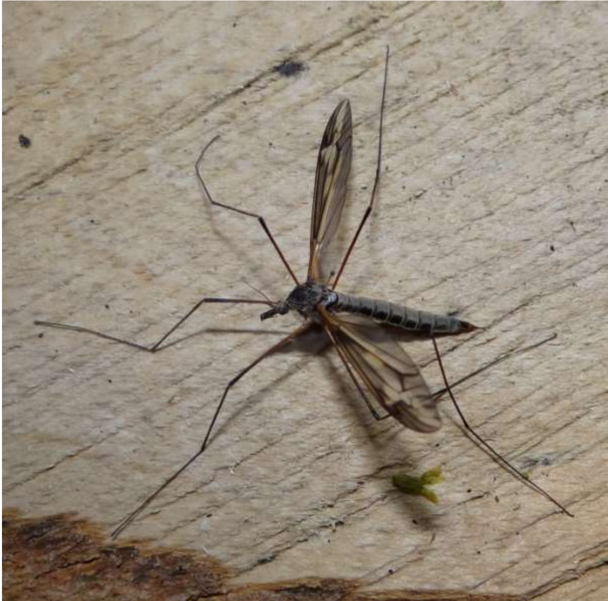
Tipula vittata - femelle – Tipule - Diptera – Tipulidae – (Lieu : BURNHAUPT-LE-HAUT – 22.04.2015)