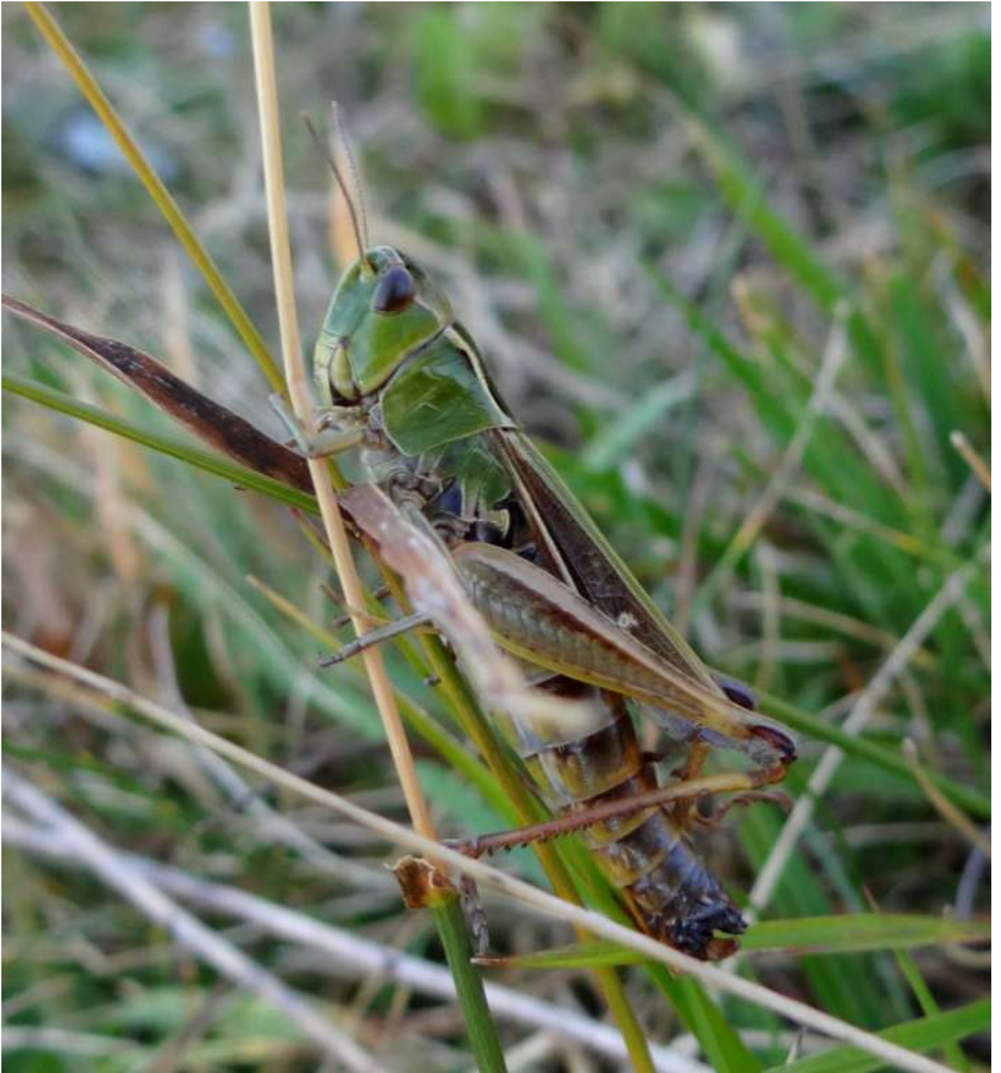
Stenobothrus lineatus – Criquet de la Palène - Le Sténobothre ligné – Criquet du brachypode – Orthoptera – Acrididae (Lieu : GERSTACKER sur les hauteurs de ALTENBACH – 13.09.2016)