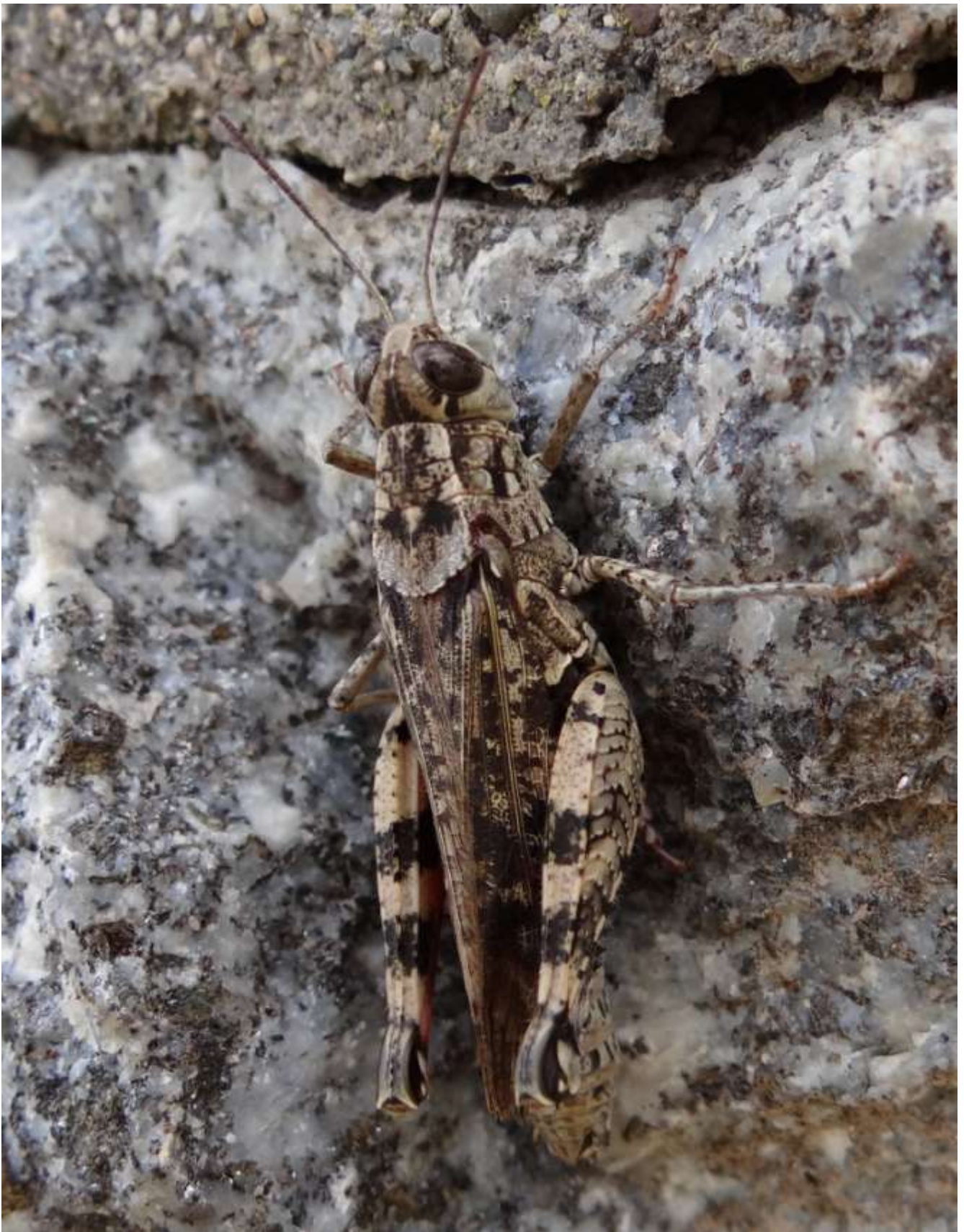
Calliptamus barbarus - Criquet de Barbarie – Caloptène ochracé – Acrididae (Lieu : Le Rangen sur les hauteurs de THANN / VIEUX-THANN – 30.09.2016)