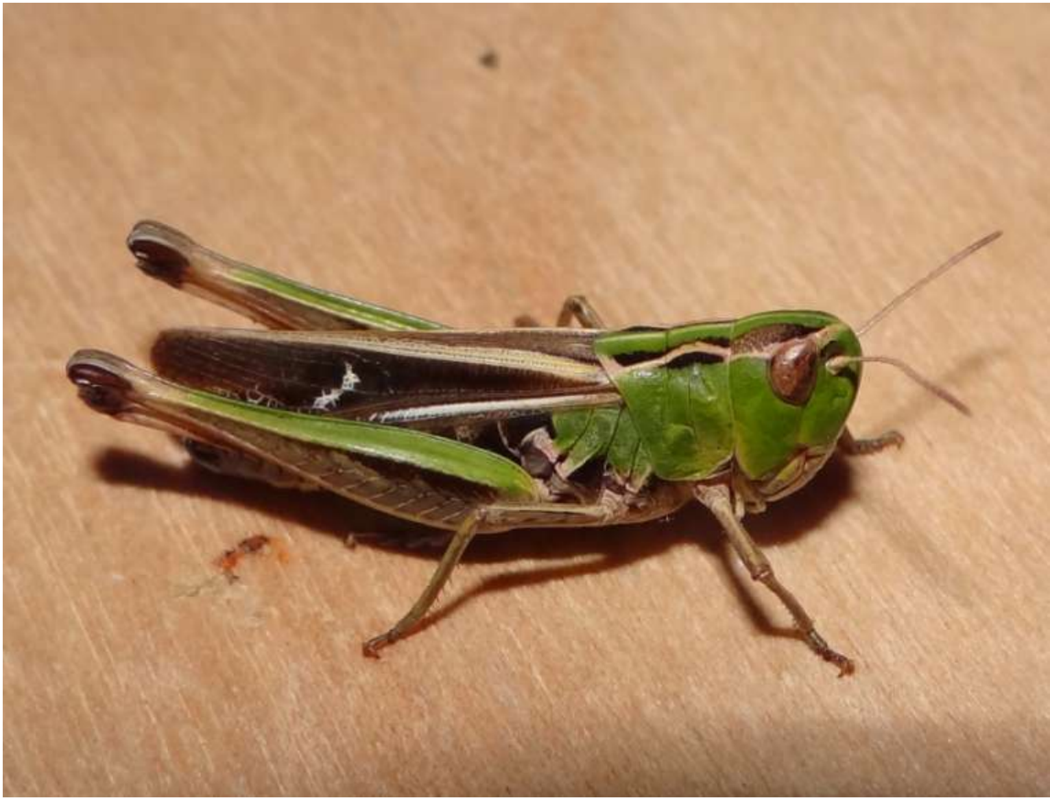
Stenobothrus lineatus – Criquet de la Palène - Le Sténobothre ligné – Criquet du brachypode – Orthoptera – Acrididae (Lieu : aux alentours de CERNAY – Nuit du 10 au 11.09.2016)