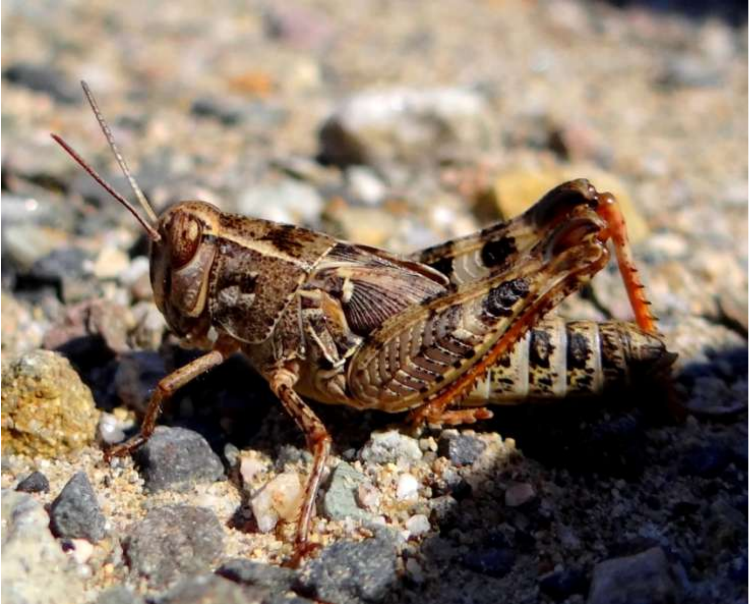
Criquet genre Calliptamus – (espèce indéterminée) – Famille Acrididae (Lieu : Réserve naturelle régionale des marais et landes du ROTHMOOS « WITTELSHEIM -68- ) 18.07.2016