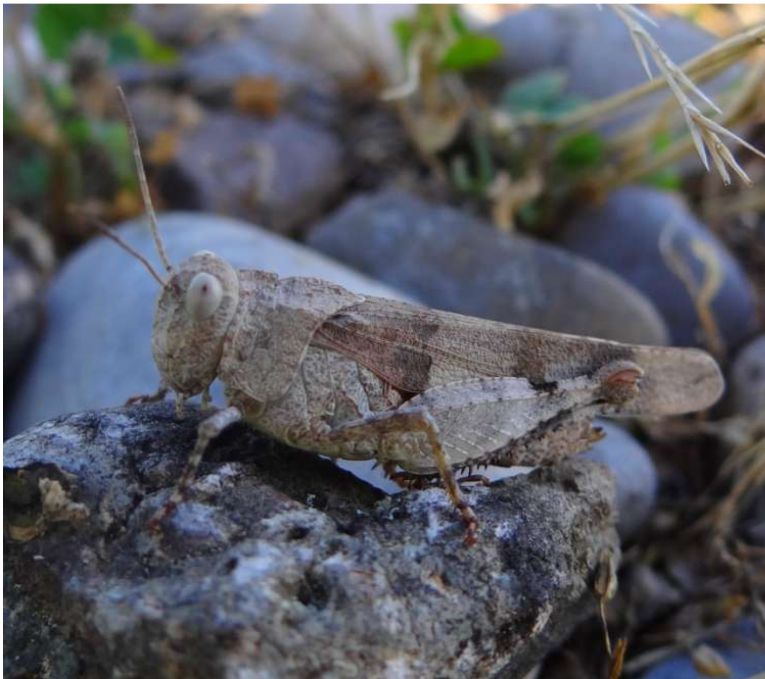
Oedipoda caerulescens - Oedipode turquoise – Criquet à ailes bleues et noires – Criquet bleu – Criquet rubané – Oedipode bleuâtre – Acrididae – (Lieu : Réserve naturelle régionale des marais et landes du ROTHMOOS « WITTELSHEIM -68- ») 18.07.2016