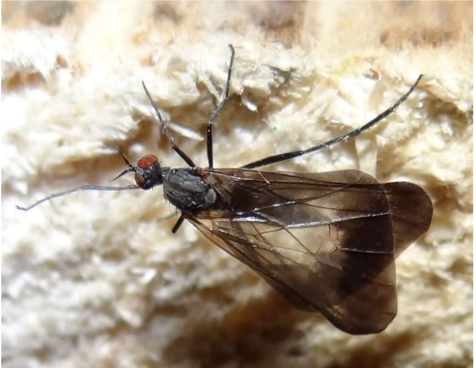
Rhamphomyia marginata – femelle – Empididae - (Lieu : BURNHAUPT-LE-HAUT – 22.04.2015)