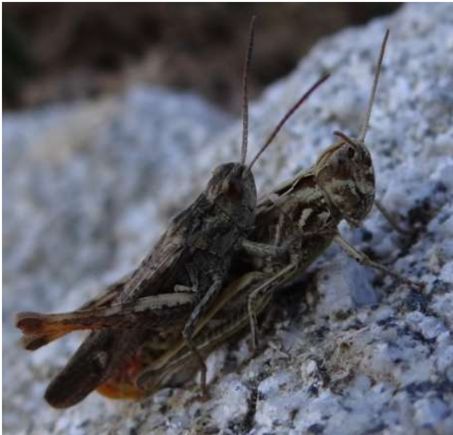
Criquet non identifié du groupe BBM ( Biguttulus , Brunneus , Mollis ) – Acrididae - famille qu'on ne peut distinguer avec certitude que par le chant des mâles. (Lieu : GERSTACKER sur les hauteurs d'ALTENBACH – 13.09.2016)