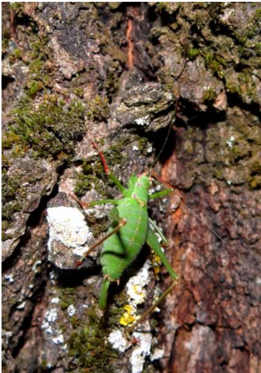
Leptophyes punctatissima – La Leptophye ponctuée – Sauterelle ponctuée Barbitiste très ponctué Orthoptera – Tettigoniidae – (Lieu : aux alentours de CERNAY – Nuit du 10 au 11.09.2016)