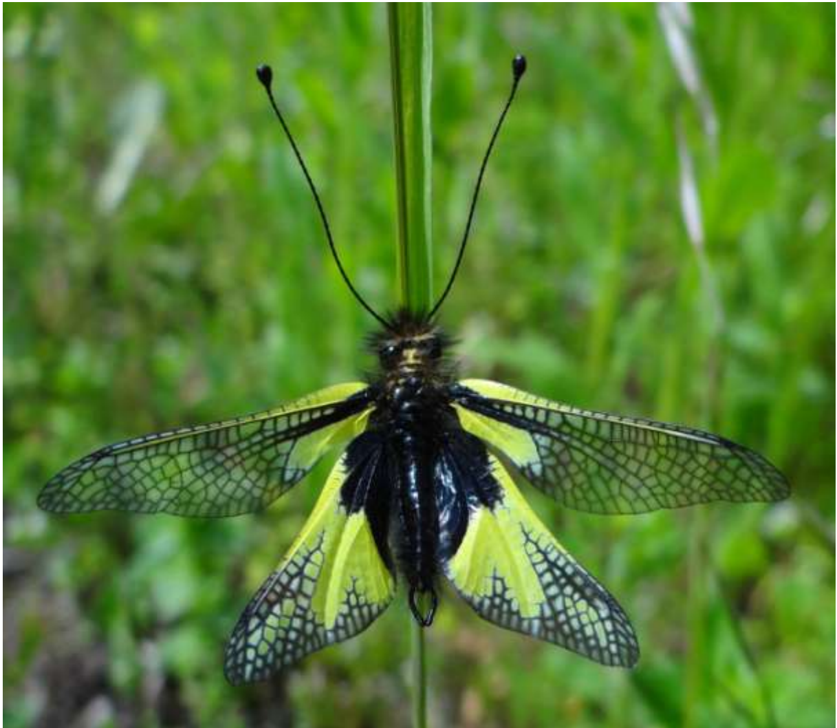
Libelloides coccajus - L'Ascalaphe soufré – mâle - Ascalaphidae Le mâle est reconnaissable à ses cerques à l'extrémité de l'abdomen (Lieu : secteur forêt de la Harth ou Hardt 68 – 10.05.2015)