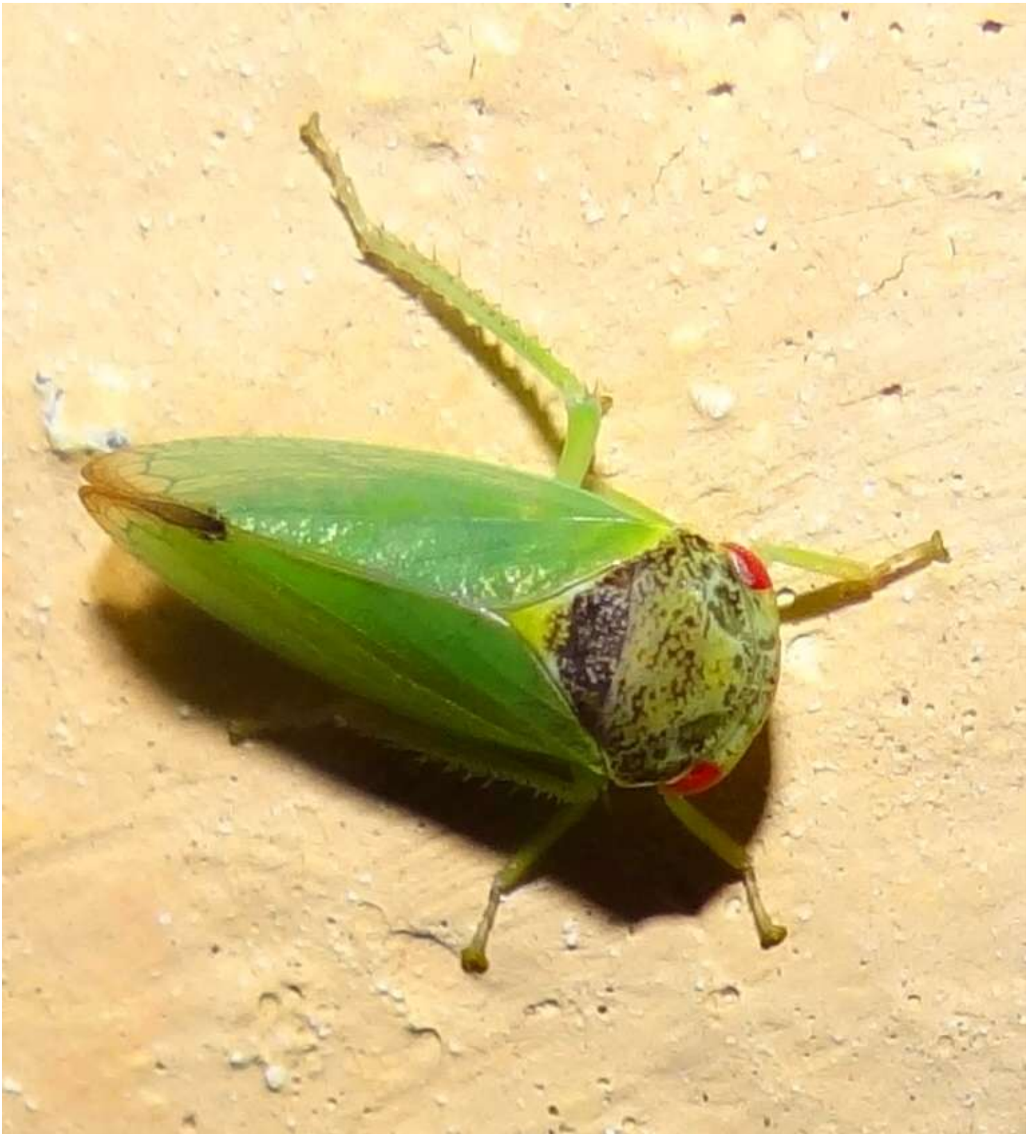
Iassus lanio - La Cicadelle du Chêne – Cicadellidae (Lieu : secteur Observatoire aux alentours du Russawag – Nuit du 29 au 30.06.2016)