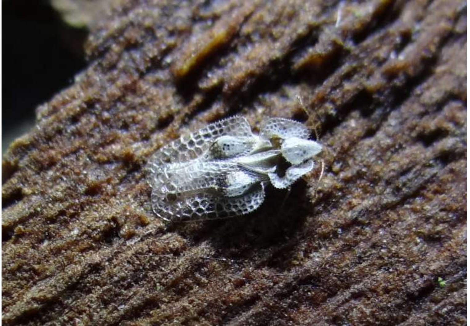
Corythucha ciliata - Le Tigre du platane (Tingidae)

(Place « platanes » intersection Grand Rue et Rue du Repos)