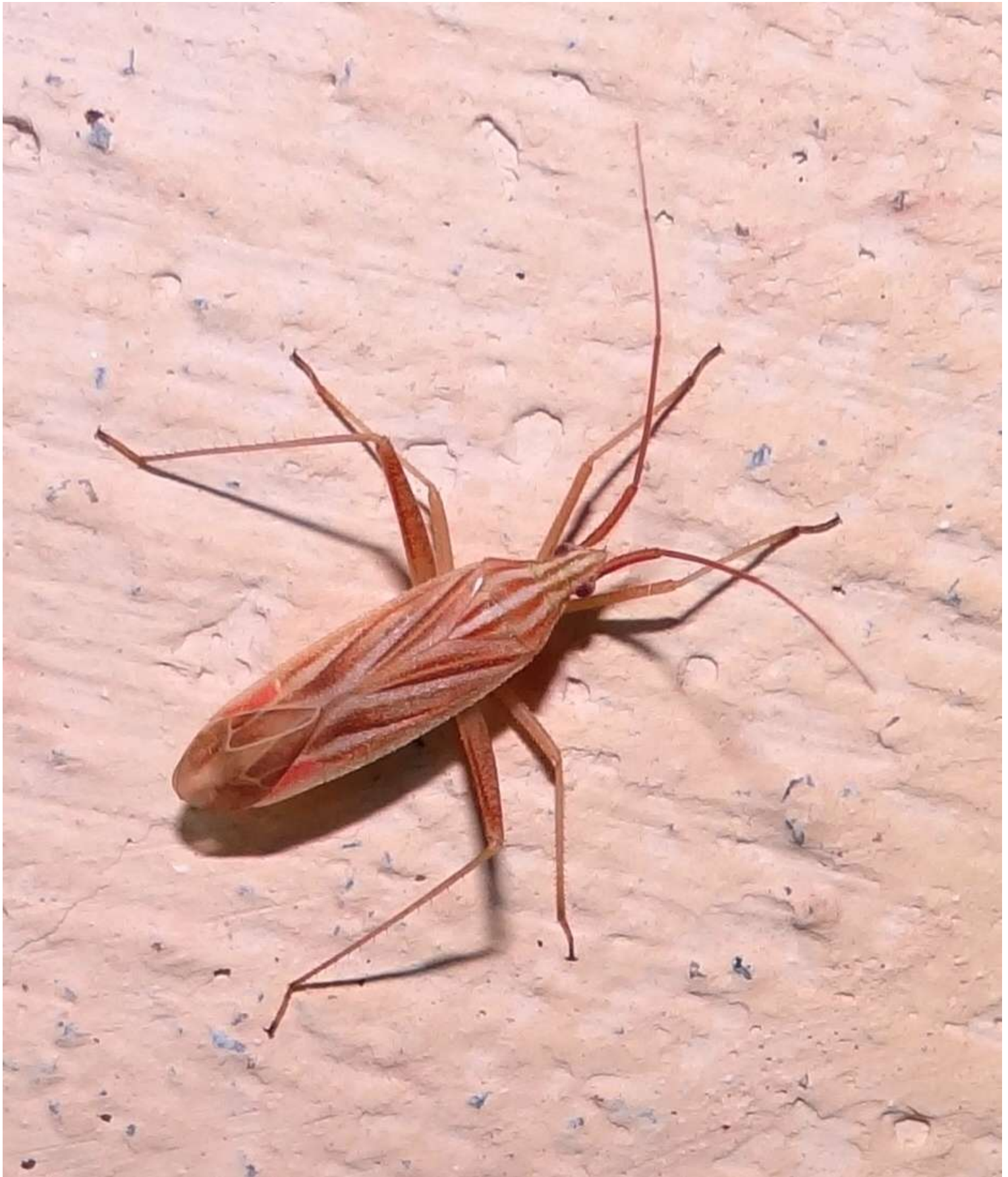
Miridius quadrivirgatus – Miridae - (Lieu : La Taverne – Nuit du 29 au 30.06.2016)