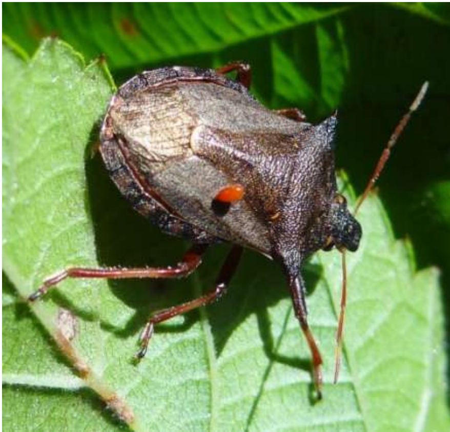
Picromerus bidens – Punaise épineuse - Pentatomidae – (Lieu : verger à proximité du Compost – 24.09.2015)