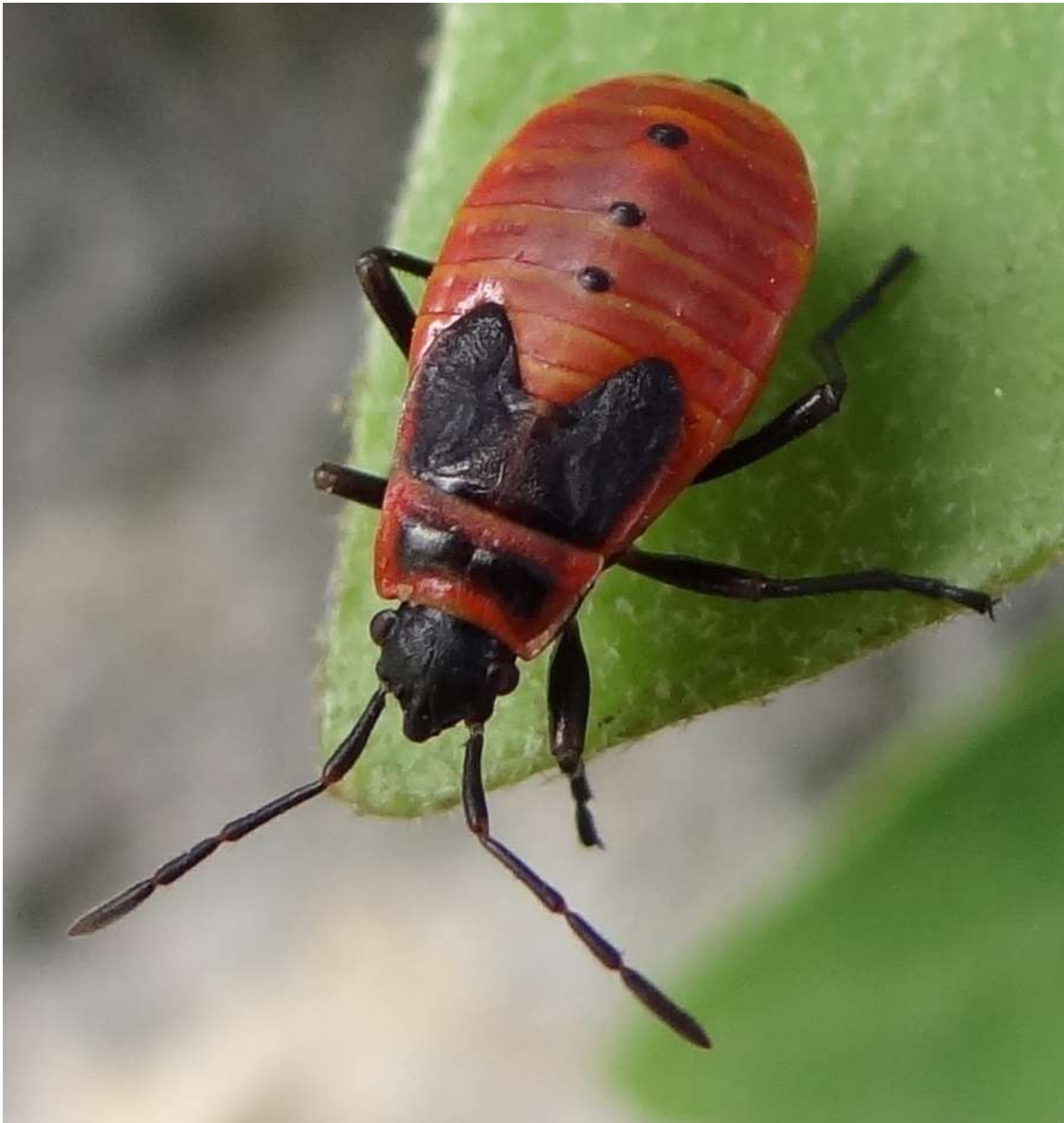
Pyrrhocoris apterus – larve - Pyrrhocoridae –