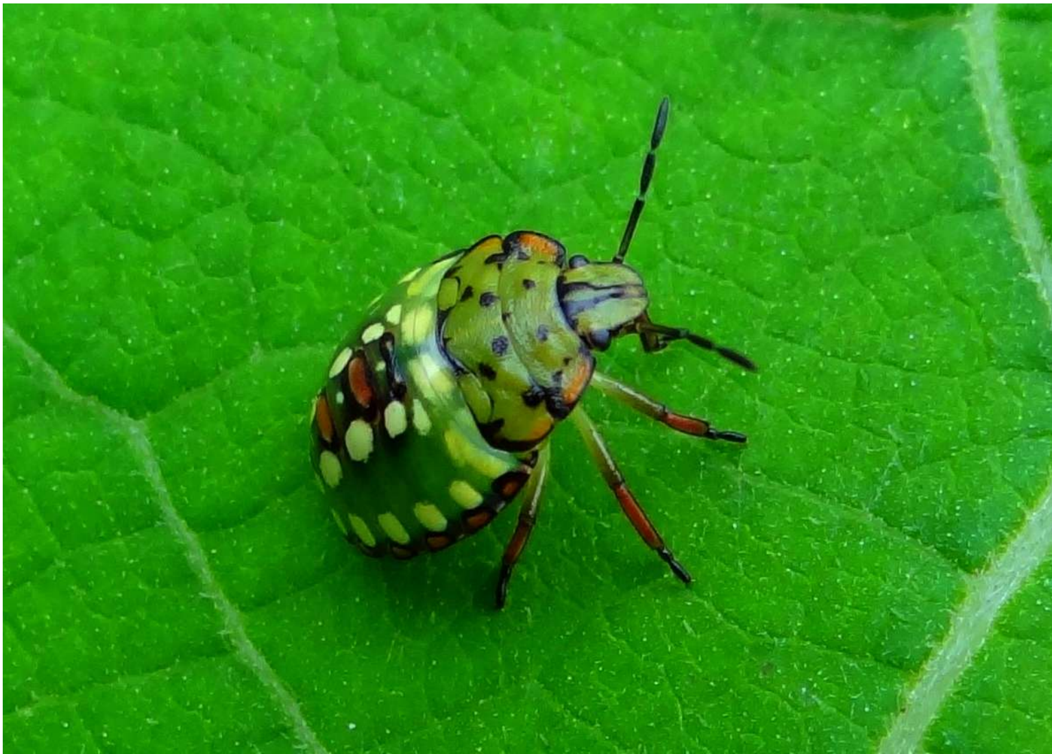
Nezara viridula - Juvénile - Punaise verte puante - Punaise verte ponctuée – Pentatomidae – (Lieu : Compost – 22.07.2016)