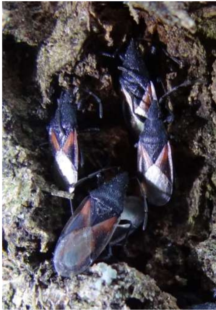
Oxycarenus lavaterae - punaises du tilleul – Lygaeidae (Lieu : Tilleuls situés entre la Place des Artisans et la Maison du barbier – 04.01.2015)