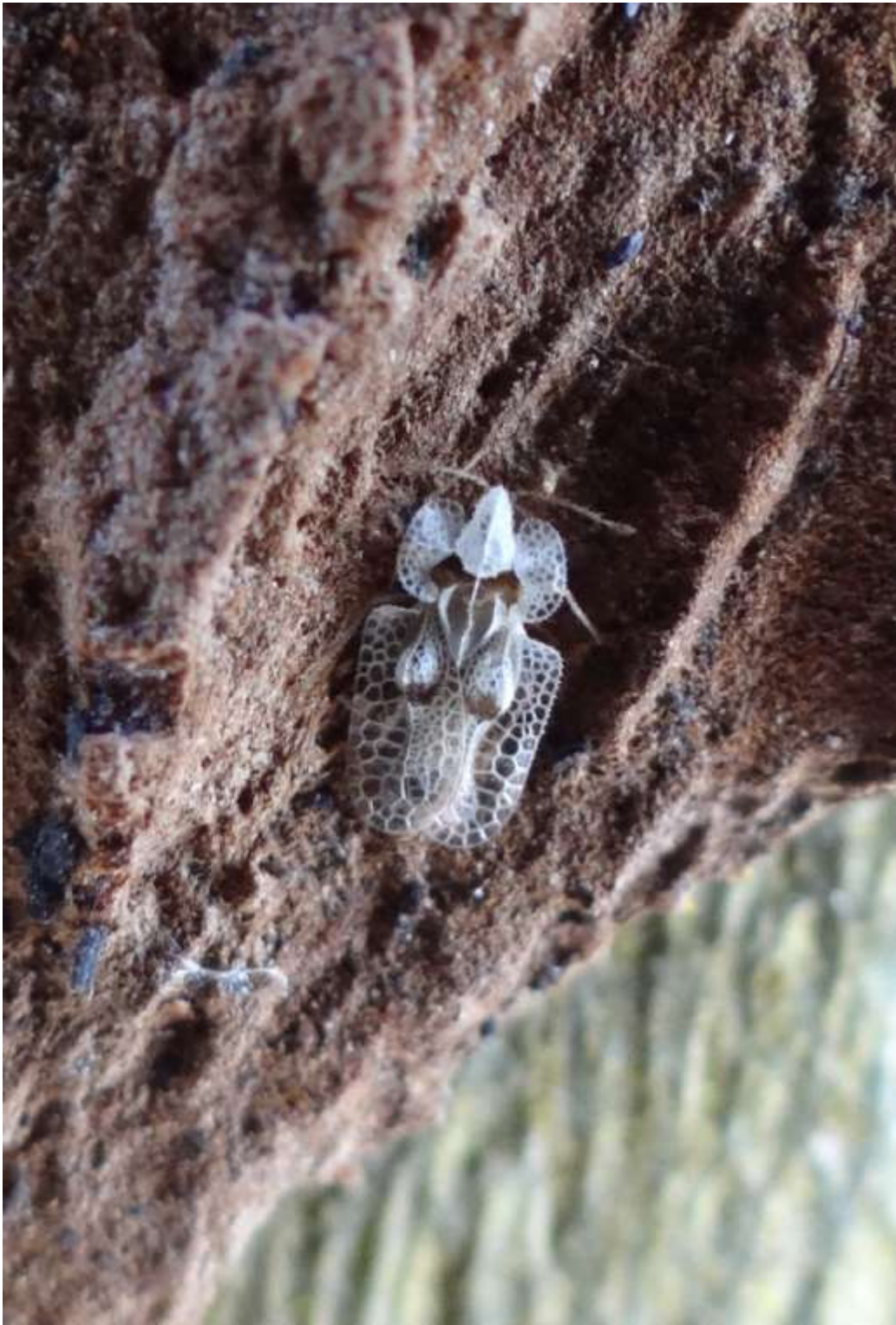
Corythucha ciliata - Le Tigre du platane (Tingidae)

(bordure chemin près du canal entre la Gare et la Tour Torony – 28.02.2015)