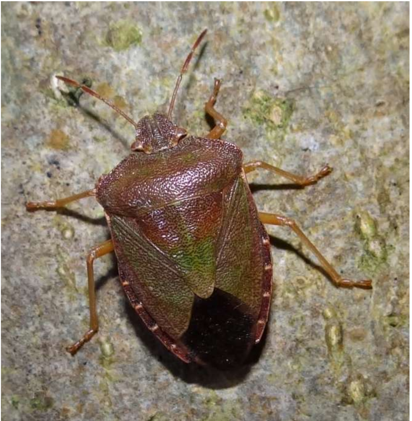
Palomena prasina - Punaise verte - (Ordre : Heteroptera – Famille : Pentatomidae)