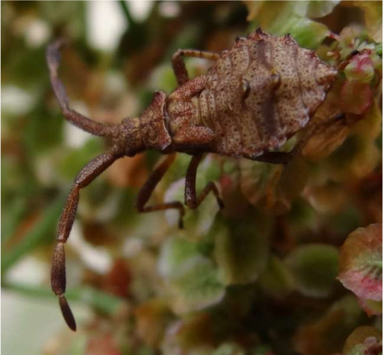
Coreus marginatus – la Corée marginée « punaise juvénile » - Coreidae

(lieu : Place derrière le Pavillon de Guebwiller - 06.07.2014)