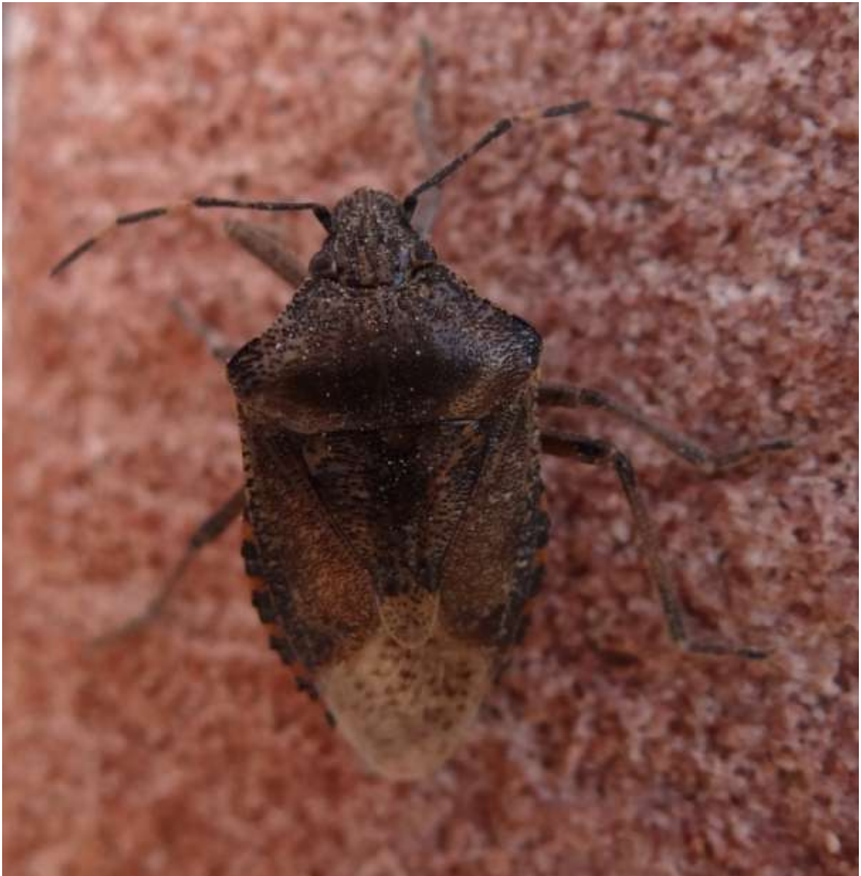
Rhaphigaster nebulosa Punaise nébuleuse – Pentatomidae (Lieu : La Gare – 14.04.2015)