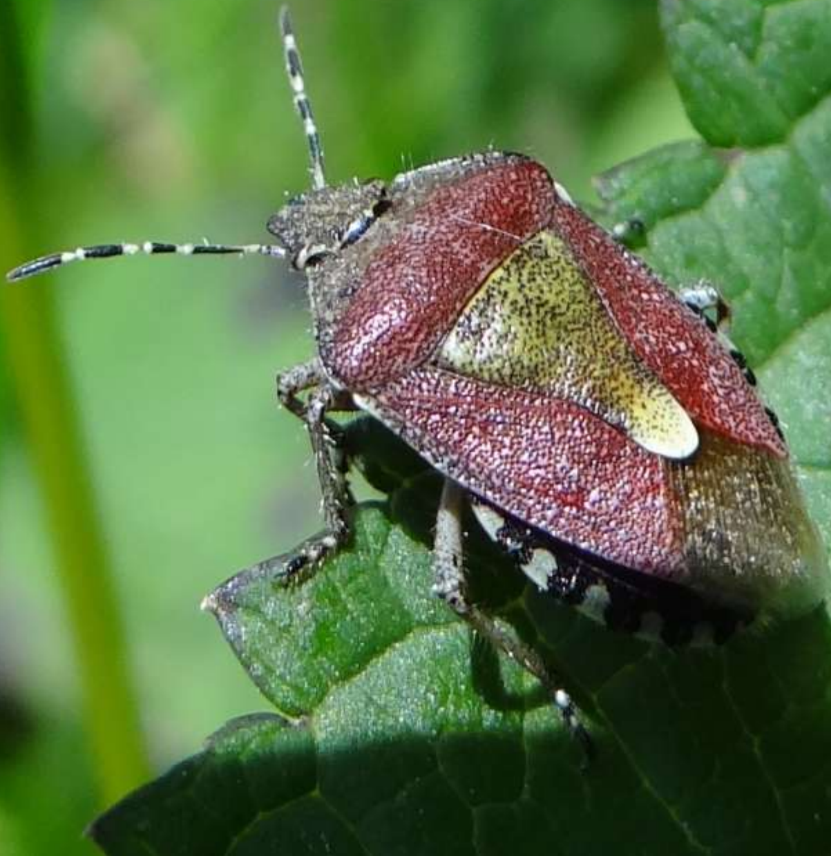
Dolycoris baccarum – La Punaise des baies – Pentatome des baies - Hemiptera – Pentatomidae

(lieu : à proximité du chemin de la Chapelle – 28.05.2015)