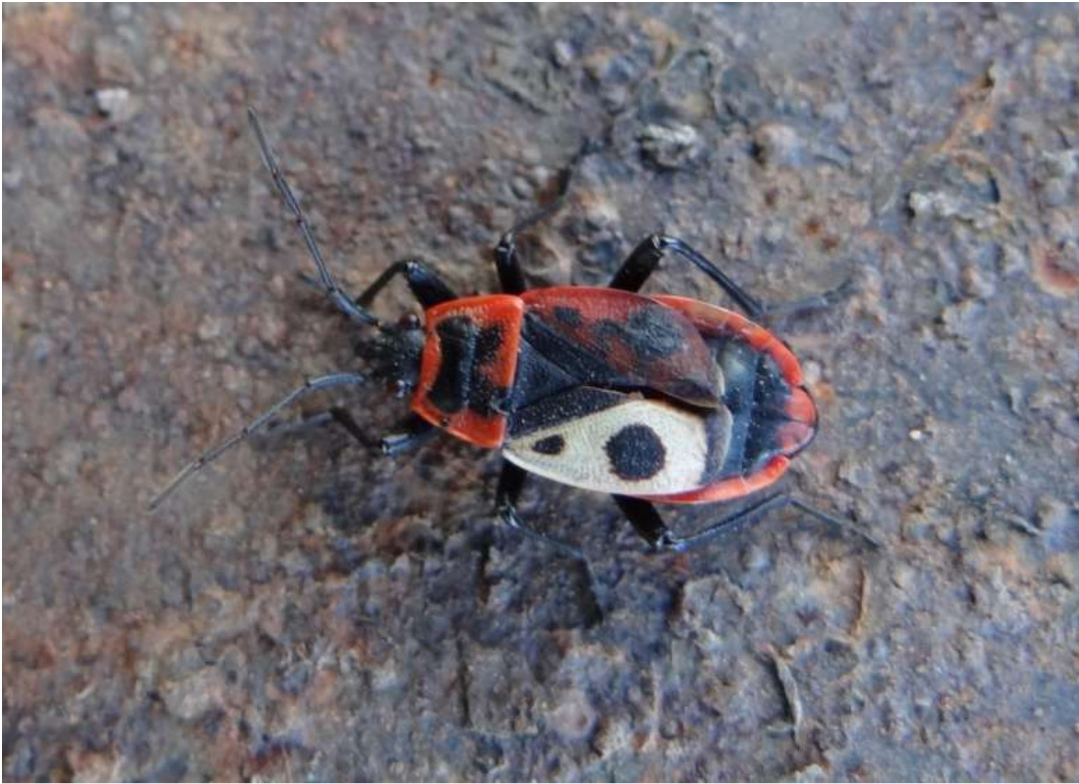
Pyrrhocoris apterus – Pyrrhocoridae – (Lieu : Compost – 20.03.2015)