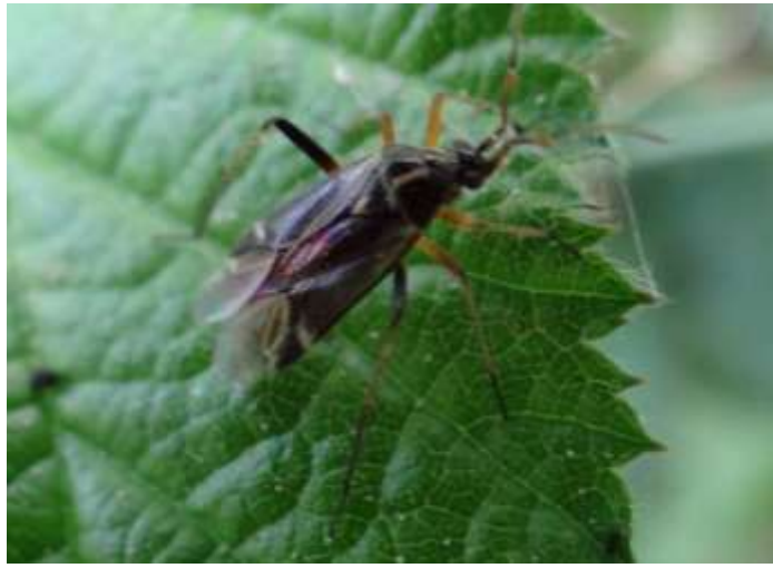
Harpocera thoracica mâle - Famille : Miridae - (lieu : arrière marais – 16.04.2014)