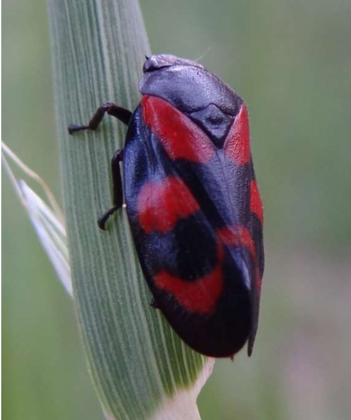
Cercopis vulnerata – Le Cercope sanguin - Homoptera – Cercopidae –