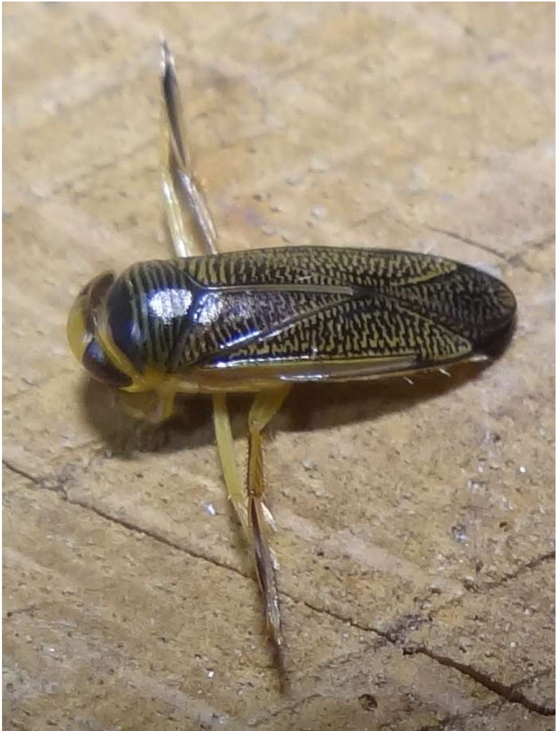
Sigara sp - femelle – Corixidae – (Lieu : Parking des bénévoles – 27.06.2015)