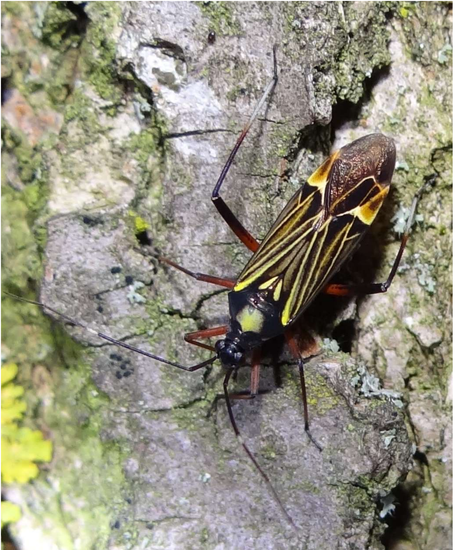
Miris striatus - Heteroptera – Miridae – (Lieu : environ Place des artisans – nuit du 16 au 17.05.2015)