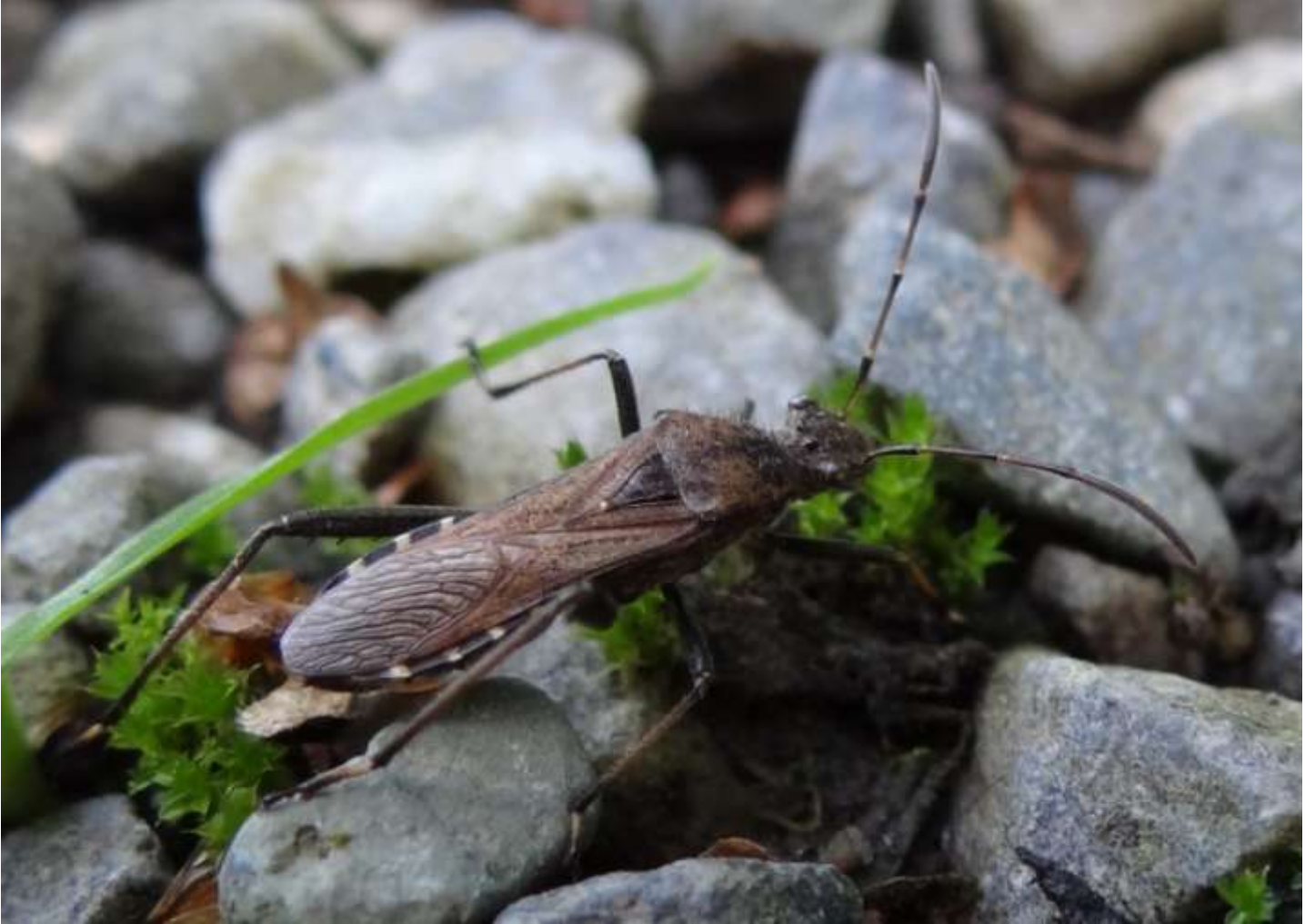
Alydus calcaratus - Alyde-fourmi - Alydidae