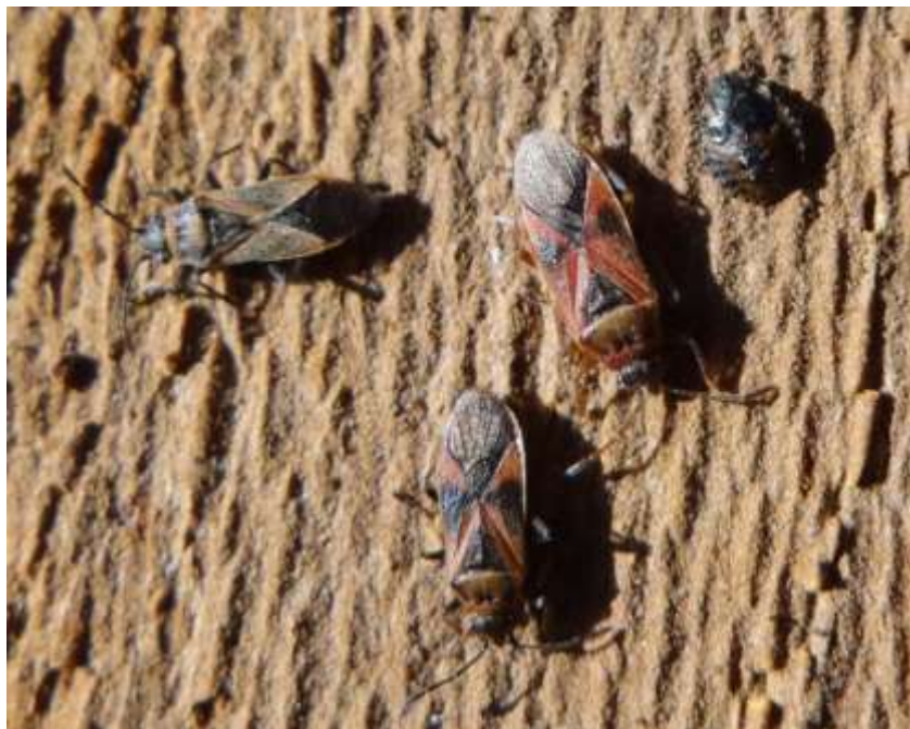
Arocatus longiceps – Punaise des platanes – Lygaeidae – (Lieu : à proximité du Labyrinthe « près du canal » – 19.02.2015)