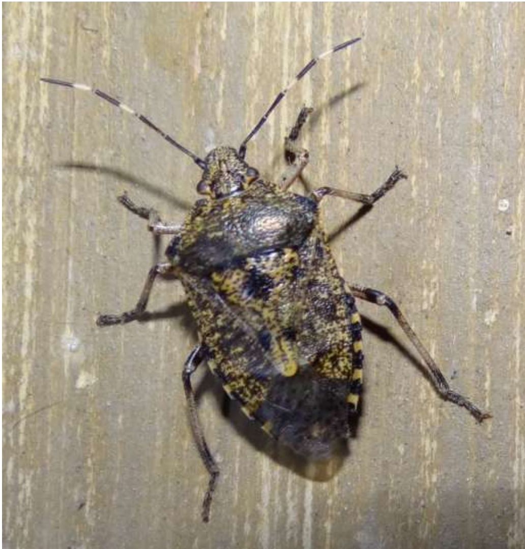
Rhapsigaster nebulosa – Punaise nébuleuse – Pentatomidae (lieu : La porcherie – 19.10.2014)