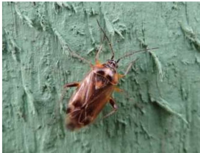
Harpocera thoracica femelle - Famille : Miridae (lieu : Russawag – 21.04.2014)