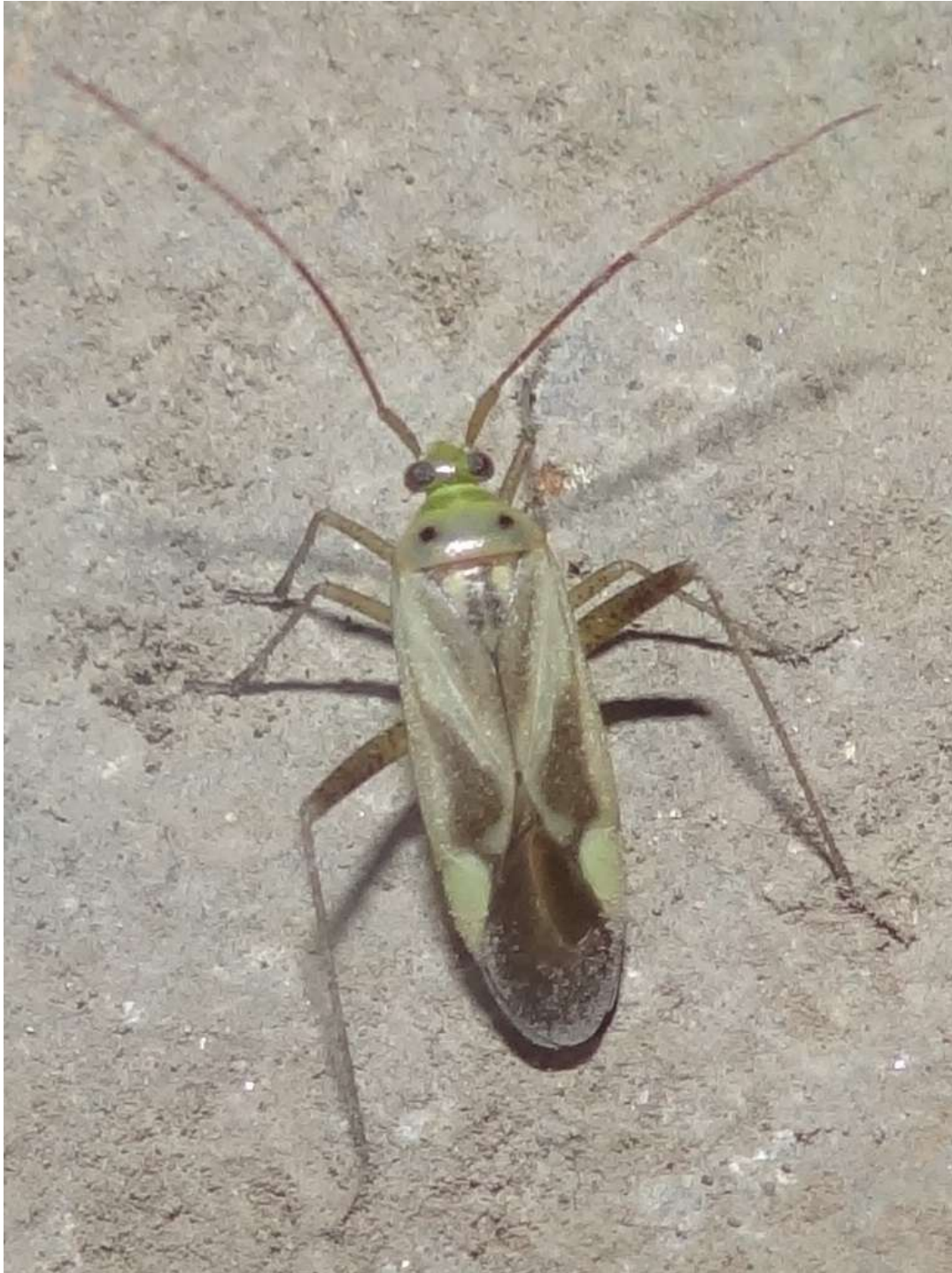
Adelphocoris lineolatus – Capside de la luzerne – Capside des légumineuses – Miridae –

(Lieu : parking des bénévoles – 27.06.2015)