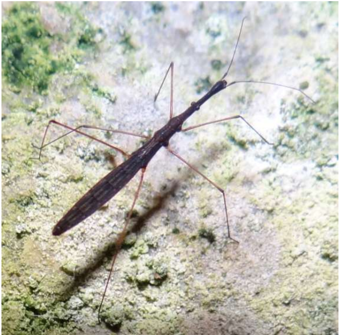
Hydrometra stagnorum - Hydromètre stagnant - Hydromètre des étangs - Punaise aiguille (Hydrometridae)

(lieu : Grotte de la cascade – 02.11.2014)