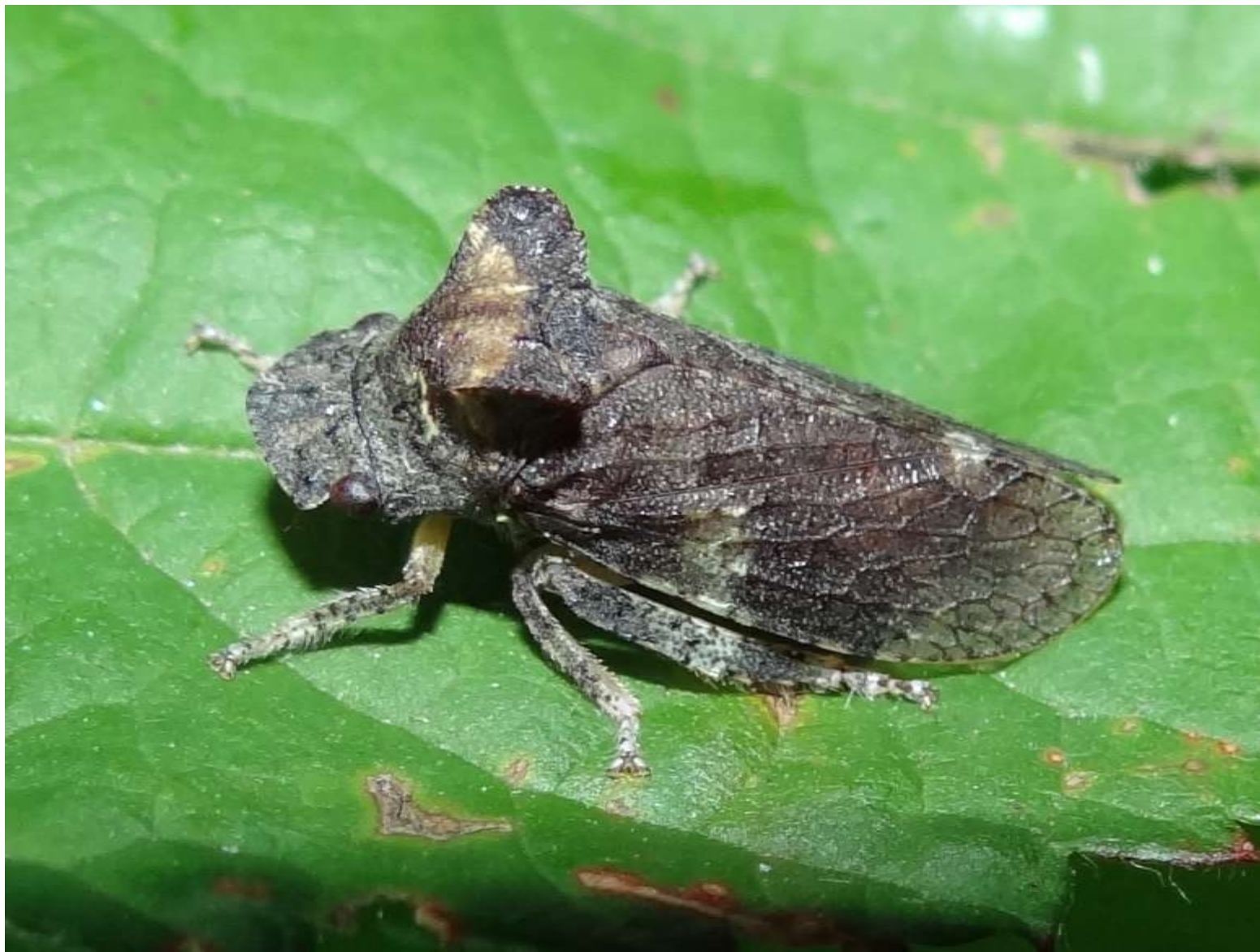
Ledra aurita - le Grand Diable – Cicadellidae - (Lieu : à côté du Pavillon de Guebwiller – 02.08.2015)