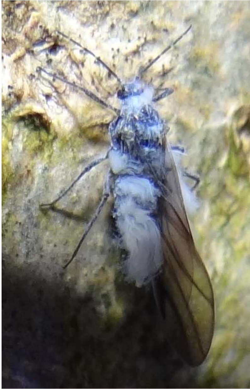
Phyllaphis fagi - le Puceron des feuilles de Hêtre – Aphididae

(lieu : à l'arrière du marais – 02.11.2014)