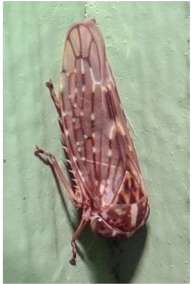
Idiocerus herrichii – Cicadellidae (lieu : à proximité du Pavillon de Guebwiller – 29.11.2014)