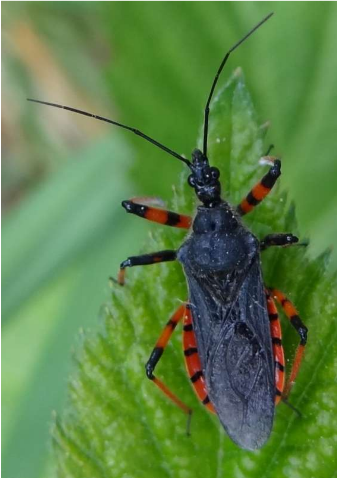
Rhynocoris annulatus - La Réduve annelée - Heteroptera – Reduviidae