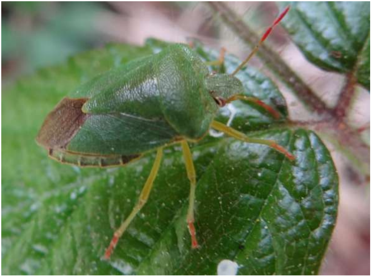
Palomena prasina - Punaise verte - (Ordre : Heteroptera – Famille : Pentatomidae)