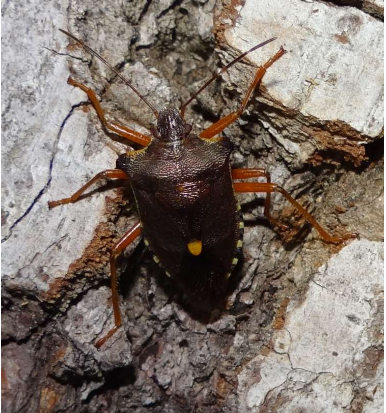
Pentatoma rufipes - Punaise à pattes rouges - Punaise des bois – Pentatomidae (Lieu : à proximité de la Chapelle – Nuit du 29 au 30.07.2016)