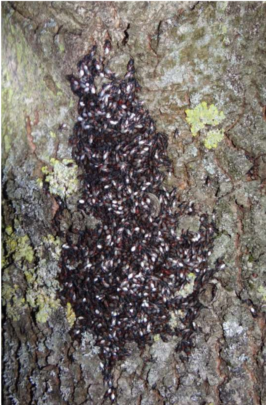
Oxycarenus lavaterae - punaises du tilleul – Lygaeidae (Lieu : Tilleuls situés entre la Place des Artisans et la Maison du barbier – 04.01.2015)