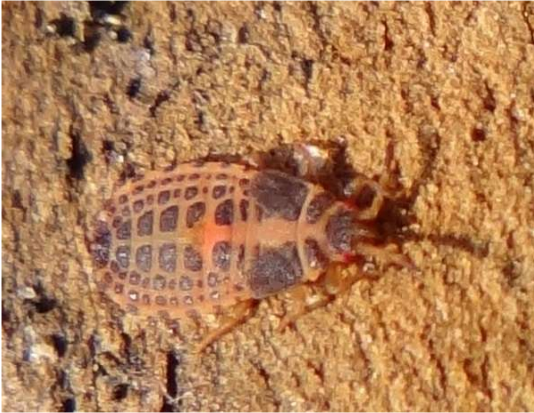
Aneurus avenius - Heteroptera - Aradidae (Larve au dernier stade)

(Lieu : forêt à proximité du Pavillon de chasse – 19.02.2015)