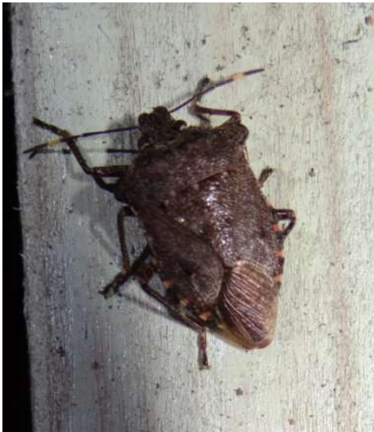
Troilus luridus – Famille : Pentatomidae (lieu : arrière du marais – 22.11.2014)