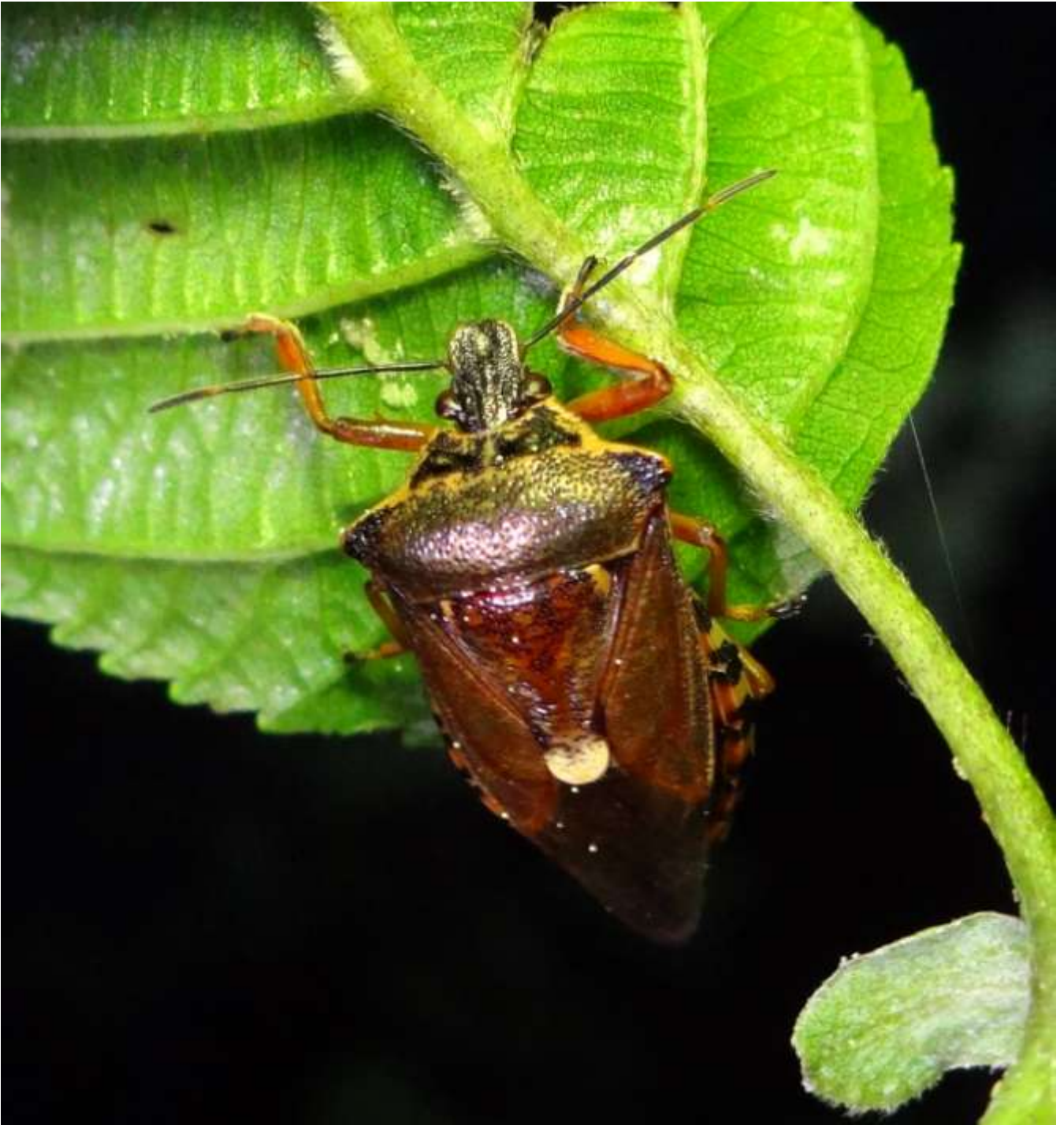
Pinthaeus sanguinipes – Pentatomidae (Lieu : Arrière marais « Grosswald » - 15.05.2016)