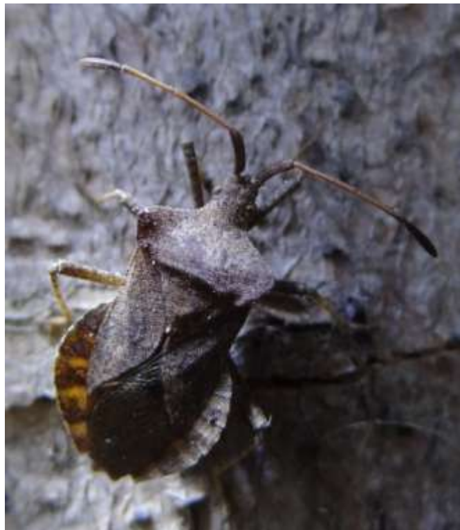
Coreus marginatus – la Corée marginée - Coreidae (lieu : secteur Maison du charbonnier - 10.04.2015)