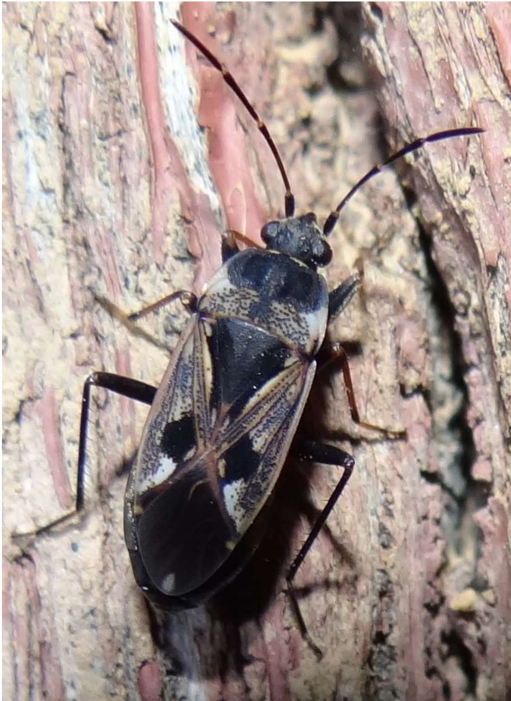
Rhyparochromus vulgaris – Lygaeidae (lieu : Maison de Kuenheim – 02.11.2014)