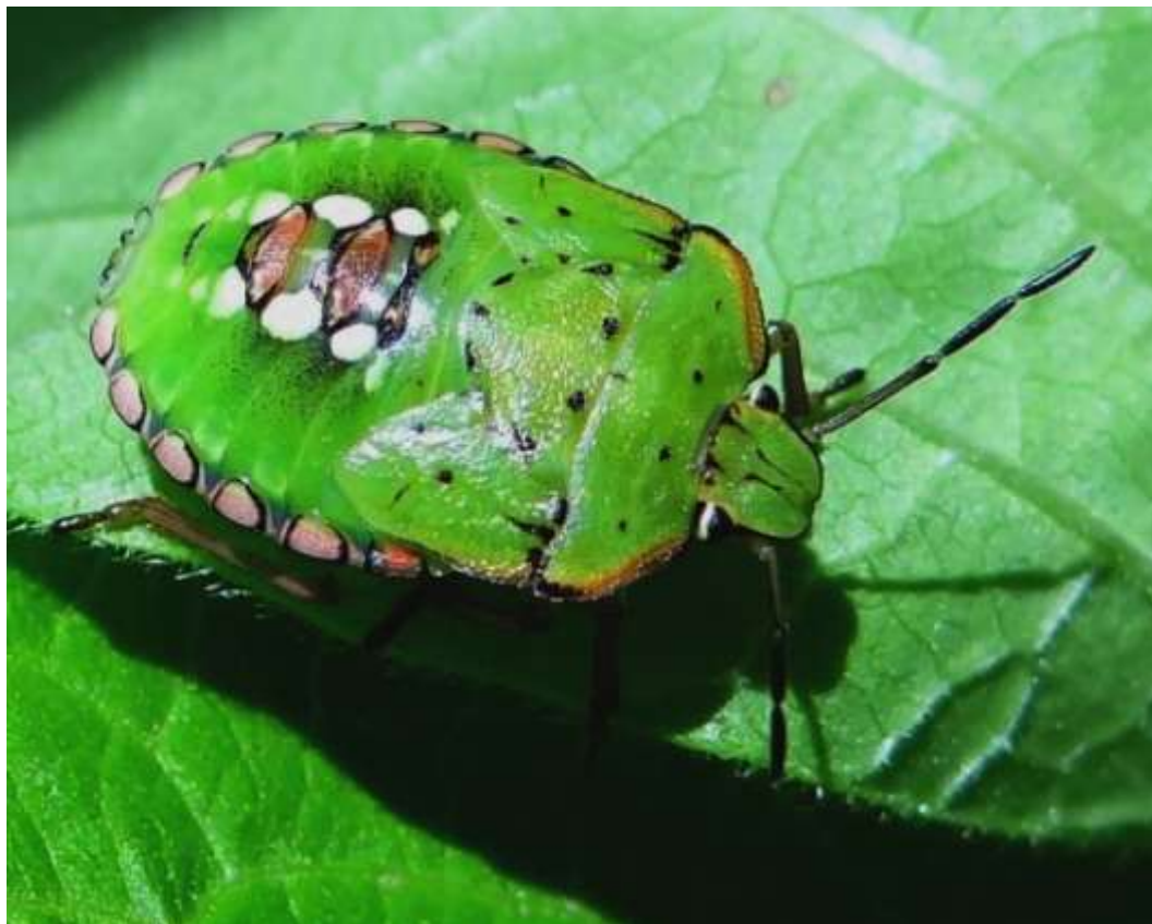
Nezara viridula « au dernier stade larvaire, juste avant la mue imaginale » Punaise verte puante - Punaise verte ponctuée – Pentatomidae – (Lieu : Jardin entre la Place des charpentiers et le Pavillon de Ribeauvillé – 11.09.2015)