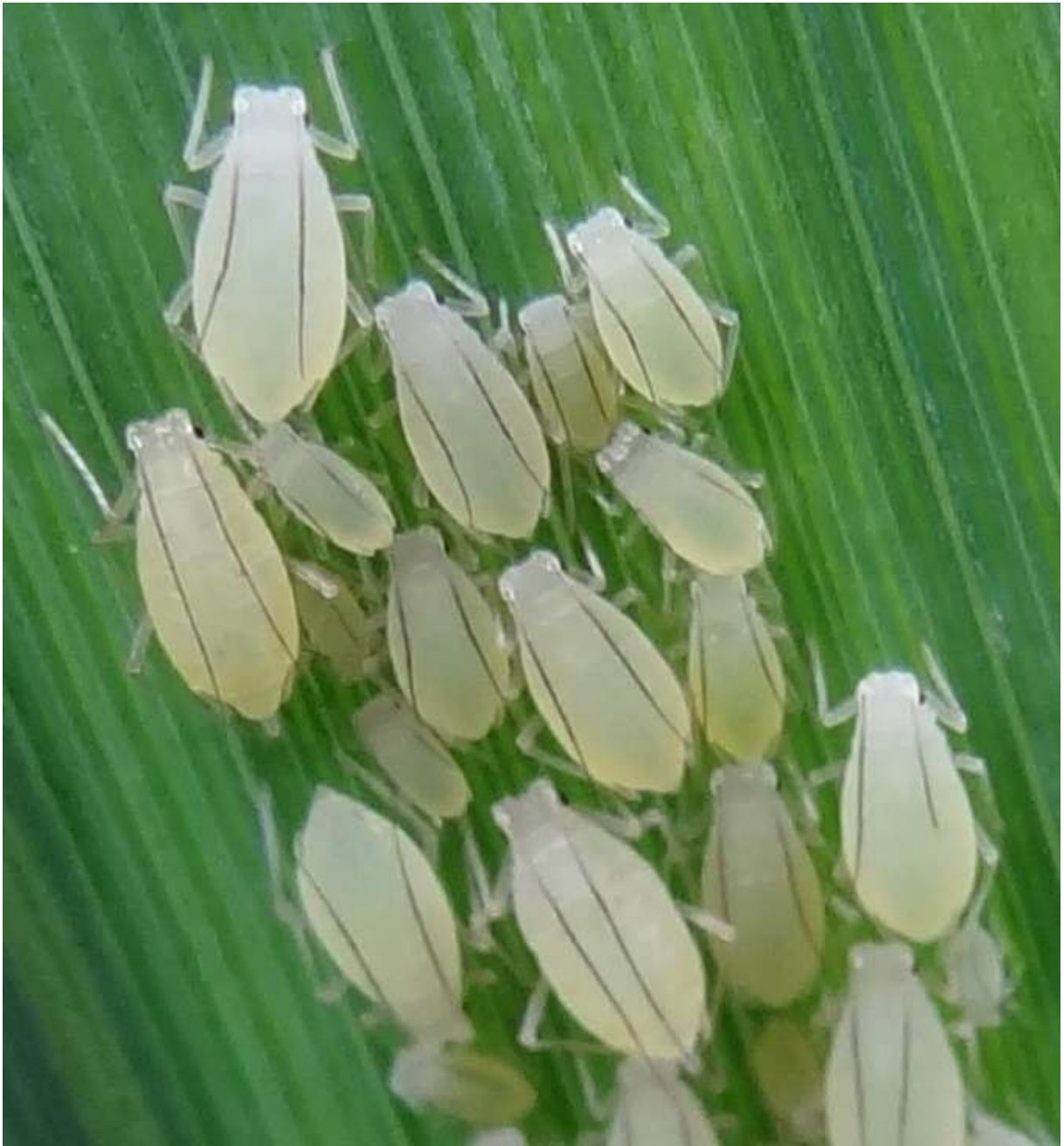
Rhopalomyzus lonicerae – Aphididae – (Lieu : aux alentours de la Tour Torony – 16.06.2015)

Les pucerons passent l'hiver en tant qu'œufs sur un hôte primaire, le chèvrefeuille. Puis vers le mois de juin, ils migrent sur une plante hôte secondaire, Phalaris arundinacea (Alpiste roseau).