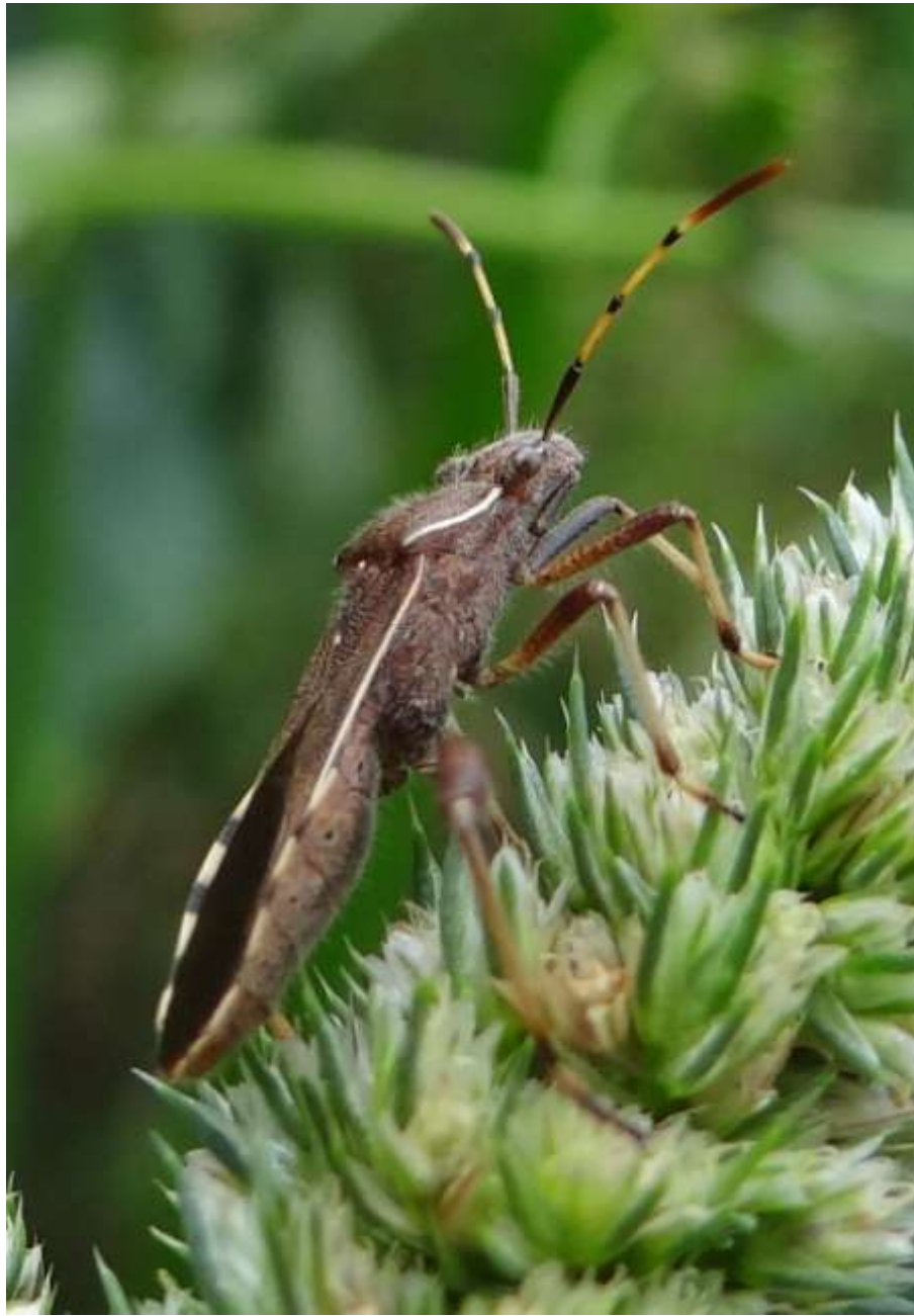
Camptopus lateralis (Germar 1817) – Alydidae

(lieu : Place derrière la Maison de Guebwiller – 06.07.2014)