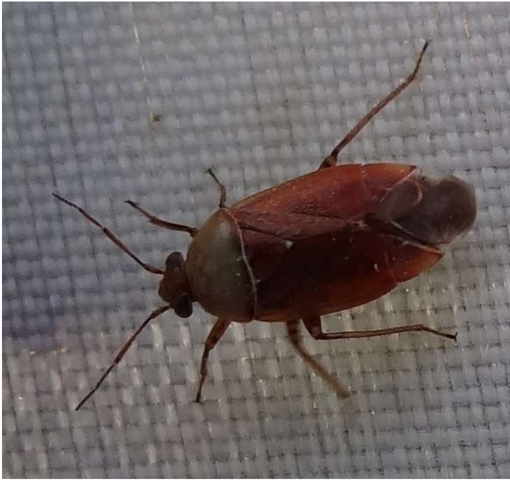
Agnocoris sp - Miridae

(Lieu : dans les arbres au bord de l'eau à proximité de la Maison du Pêcheur – 05.04.2015)