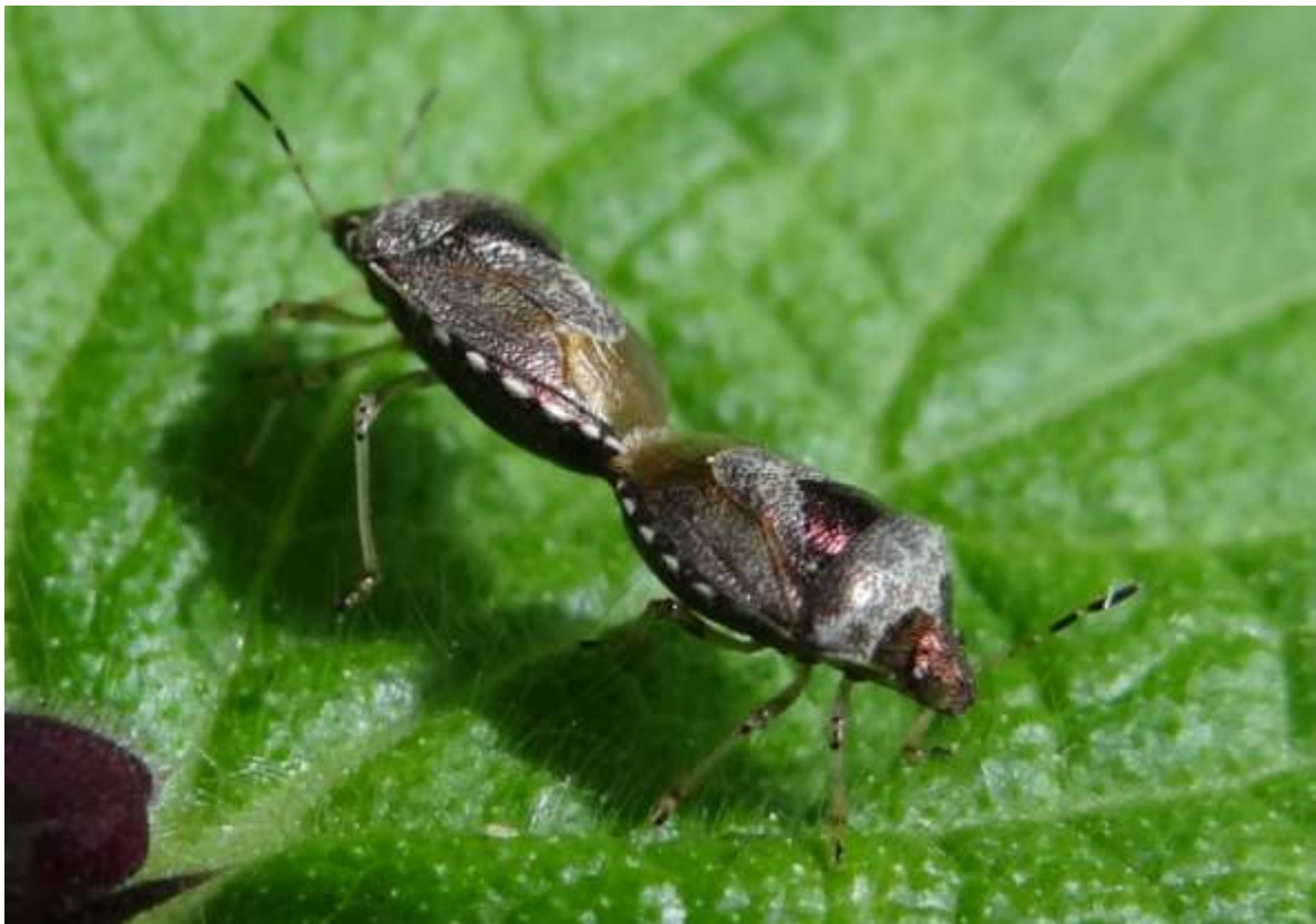
Eysarcoris venustissimus – Pentatomidae – (lieu : à proximité de La Chapelle – 21.05.2014)