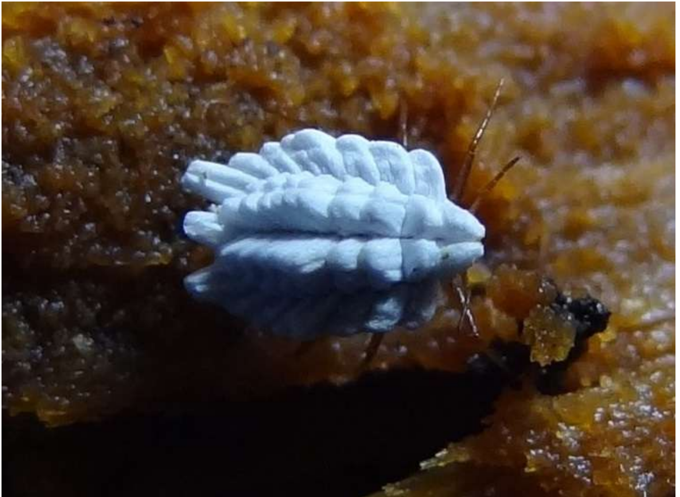
Orthezia urticae - Orthésie de l'ortie - Ortheziidae – Hemiptera (Lieu : arrière marais -

Le nom du genre a été formé du nom de l'abbé d'Orthez qui a découvert et observé cet insecte. Cette cochenille (3 mm) est recouverte de cire d'un blanc pur. La femelle a des plaques cireuses très longues à son extrémité qui forment un ovisac : l'abbé d'Orthez le nommant "berceau".