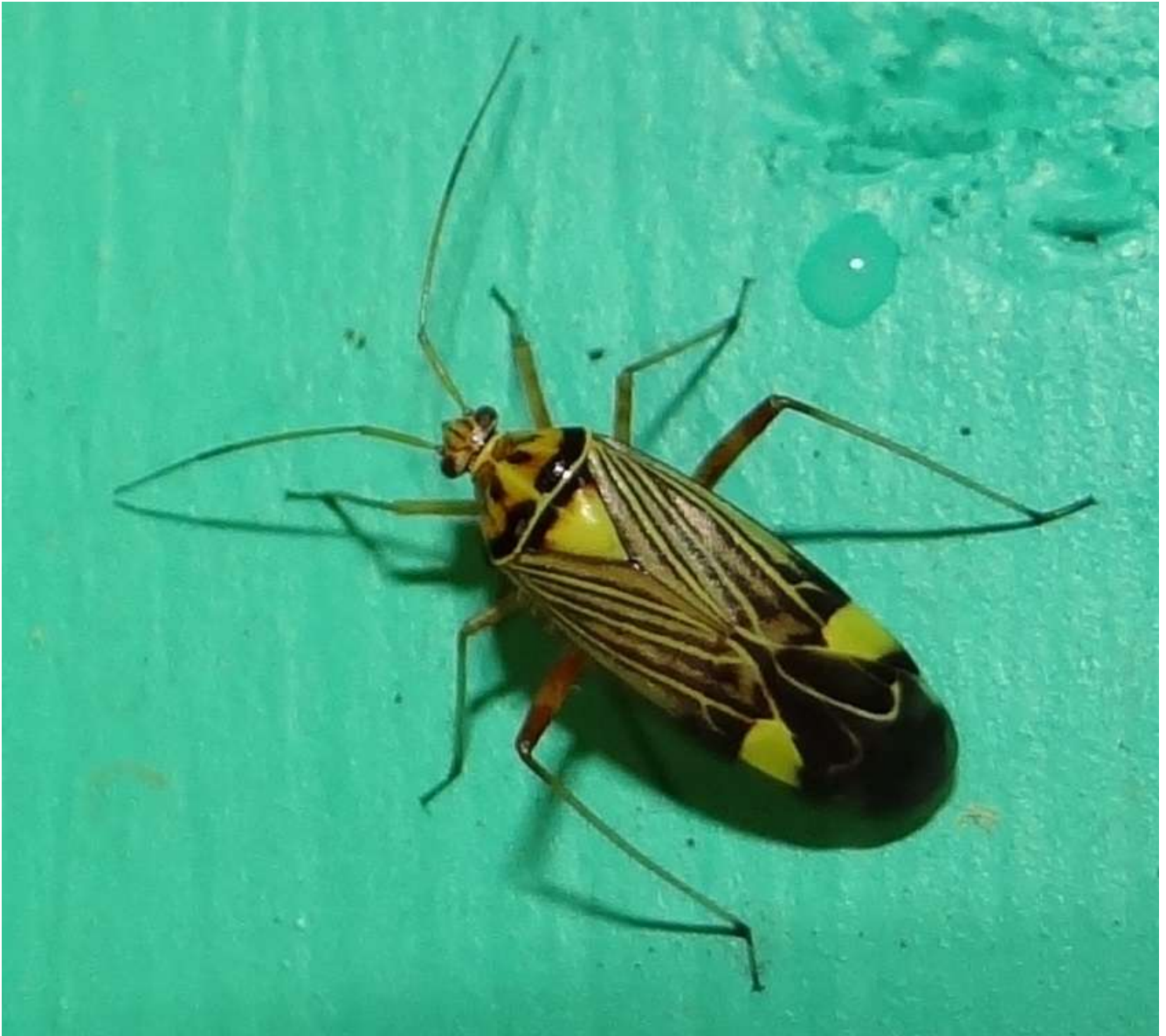
Rhabdomiris striatellus – Punaise des Chênes – Famille Miridae