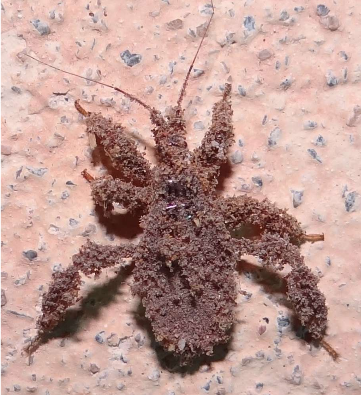
Reduvius personatus – larve de punaise : le Réduve masqué – Reduviidae