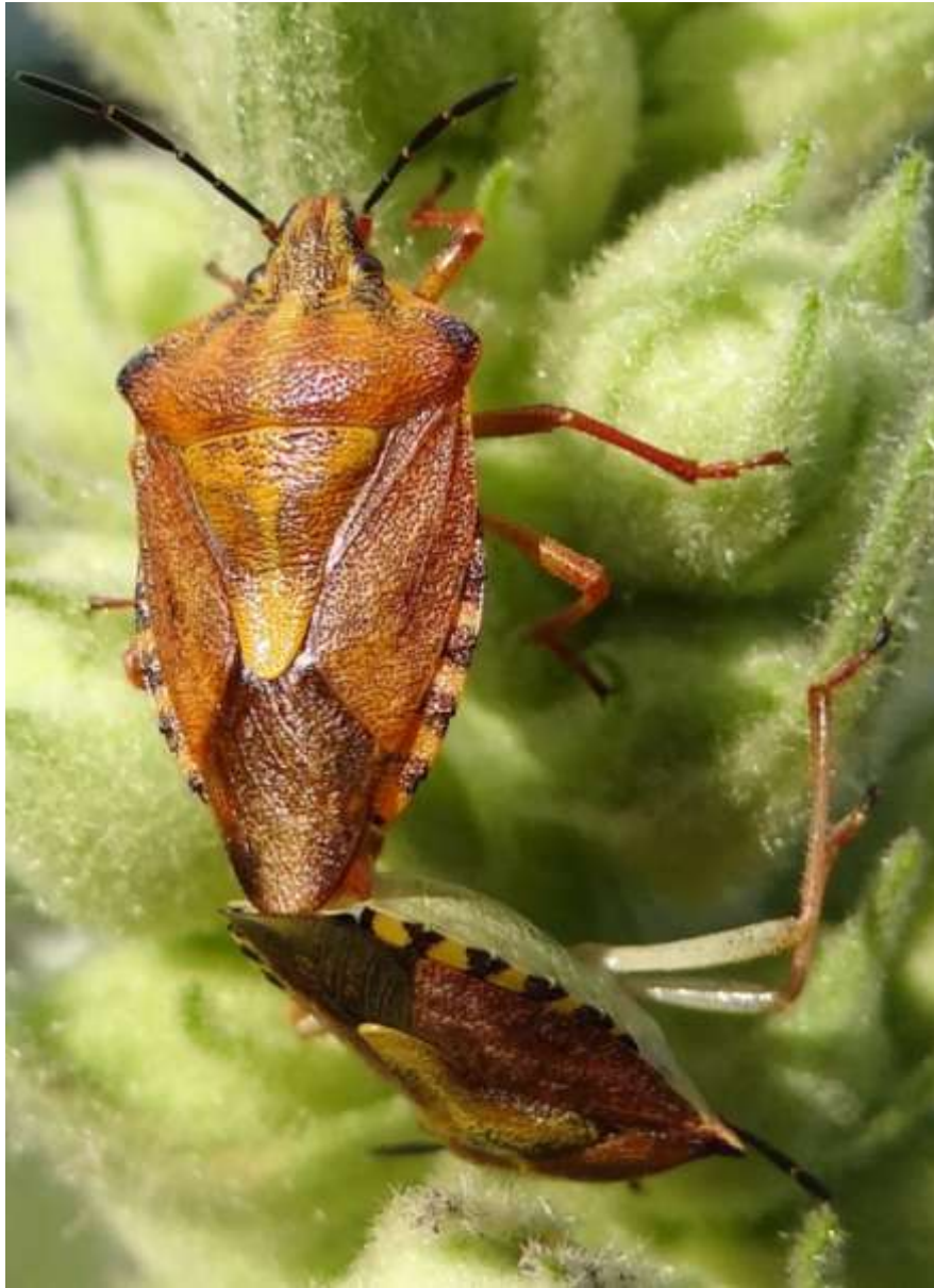
Carpocoris purpureipennis – Punaise à pattes rouges – Pentatomidae