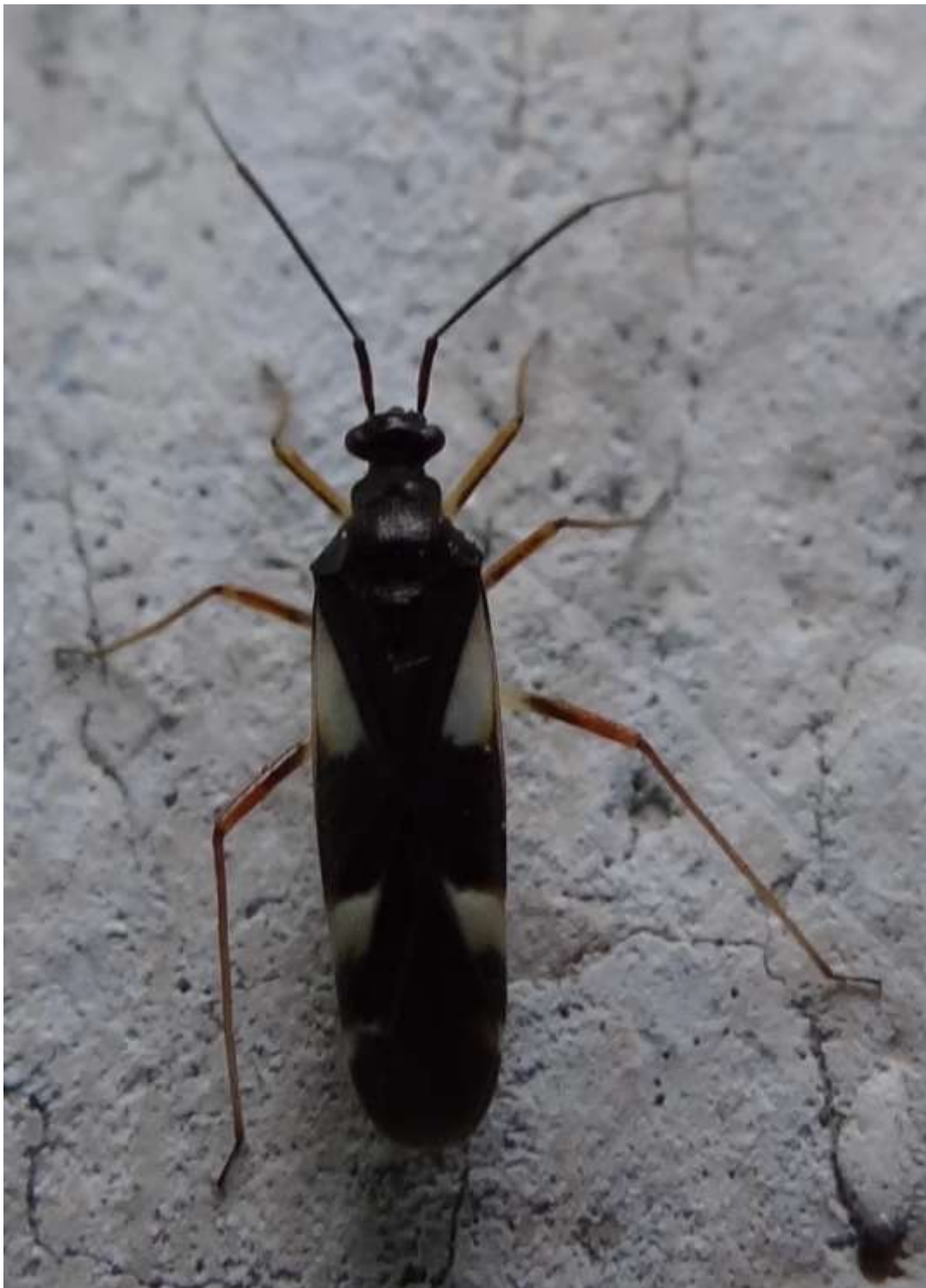
Dryophilocoris flavoquadrimaculatus - Heteroptera – Miridae -

(Lieu : Pavillon de Ribeauvillé – 01.05.2015)