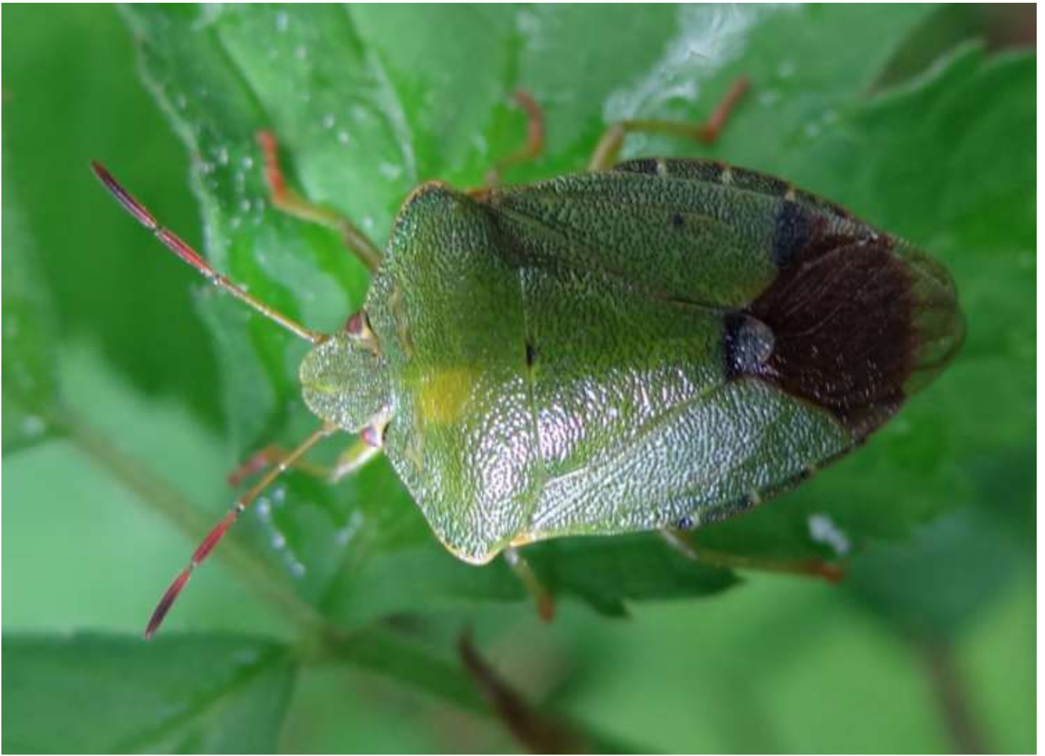
Palomena prasina - Punaise verte - (Ordre : Heteroptera – Famille : Pentatomidae)