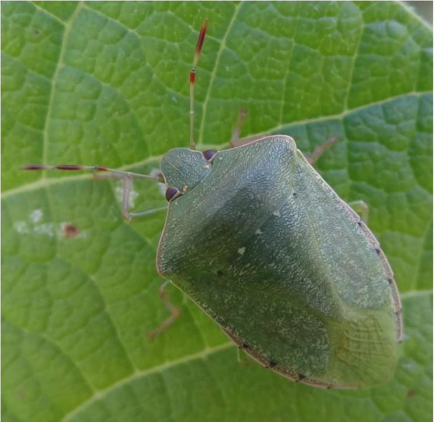
Nezara viridula - Imago

Punaise verte puante - Punaise verte ponctuée – Pentatomidae –