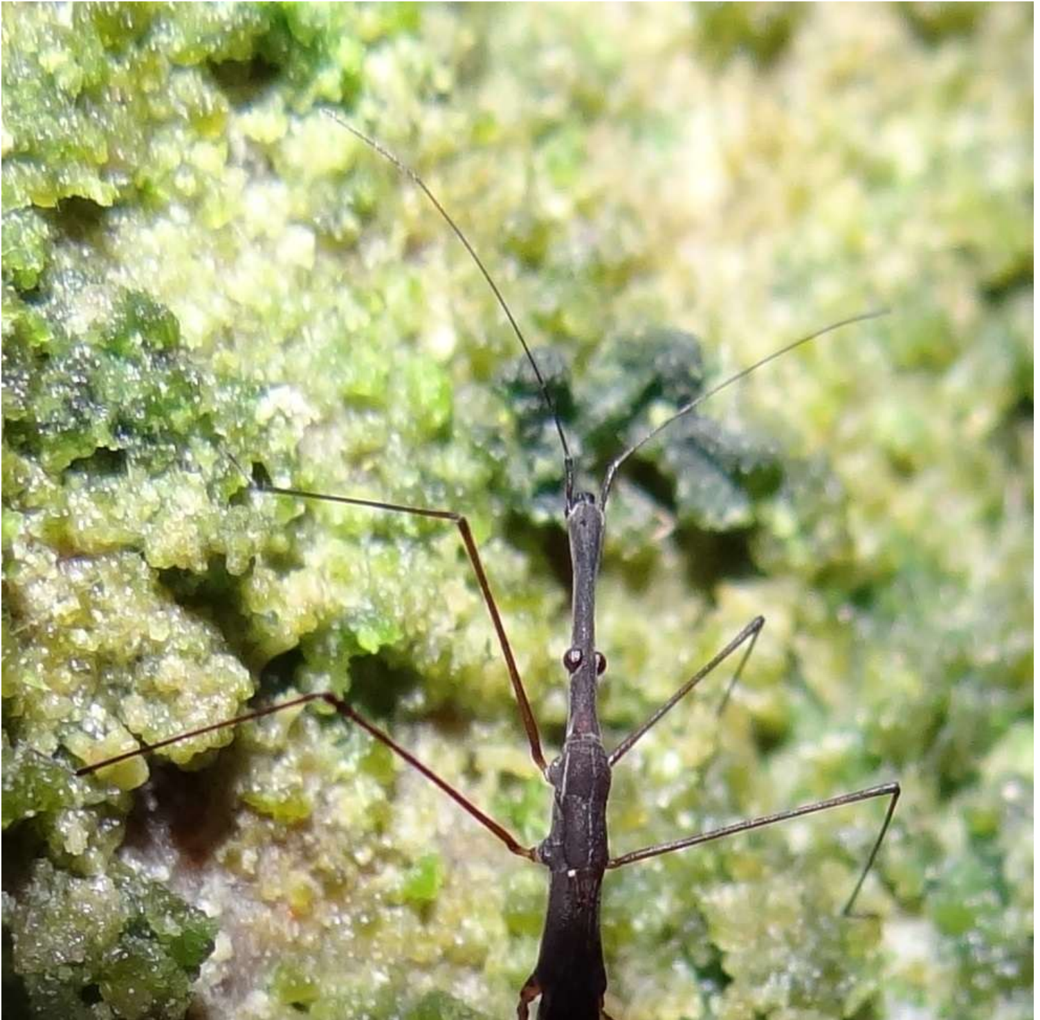
Hydrometra stagnorum - Hydromètre stagnant - Hydromètre des étangs - Punaise aiguille (Hydrometridae)

(lieu : Grotte de la cascade – 19.11.2014)