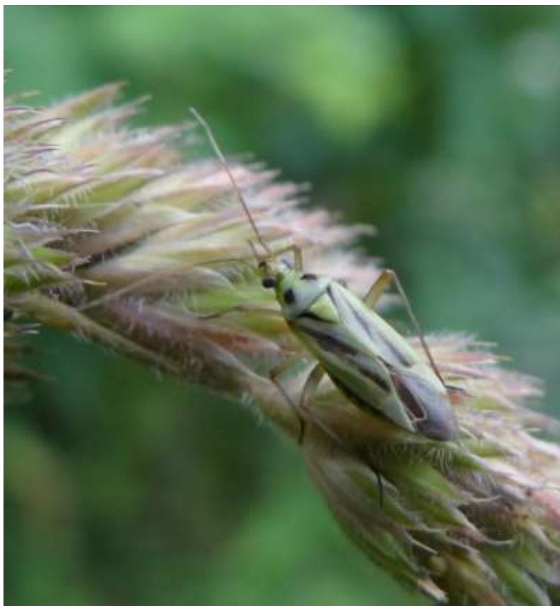
Stenotus binotatus – Miridae - (Lieu : Compost – 16.06.2015)