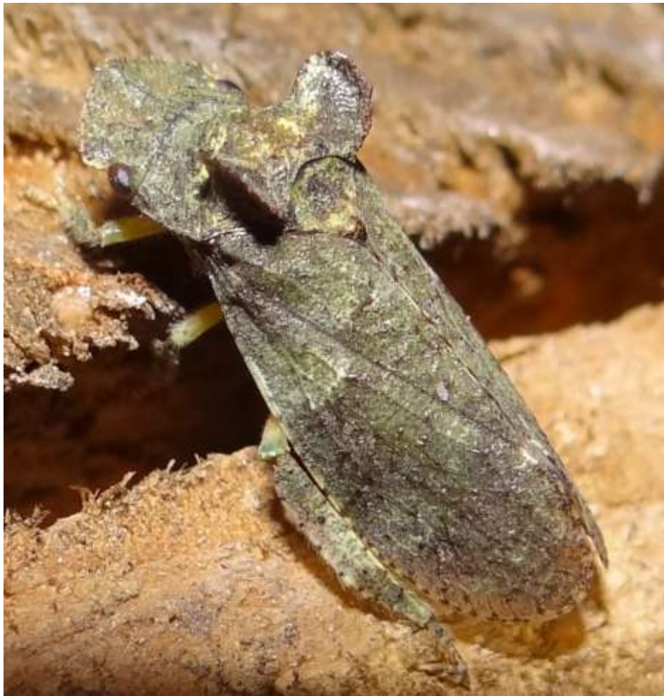
Ledra aurita - le Grand Diable – Cicadellidae (lieu : Place du Manège – 17.07.2014)