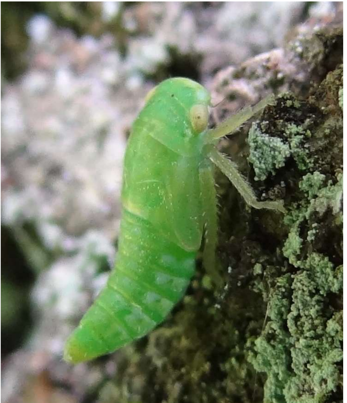
Nymphe de la famille des Cicadellidae