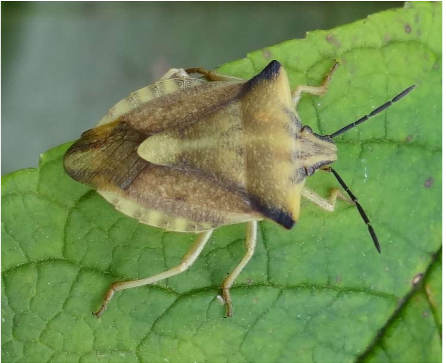
Carpocoris fuscispinus – Punaise des fruits à pointes sombres - Pentatomidae