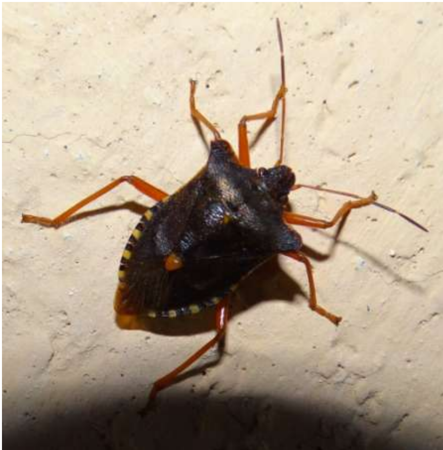
Pentatoma rufipes - Punaise à pattes rouges - Punaise des bois – Pentatomidae (lieu : La Taverne - 30.08.2014)