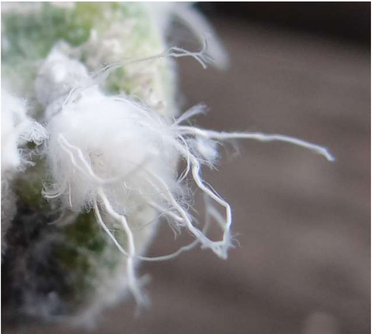
Prociphilus xylostei xylostei – Puceron laineux du Chèvrefeuille – Aphididae

(photographie réalisée lors de l'animation nature au Pavillon de Guebwiller le 1 er juin 2014)