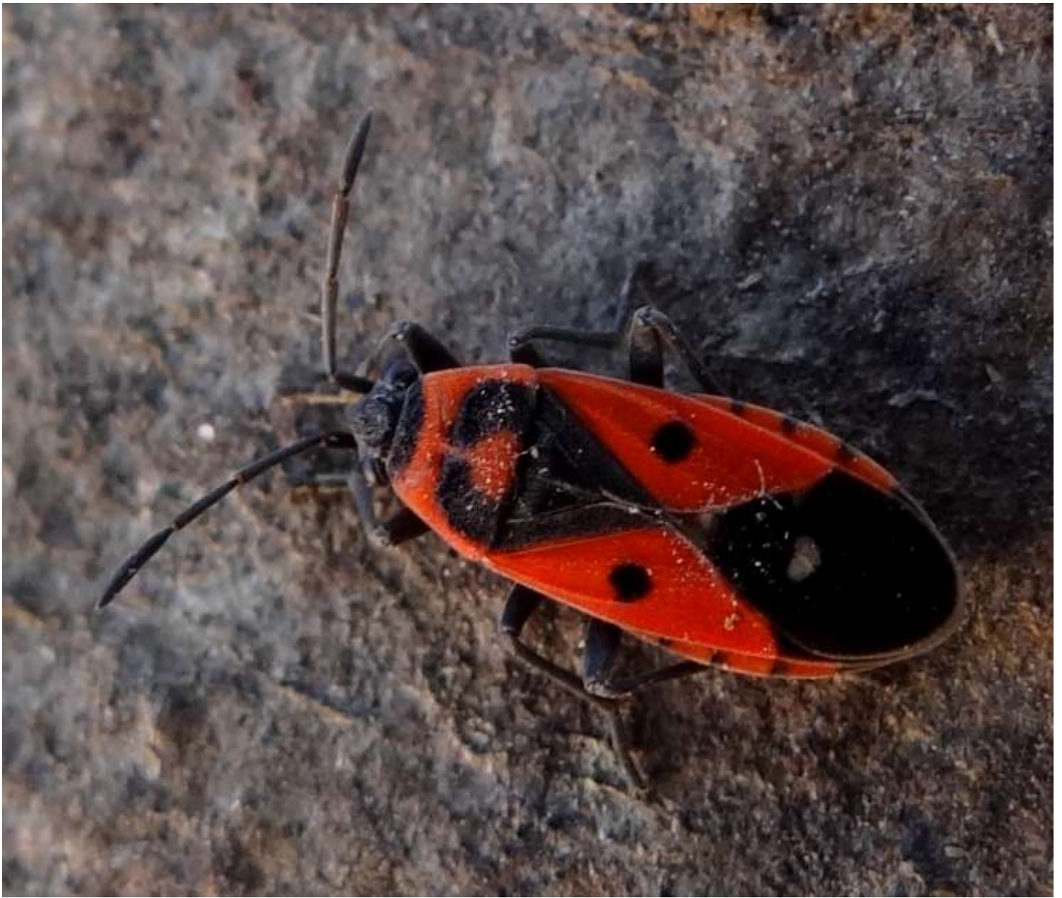
Melanocoryphus albomaculatus – Hemiptera – Lygaeidae – (Lieu : La Taverne – 26.11.2016)