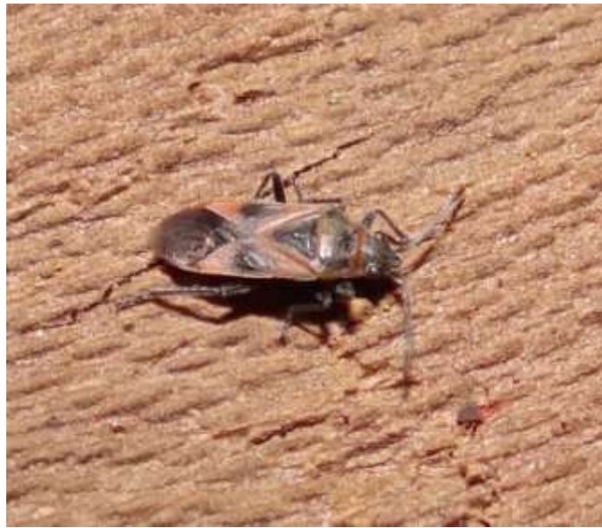
Arocatus longiceps – Punaise des platanes – Lygaeidae – (Lieu : Place intersection Grand'Rue / Rue du Repos – 04.01.2015)