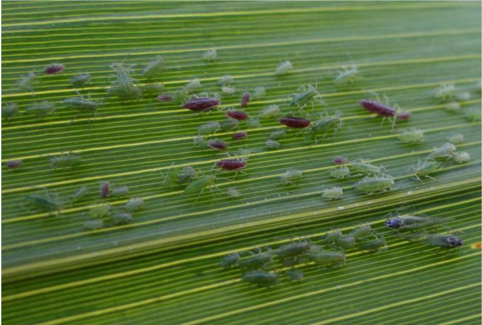
Hyalopterus pruni - Puceron farineux du prunier - Aphididae

Espèce diécique : l'hôte primaire sur lequel sont pondus les œufs en hiver est en général un arbre, le prunier, l'Épine noire et l'hôte d'été, dit secondaire est souvent une plante, ici le Roseau commun ( Phragmites australis ) – « Texte : Paule EHRHARDT »