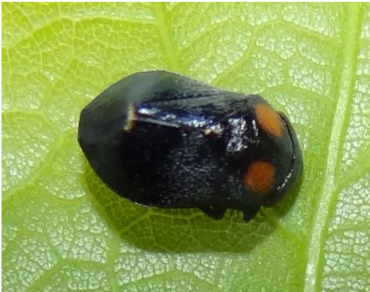
Penthimia nigra - Homoptera – Cicadellidae - (Lieu : Pré de scouts – 29.04.2015)