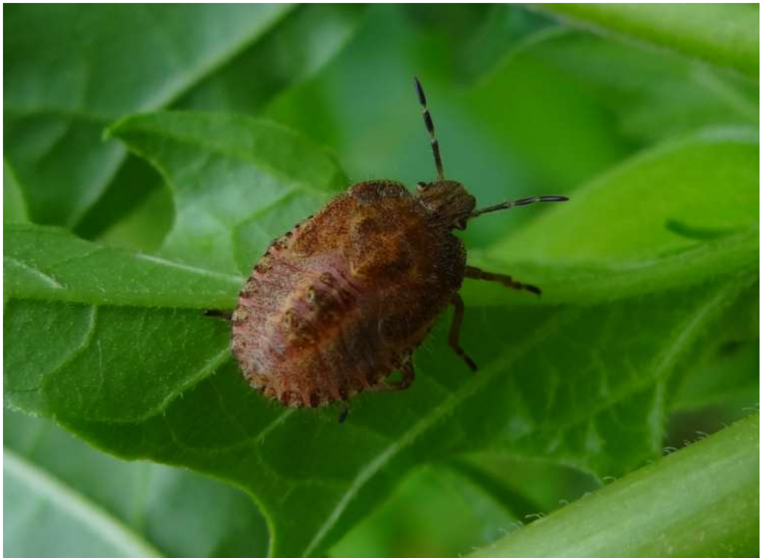
Dolycoris baccarum juvénile – La Punaise des baies – Pentatome des baies - Hemiptera – Pentatomidae - (lieu : Compost – 22.07.2016)