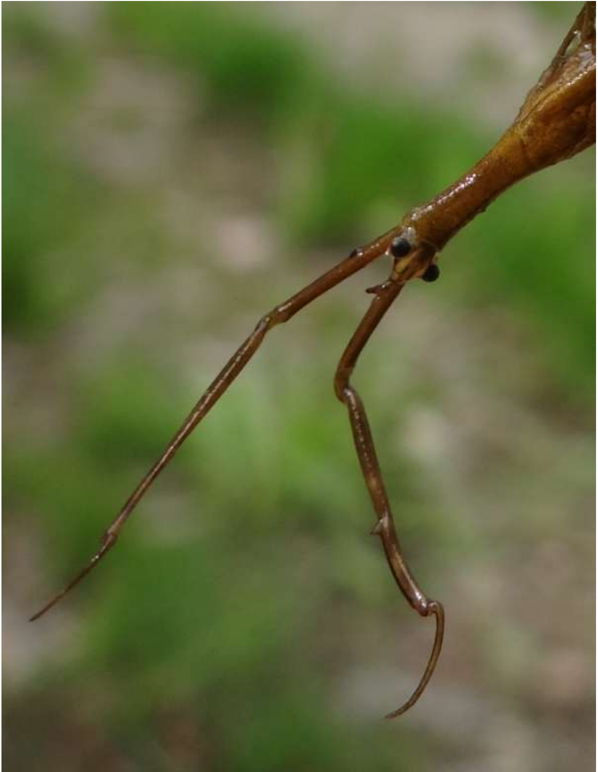
Ranatra linearis - la Ranâtre - Nepidae

(lieu : Atelier nature Maison de Guebwiller – 27.07.2014)