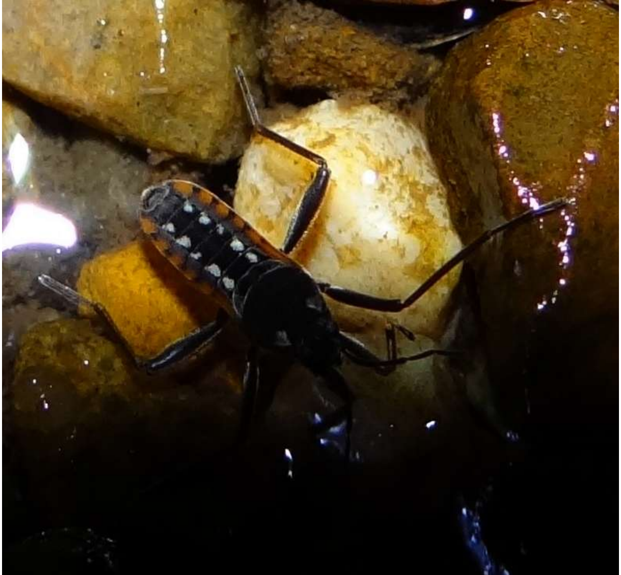
Velia caprai - La Velie jaune - Hemiptera – Veliidae (Lieu : Fontaine à côté du Pont du 1er mai - 25.01.2016)