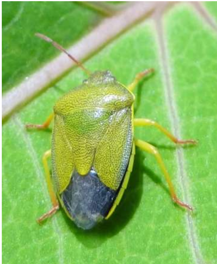
Piezodorus lituratus – Punaise des genêts – La Punaise ponctuée - Heteroptera – Pentatomidae (Lieu : à proximité de la Maison de Kunheim – 28.05.2015)