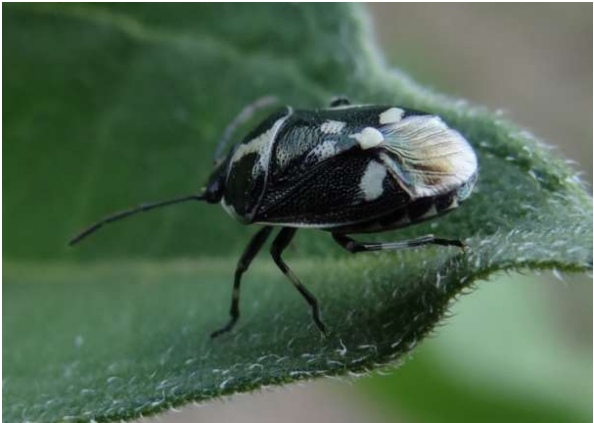
Eurydema oleracea – Punaise potagère – Pentatomidae (lieu : Champs du Belli – 18.06.2014)