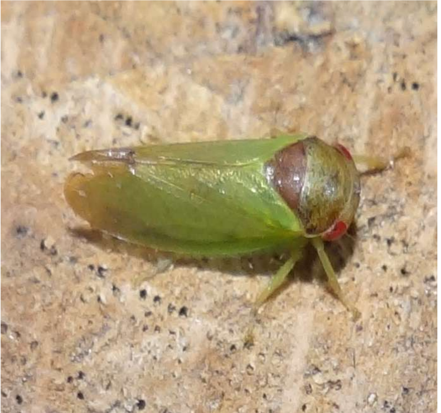
Iassus lanio – La Cicadelle du Chêne - Cicadellidae – (Lieu : Parking des bénévoles – 27.06.2015)