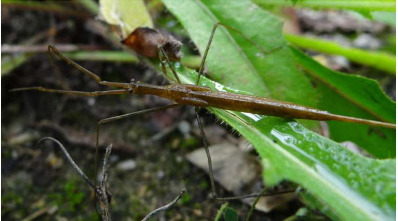
Ranatra linearis - la Ranâtre - Nepidae

(Hémiptère carnassier également appelé punaise d'eau, ranâtre linéaire ou scorpion d'eau à aiguille)