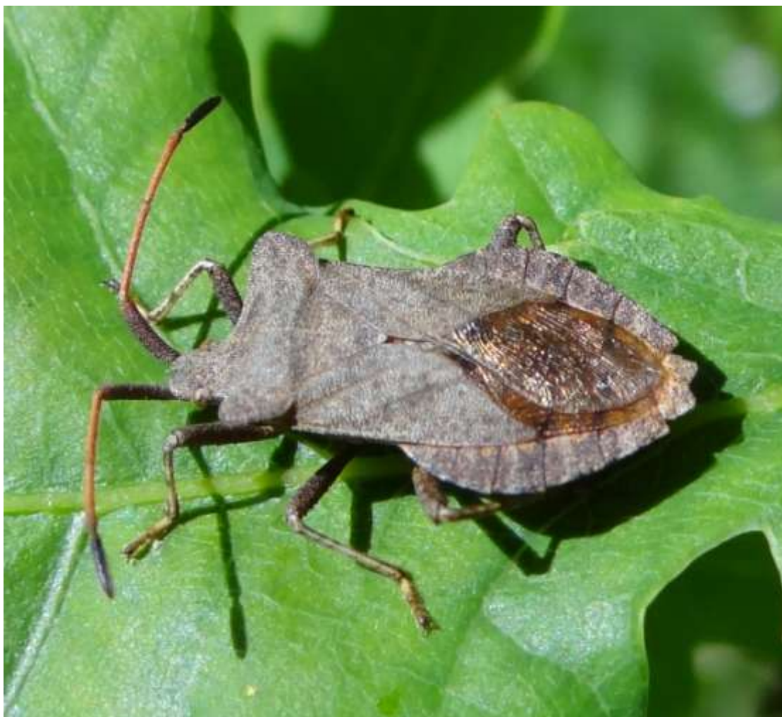
Coreus marginatus – la Corée marginée - Coreidae

(Lieu : aux alentours de la route d'accès à l'Ecomusée - 07.05.2015)