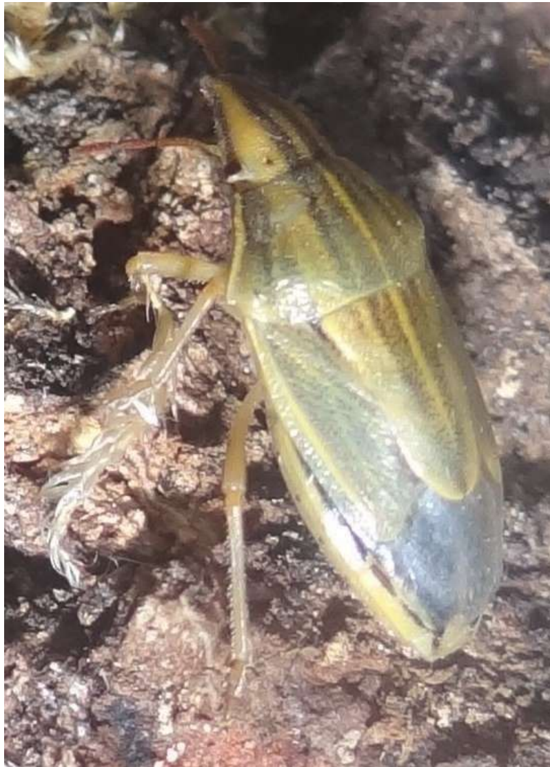
Aelia acuminata – Punaise des blés – Pentatomidae – (Lieu : Parking des bénévoles – 27.06.2015)