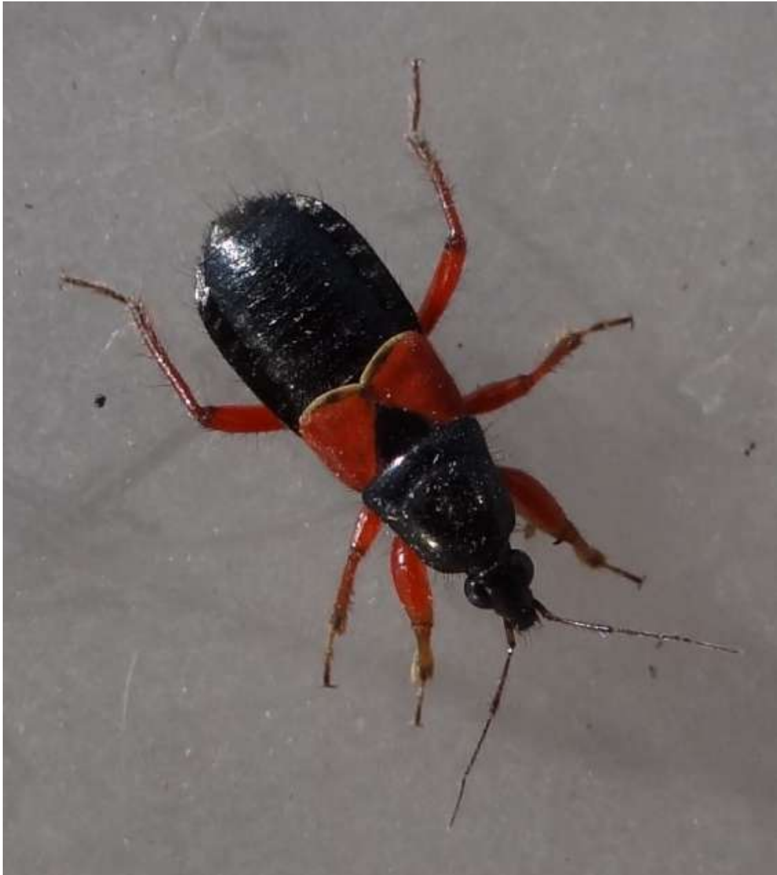
Prostemma guttata forme brachyptère (Heteroptera - Nabidae)

(Lieu : Maison du Charbonnier – 09.04.2015)