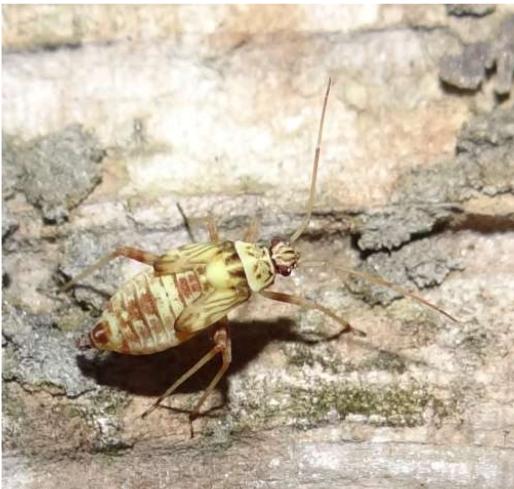
Rhabdomiris striatellus – larve de la Punaise des Chênes - Heteroptera – Miridae – (Lieu : Sentier du ruisseau / Grosswald – 29.04.2015)