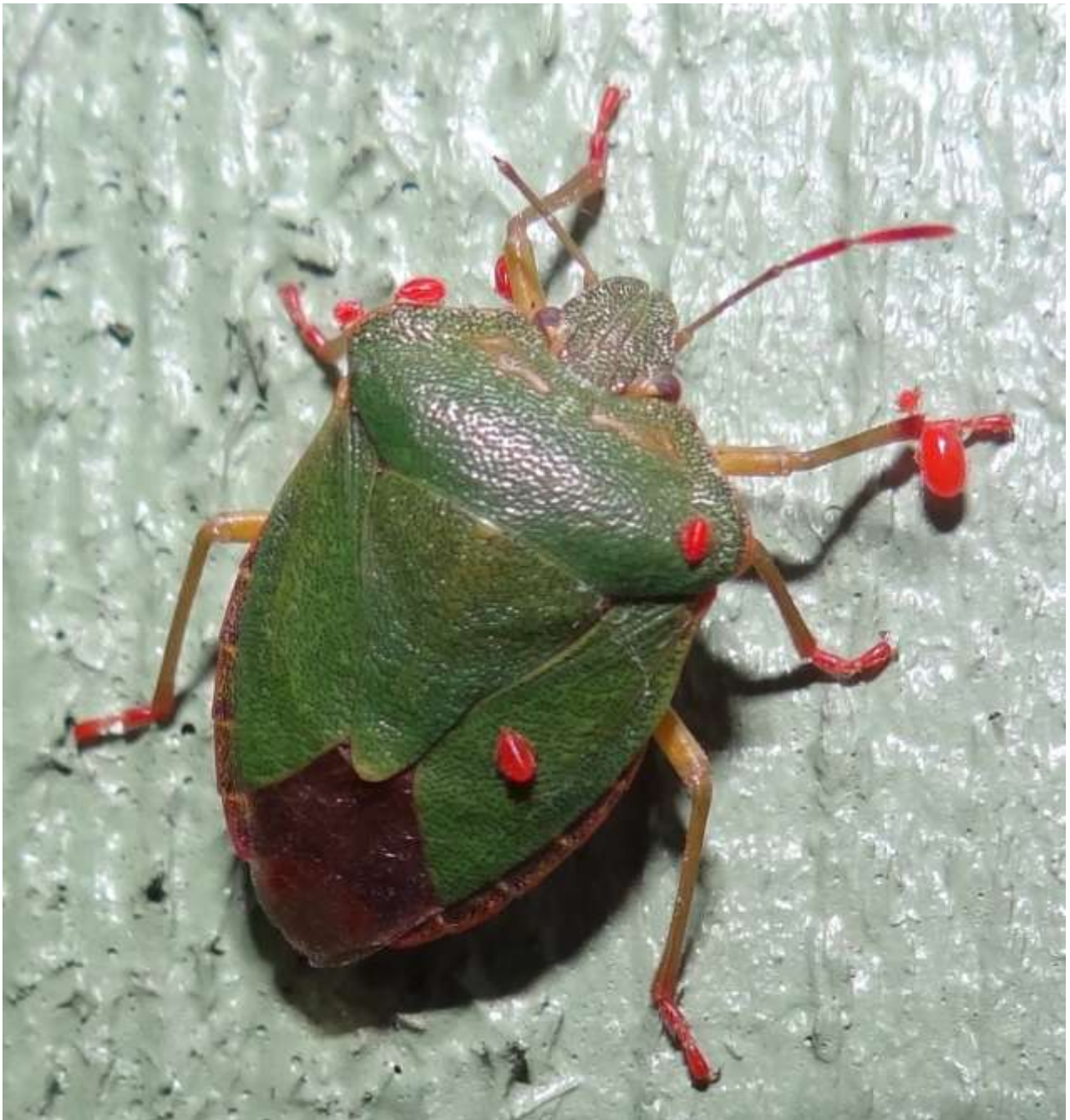
Palomena prasina - Punaise verte - (Ordre : Heteroptera – Famille : Pentatomidae)

(lieu : Chemin du Russawag – 07.07.2014)