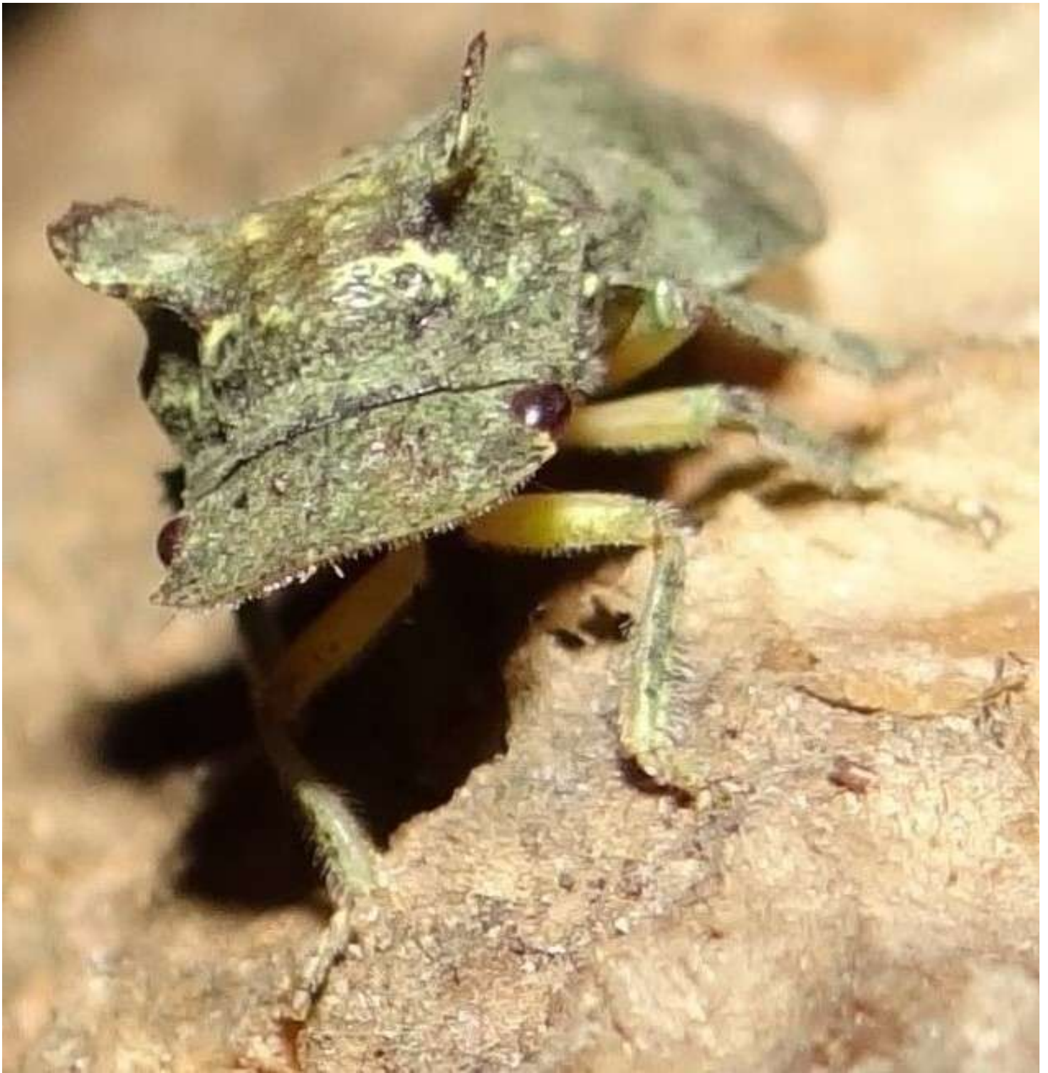
Ledra aurita - le Grand Diable – Cicadellidae - (Lieu : Place du Manège – 17.07.2014)