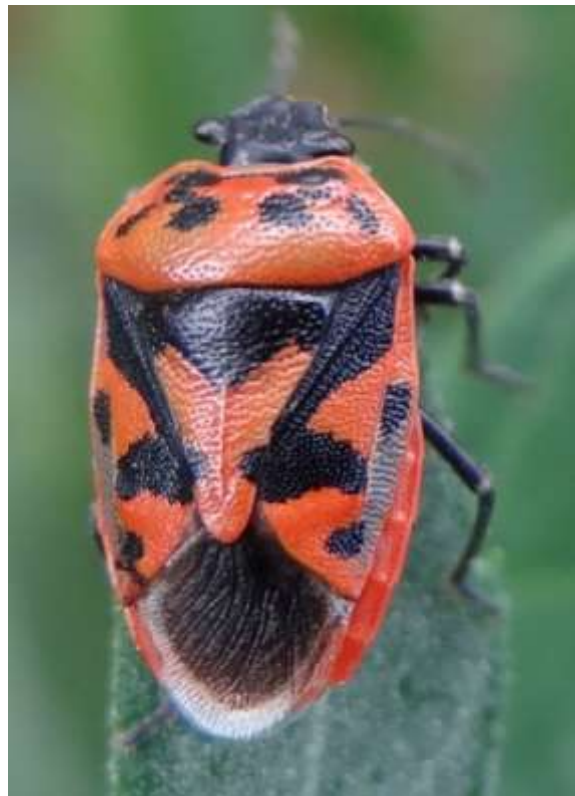
Eurydema ornata – La Punaise rouge du chou – Punaise ornée – Pentatomidae (Place derrière le Pavillon de Guebwiller - 06.07.2014)