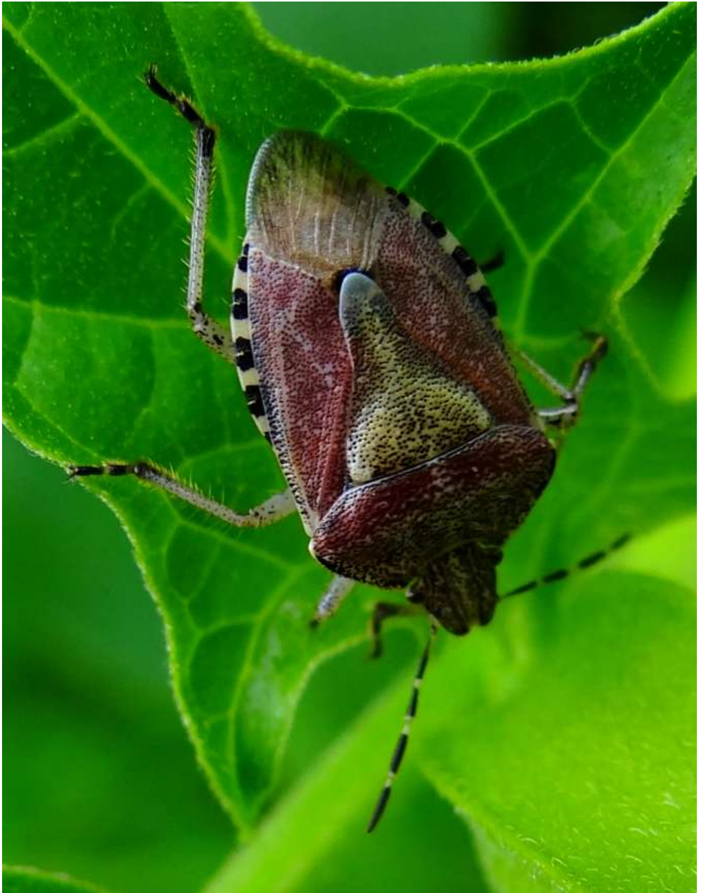
Dolycoris baccarum – La Punaise des baies – Pentatome des baies - Hemiptera – Pentatomidae (lieu : Compost – 22.07.2016)