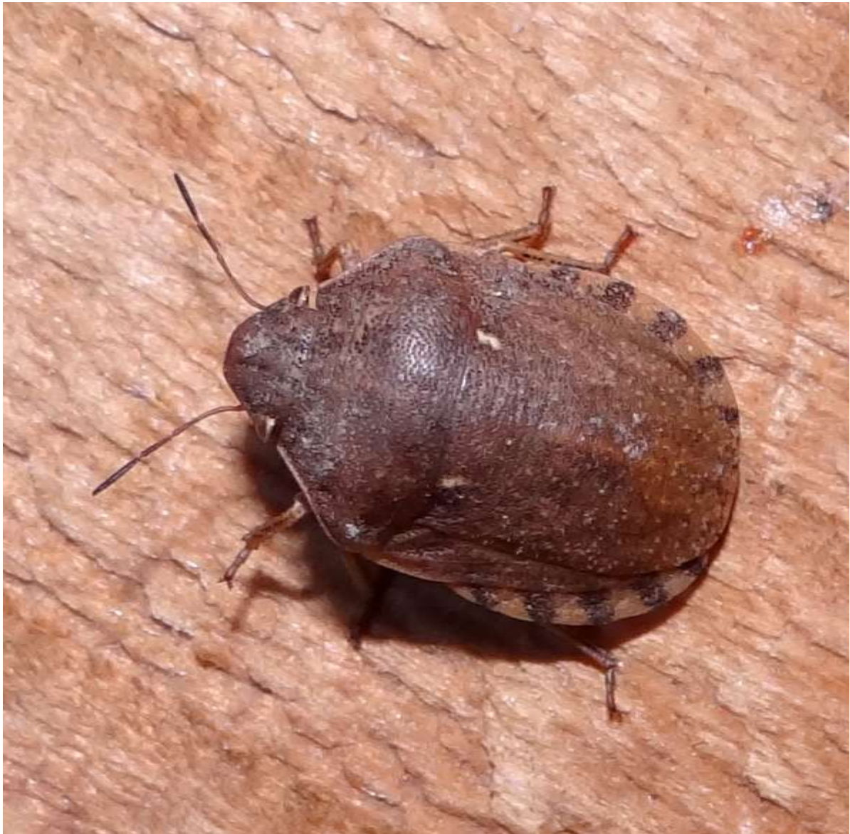
Eurygaster maura - Punaise des céréales – Scutelleridae (Lieu : Pré des scouts – Nuit du 26 au 27.08.2016)