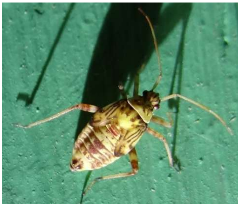
juvénile de Miridae – 24.04.2014 (Lieu : Secteur La taverne)