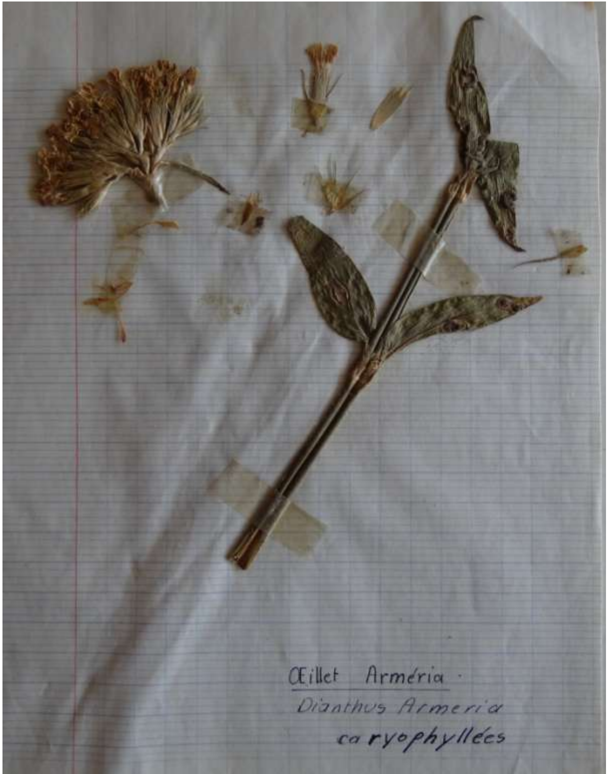
Œillet Armeria · Dianthus Armeria caryophyllées