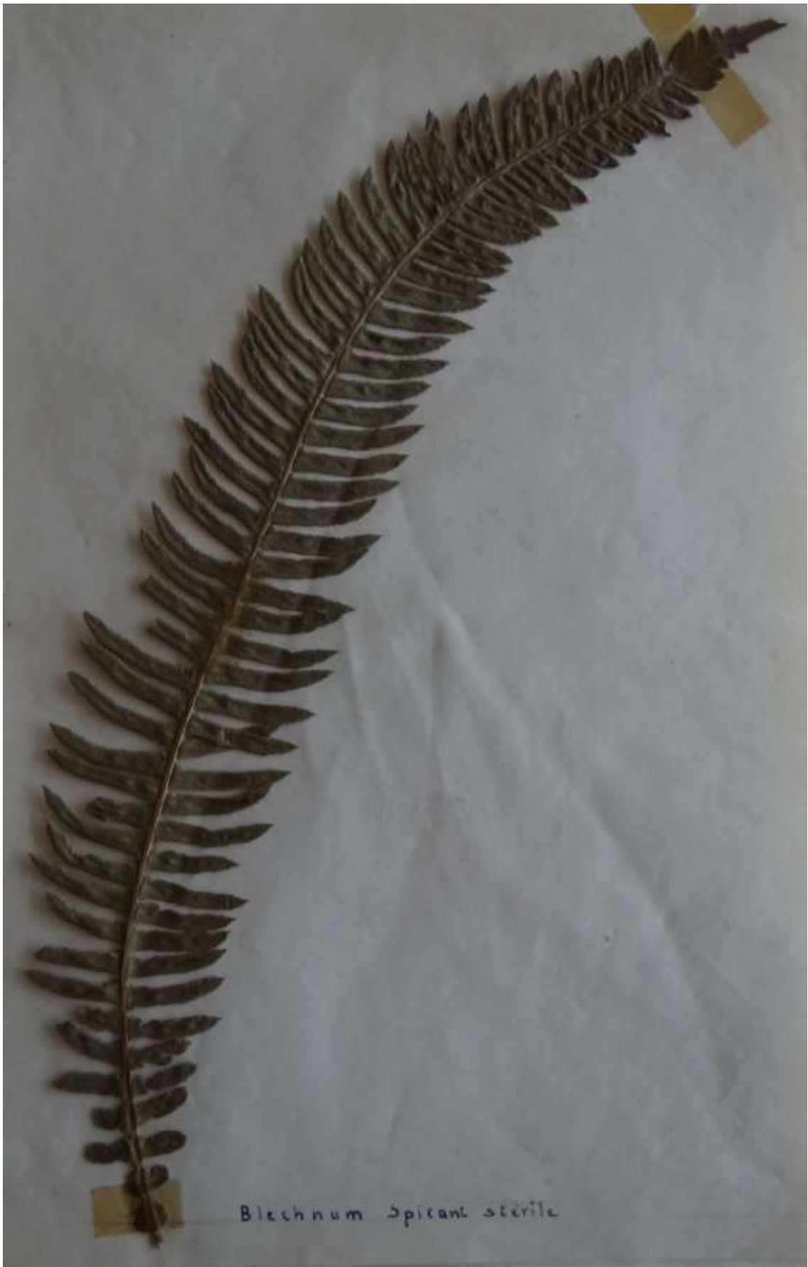
Blechnum spicant sterile