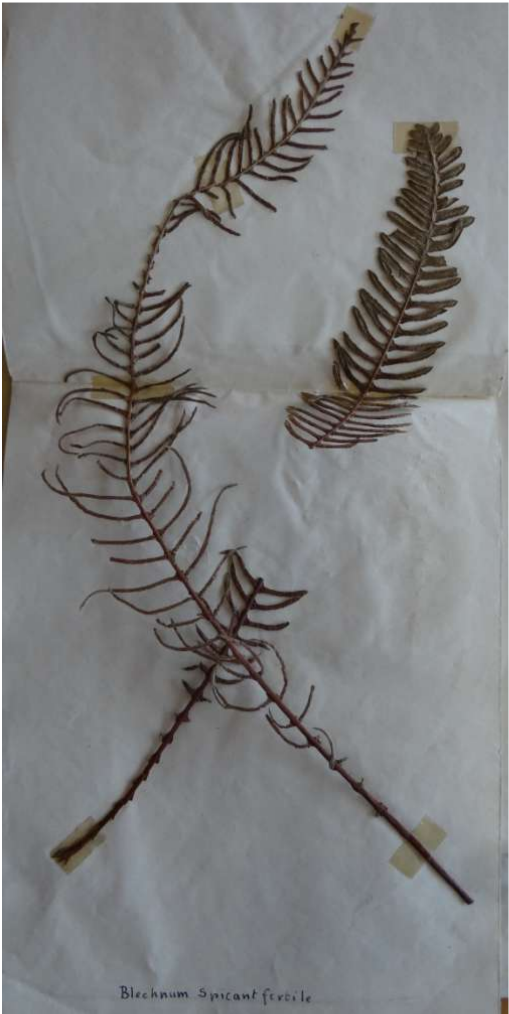
Blechnum spicant fertile