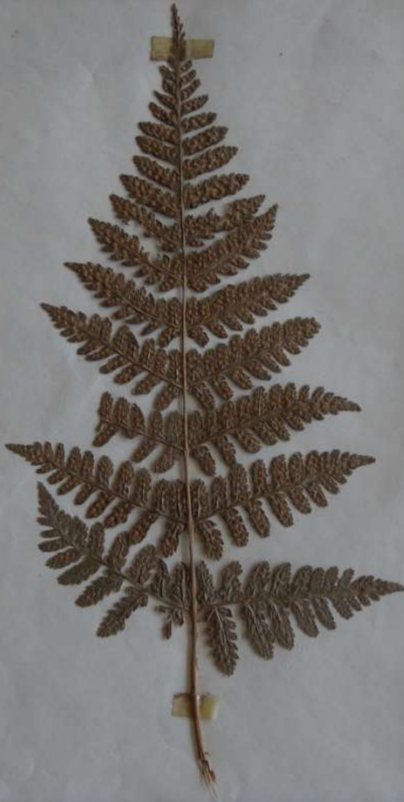
Polystichum spinulex fertile