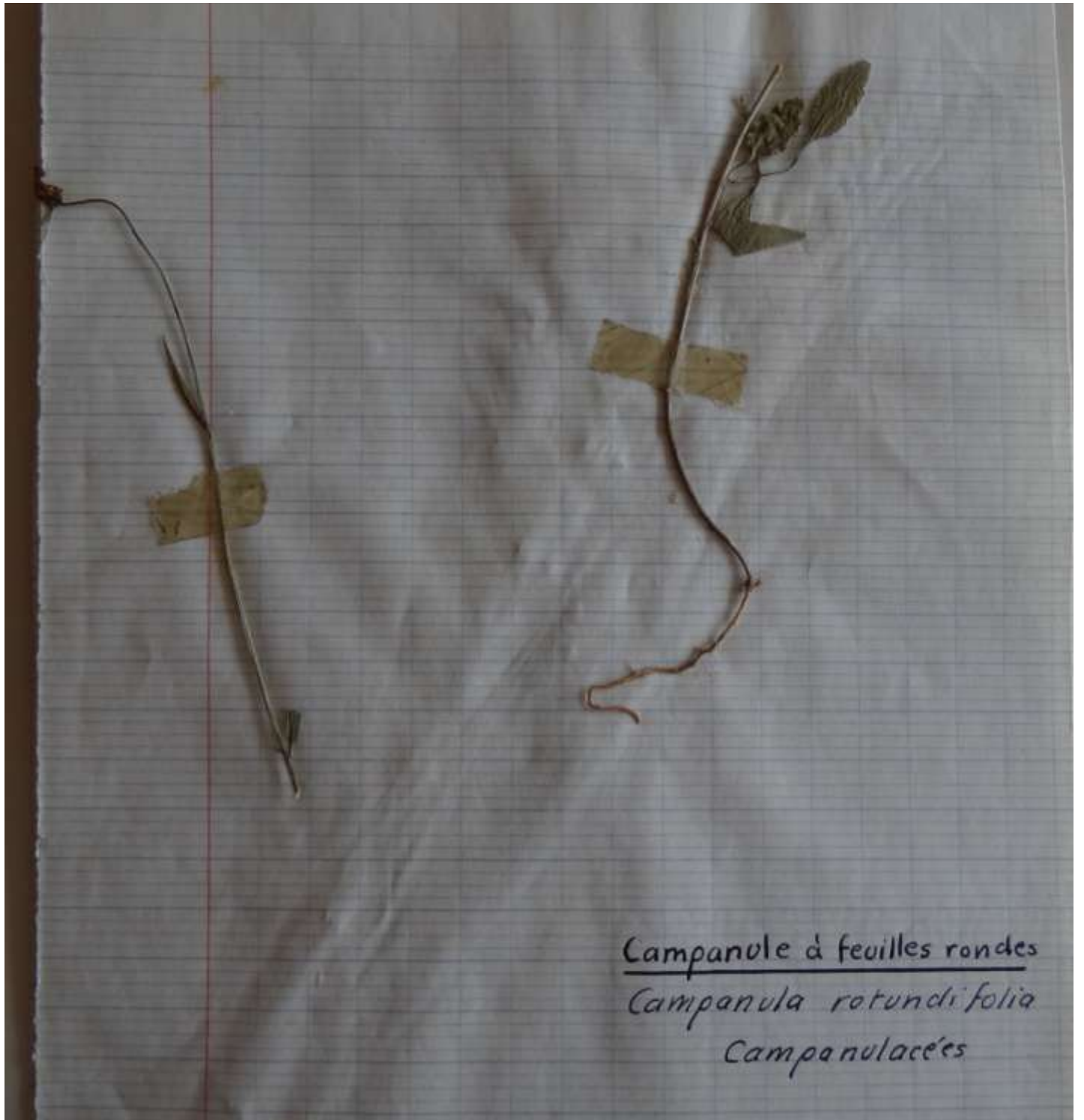
Campanule à feuilles rondes Campanula rotundifolia Campanulacées