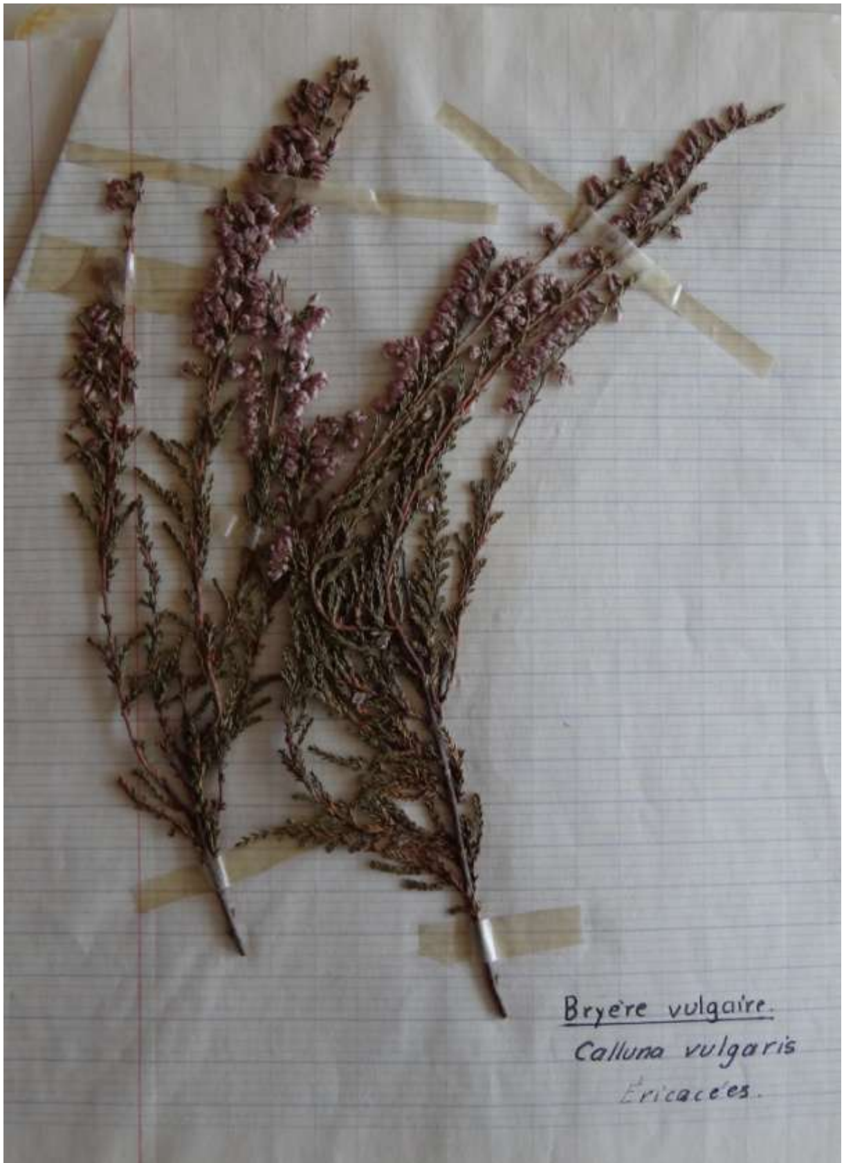
Bryère vulgaire. Calluna vulgaris Ericacées.