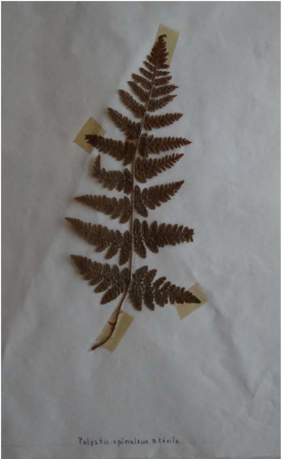
Polystichum spinulosum stérile