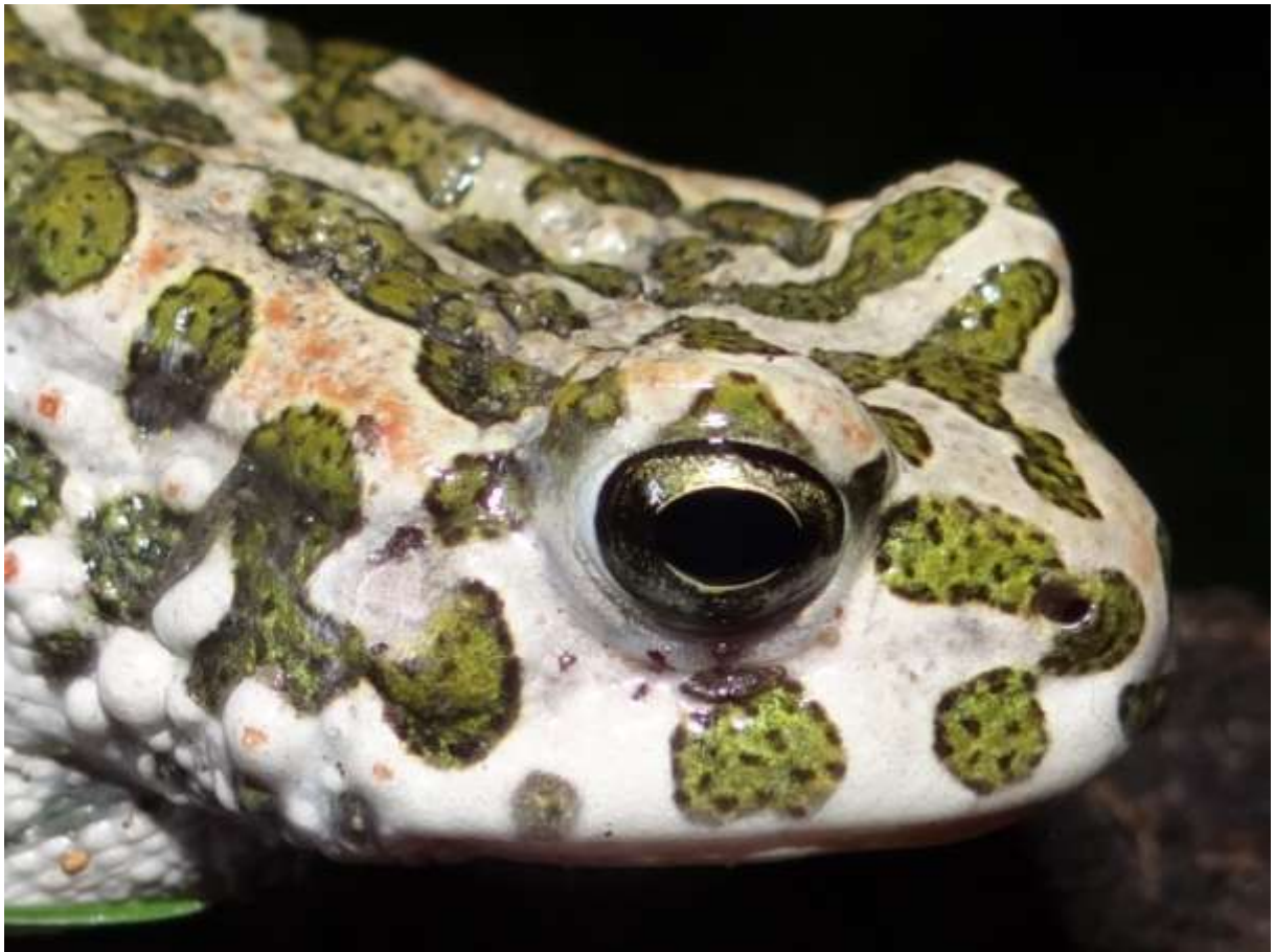
Crapaud vert – Bufo viridis

(A proximité de la Maison du Barbier - nuit du 30 au 31.08.2014)