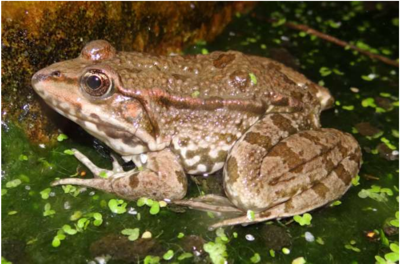
(lieu : La cascade -Grotte- « abords du quai d'embarquement » - nuit du 15 au 16.08.2014)