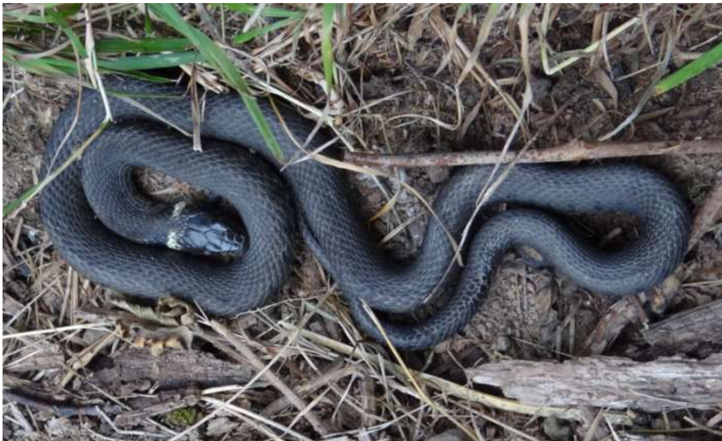
Couleuvre à collier (Prés des scouts - 07.07.2014)