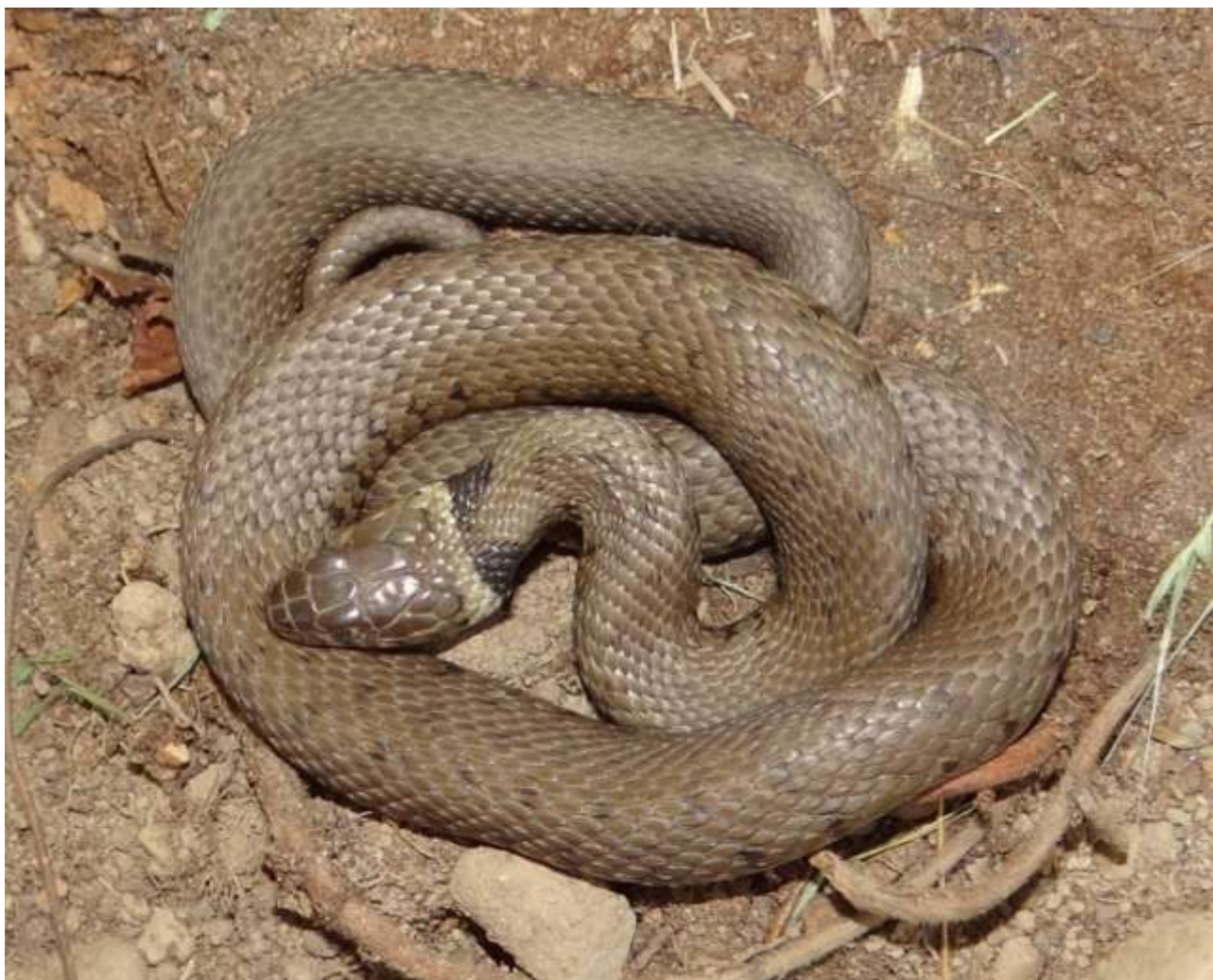
Couleuvre à collier (lieu : Pré des scouts – 14.06.2014)