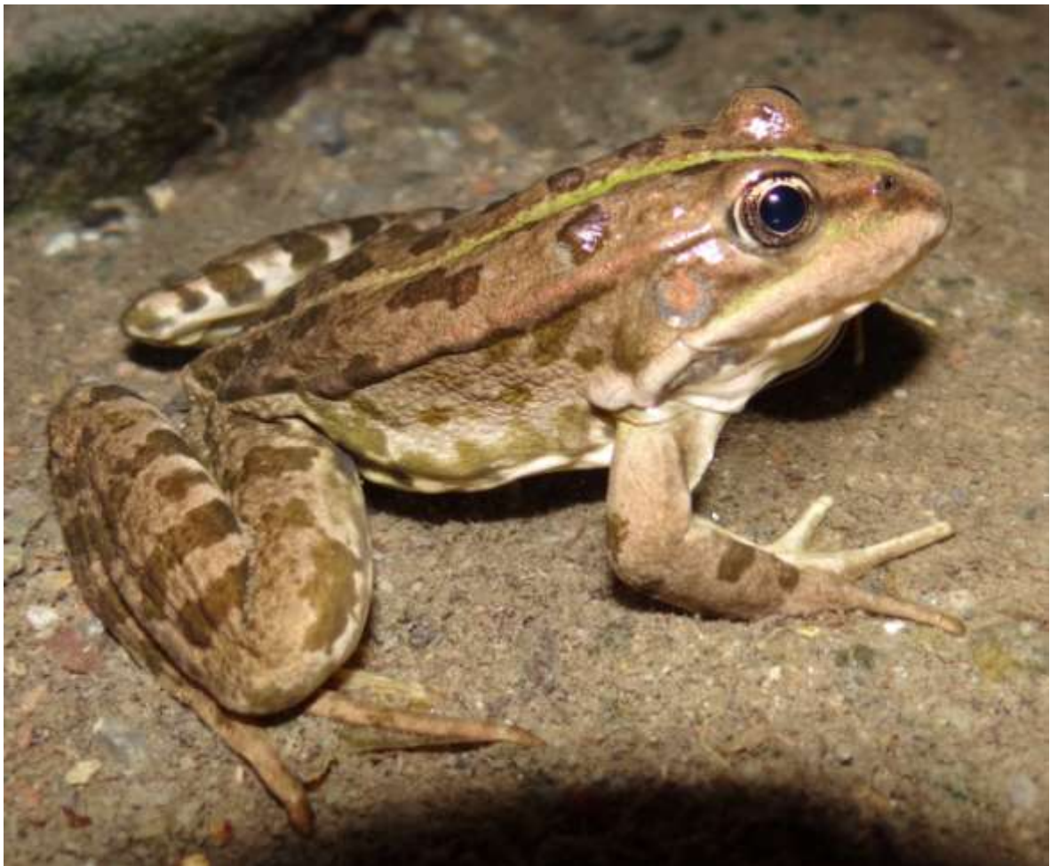
(Grand Rue « petit bassin devant le calvaire » – 11.07.2014)