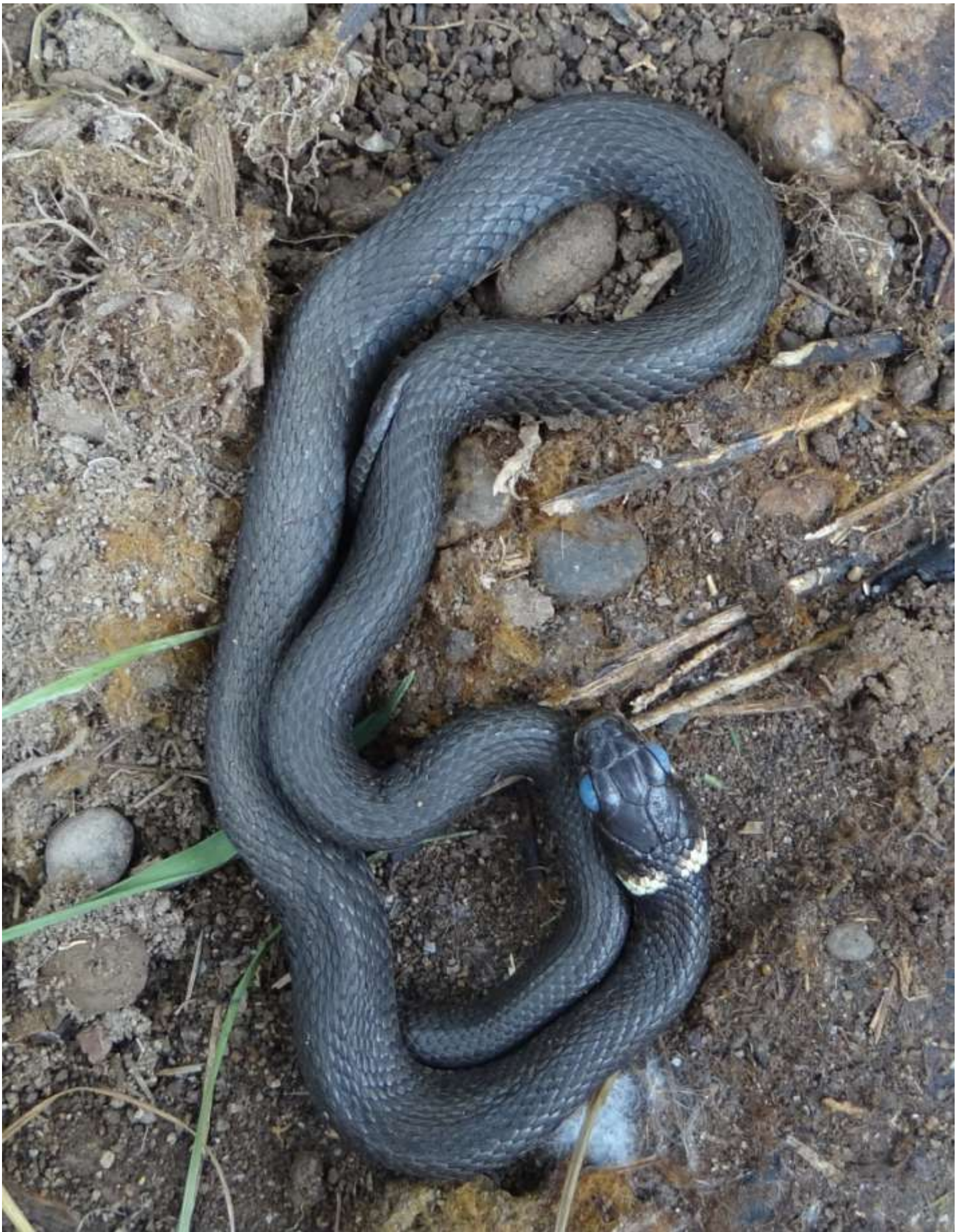
Couleuvre à collier (Lieu : Pré des Scouts – 16.06.2015)