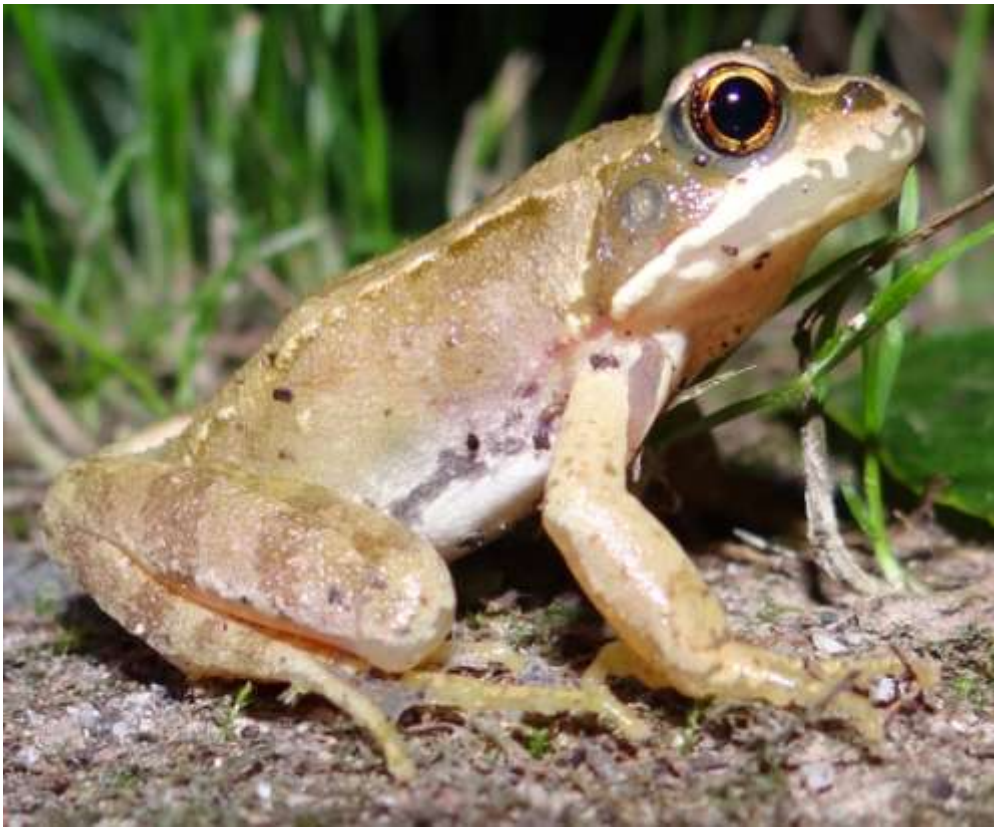
(lieu : Russawag : nuit du 06 au 07.09.2014)