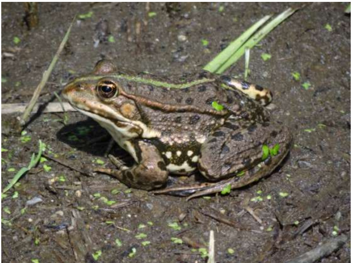
(lieu : Pavillon de Guebwiller – 14.07.2014)