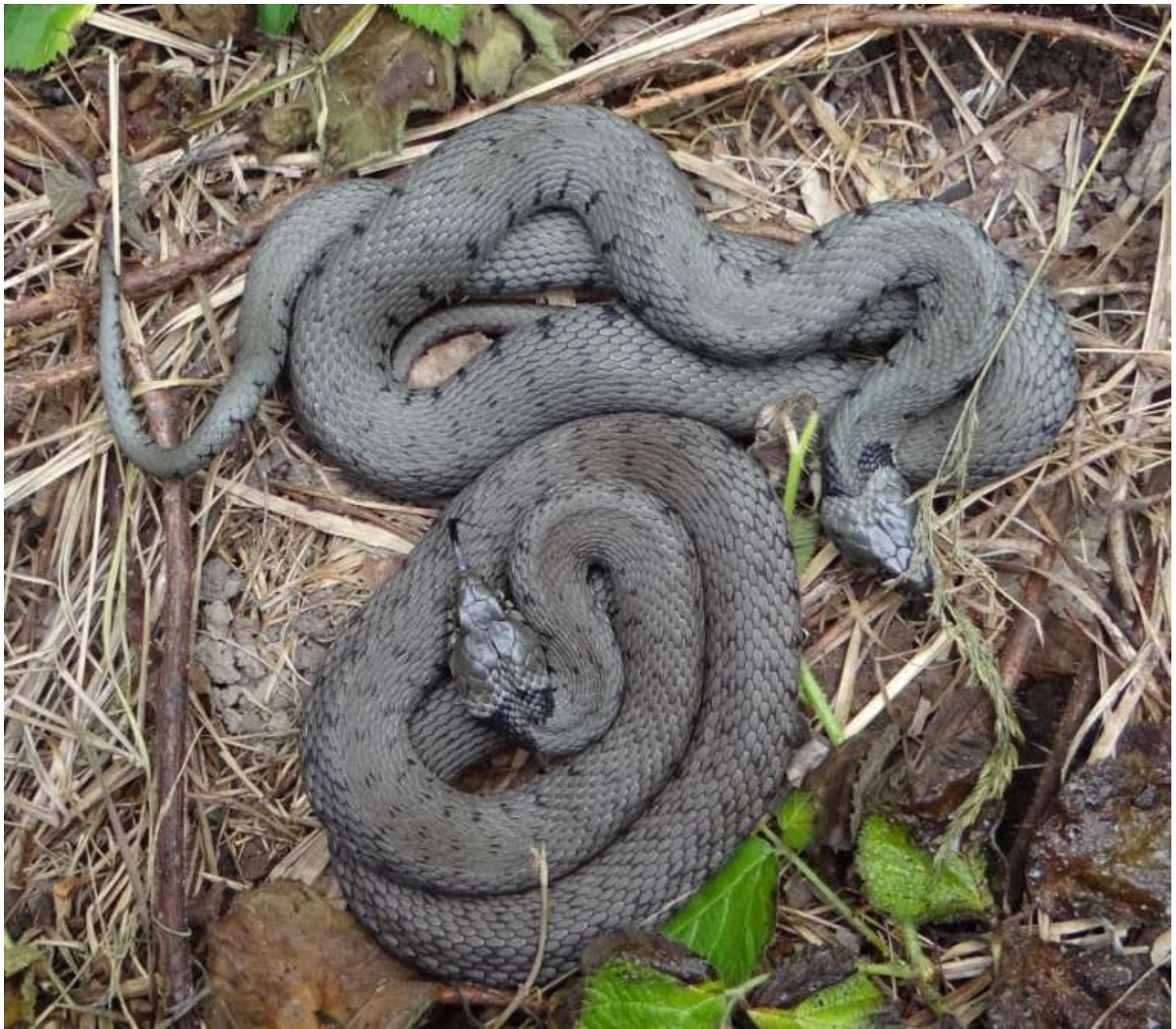
Couleuvres à collier – (Lieu : Compost – 16.06.2015)