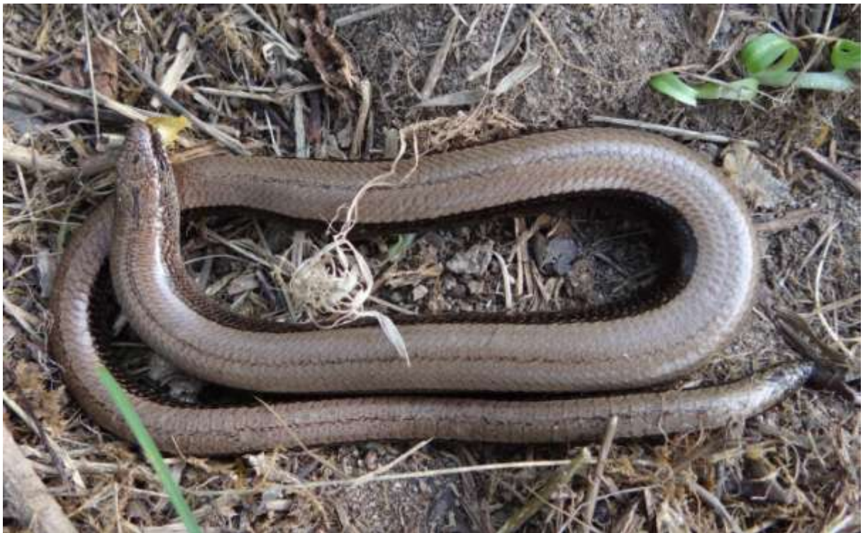
Orvet (aux alentours de la Tour Torony ou au compost - 20.08.2014)