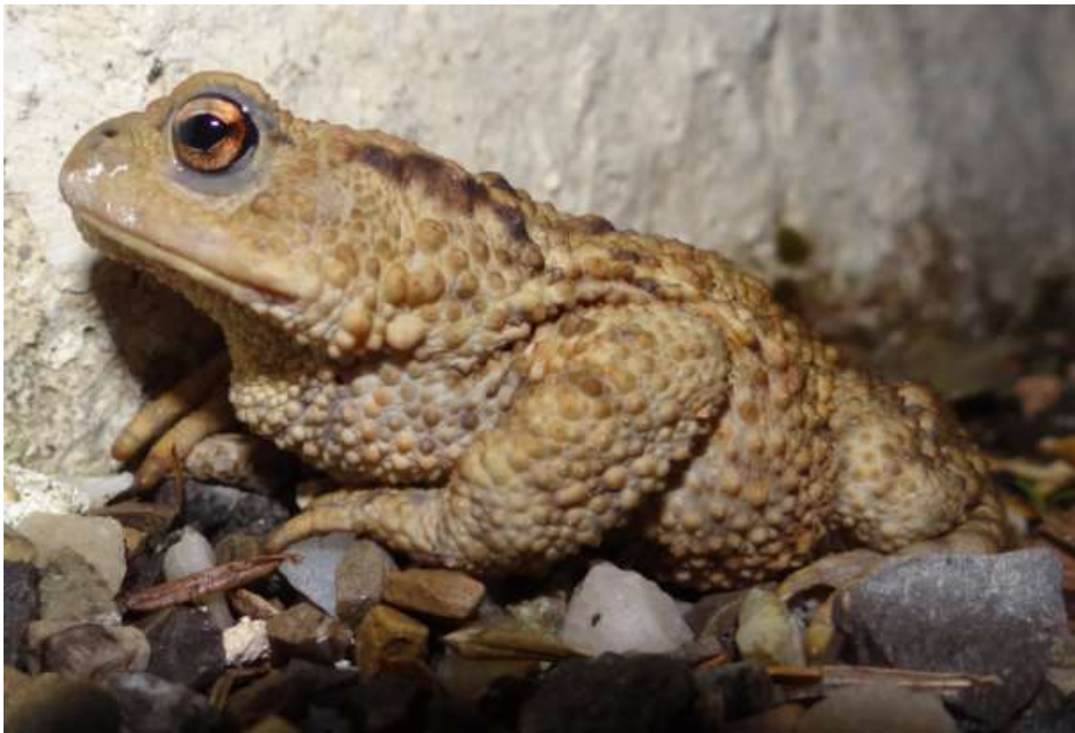
(Allée des Platanes – 06.07.2014)