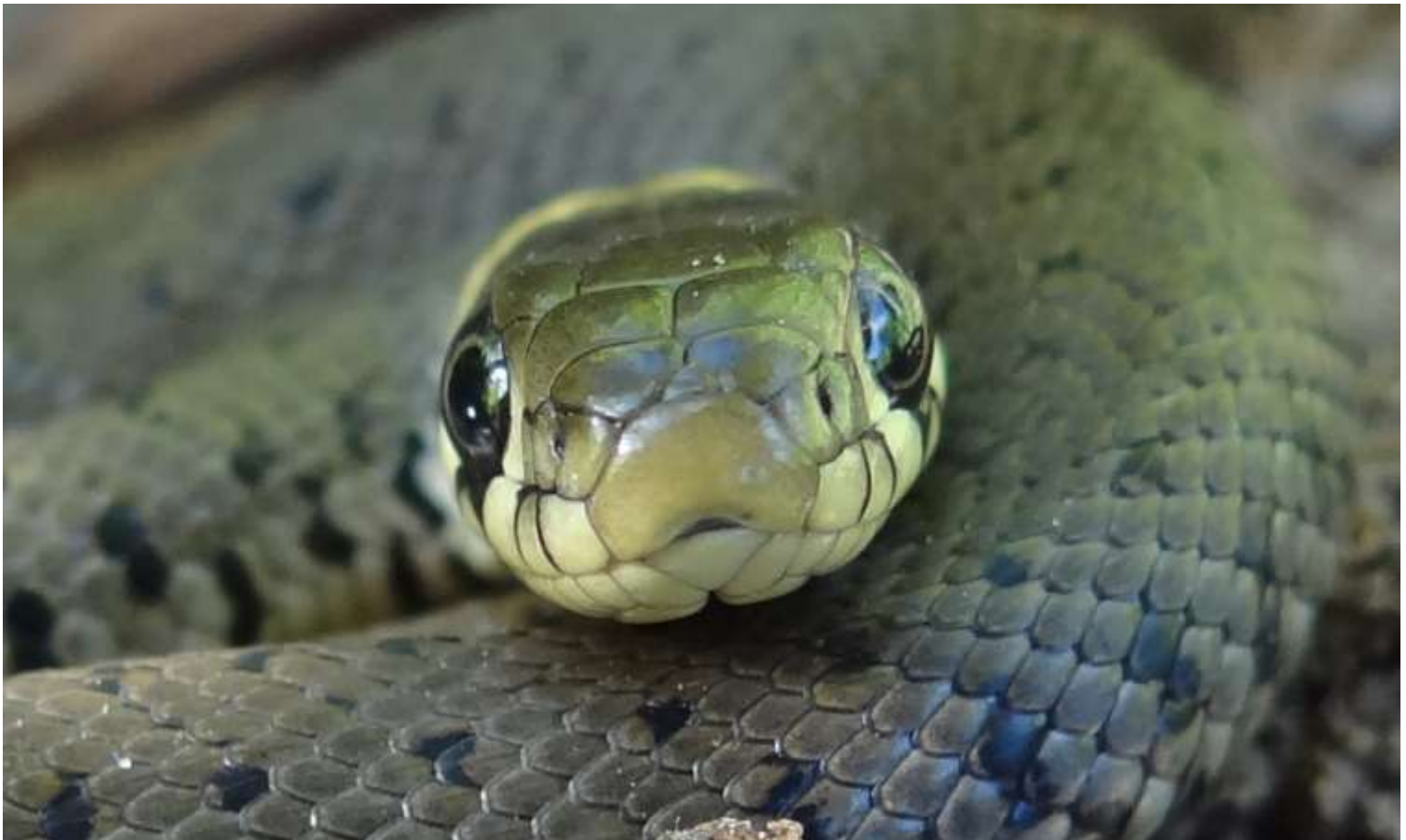
Couleuvre à collier (Lieu : Pré des Scouts – 06.05.2015)