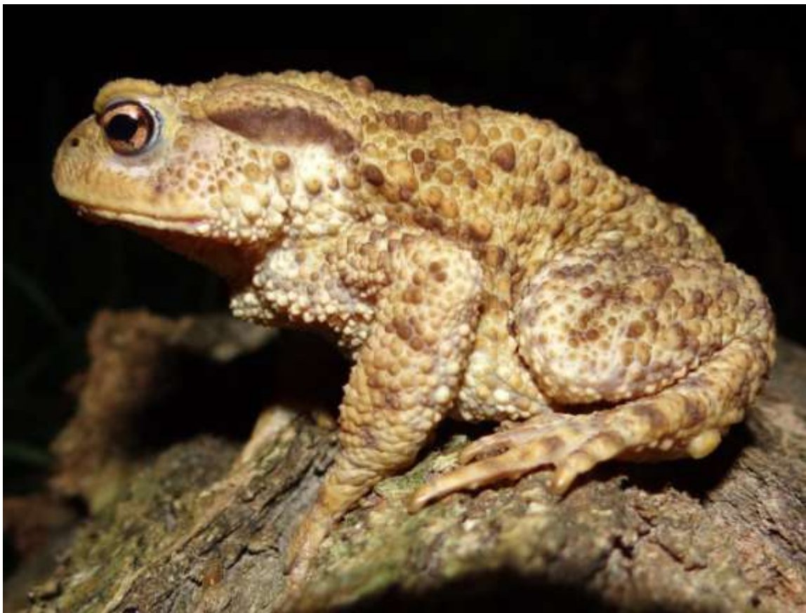
(aux alentours du Chemin de la Roselière - Nuit du 06 au 07.09.2014)