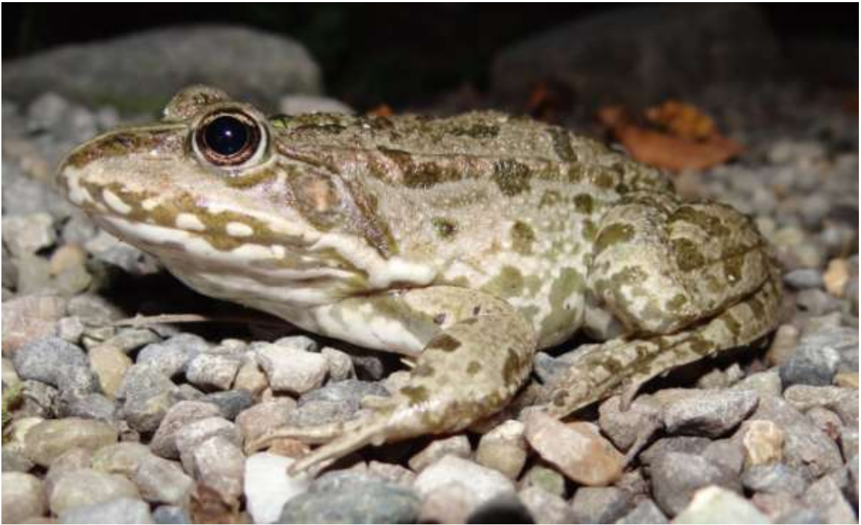
(Grand Rue – 28.08.2014)