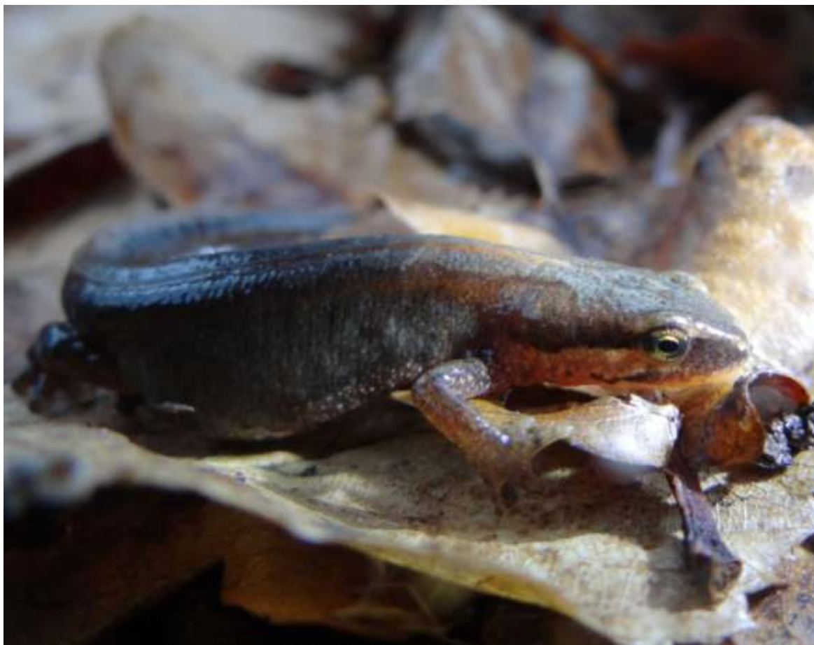
Triton palmé - Lissotriton helveticus - (Lieu : Forêt arrière marais – 22.02.2015)