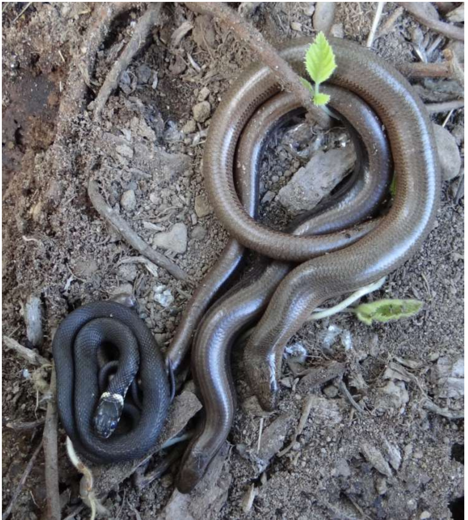
Couleuvre et orvets – (lieu : pré de scouts – 14.05.2014)