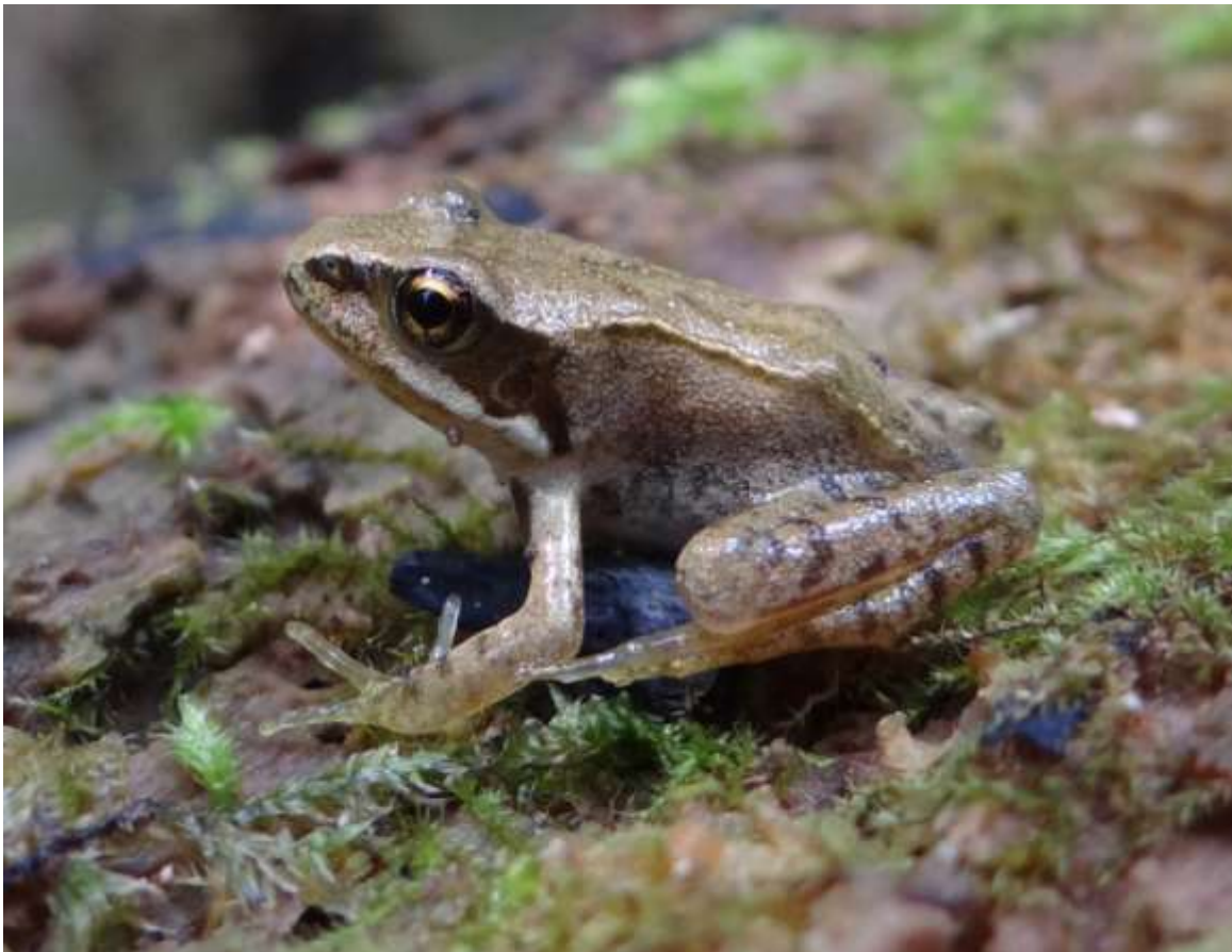
Grenouille (Arrière marais - 23.07.2014)