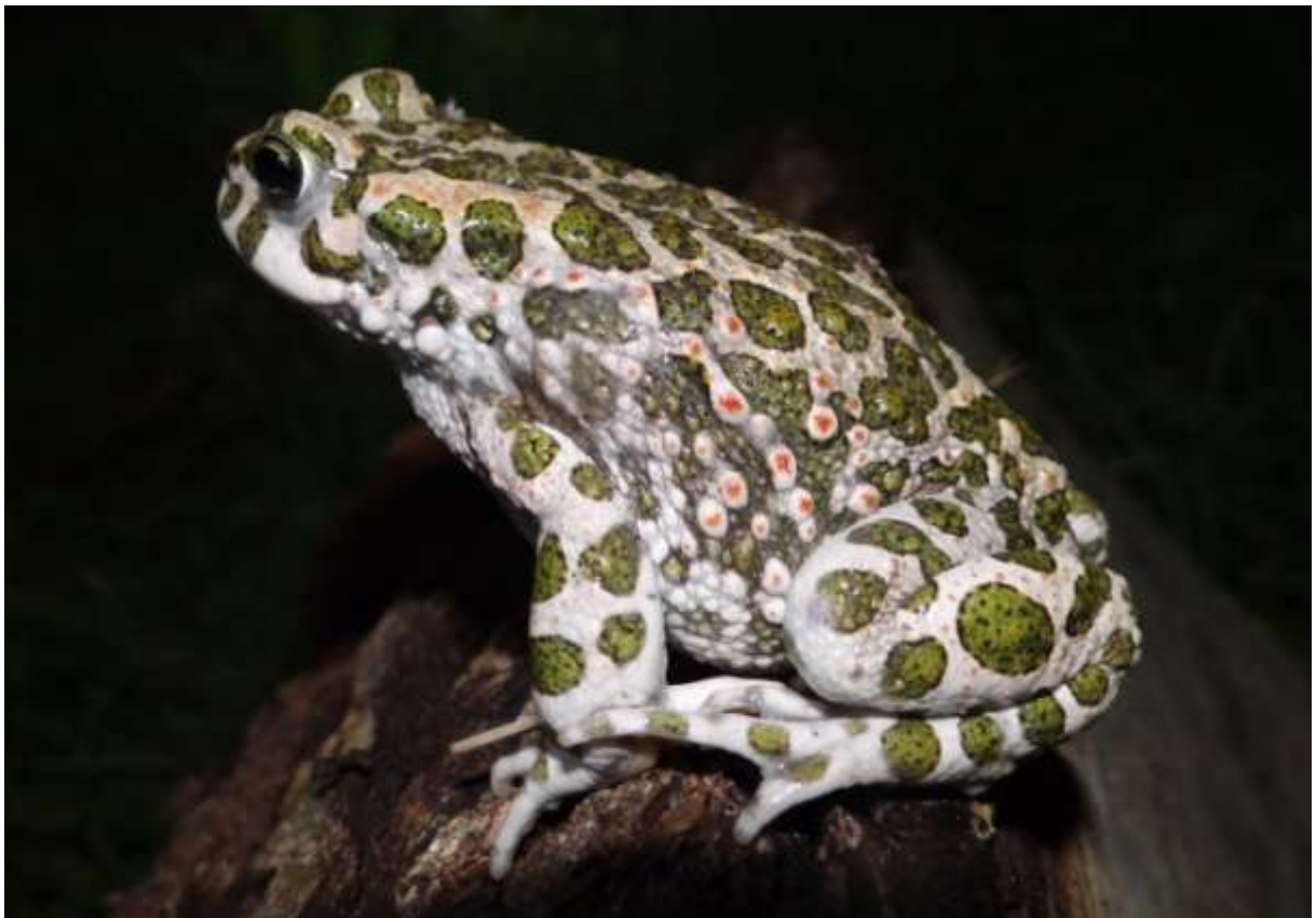
Crapaud vert – Bufo viridis

(A proximité de la Maison du Barbier - nuit du 30 au 31.08.2014)