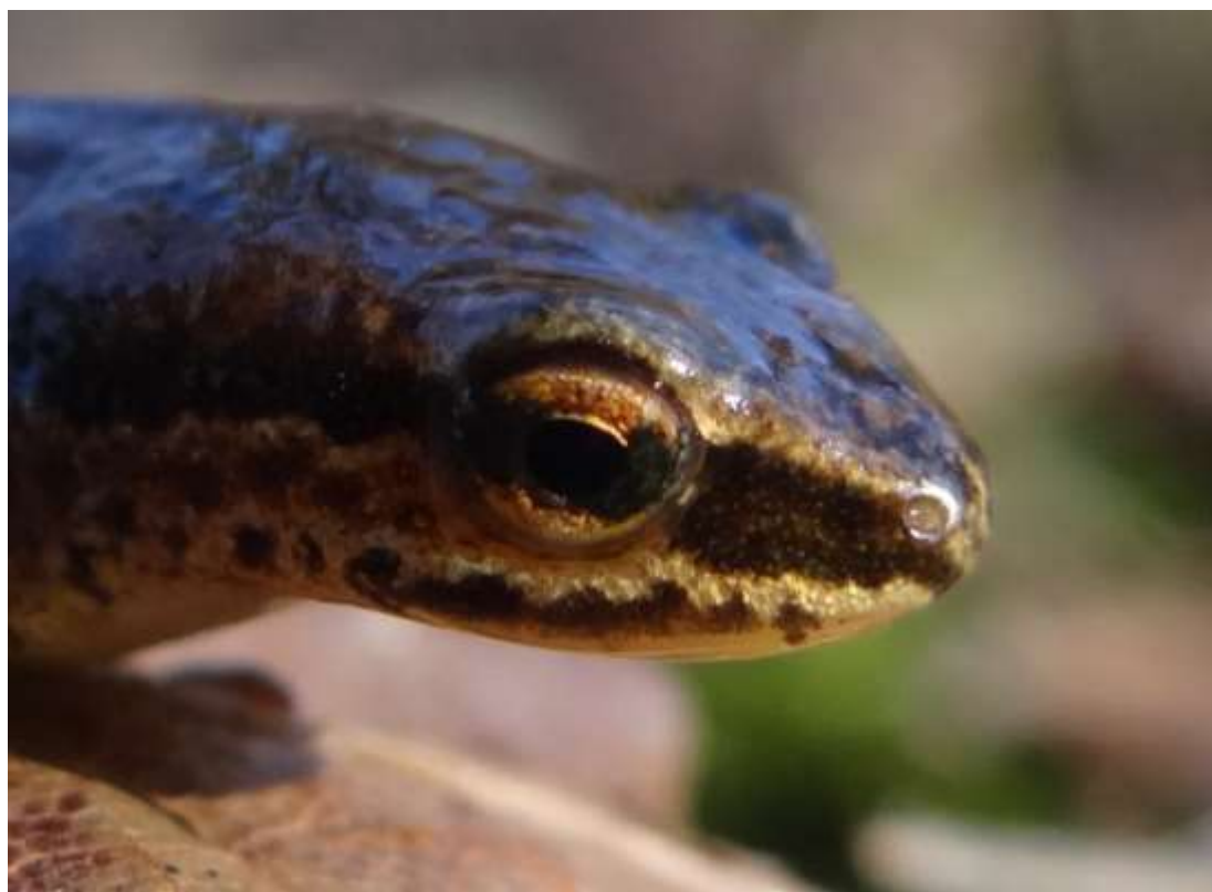
Triton palmé - Lissotriton helveticus - (Lieu : Forêt arrière marais – 07.03.2015)