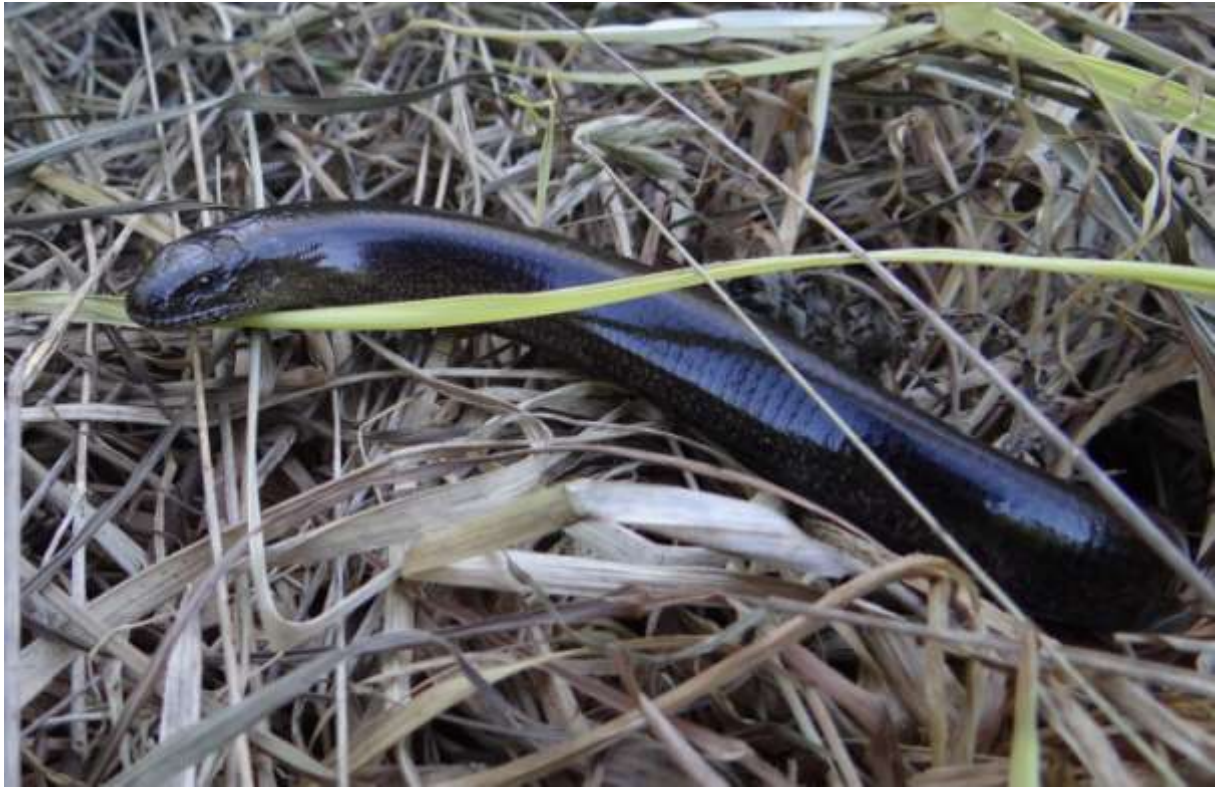
Orvet mélanisé (lieu : Déchets verts – 06.06.2014)