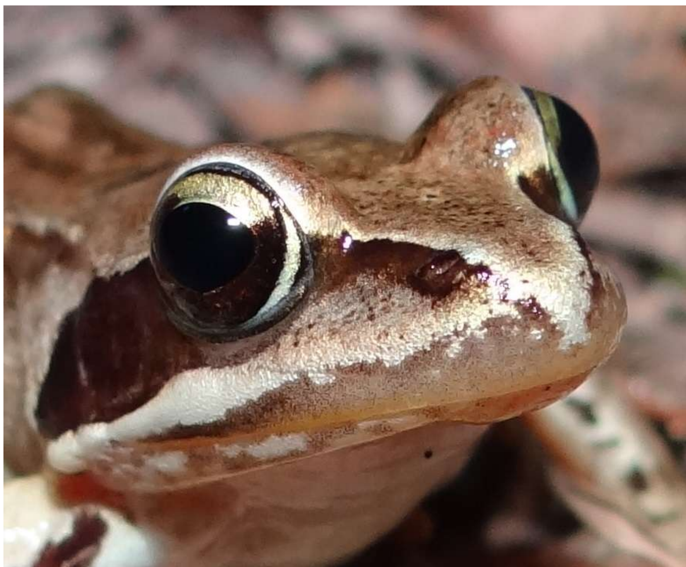
(Lieu : arrière marais « Chemin du Grosswald » - 16.07.2015)