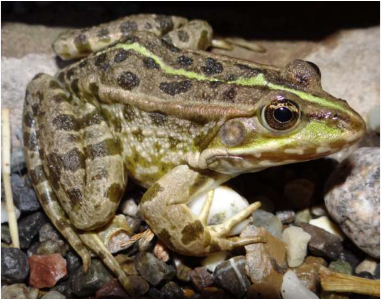
(à proximité du sentier des Pêcheurs -11.07.2014)