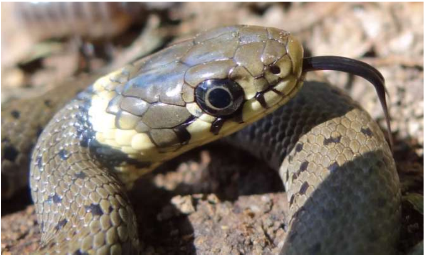
Couleuvre à collier – (Lieu : Pré des scouts – 06.05.2015)