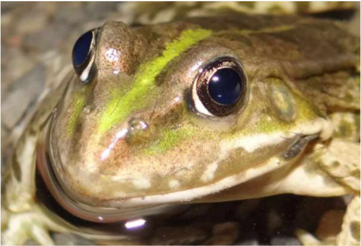
(Grand Rue « petit bassin devant le calvaire » – 07.07.2014)