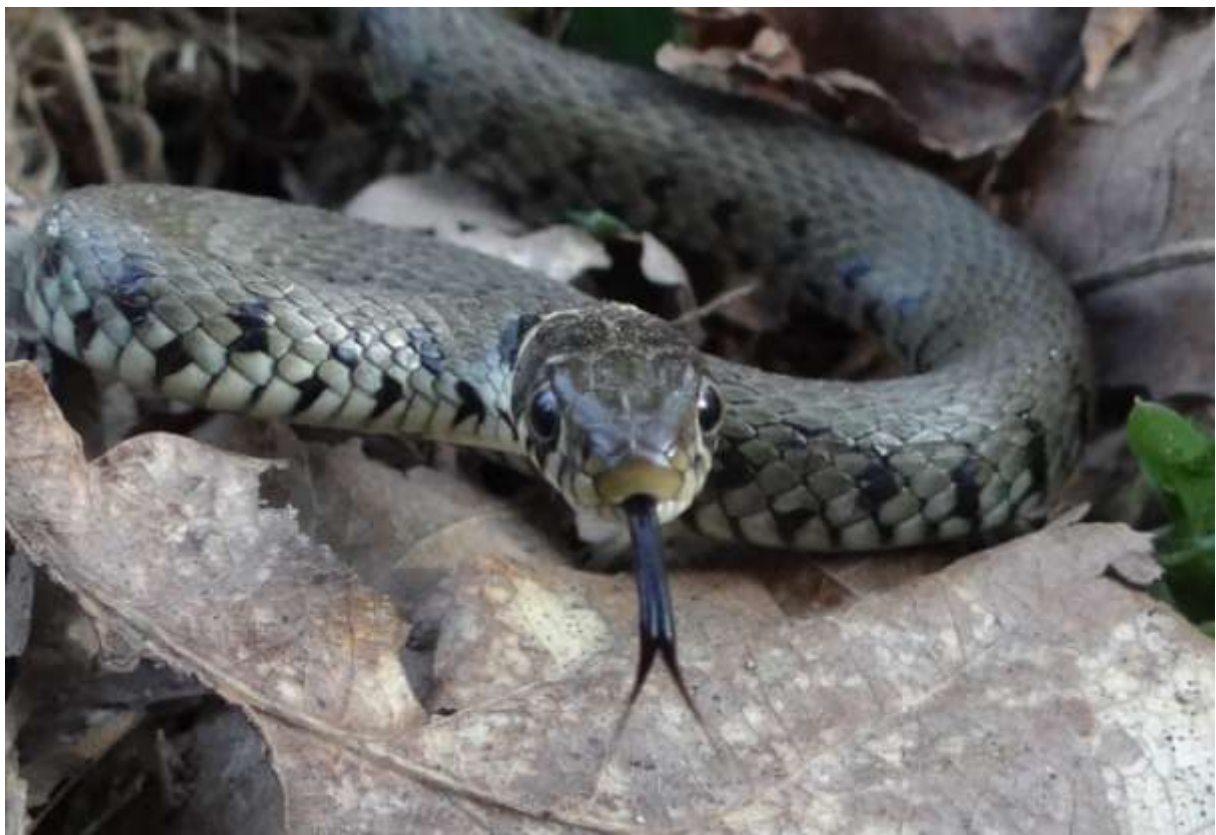
Couleuvre à collier - (Lieu : Arrière marais – 13.04.2015)