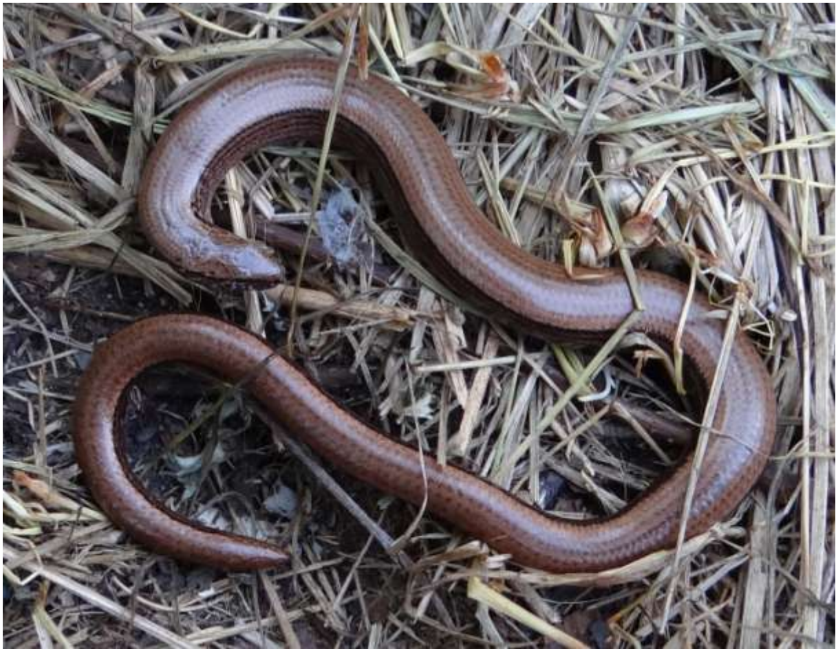
Orvet (aux alentours de la Tour Torony ou au compost - 20.08.2014)