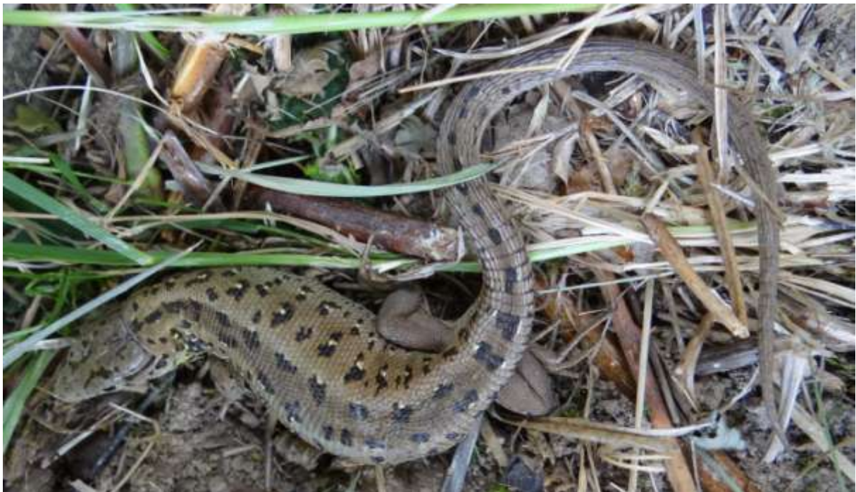
(lieu : Pré des scouts – 06.06.2014)