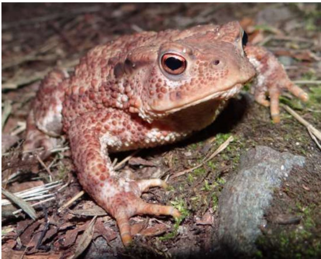
(lieu : Russawag – nuit du 06 au 07.09.2014)