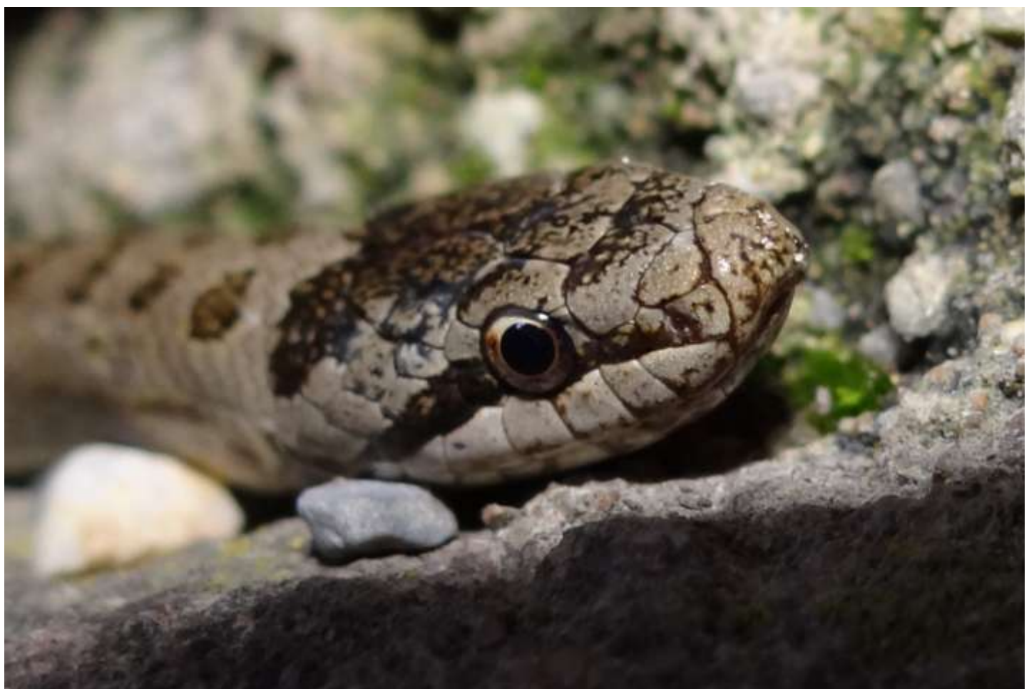
La Coronelle lisse – Coronella austriaca

(muret à proximité de la cascade de la grotte - nuit du 30 au 31.08.2014)