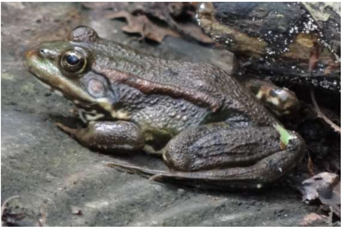
Grenouille (Arrière du marais « vestige en béton » 23.07.2014)