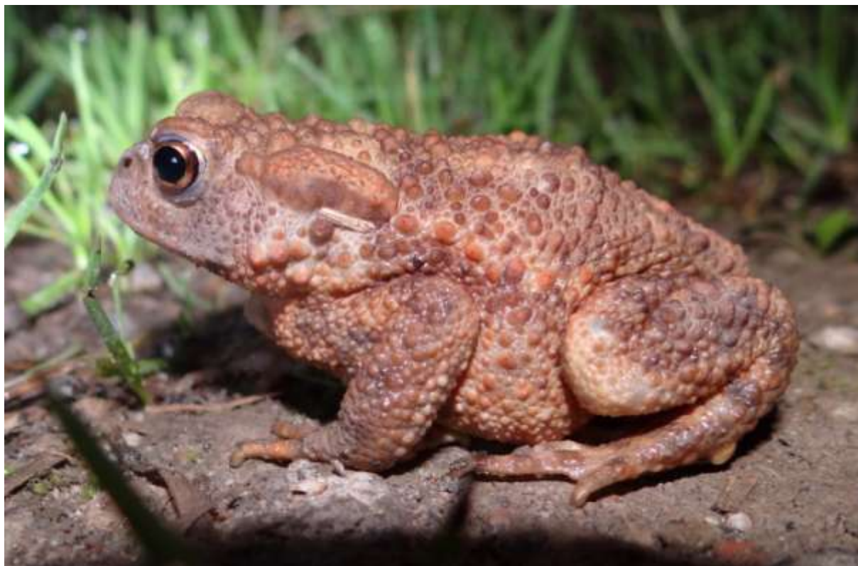
(lieu : Chemin à proximité de la Chapelle – nuit du 30 au 31.08.2014)