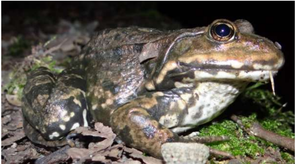
(lieu : aux alentours du Chemin de la Roselière – nuit du 06 au 07.09.2014)