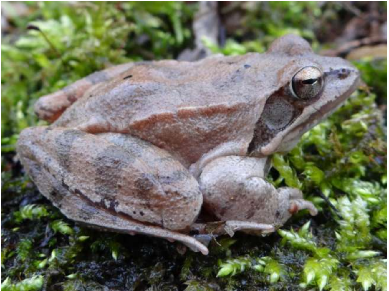
Grenouille agile (Lieu : Forêt arrière marais – 22.02.2015)