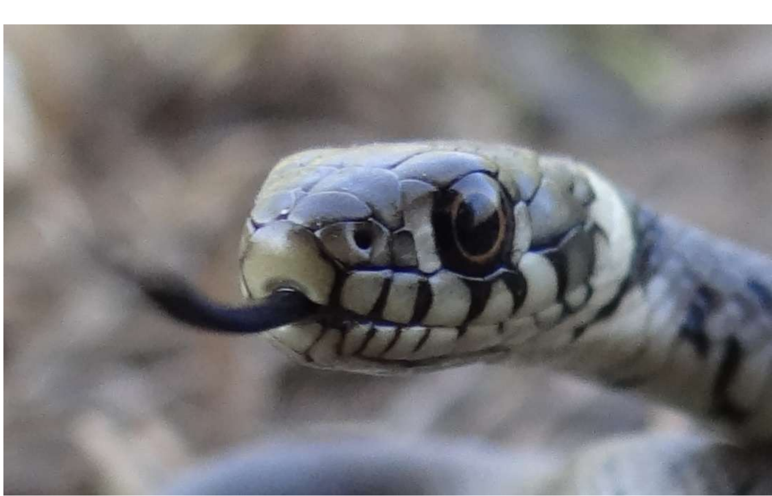
Couleuvre à collier (Lieu : Compost – 22.04.2015)