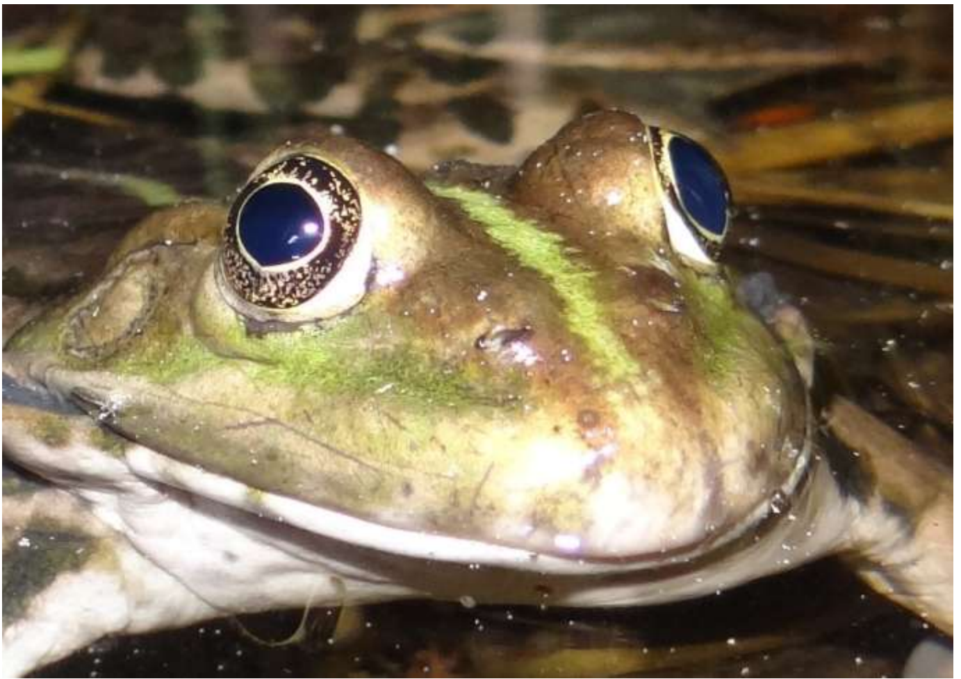
(lieu : Pavillon de Guebwiller – bordure marais – 24.04.2014)