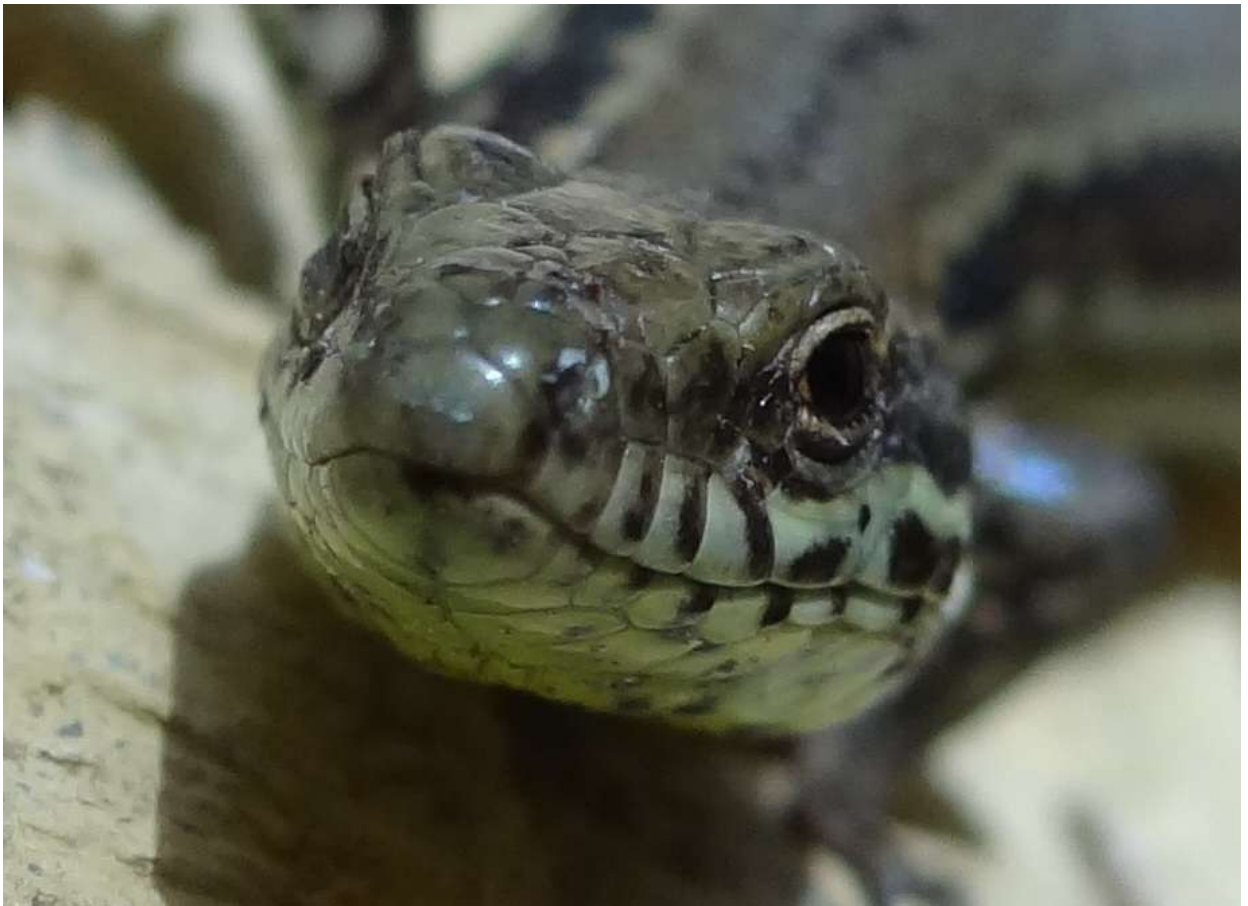
(lieu : Labyrinthe – 28.08.2014)