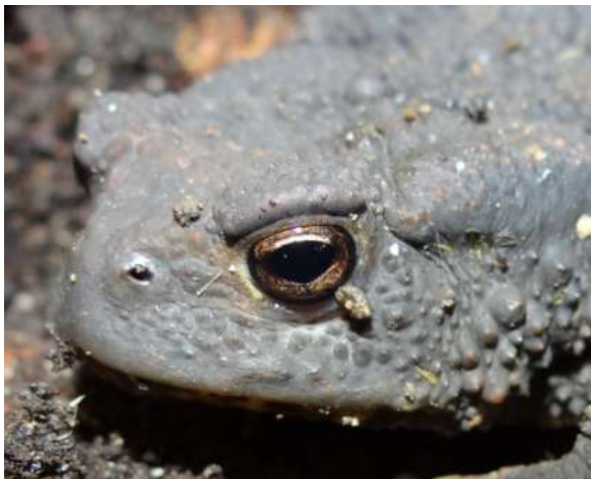
(entre l'allée de Kuenheim et la maison récemment construite « à côté du pont » - 31.07.2014)