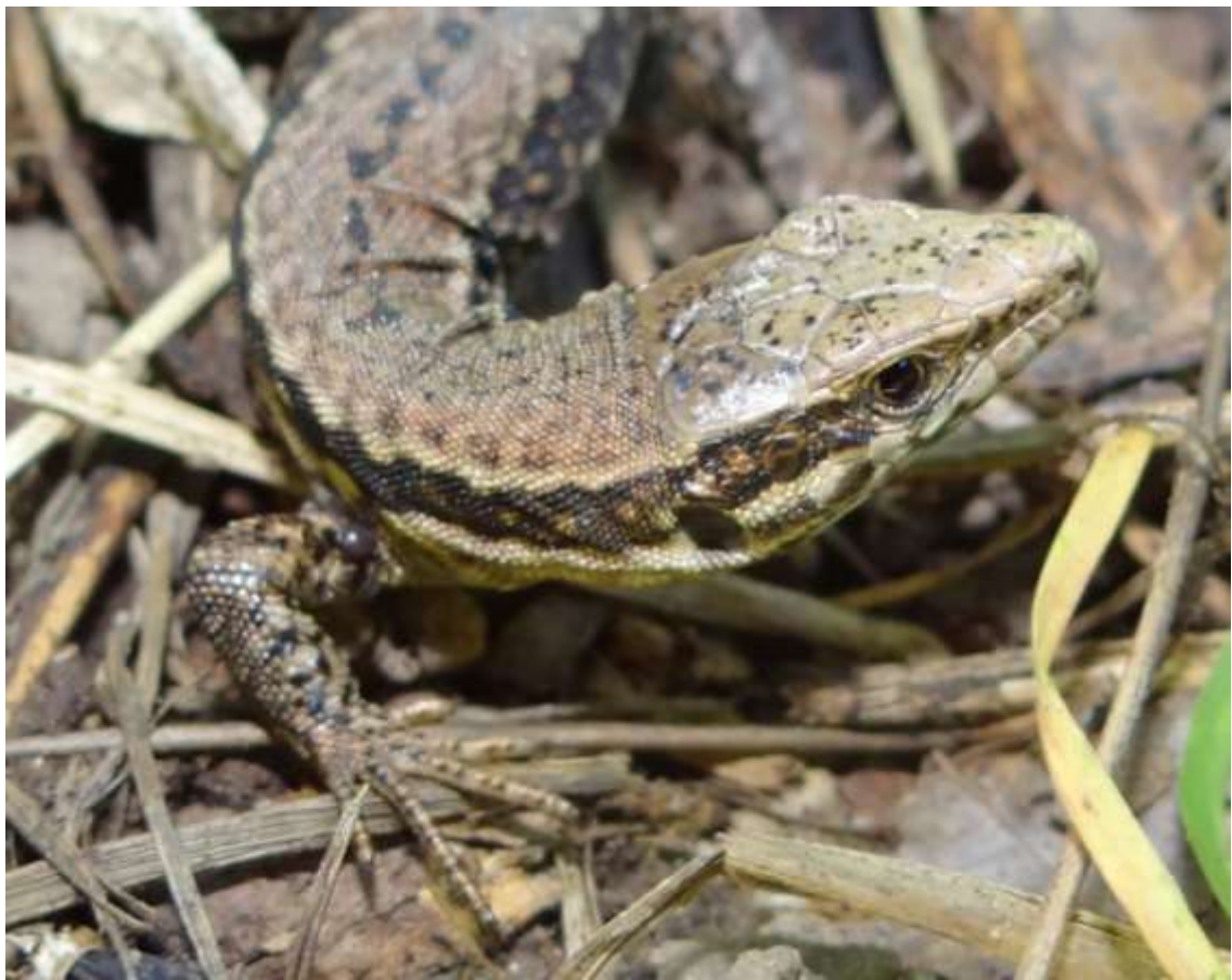
(Lieu : Pré des scouts – 10.05.2015)