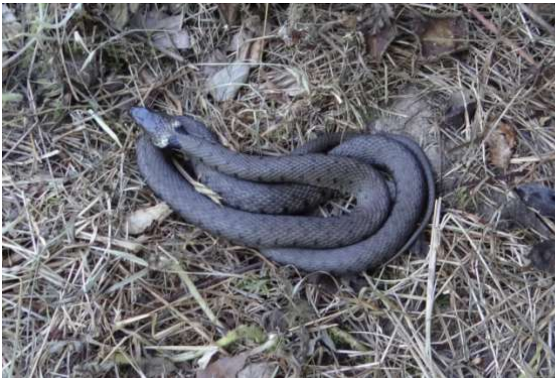
Couleuvre à collier (lieu : Place compost « déchets verts » – 05.06.2014)