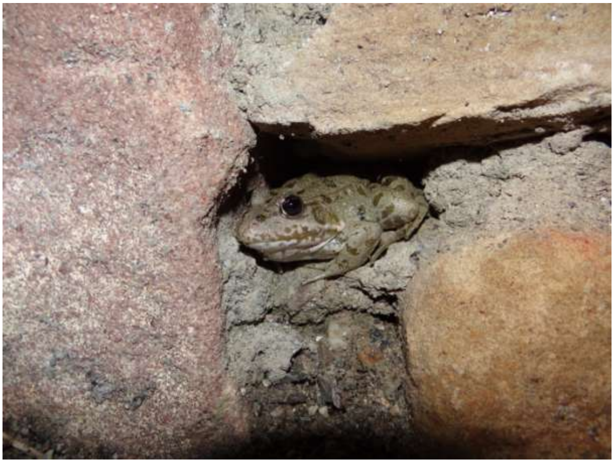
Grenouille (lieu : aux alentours de la Place de l'entrée principale – nuit du 15 au 16.08.2014)