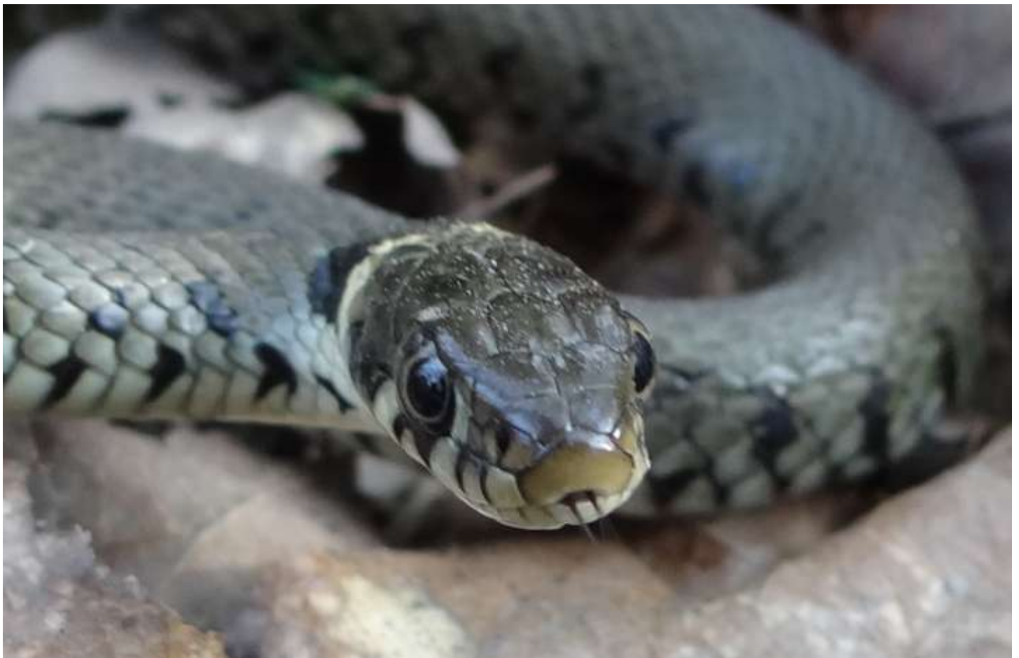
Couleuvre à collier - (Lieu : Arrière marais – 13.04.2015)