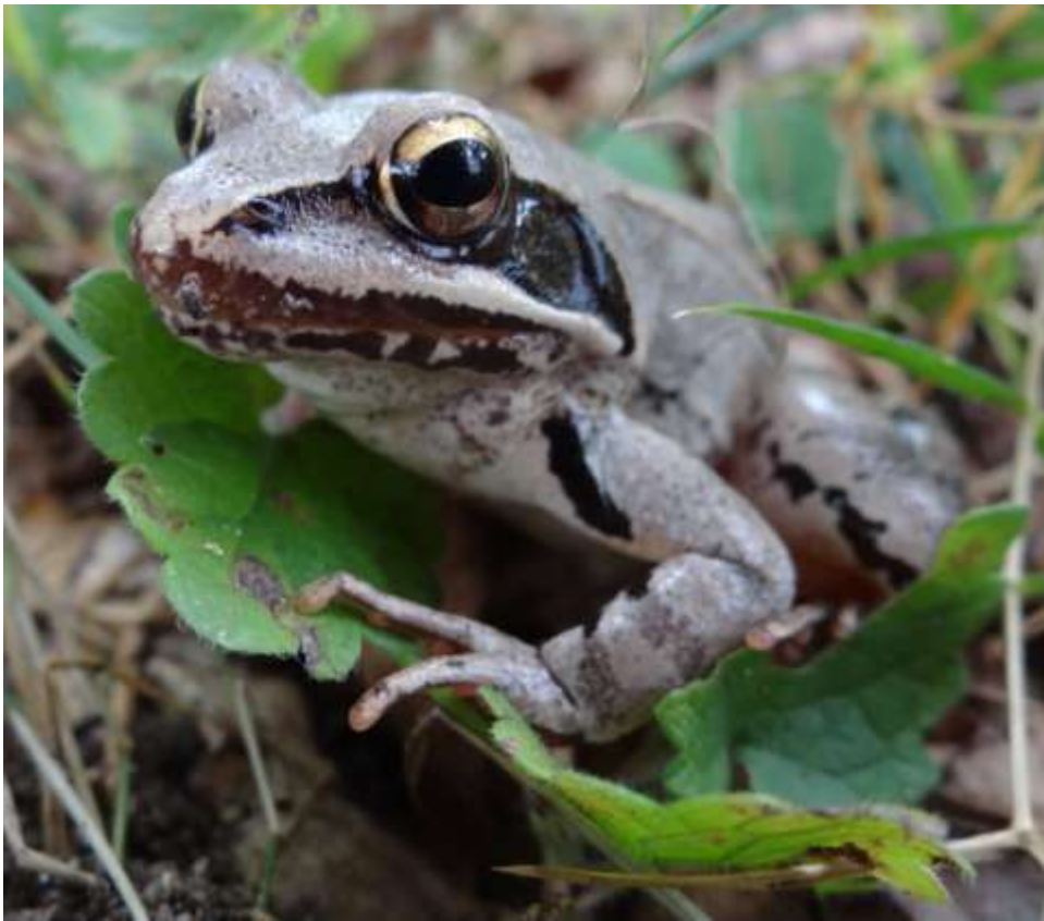
(à proximité du Gros chêne « Russawag » - 05.08.2014)