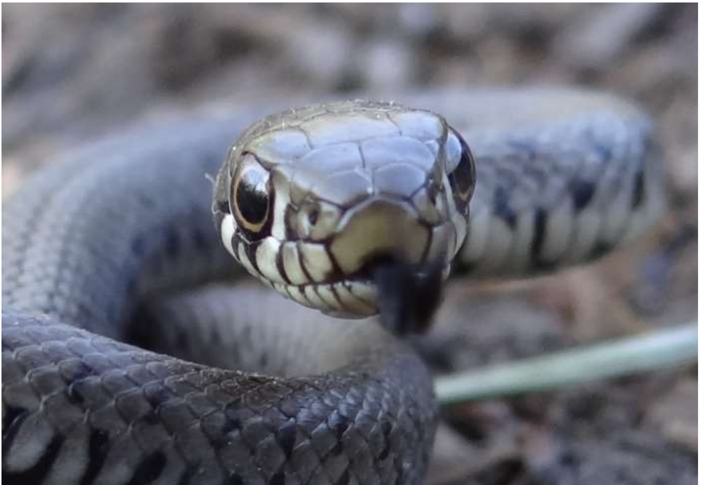
Couleuvre à collier (Lieu : Compost – 22.04.2015)