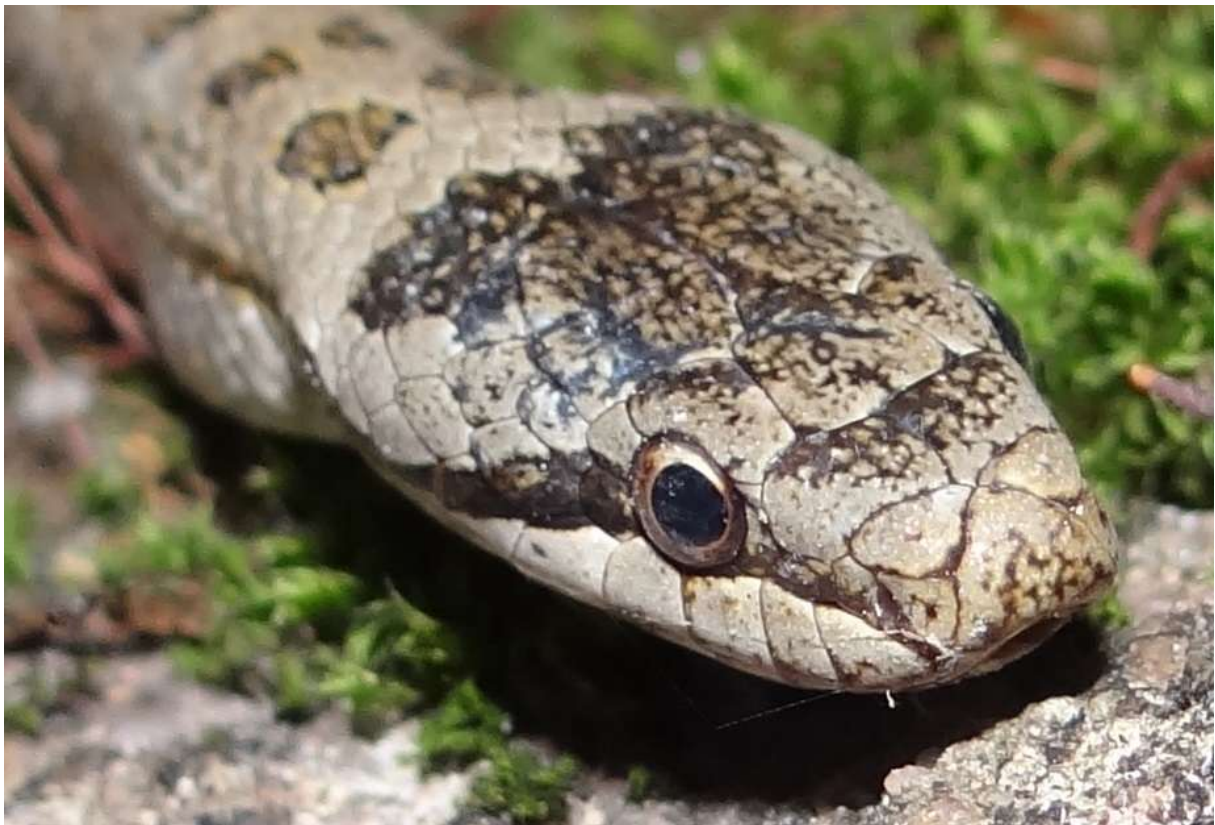
La Coronelle lisse – Coronella austriaca

(à proximité du Pont du 1 er mai - nuit du 06 au 07.09.2014)