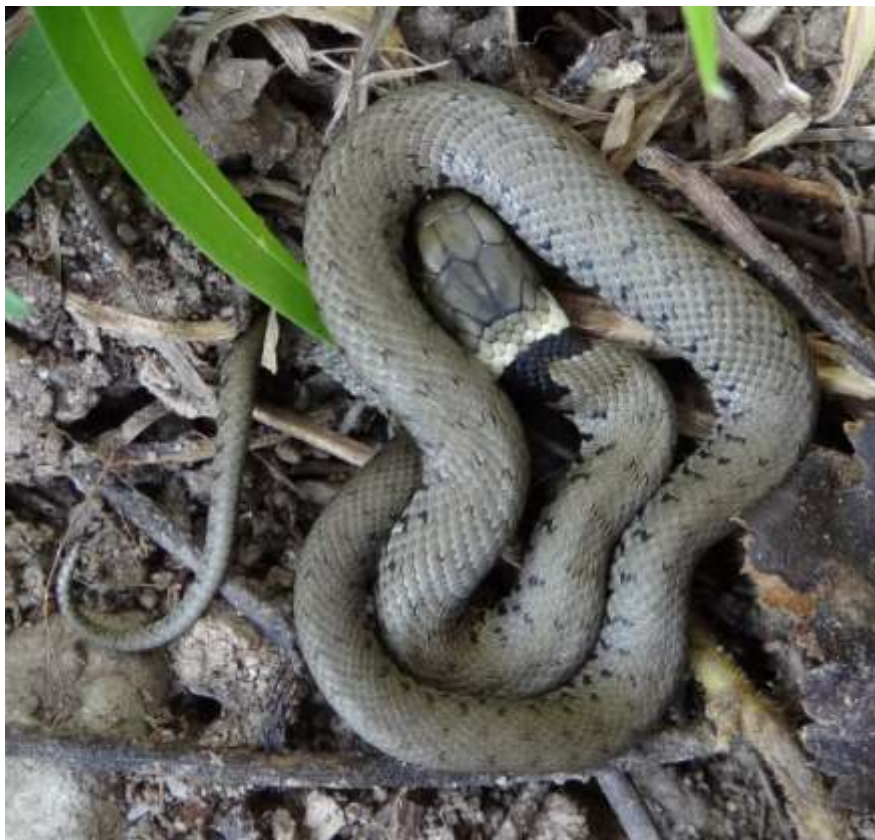
Couleuvre à collier (Lieu : Pré des scouts – 22.04.2015)