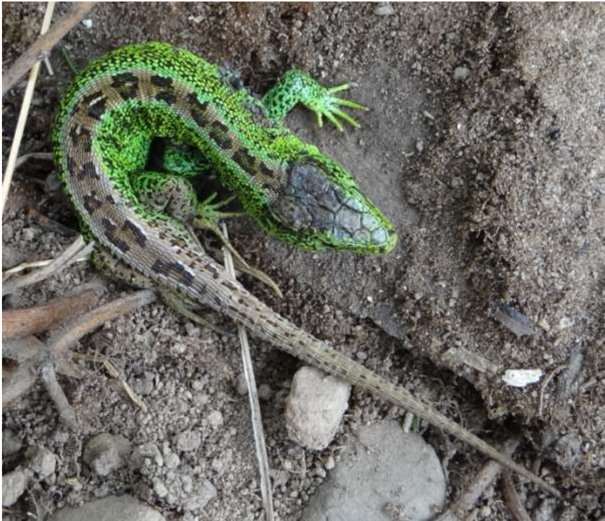
(lieu : Pré des scouts – 29.05.2014)