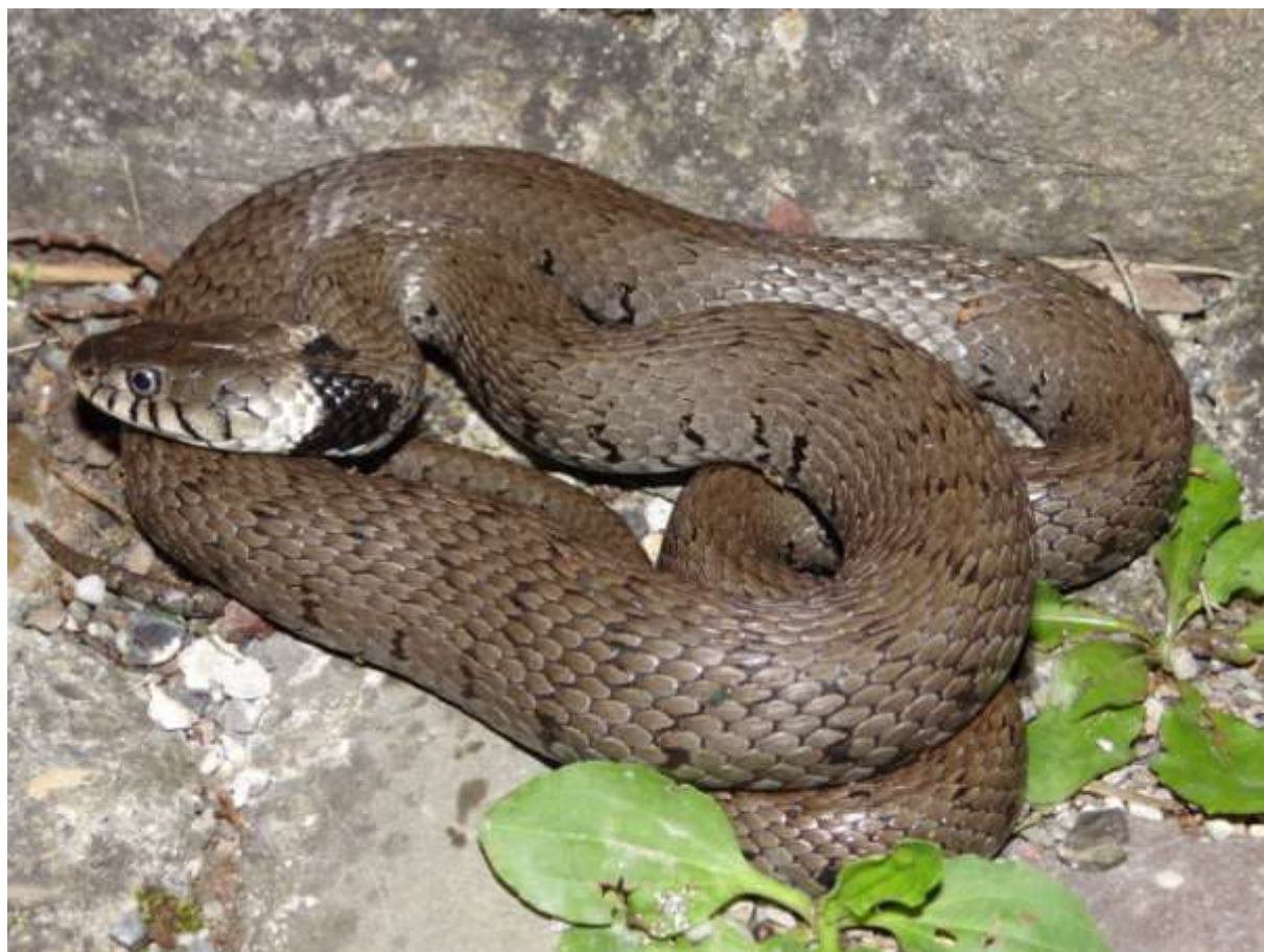
Couleuvre à collier (Rue du Moulin près du pont - nuit du 02 au 03.08.2014)