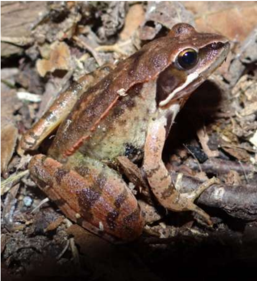
(lieu : à proximité du Pavillon de chasse - nuit du 30 au 31.08.2014)