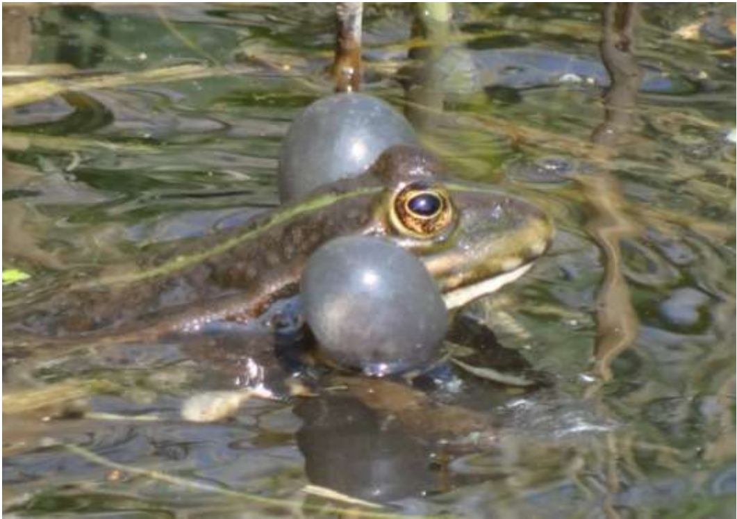
Grenouille rieuse – (lieu : Pavillon de Guebwiller – bordure marais - 13.04.2014)