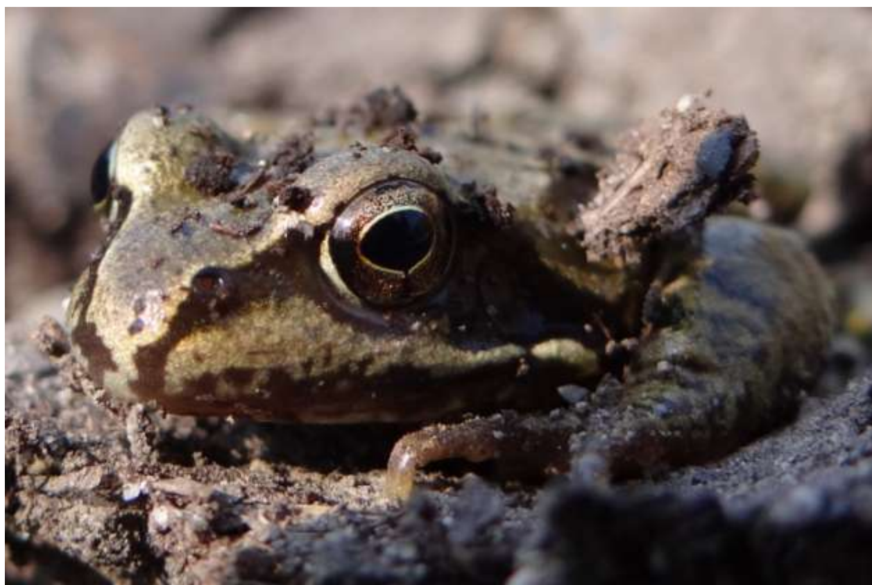
Rana temporaria (Grenouille rousse) « les 2 photos »