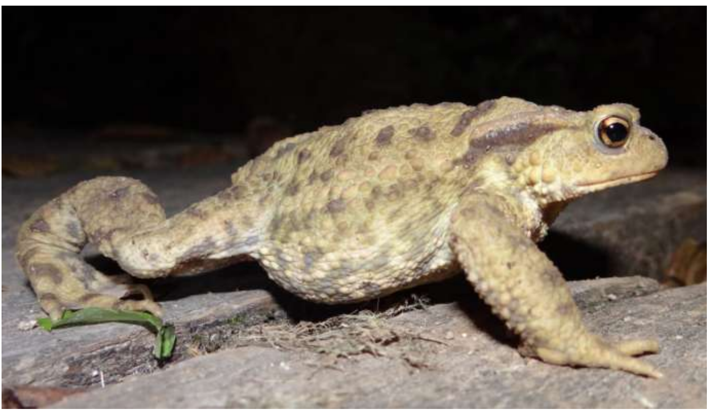
(A proximité de la Maison du 21 ème siècle - nuit du 06 au 07.09.2014)