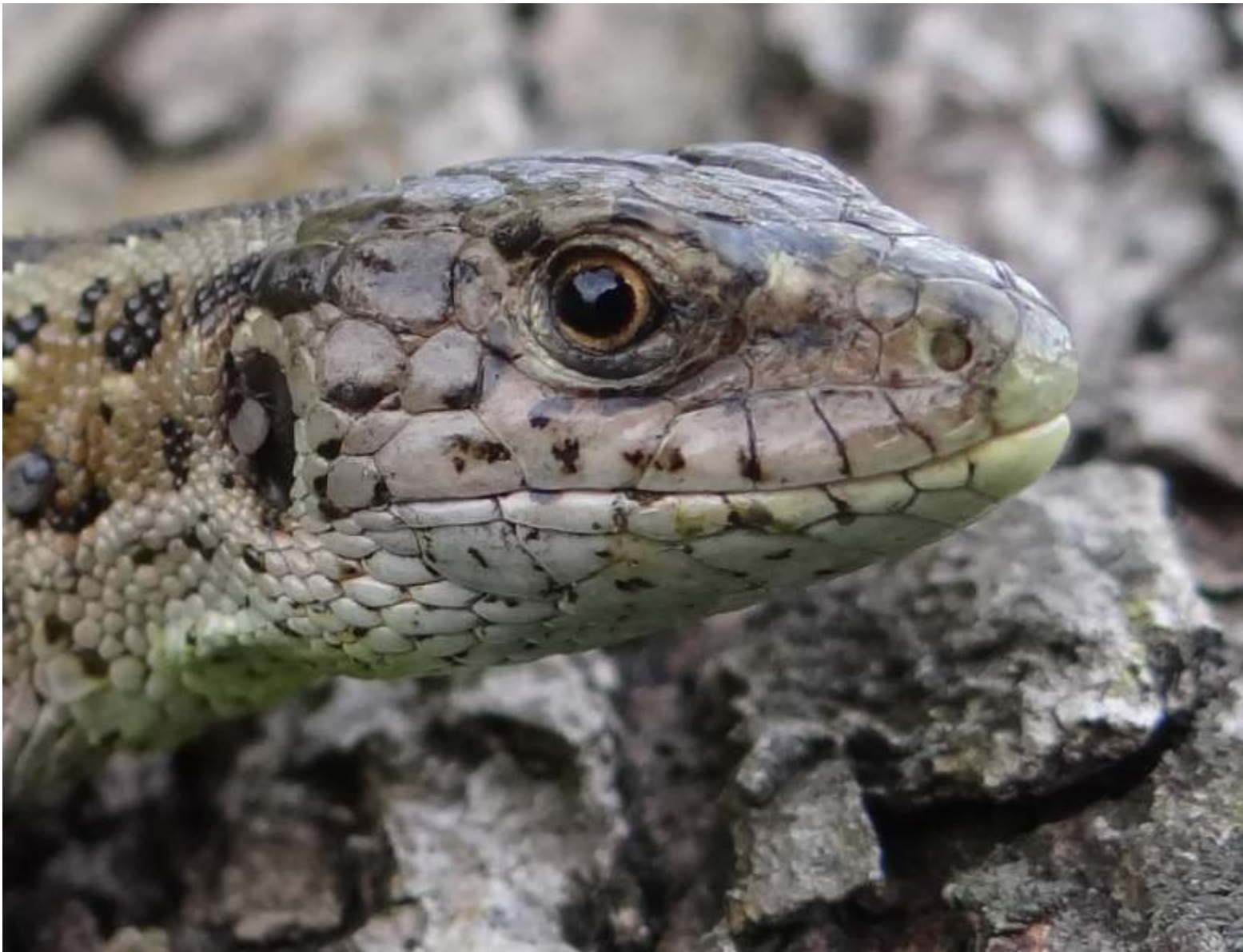
(Lieu : entre le marais et la maison du 20 ème siècle « Kunheim » - 16.05.2015)