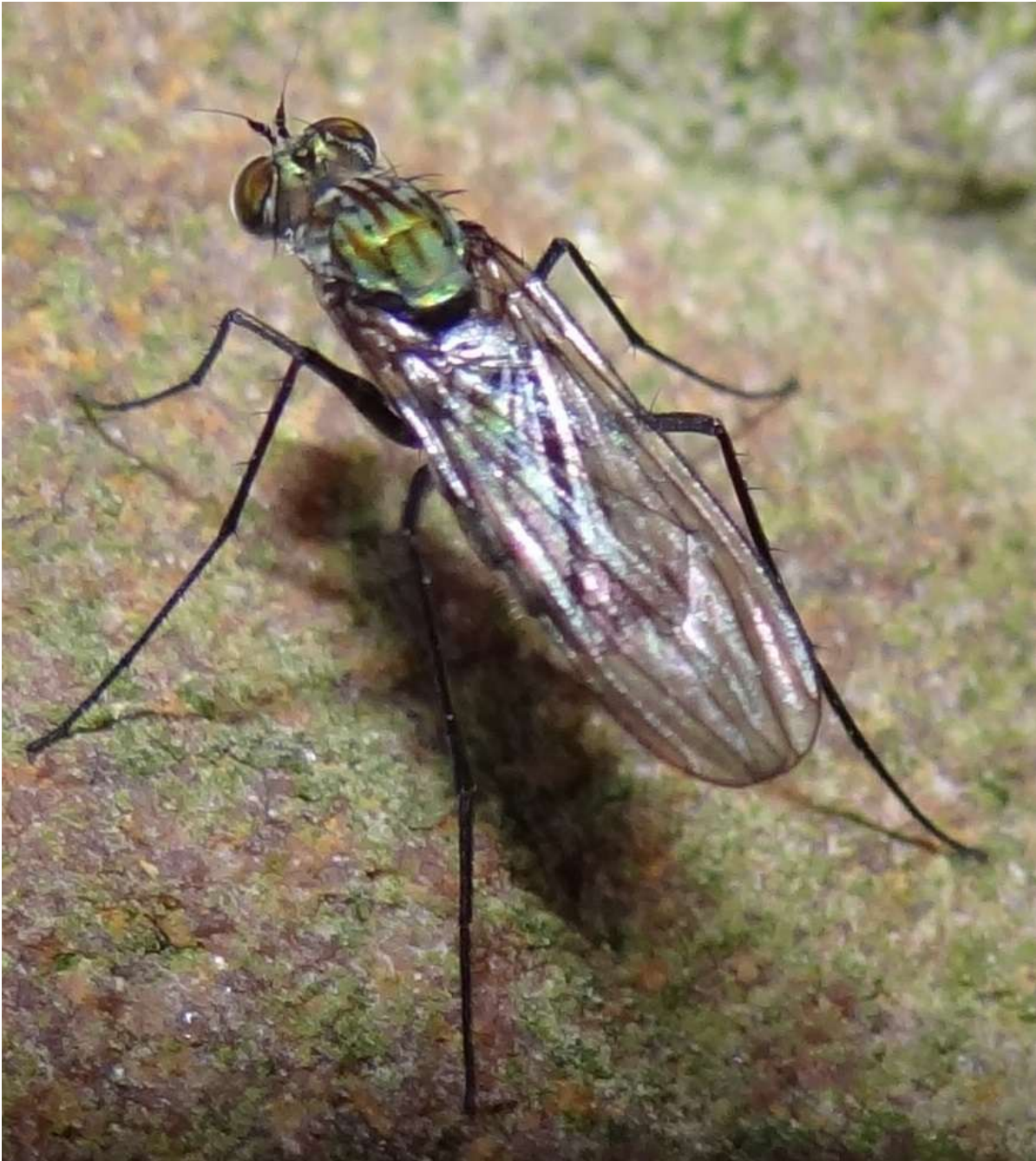
Liancalus virens – Diptera - Dolichopodidae – (02.11.2014)