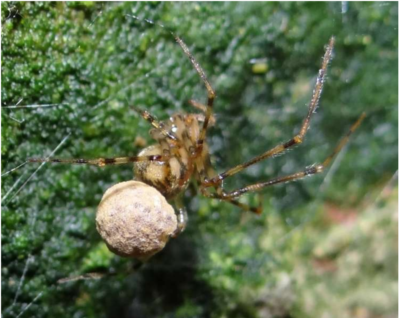
Nesticus cellulanus - Nestique alvéolé – Araneae – Nesticidae – (nuit du 16 au 17.05.2015)