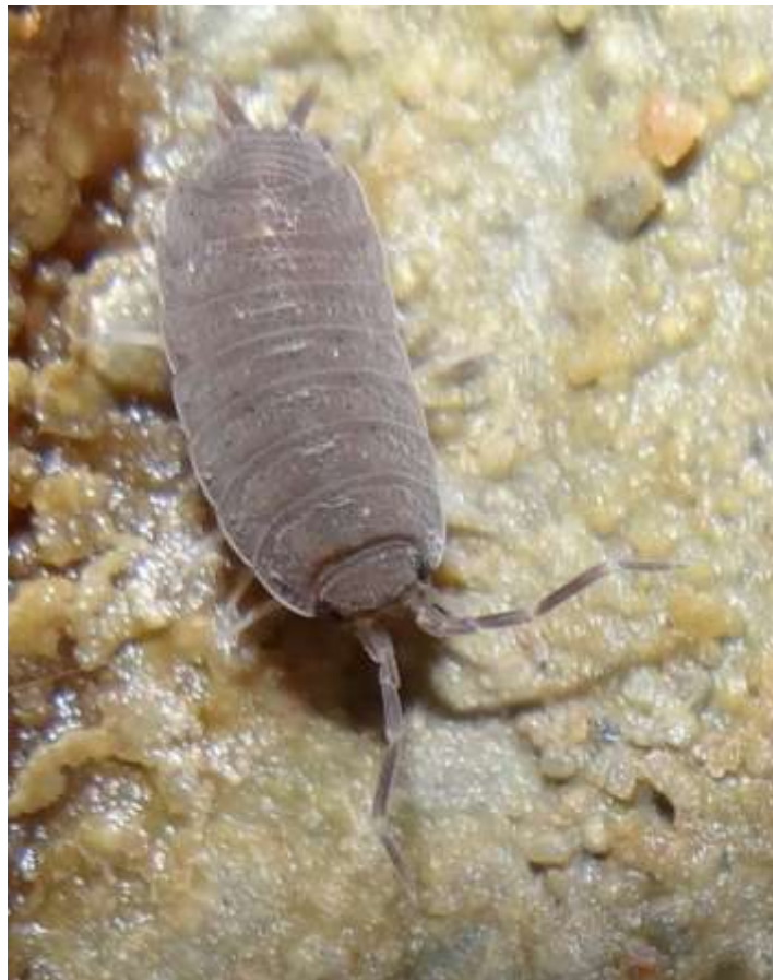
Porcellionides pruinosus (dans sa version bleu violacé mat) Cloporte rare dans l'Est de la France Classe des Crustacea - Ordre : Isopoda – Famille : Porcellionidae (01.11.2014)