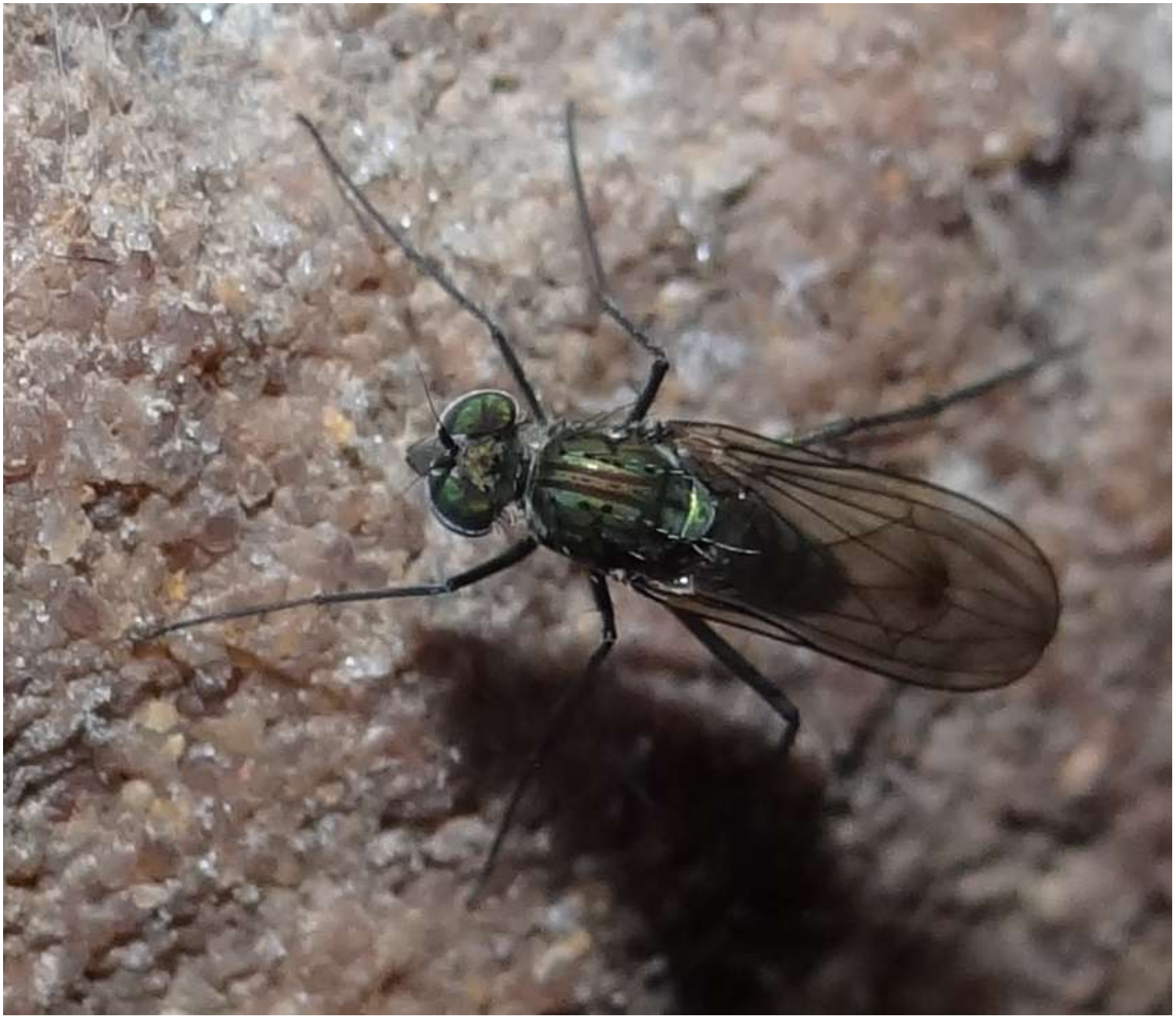
Liancalus virens – Diptera – Dolichopodidae – (22.11.2014)