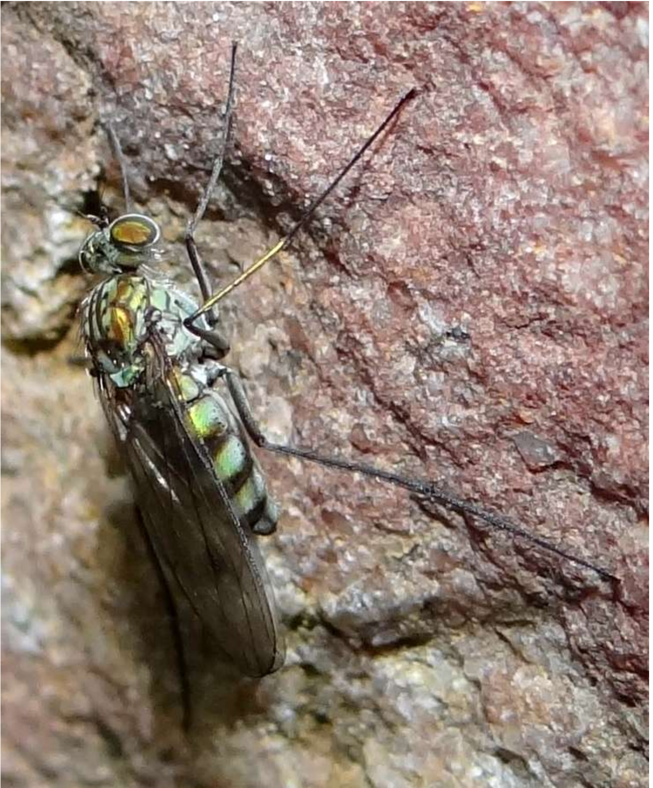
Liancalus virens – Diptera – Dolichopodidae – (Nuit du 22 au 23.10.2016)