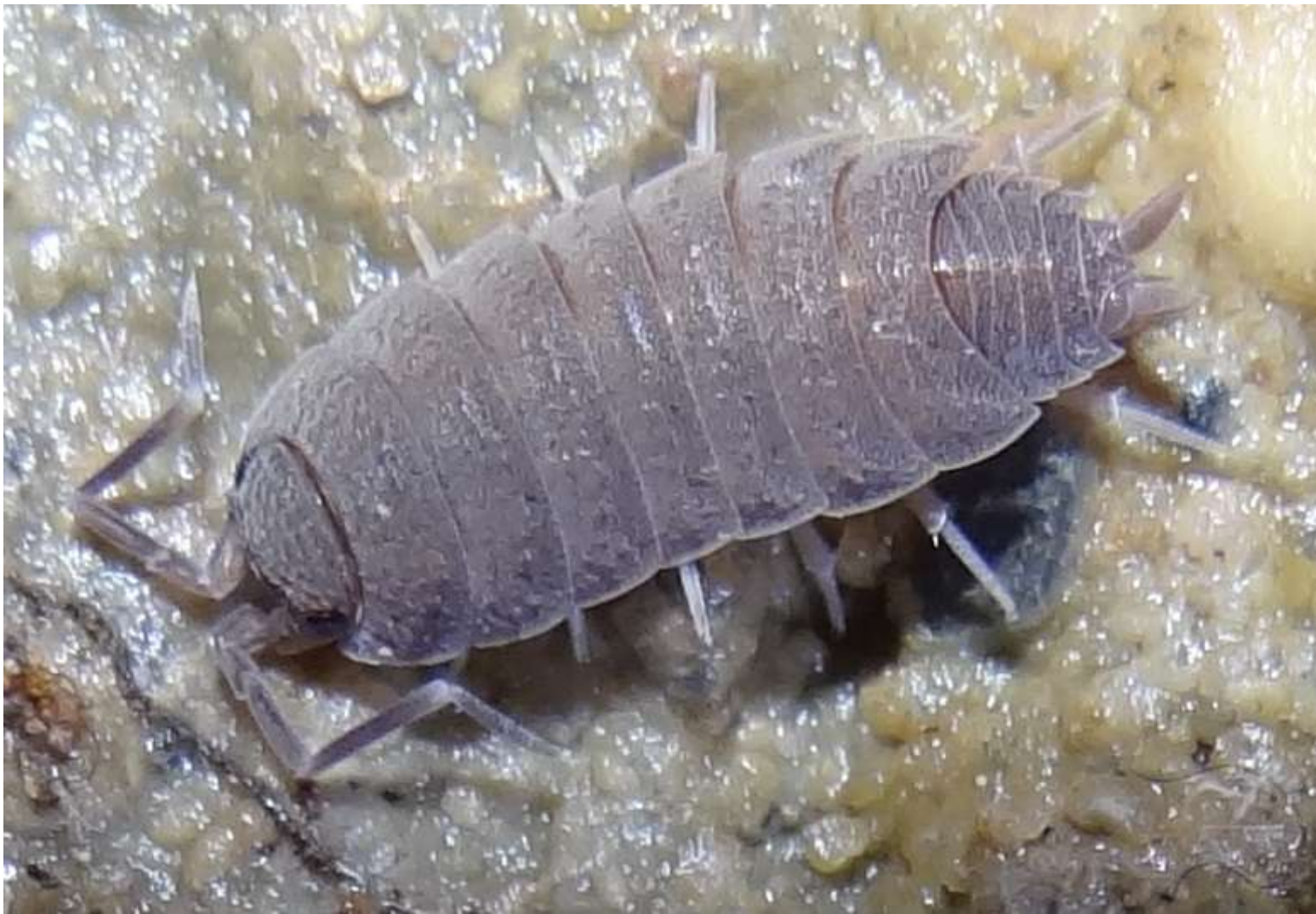
Porcellionides pruinosus (dans sa version bleu violacé mat) Cloporte rare dans l'Est de la France Classe des Crustacea - Ordre : Isopoda – Famille : Porcellionidae (01.11.2014)