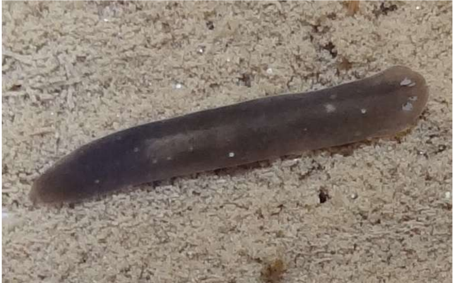
Dugesia lugubris/polychroa - (Platyhelminthes, Rhabditophora, Seriata, Dugesiidae) (Nuit du 05 au 06.08.2014)