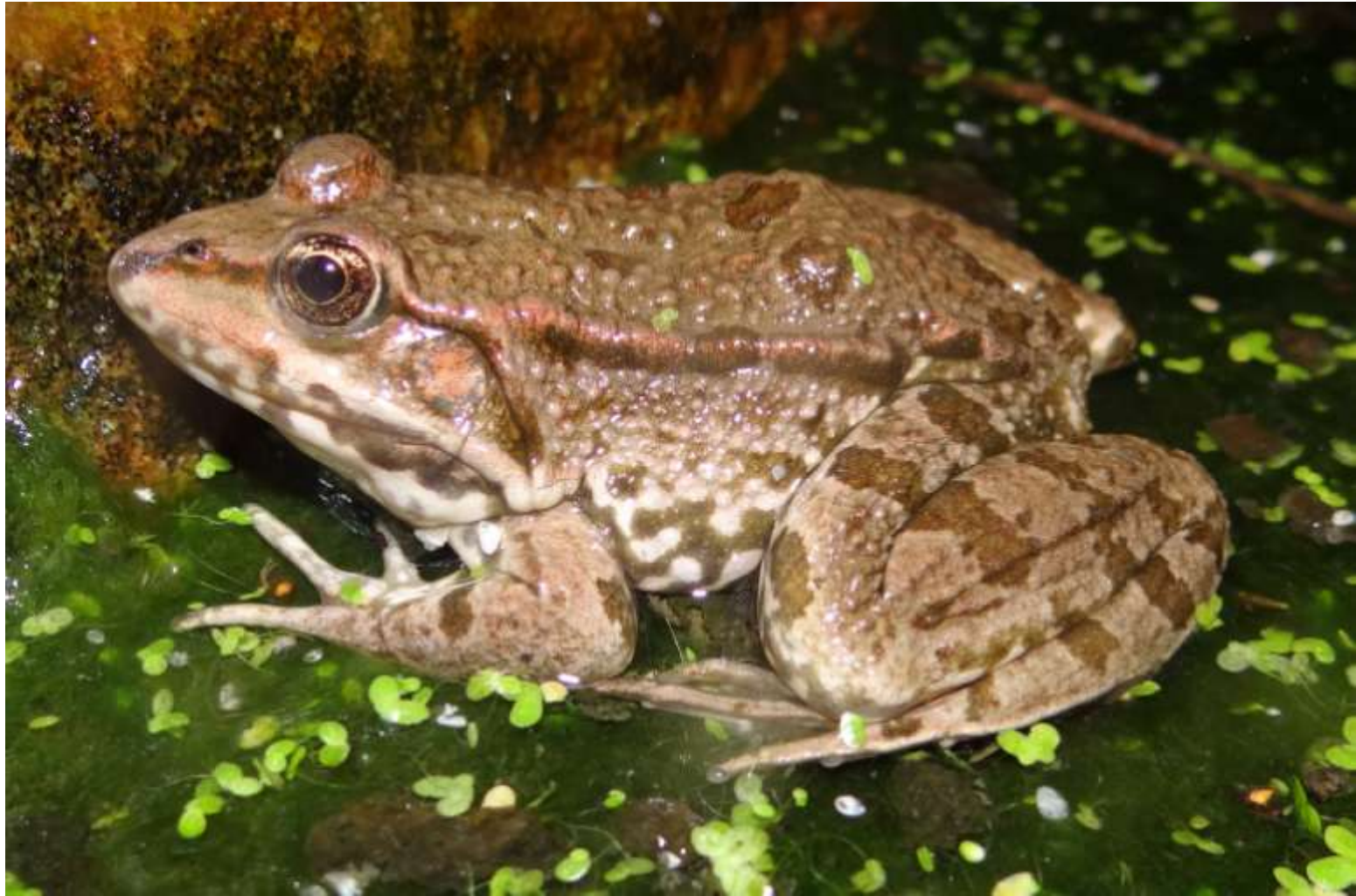
Grenouille – (Nuit du 15 au 16.08.2014)