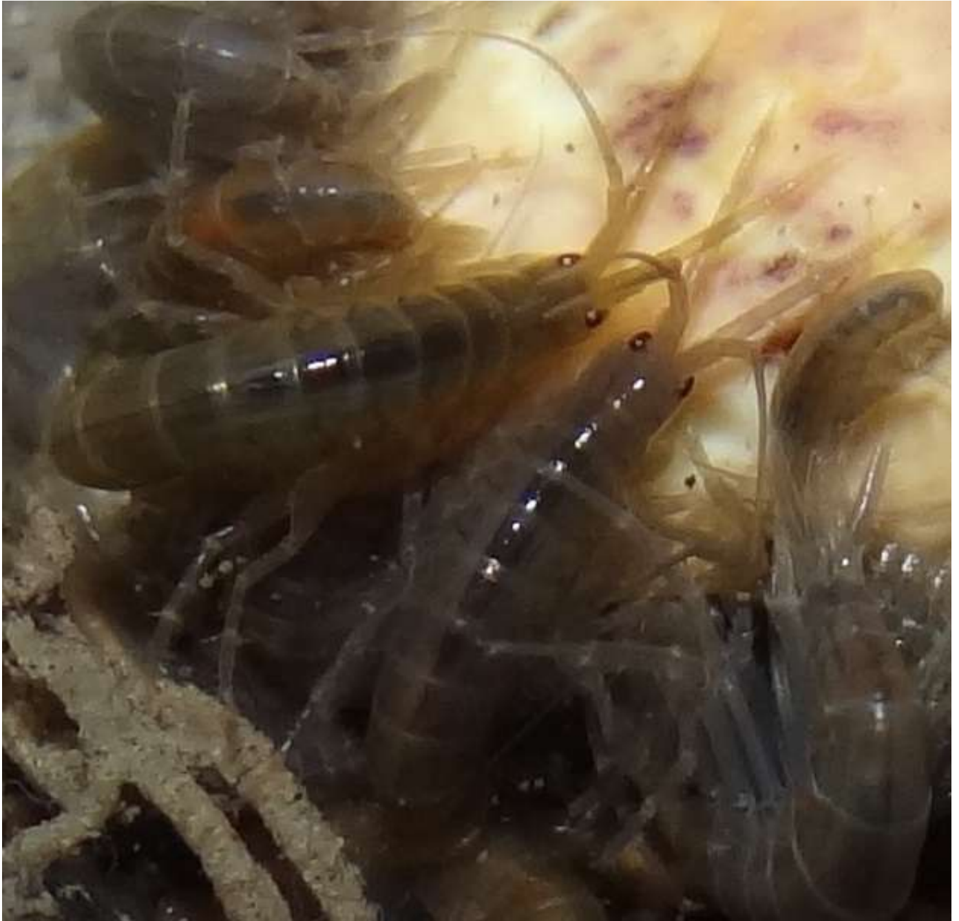
Gammarus sp – Crustacea - Ordre : Amphidopa – Famille : Gammaridae