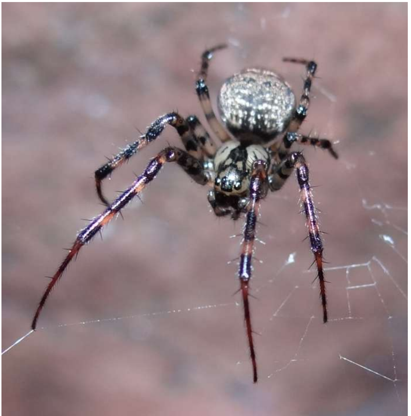
Metellina merianae – Méta des terriers – Méta de Mérian – Araneae - Tetragnathidae (19.10.2014)