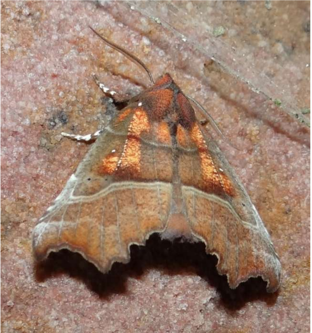
Scoliopteryx libatrix - La Découpure – Lepidoptera - Erebidæ (19.10.2014)