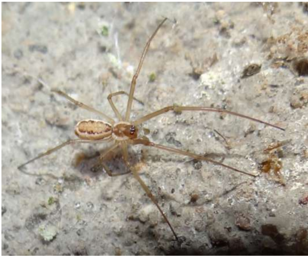
Neriene radiata – Araneae - Linyphiidae (15.12.2014)