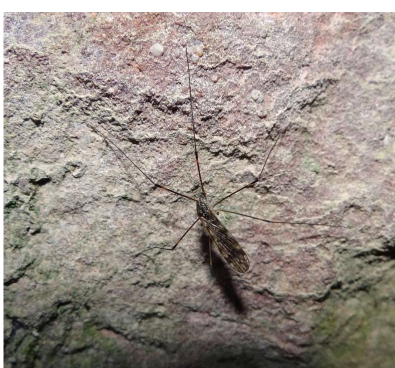
Dicranomyia sp – Tipule des grottes - Diptera – Limoniidae (16.04.2015)