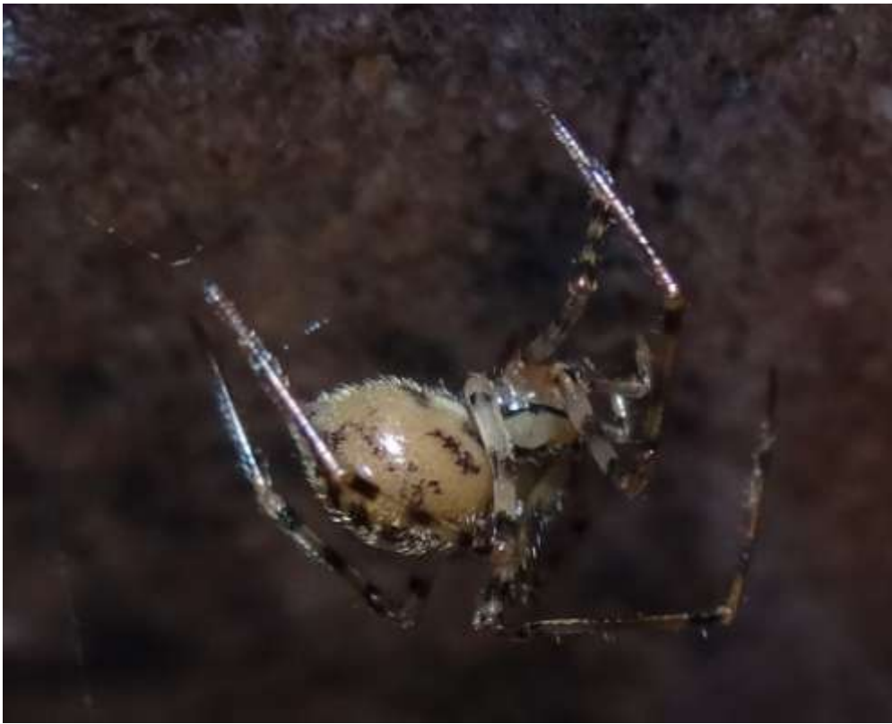
Nesticus cellulanus - Nestique alvéolé – Araneae – Nesticidae - (19.11.2014)