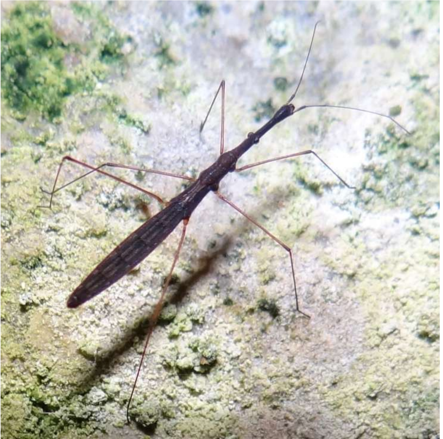
Hydrometra stagnorum - Hydromètre stagnant - Hydromètre des étangs - Punaise aiguille (Hemiptera - Hydrometridae) - 02.11.2014