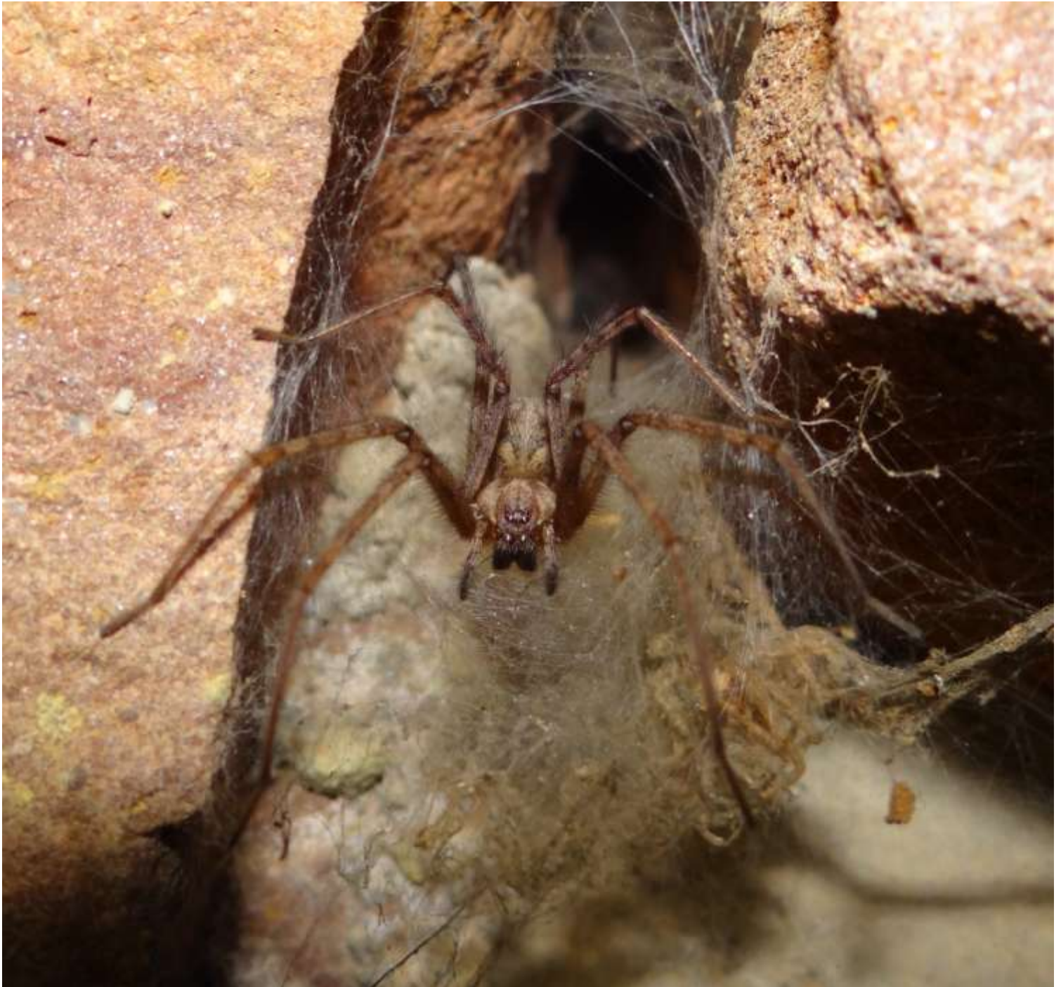
Tegenaria sp – Araneae - Agelenidae – (03.06.2016)