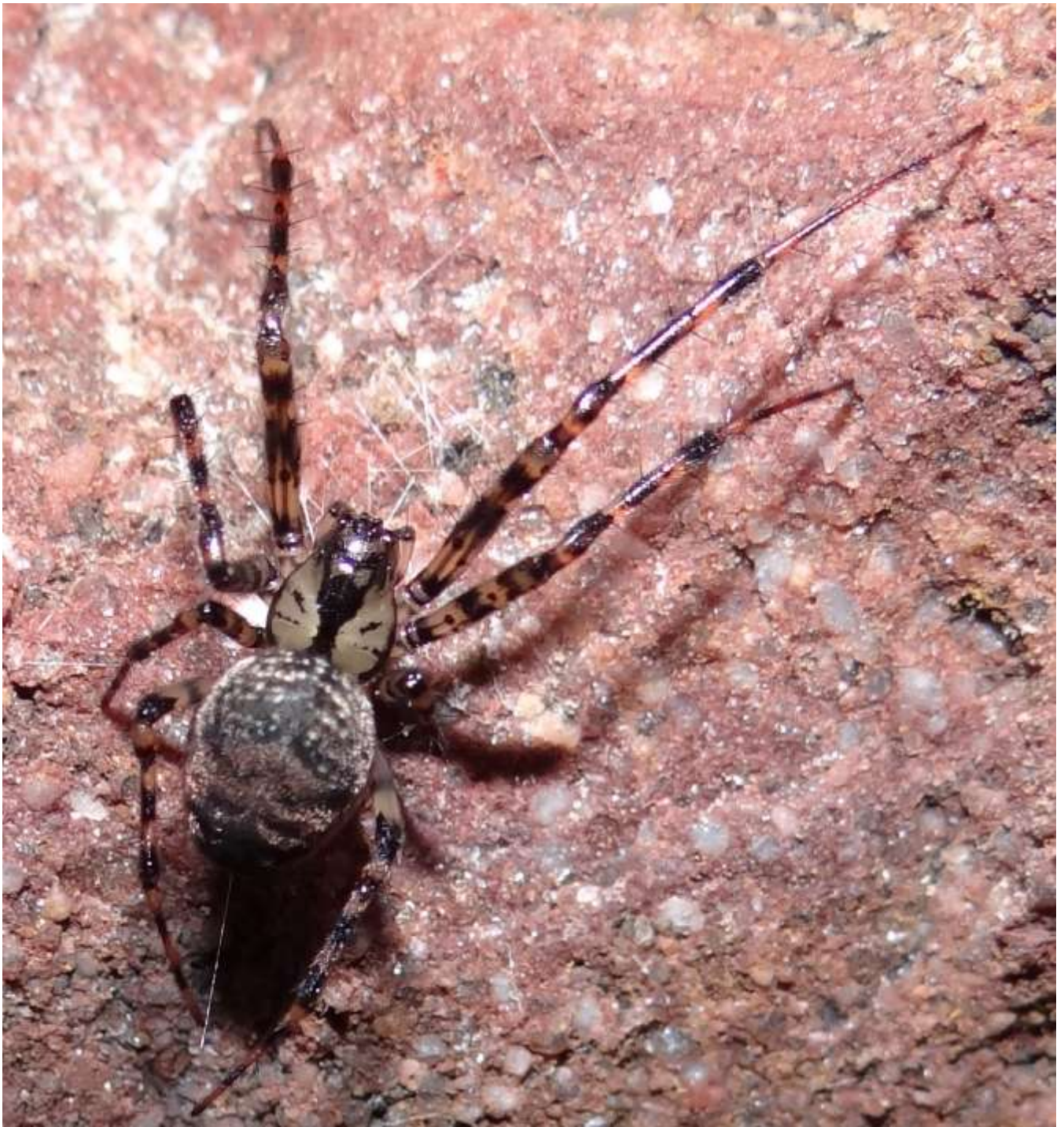
Metellina merianae – Méta des terriers – Méta de Mérian – Araneae - Tetragnathidae (19.10.2014)