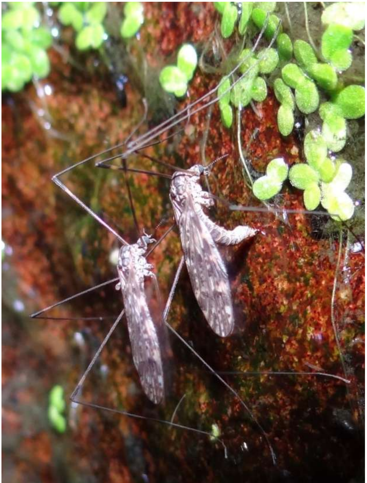
Dicranomyia sp – Tipule des grottes - Diptera – Limoniidae (à l'entrée de la Grotte de la cascade – 02.11.2014)