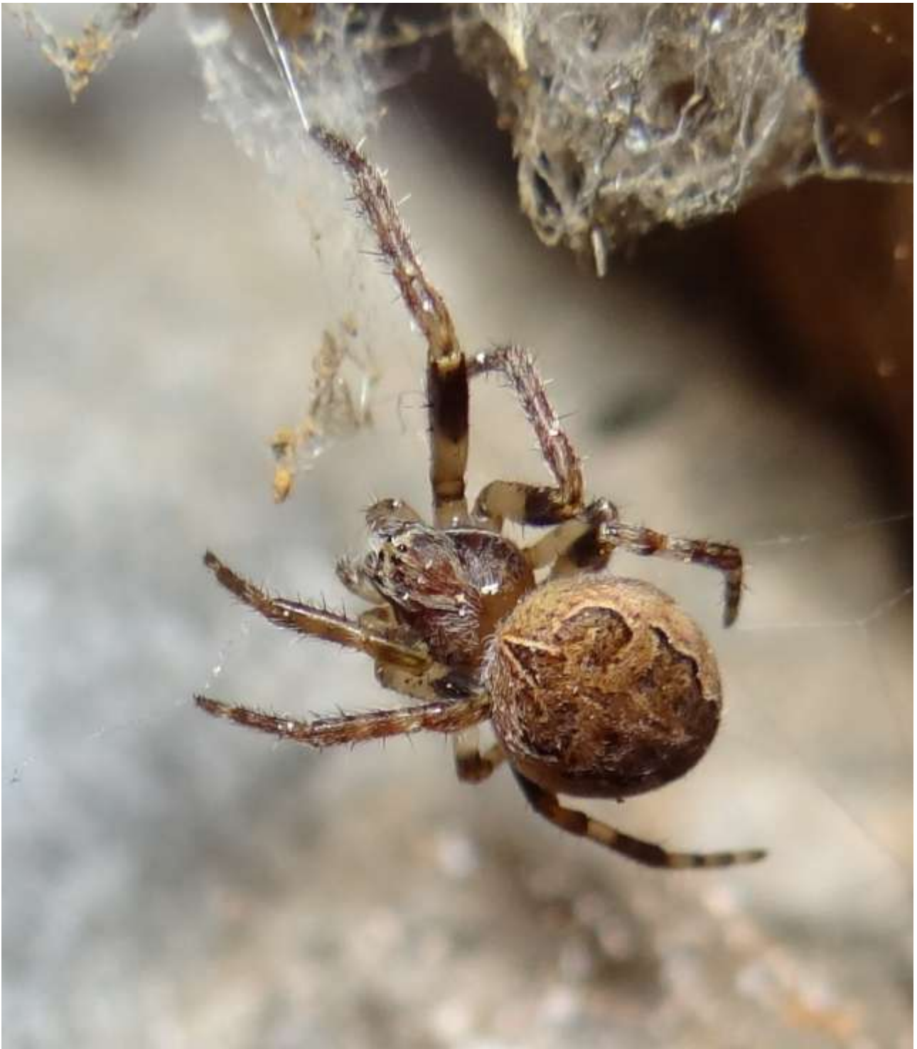
Larinioides sericatus - (ex- Larinioides sclopetarius ) – l'Epeire des ponts Araneae - Araneidae - (21.03.2015)