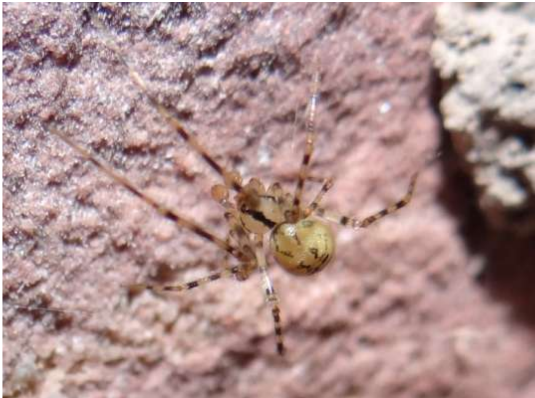
Nesticus cellulanus – Nesticus alvéolé – Araneae – Nesticidae - (19.11.2014)