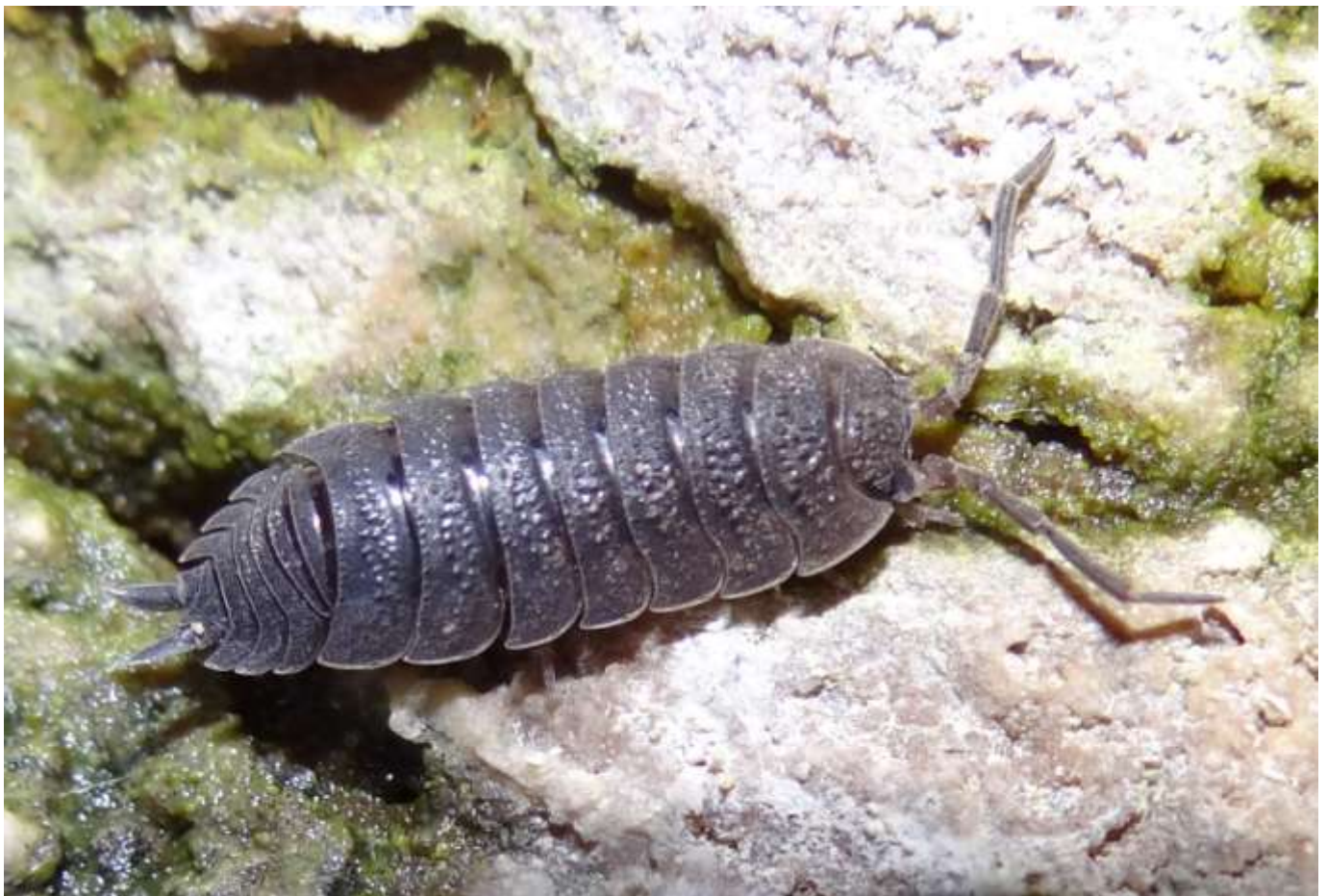
Porcellio scaber – Cloporte rugueux - Porcellion rude Classe des Crustacea - Ordre : Isopoda - Porcellionidae (24.04.2015)