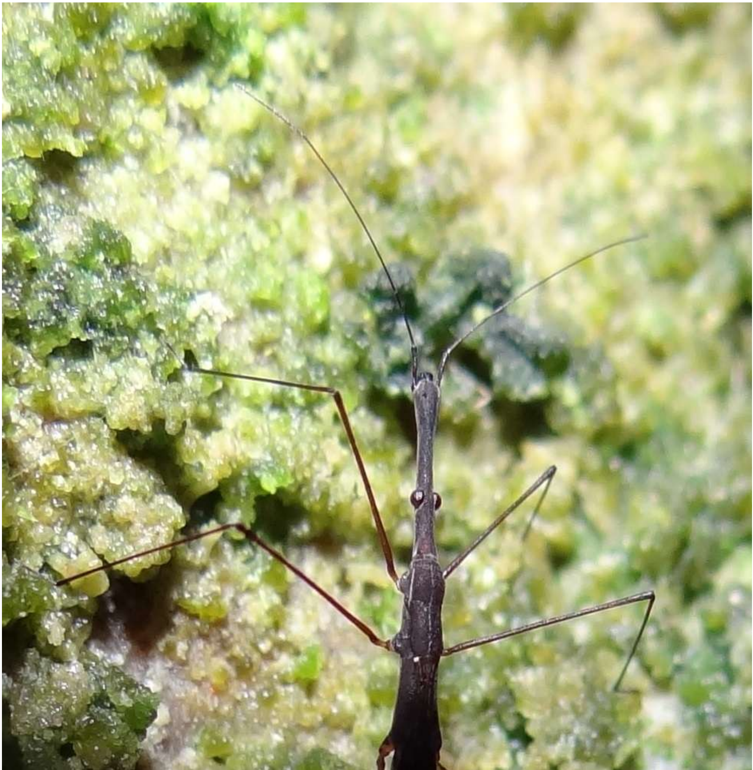
Hydrometra stagnorum - Hydromètre stagnant - Hydromètre des étangs - Punaise aiguille (Hemiptera - Hydrometridae) - 19.11.2014