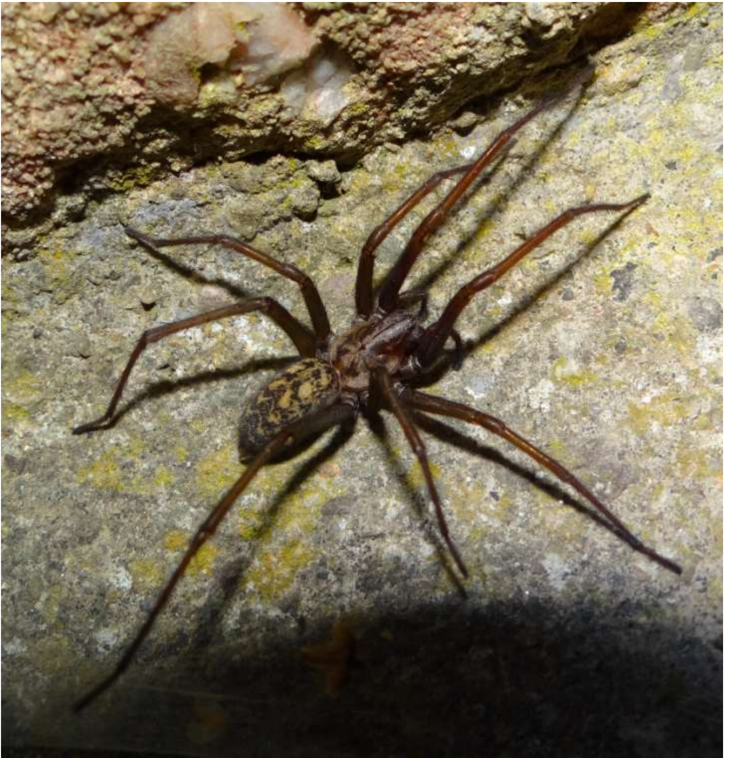
Tegenaria sp – Araneae - Agelenidae – (15.10.2016 « soir »)