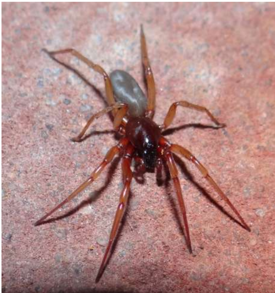
Harpactea rubicunda – Araneae - Dysderidae - (22.11.2014)