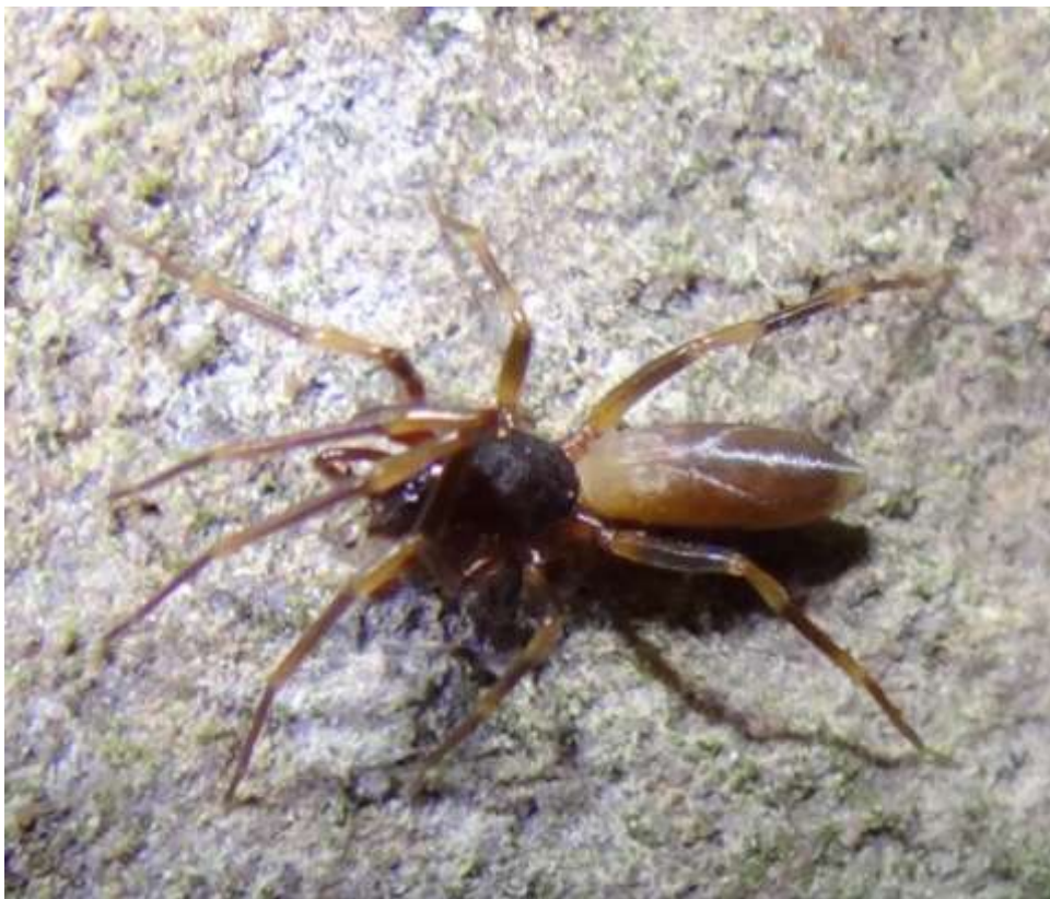
Harpactea hombergi - Harpactée pattes-rayées - mâle – Araneae - Dysderidae - (21.12.2014)