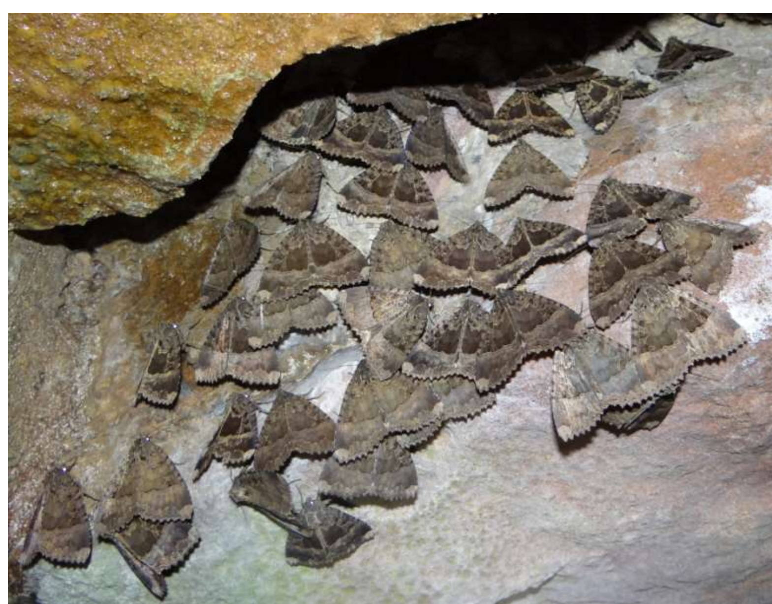
Dortoir de Mormo maura - La Maure – Lepidoptera - Noctuidae - (nuit du 16 au 17.07.2015)