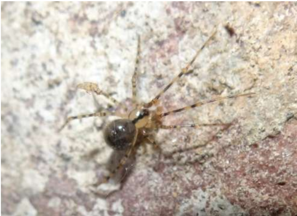
Nesticus cellulanus – juvénile - Araneae – Nesticidae – (10.05.2015)