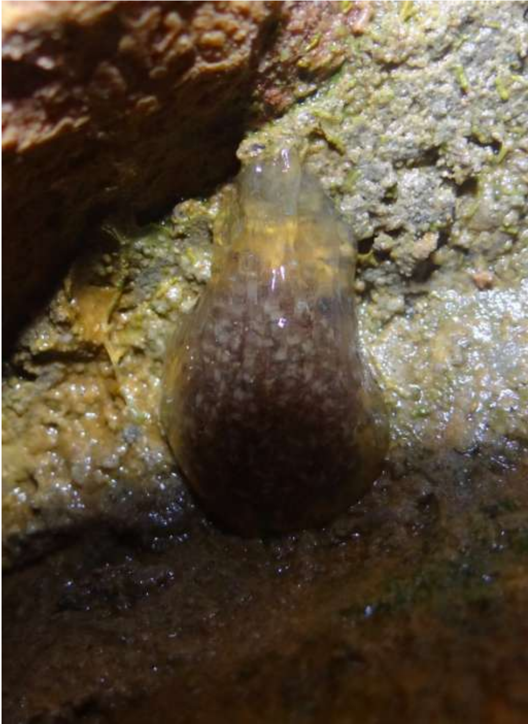
Ponte gélatineuse de Trichoptère (Ordre : Trichoptera – Famille : Limnephilidae) 18.10.2014