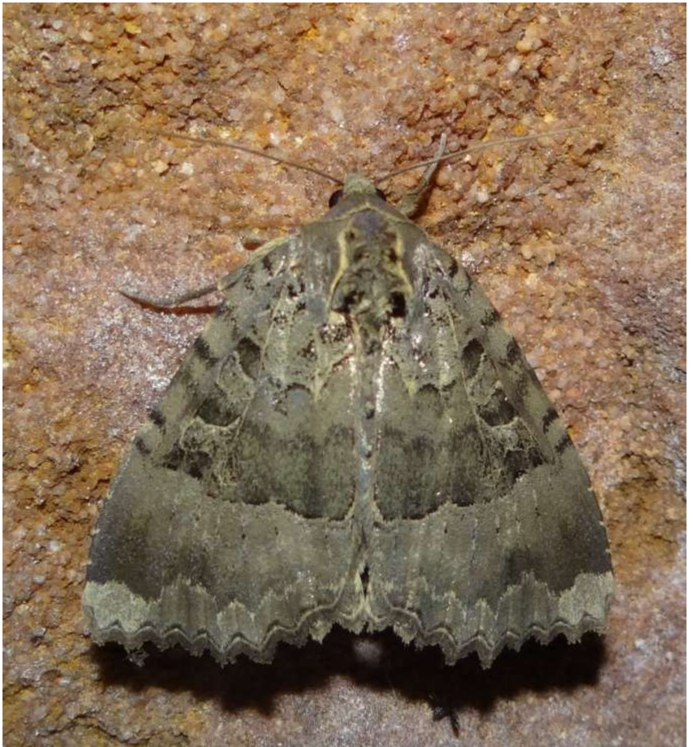
Mormo maura - La Maure – Lepidoptera - Noctuidae - (nuit du 16 au 17.07.2015)