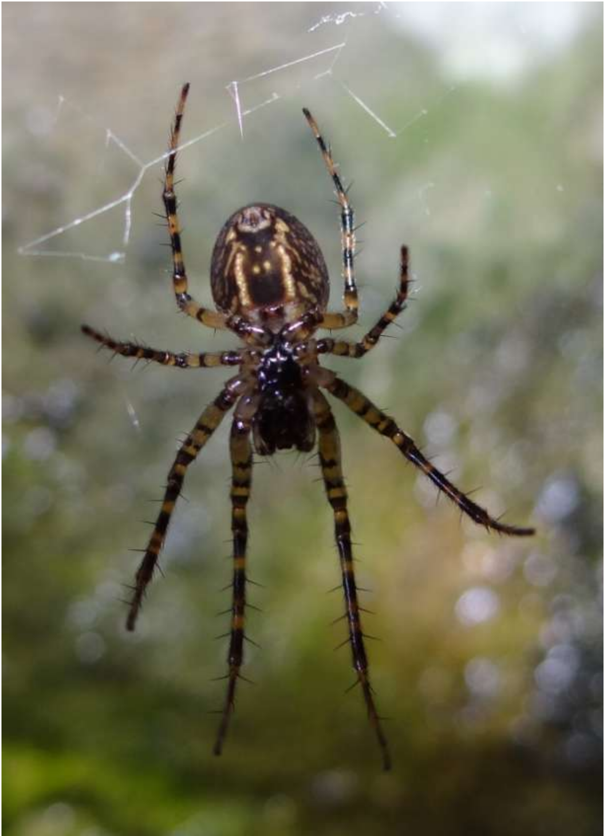
Metellina merianae – Méta des terriers – Méta de Mérian – Araneae - Tetragnathidae (21.03.2015)