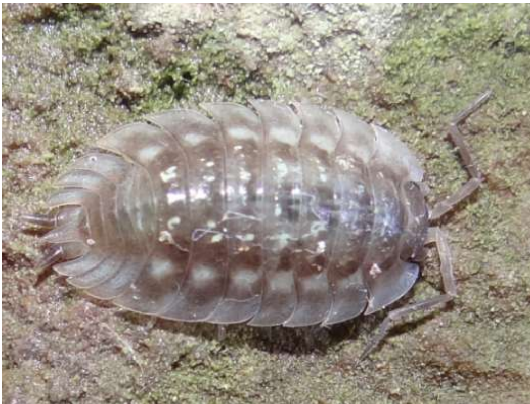
Oniscus asellus – L'Aselle des murs – Cloporte des murs – cloporte lisse – Classe des Crustacea - Ordre : Isopoda – Famille : Oniscidae - (01.11.2014)