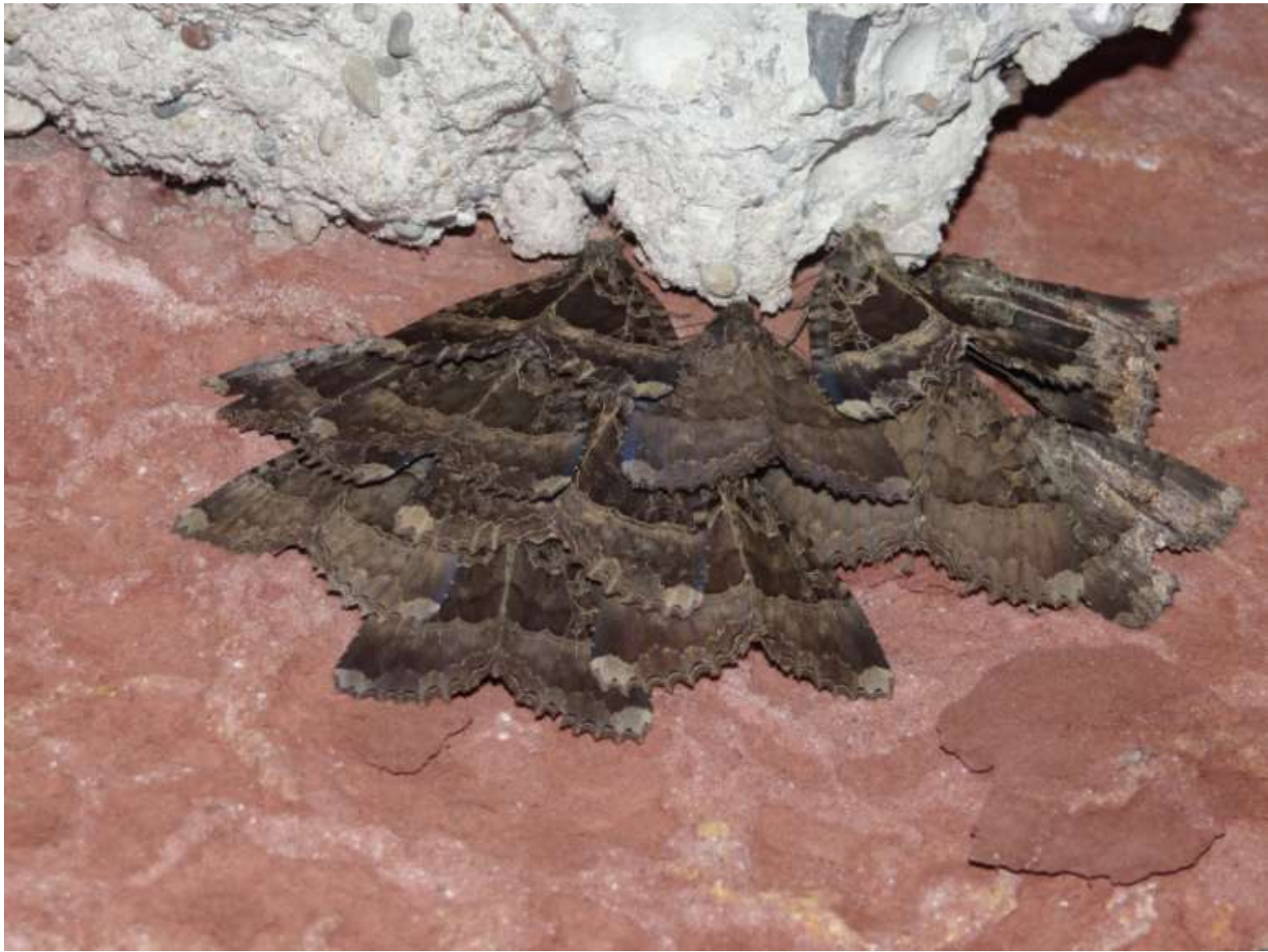
Dortoir de Mormo maura - La Maure – Lepidoptera - Noctuidae - (29.07.2014)